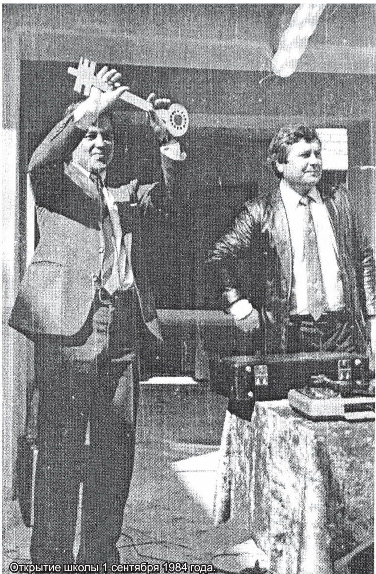
Открытие школы 1 сентября 1984 года.

О строительстве совхоза в с. Подымахино читайте на с. 8, 9.