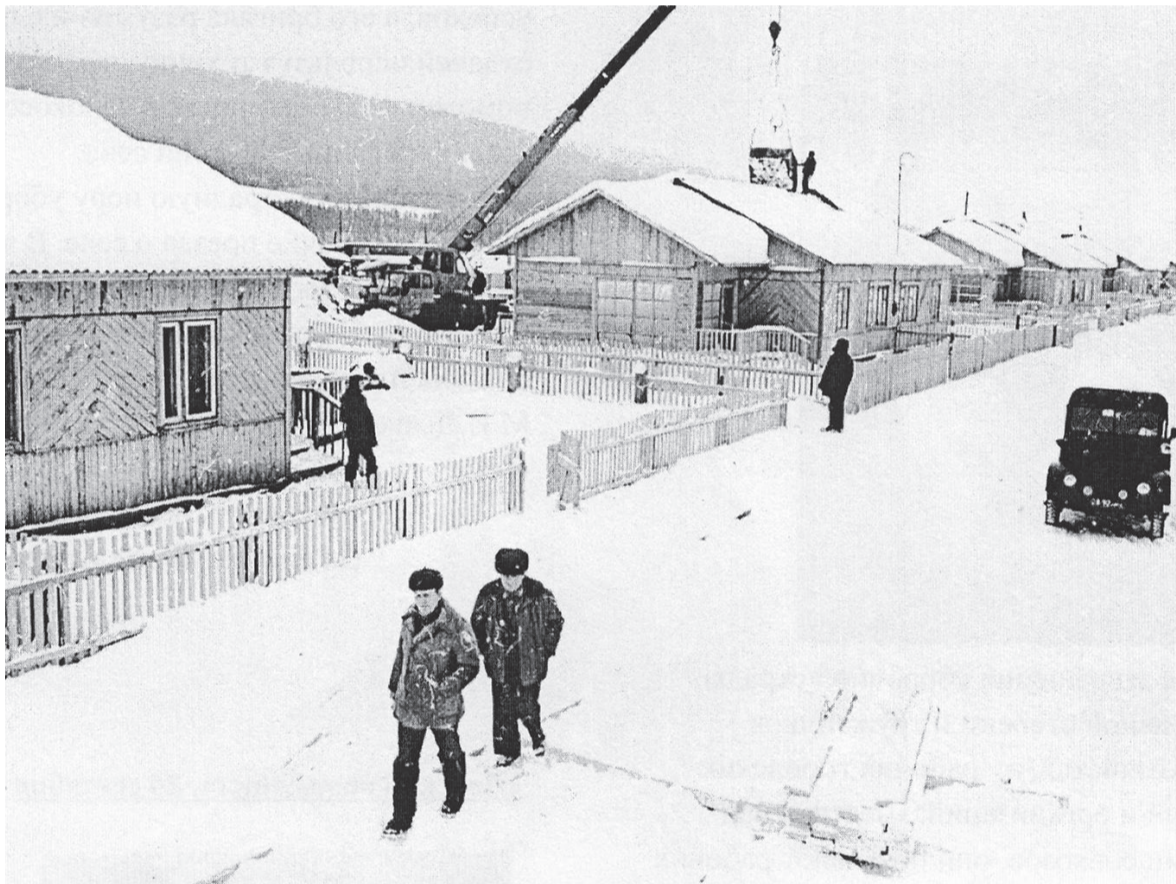
Строится совхоз «Подымахино» для бамовских строителей. Фото Э. Д. Брюханенко – (Б. м.), 1976.

К лету 1977 года на территории совхоза полным ходом шли подготовительные работы: строители СМП-266 построили девятиквартирный дом под общежитие, столлярный цех, бетонно-растворный узел, склад, гараж, прорабскую, дизельную электростанцию, завезли две с половиной тысячи кубометров гравия. Начали вертикальную планировку площадок под ферму для крупного рогатого скота, под поселковую котельную, готовили опалубку на фундаментах, приступили к «нулям» десяти двухквартирных домов.