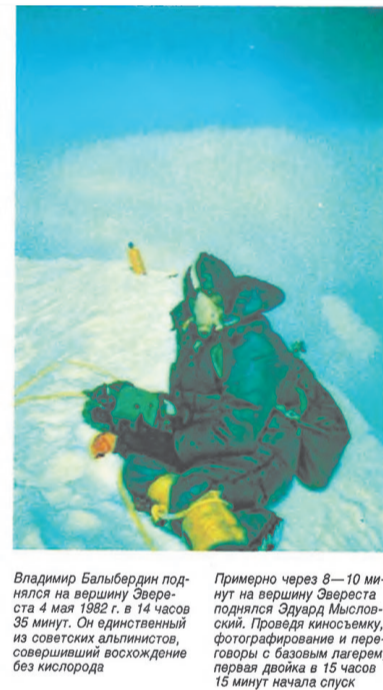
Владимир Бальбердин поднялся на вершину Эвереста 4 мая 1982 г. в 14 часов 35 минут. Он единственный из советских альпинистов, совершивший восхождение без кислорода