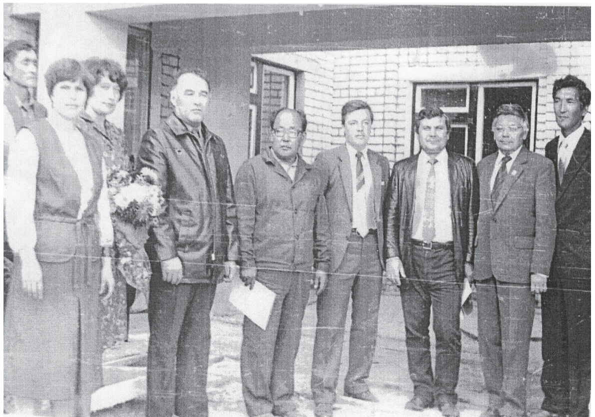
Открытие школы 1 сентября 1984 года.