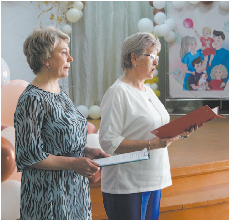
Напутственные слова от учителей школы № 2.

Каждый год в конце мая выпускники школ отмечают праздник «Последний звонок».