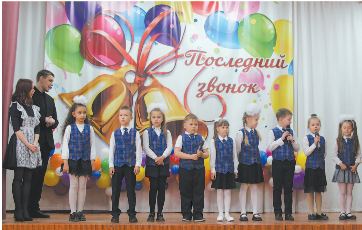
Поздравления первоклассников школы № 4.

Они улыбаются сквозь слёзы и понимают, что за дверьми родной школы – новая жизнь. Впереди экзамены, а дальше поступление в колледж или вуз, – и новая пора, студенчество. Они готовы к новым испытаниям, ведь их многому научили педагоги, которые навсегда останутся путеводным огоньком маяка на дальнейшем жизненном пути ребят.