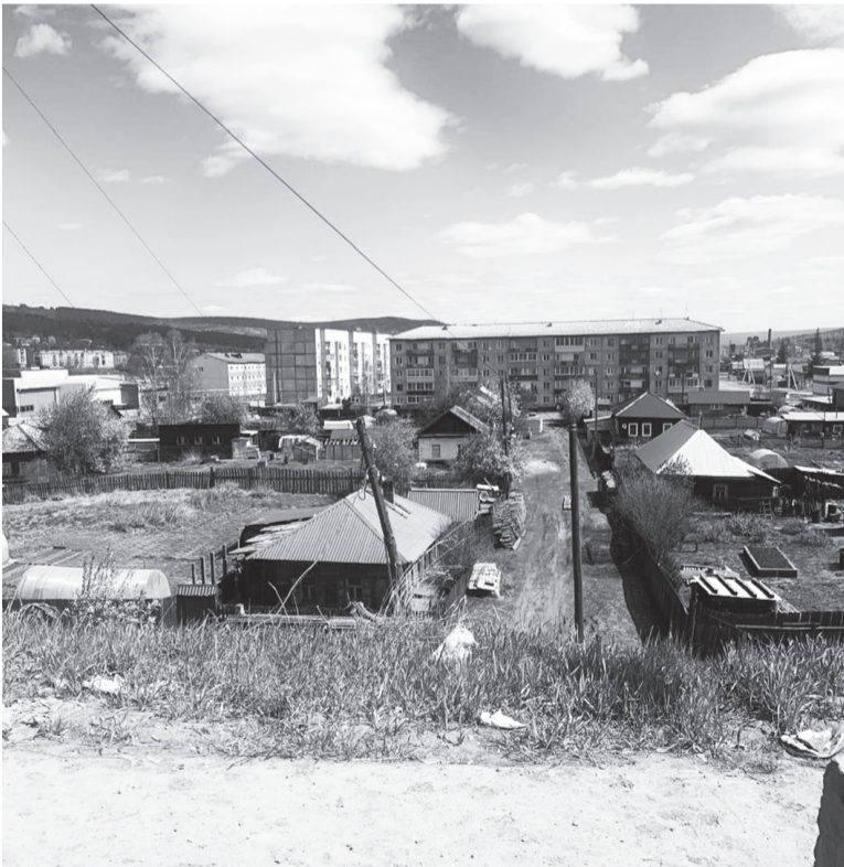
Локация со старой улицей.