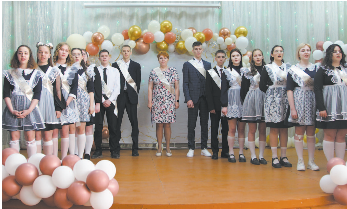
Выпускники школы № 2.

Виновники торжества тоже не отставали: они подготовили трогательные слова и цветы для своих учителей, которые за руку провели ребят через все года их школьной жизни, помогли не терять ориентиры и учили идти только вперёд.