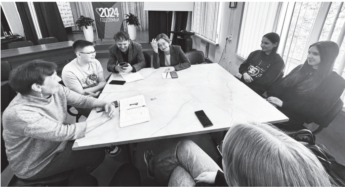
Обсуждение плана действий с командой УКМО.