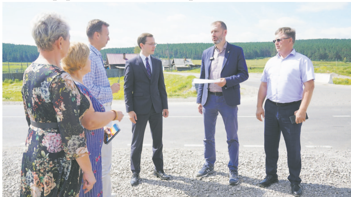
Качество ремонта дорог, выбор объектов, расстановка приоритетов — вот что в первую очередь интересует парламентариев в сфере дорожного строительства.

– Мне кажется, молодежь всегда политически активна и имеет свою точку зрения.