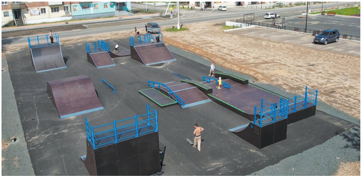
Чунский муниципальный округ, скейт-парк в п. Лесогорск.

году. Когда уже будет сформирована дума округа, бюджет. Но не забываем о том, что нормативы отчислений у нас увеличатся. С 1 января 2025 года будем получать повышенный норматив – 75%. У нас также будет меньше депутатов, мы сэкономим на думах поселений. У нас будет только дума муниципального округа. В думу округа смогут войти представители всех населённых пунктов.