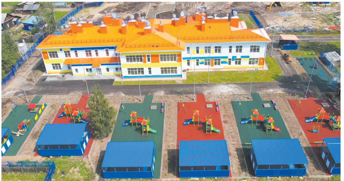
Чунский муниципальный округ, детский сад в п. Октябрьский.

– Реализация начнётся с 1 января 2025 года, но реального эффекта, я думаю, мы достигнем к 2026