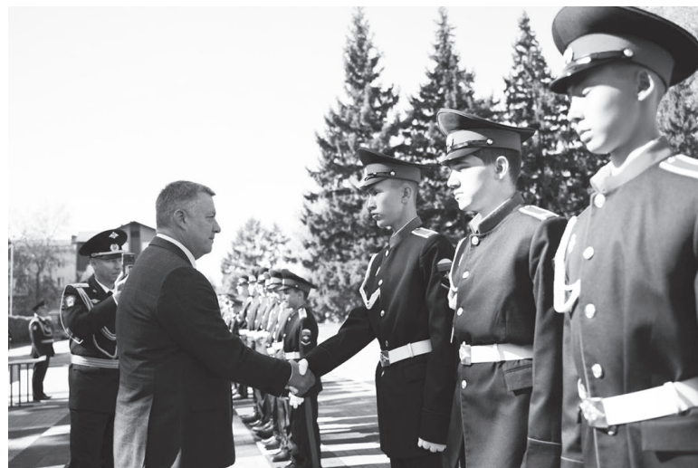
Кадетское образование успешно развивается в Приангарье.

По словам министра образования Максима Парфенова, в Иркутской области созданы и утвержде-