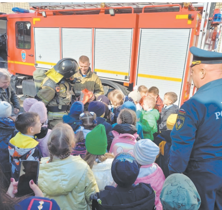
Спасатели напомнили школьникам правила пожарной безопасности.

детей осознанное и ответственное отношение к правилам пожарной безопасности пожарные провели