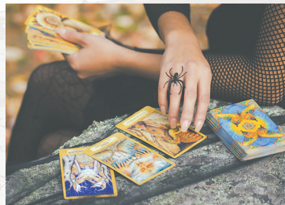
Профессии «Таролог» не существует.

ход из других источников ухаживающий не имеет права. Однако согласно проекту приказа Минтруда РФ, возможно, уже с января 2024 г. работающие на дому родители, которые ухаживают за детьми-инвалидами в возрасте до 18 лет и инвалидами с детства первой группы, смогут получать ежемесячные выплаты. При этом не будет иметь значения, работает опекун в формате частичной занятости, неполный рабочий день, удалённо или по договору гражданско-правового характера. Пособие также смогут получать самозанятые.