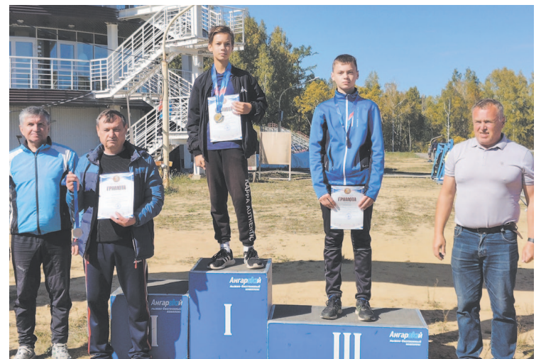
Один из наших юных спортсменов встал на пьедестал почёта.