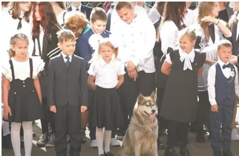
Школьники вернулись в родные стены.

Теперь можно официально заявить: школа № 6 открыта. Капитальный ремонт учебного заведения – событие грандиозное, масштабное. Начала ждали долго, а потом с нетерпением дождались его окончания. Но все ремонтные работы наконец-то позади.