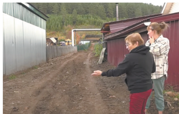
Прошло несколько встреч с представителем подрядчика, но изменений немного.

Местные уверенно заявляют что то, как и для чего вели работы, их не интересует. Сейчас для них важен только результат устранения ошибок подрядчика. Найти правых, виноватых, а тем более ответственных в разговоре невозможно. Подрядчик молча разводит руками и произносит многообещающую фразу «я постараюсь».