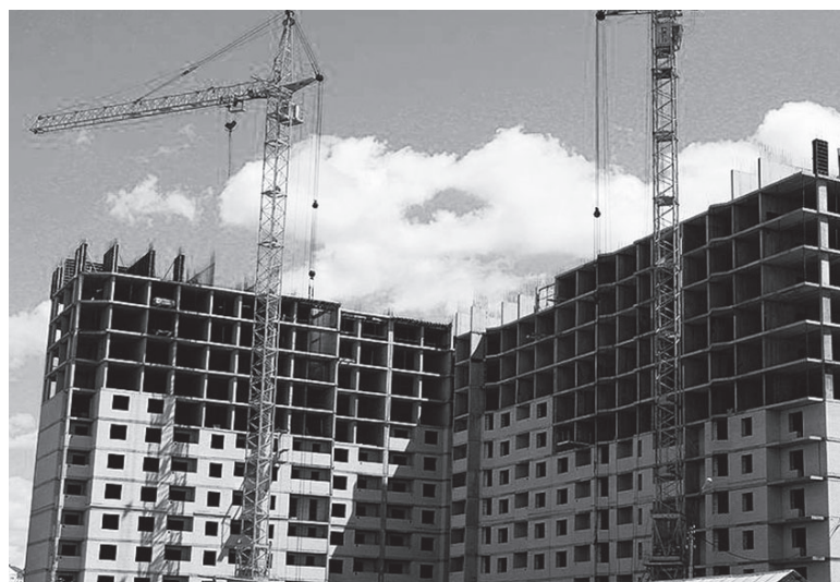
Обманутые дольщики могут рассчитывать на компенсацию.

щиков. По итогам встречи представители Фонда подтвердили готовность начать выплаты компенсаций по пяти объектам. Также сейчас прорабатывается вопрос об исключении одного объекта из реестра, так как в данном случае отсутствовали пострадавшие.