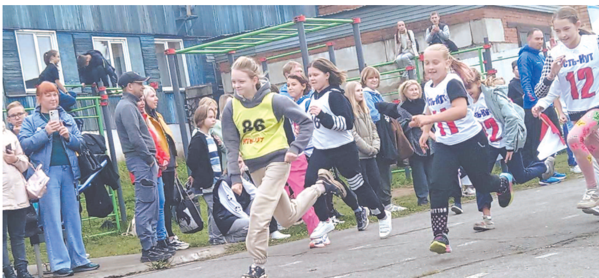
474 человека пробежали кросс Нации в Усть-Куте.