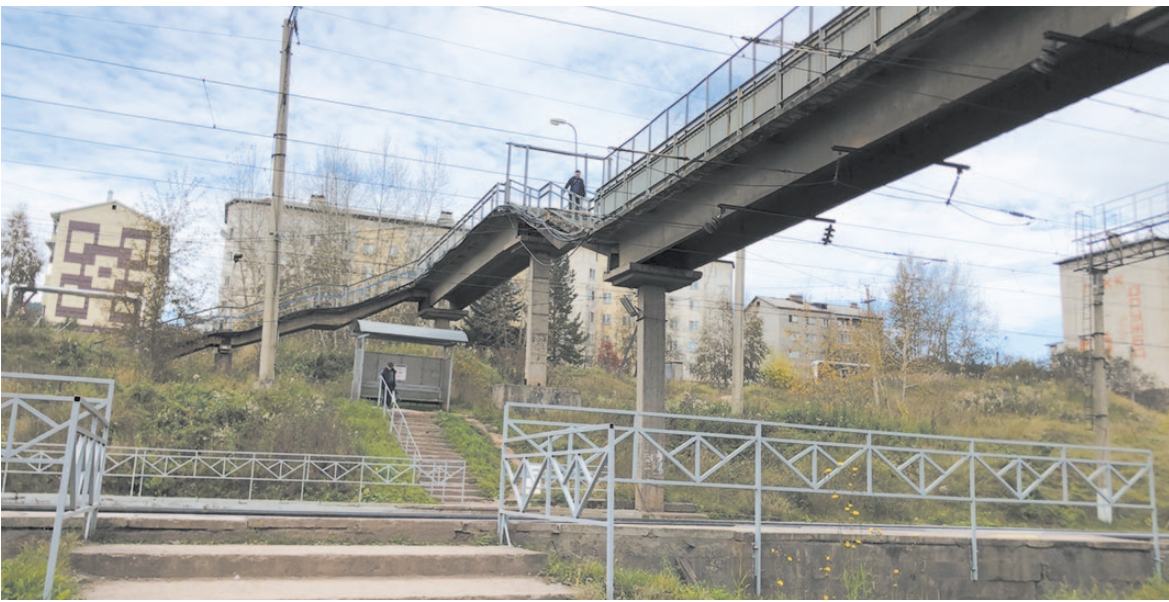
Переходить железную дорогу в неполюженном месте – большой риск.