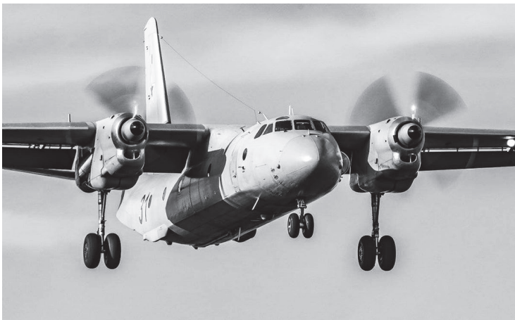
Самолёт такого типа может лететь и с одним работающим мотором.

В пресс-службе также добавили, что самолет АН-26 имеет такое строение, что может долететь и с одним работающим двигателем, поэтому эту ситуацию нельзя назвать чрезвычайной. Никаких экстренных мер не потребовалось. На борту находились 25 пассажиров и 5 членов экипажа. Пострадавших нет.