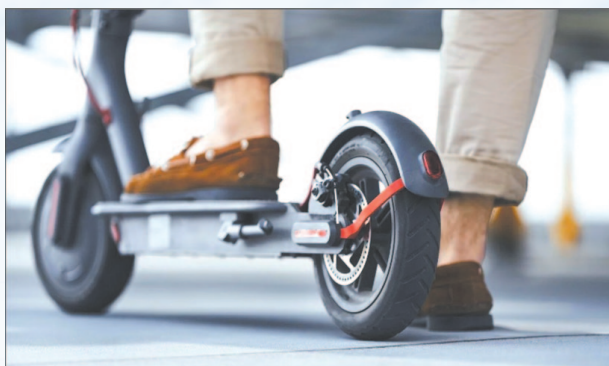
СИМ — это в том числе и электросамокаты.

— В ПДД должен быть запрет на движение СИМ по тротуару и пешеходным дорожкам, — считает председатель «Движения автомобилистов России» Виктор Похмелкин. — А если электросамокат движется по проезжей части, его владелец должен иметь зарегистрированный номер и полис ОСАГО, чтобы, если он