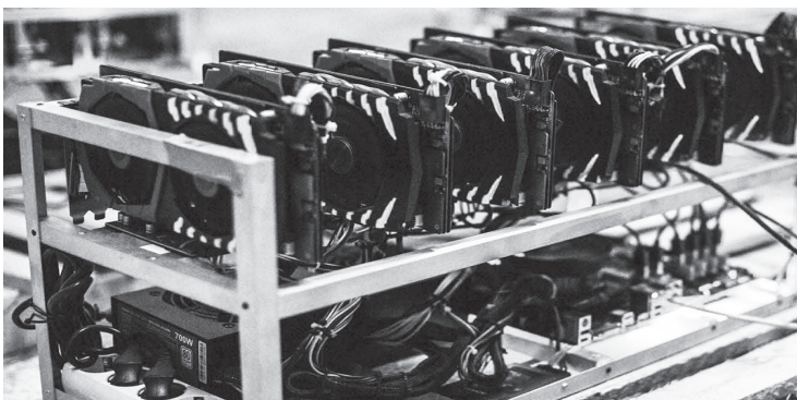
Перегрузка электросетей — частая причина возгораний.

Непригодный для жилья дом хозяин использовал для добычи криптовалюты. В нем он установил несколько машинок в шумобоксах. В результате перегрузки сети произошло воспламенение проводки. Проводится проверка.