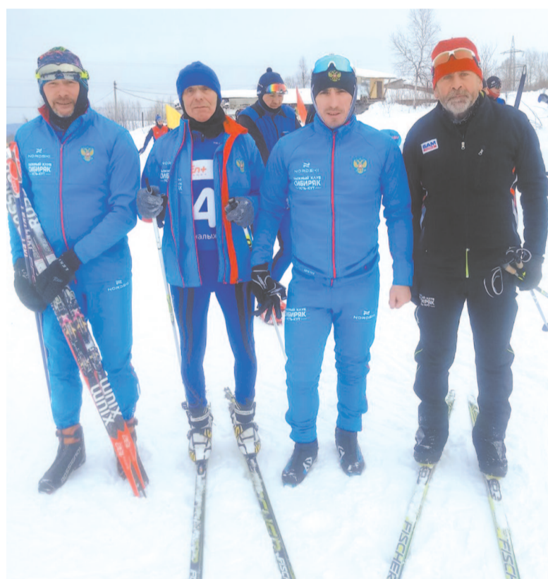
В команду «Север» вошли четыре спортсмена усть-кутского клуба «Сибиряк»