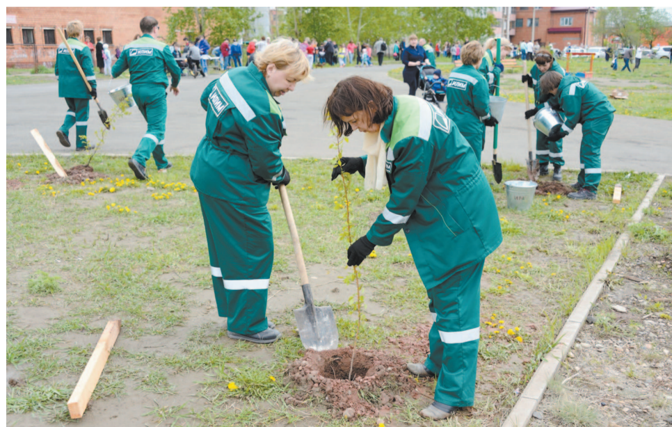
Власти Братска намерены дополнительные средства направить на программы по озеленению