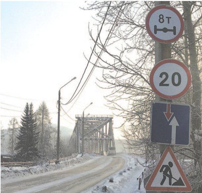
Для обеспечения безопасности проезда и снижения нагрузки на мост установлены дорожные знаки: ограничение скорости – 20 км/ч, ограничение нагрузки на ось – восемь тонн