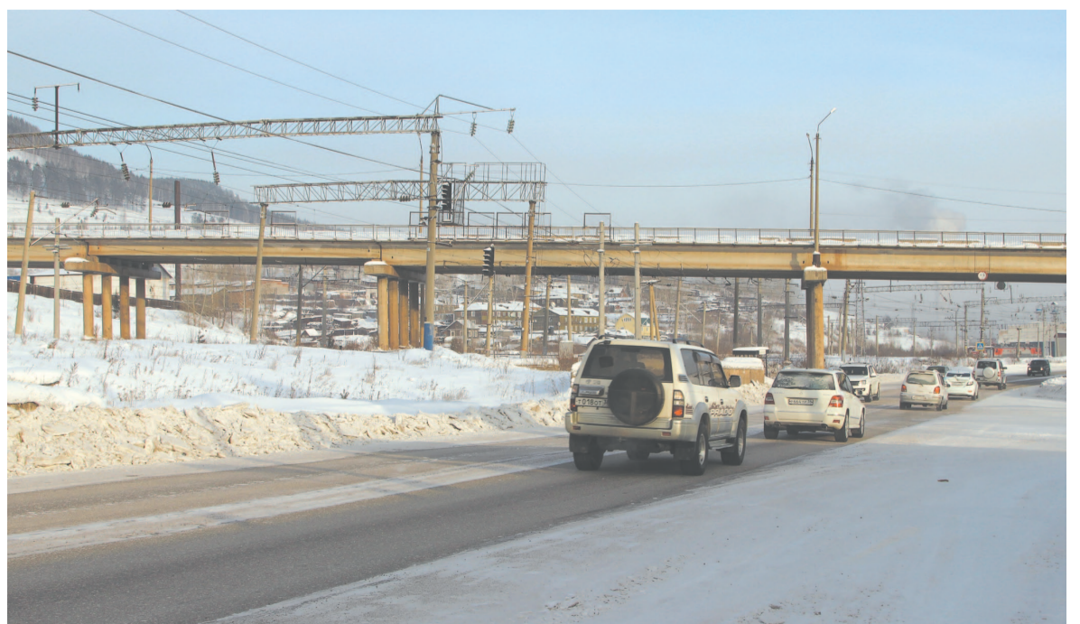
Капитальный ремонт мостов требует больших финансовых затрат, что непосильно для городского бюджета, нужна федеральная или областная поддержка