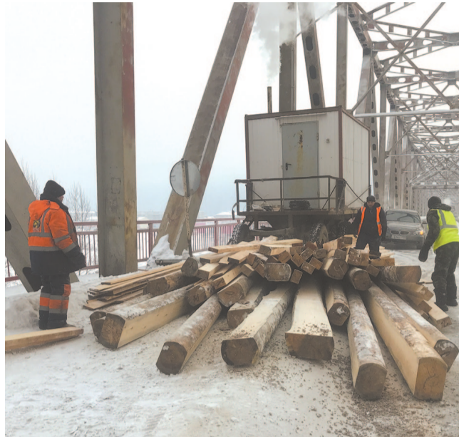
Работники ДСИО приступили к ремонтно-восстановительным работам 23 января