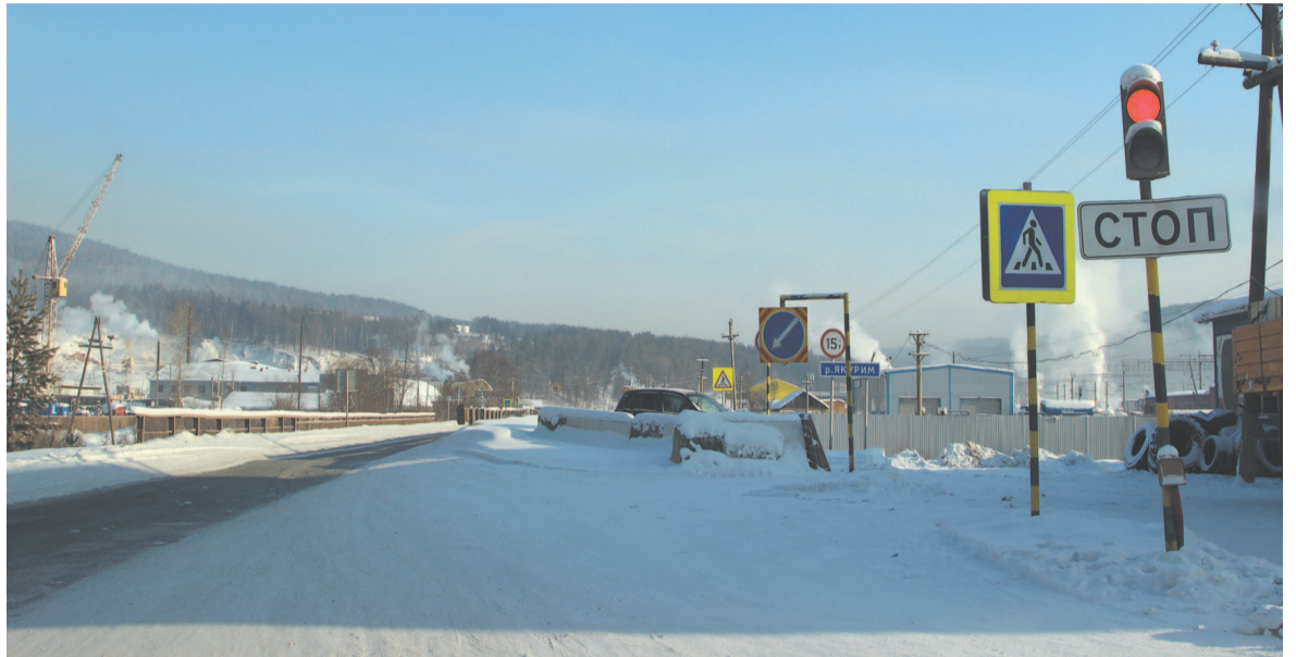
20 января объект капитального ремонта включен в предварительную программу работ на 2021-2022 годы

Безусловно, проблемы с мостами и путепроводами в нашем городе есть, но не всегда их решение зависит от местных властей. Контроль за инженерными сооружениями осуществляется, ремонт, насколько позволяет бюд-