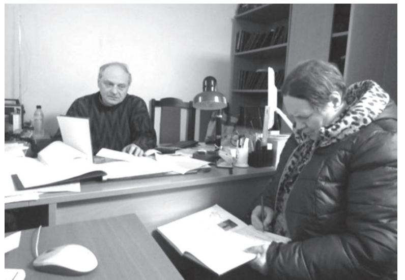
Архив Пискаревского кладбища. Для поиска информации о солдатах используем сведения из книги «Наши земляки – защитники Ленинграда»

Среди защитников Ленинграда действительно много уроженцев Иркутской области, в том числе из нашего района. Краеведы продолжают работу над установлением точных биографических сведений и мест захоронений, ведь нельзя допустить, чтобы хоть один солдат был забыт. А это значит, что воз-