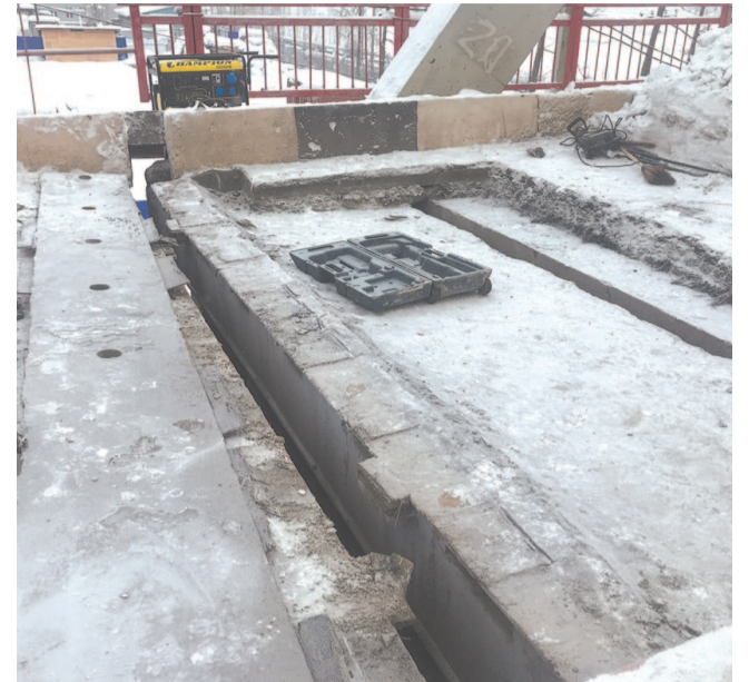
В плане демонтаж необходимого для работы участка проезжей части моста, установка смещенной плиты, создание временного деревянного настила

В наши социальные сети один из жителей прислал видеосъемку, на которой отчетливо видны трещины на опорах железнодорожного моста в районе Техучилища. Это стало поводом для проверки состояния путепроводов и мостов в Усть-Куте: насколько безопасны переправы, и проводится ли их техническое обслуживание?