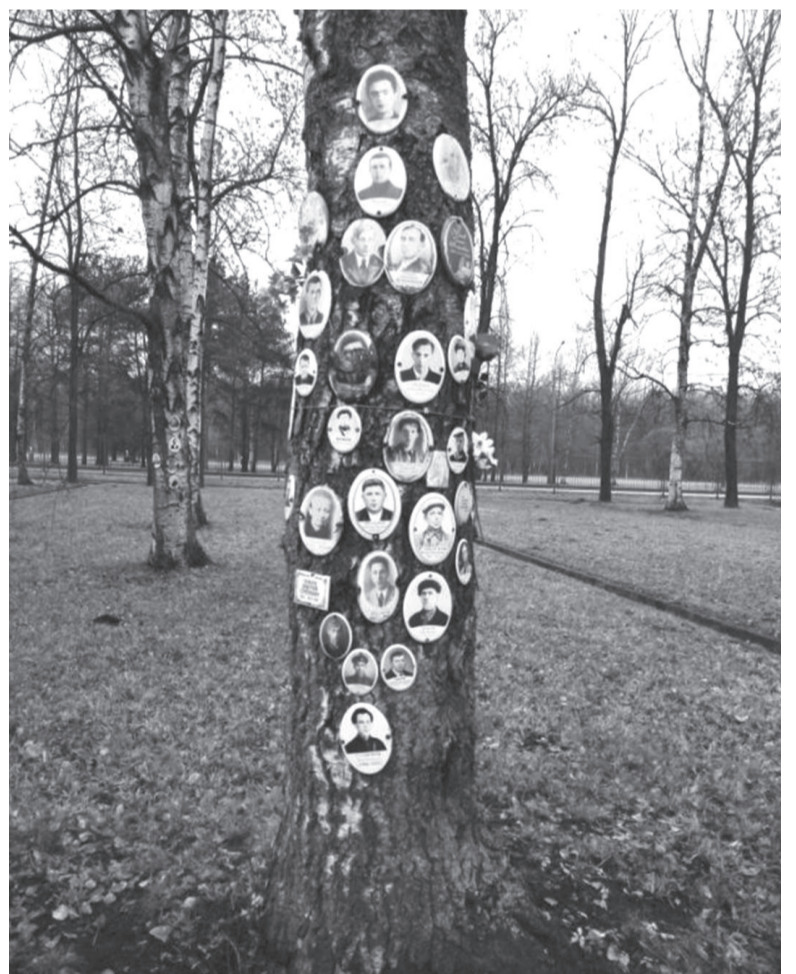
Вот так увековечены имена погибших в Ропше солдат

можен выпуск третьей книги. Издания, с которыми могут познакомиться все желающие, представлены в библиотеках и музеях Усть-Кутского района.