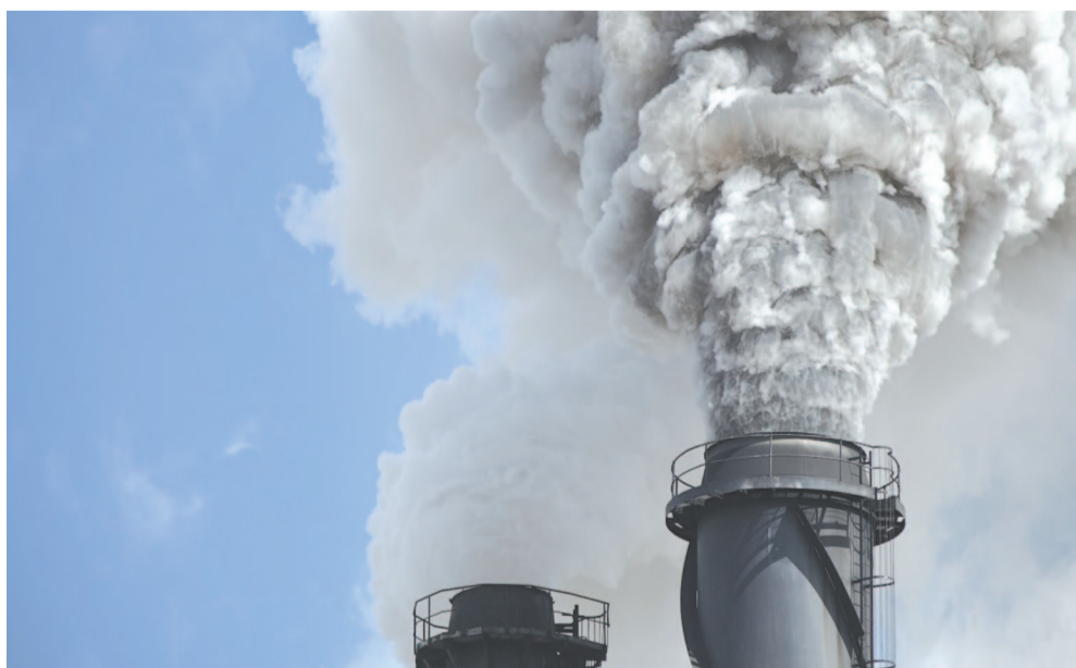
Задачи по минимизации ущерба природе, охране человеческого здоровья непосредственно лежат на плечах муниципалитетов