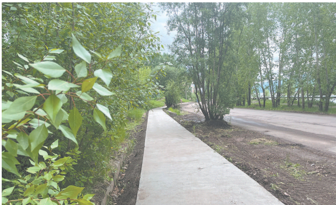
Тротуар по ул. Пролетарская, у шк. № 4.