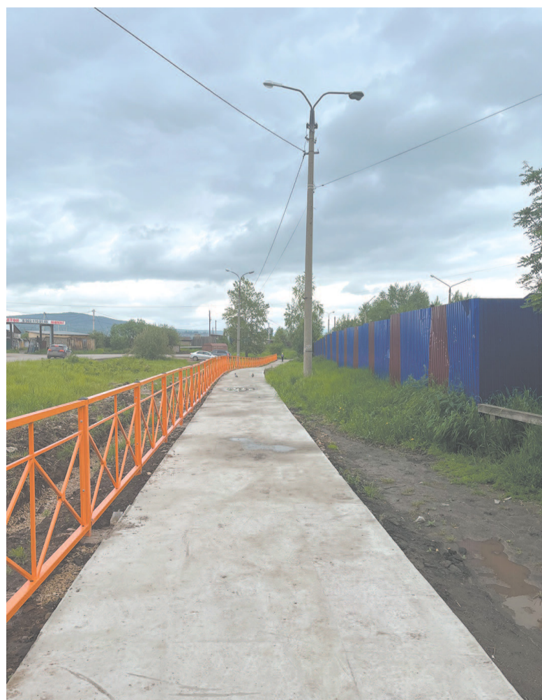
Тротуар по ул. Речников, у д/с «Тополёк».