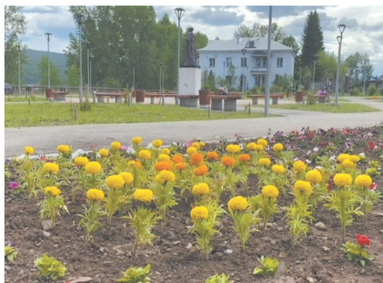
Цветник в парке им. Д.Е. Зверева.