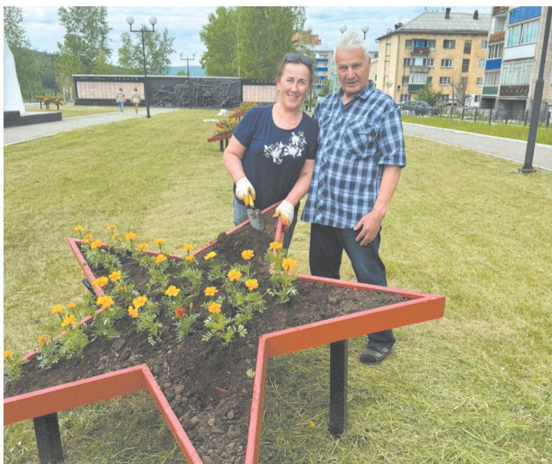
Неравнодушные жители принимают участие в озеленении города.