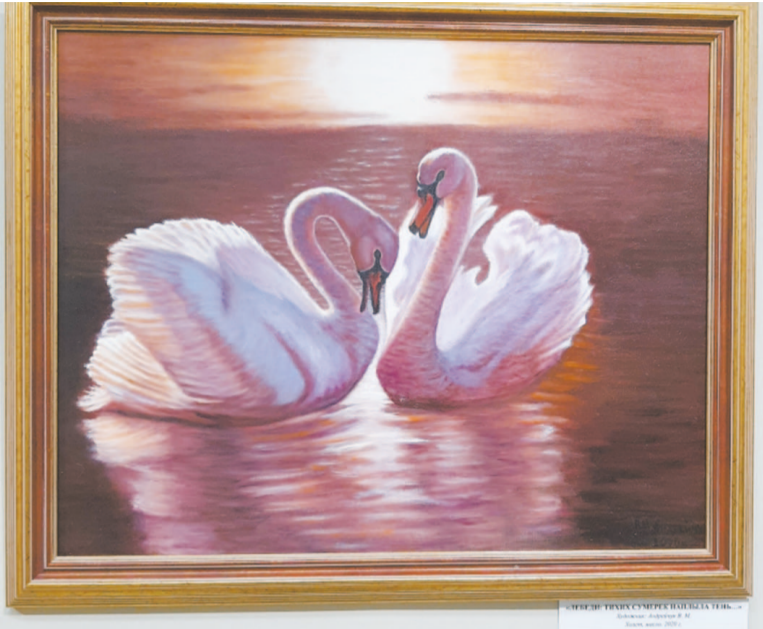
Из представленных работ посетители выбрали наиболее любимую картину «Лебеди: тихих сумерек наплыла тень...»