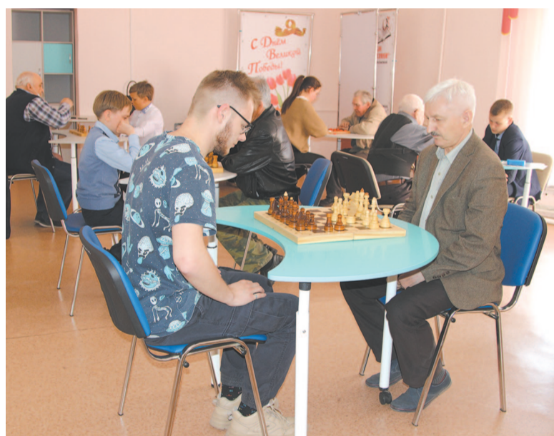
В ходе игры участники удивляли интересными игровыми комбинациями, неординарным решением шахматных партий

Все участники остались довольны своей игрой, ведь главное в таких мероприятиях участие, а не победа.