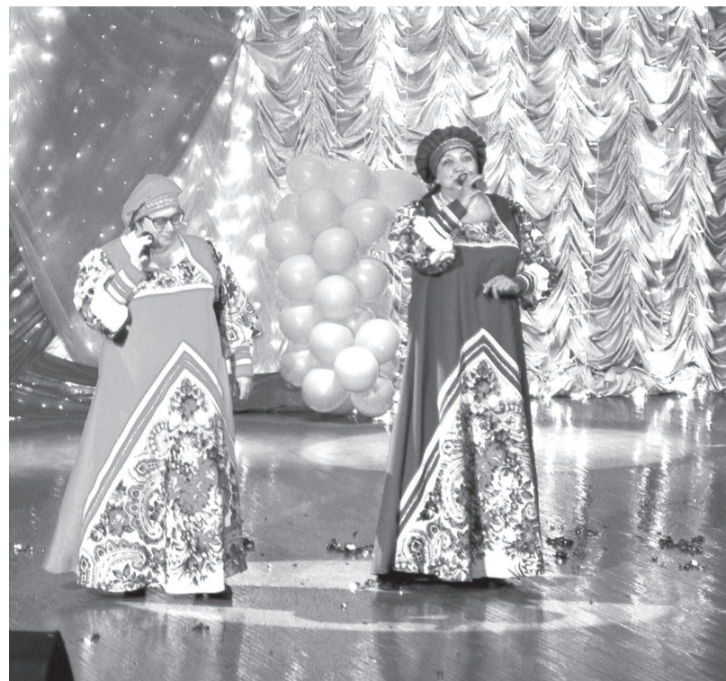
Каждое выступление стало запоминающимся