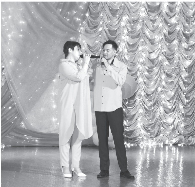
Дуэт «Вдохновение» исполнил песню «За Россию»