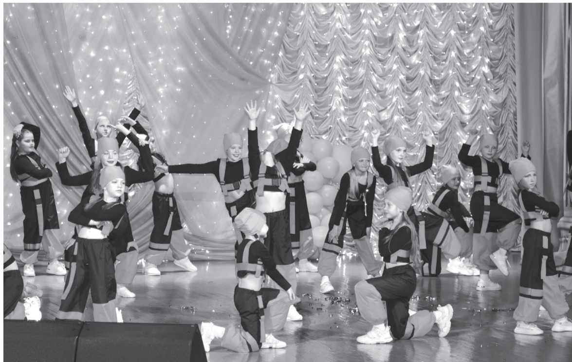
Устькютяне тепло встречали всех артистов ДК. Раз, и на сцену вышел «Кураж»!