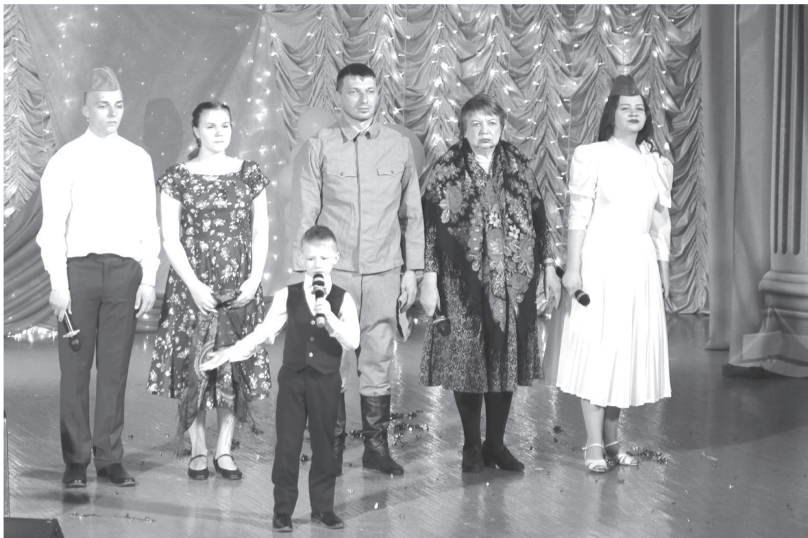
В программу мероприятия были включены номера лирической и патриотической направленности