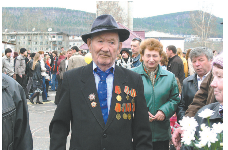
Самые ценные кадры – с участниками Великой Отечественной войны

хиве 20 фильмов. В основном о речном порте. Сейчас у каждого грузового района своё название: Западный, Восточный, Северный, Центральный. Мало кто знает, что несколько десятилетий назад они были под нумерацией, причём Первый район находился рядом со Вторым, вблизи Зыряновки. Построили большой причал, где могли швартоваться суда. Их ставили под погрузку муки, сахара и других продуктов питания. По транспортёрной ленте мешки перемещали в трюм.