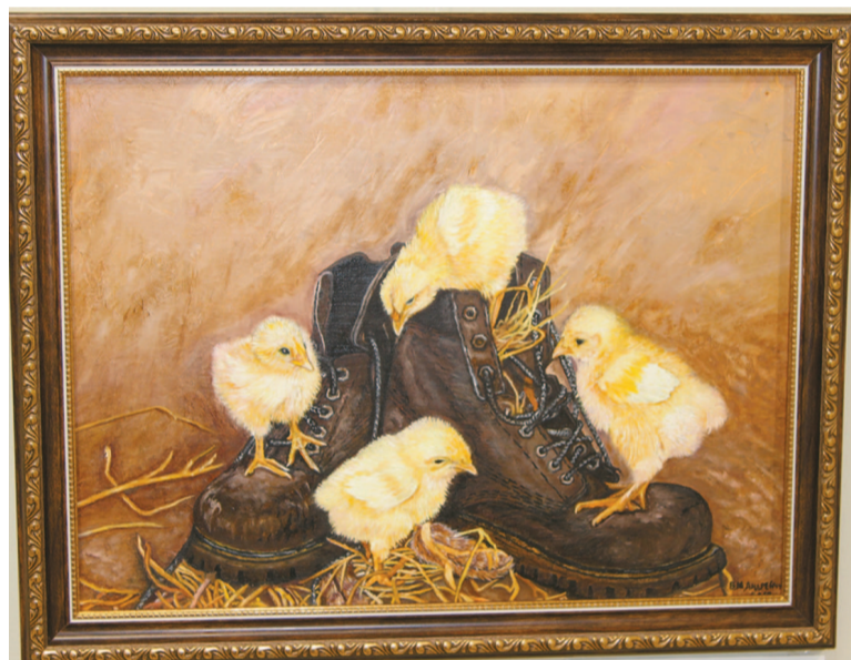
Подарок Усть-Кутскому историческому музею – картина «Инкубаторские»

Среди всех видов изобразительного искусства анималистика по праву считается самым древним. Рисунки первобытных людей, сохранившиеся в пещерах, поражают наших современников удивительной жизненностью изображений диких животных. Анималистические темы присутствуют и в творчестве русских живописцев, таких великих художников как В. Васнецов, К. Савицкий, Е. Чарушин, С. Ворошилов, И. Шишкин, В. Серов и других.