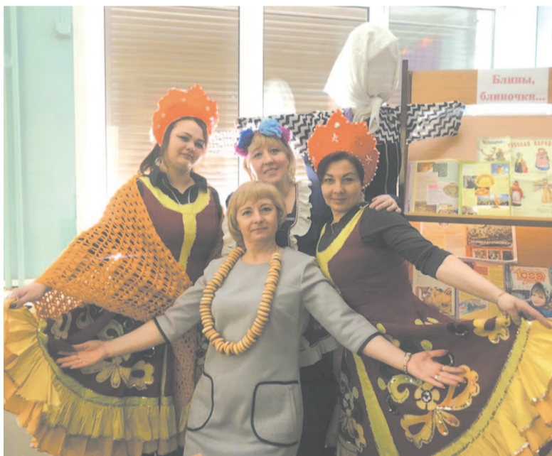
Наш коллектив, 2021 год