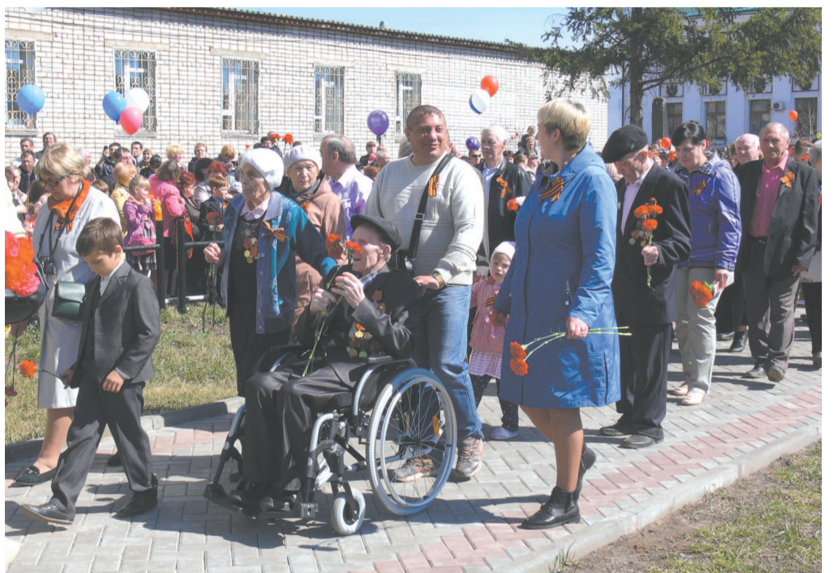
«Вам всем, кто вынес ту войну – в тылу или на полях сражений, – принёс победную весну, – поклон и память поколений»