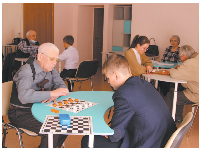
Прошел завершающий турнир по шашкам и шахматам среди ветеранов и молодёжи