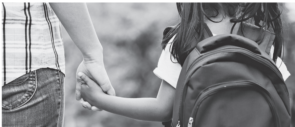
Меры безопасности не должны ограничиваться установлением тревожных кнопок и систем видеонаблюдения

Федеральным правительством, Государственной думой и органами исполнительной и законодательной власти Иркутской области уже обсуждается ряд неотложных решений. Одной из первоочередных мер должно стать усиление пропускного режима и ограничение доступа в образовательные учреждения.