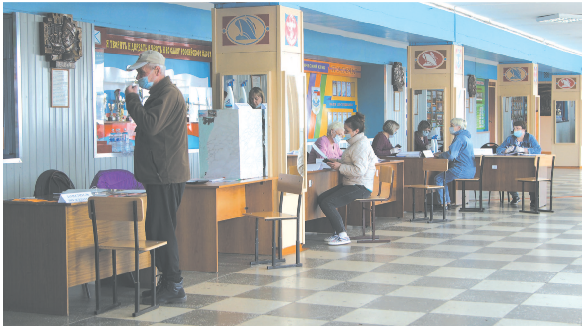
В досрочных выборах главы Усть-Кутского муниципального образования (городского поселения) приняли участие 6085 избирателей (18,74 процента)

На досрочных выборах главы Усть-Кутского муниципального образования (городского поселения) и дополнительных выборах