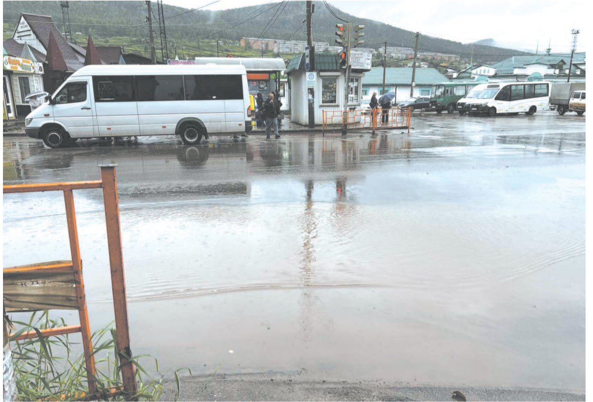
От луж на Кирова не удалось избавиться даже после ремонта дороги.

– Конечно, укладывать искусственные неровности, которые наши горожане называют «лежащими полицейскими», будем в обязательном порядке, поскольку это прописано в контракте. Кстати, мы пересогласовали высоту неровностей, шириной они будут так же четыре метра, а вот высота составит семь сантиметров. Обязательно это сделаем, потому что безопасность пе-