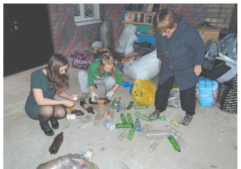
Сортировка – важный этап перед отправкой на переработку.