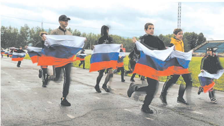
На стадионе «Водник» юные спортсмены пробежали эстафету с флагами.