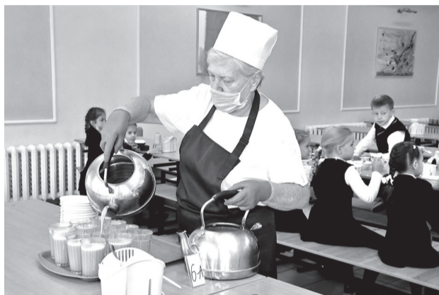
Работники школьных пищеблоков должны носить маски.