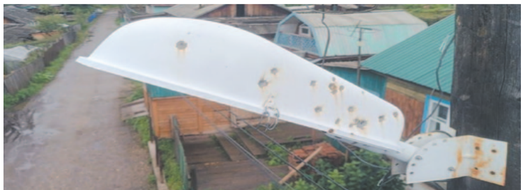
Фонари просто расстреляли из пневматической винтовки.

«В городе в течение последних двух лет идет планомерная работа по восстановлению уличного освещения. Из бюджета выделяются небольшие средства для того, чтобы максимально отработать по всем заявкам, которые поступают от жителей города. Правда, как выяснилось, не все горожане хотят, чтобы на их улицах было светло», – говорится в сообщении администрации, опубликованном в мессенджере Телеграм.