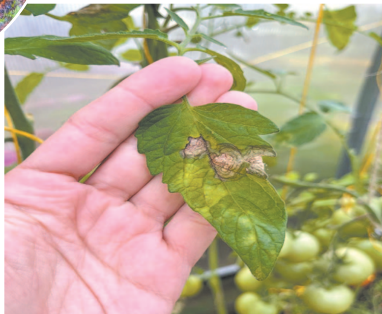
Фитофтороз без преувеличения можно назвать страшным сном любого дачника.

Чтобы избежать появления фитофтороза, лучше всего проводить профилактические мероприятия. Самой эффективной профилактикой фитофтороза является грамотный севооборот. Не следует высаживать томаты и другие паслёновые на одно и то же место больше 3–4 лет. Лучшими последователями после них являются лук, чеснок, бобовые культуры, капуста.