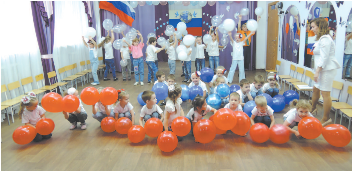
Белый цвет символизирует чистоту, синий - верность, красный - силу.