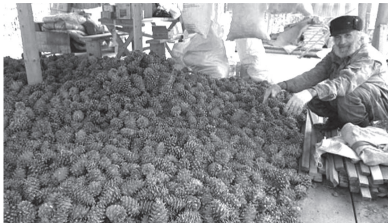
До 10 тысяч тонн ореха планируют заготовить в этом году.

Жители Приангарья могут бесплатно заготавливать кедровый орех для собственных нужд на всех лесных участках Иркутской области.