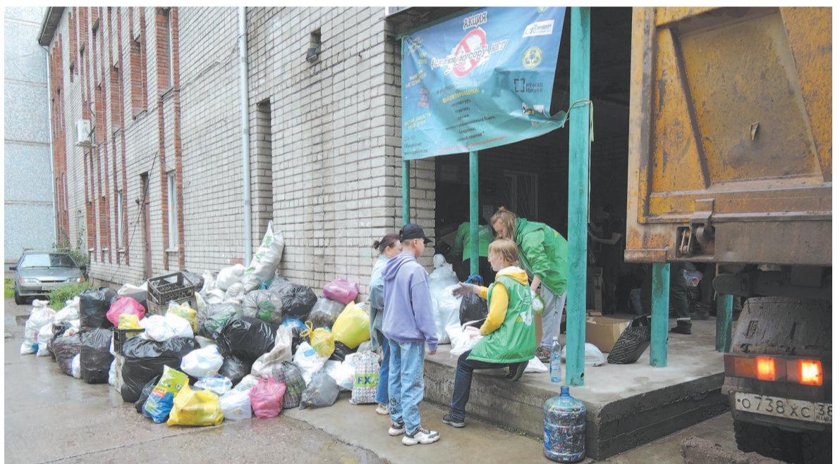
Вторсырьё сдавали в течение всего дня.