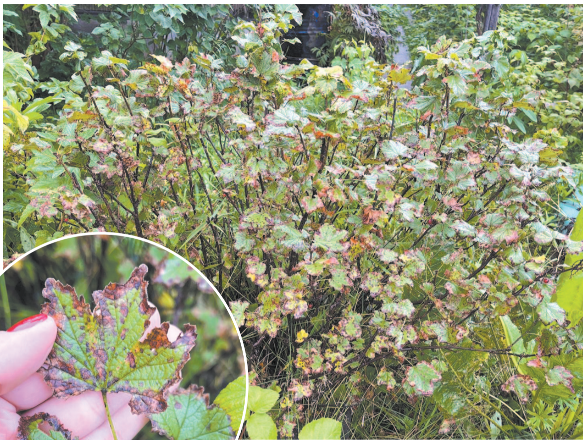
Так выглядят листья смородины, поражённые антракнозом.

Отличной профилактикой антракноза является регулярная обработка растений «Фитоспорином». Его можно применять даже на стадии