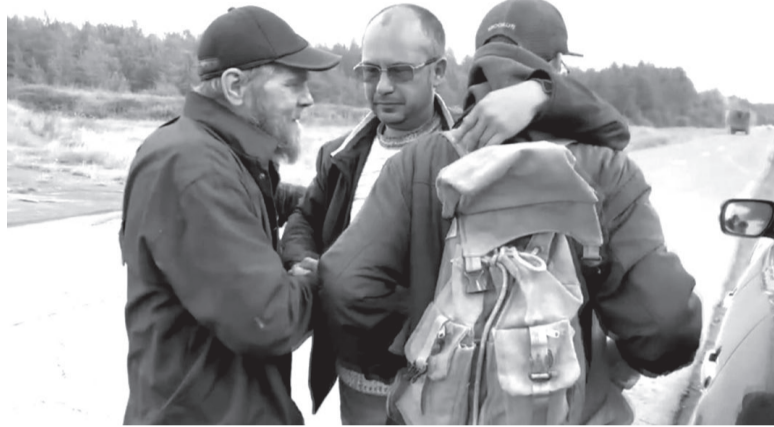
Отец не сдерживает слёз, обнимая сына-подростка. Мальчика вместе с дедушкой искали трое суток.

Было известно, что заблудившийся пенсионер – опытный таёжник, занимающийся охотой и ранее работавший геологом, он уверенно ориентируется в лесу, имеет с собой небольшой запас