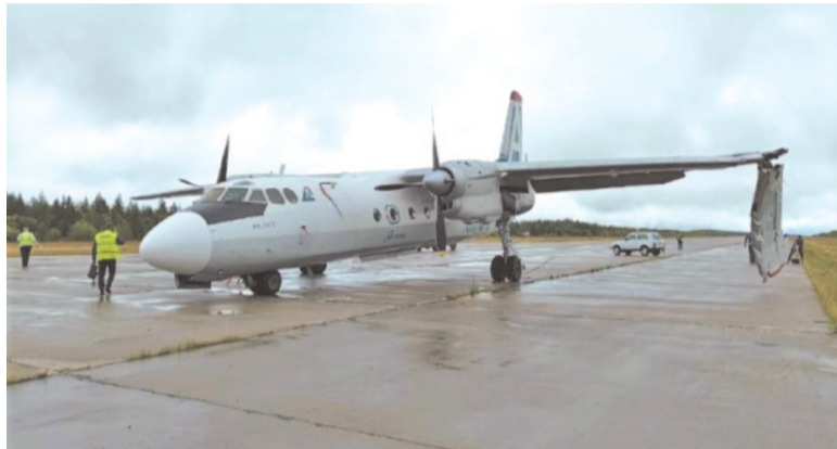
Самолёт выкатился за пределы взлетно-посадочной полосы и получил повреждения.

Самым обсуждаемым событием прошлой недели, несомненно, стала аварийная посадка пассажирского самолёта Ан-24 в аэропорту Усть-Кута. Официальной информации о происшествии крайне мало, вот что известно на сегодняшний день.