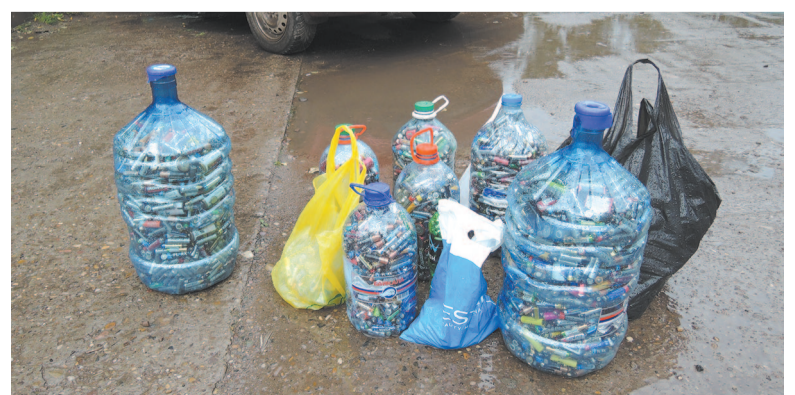
Самое тяжёлое во всех смыслах вторсырьё.