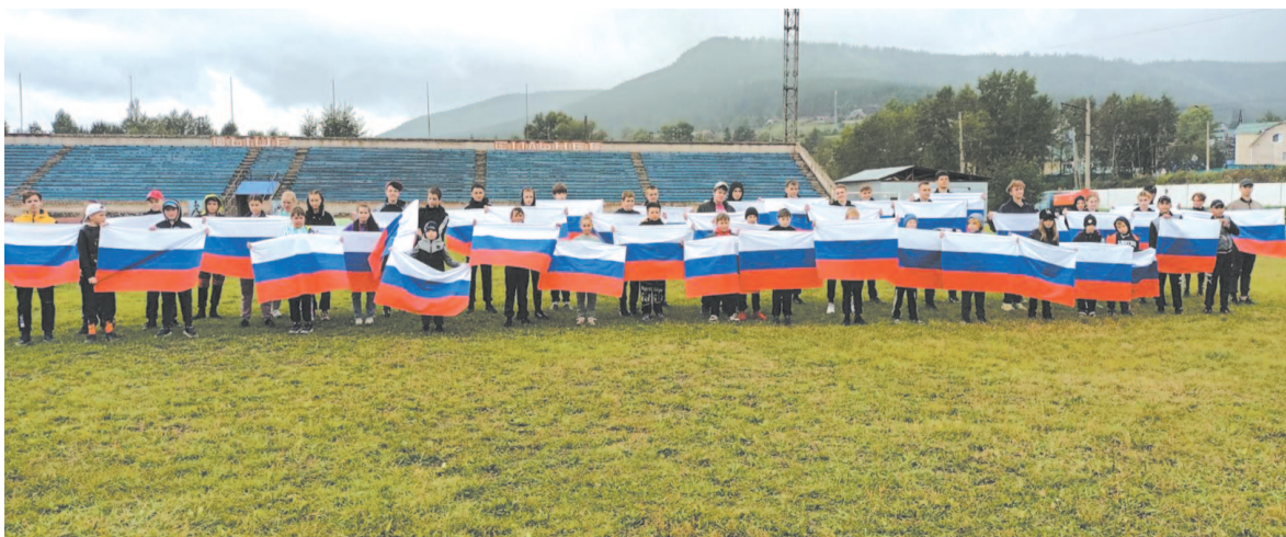
Дождь флешмобу не помеха.