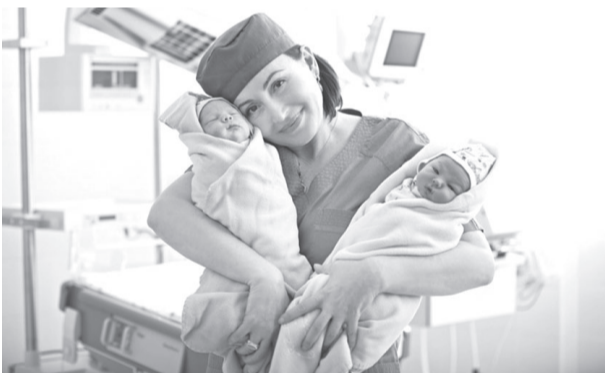
При рождении двойняшек размер материнского капитала составит 693 144,1 рубля.

Если родители уже получили маткапитал на первенца ранее, то за двойняшек семья получит 168 616,2 рубля, положенные на второго ребёнка.