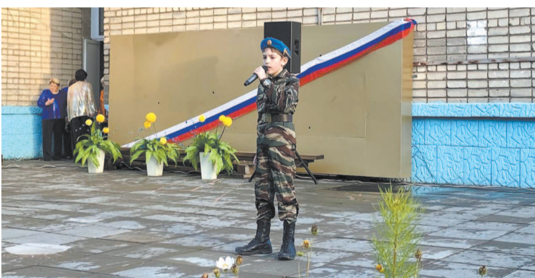
22 августа вся страна отмечала День российского флага. В Усть-Куте тоже организовали разные активности.

22 августа на стадионе «Водник» прошло мероприятие, посвящённое Дню флага Российской Федерации. Молодые спортсмены организовали флешмоб с флагами, а затем приняли участие в эстафете.