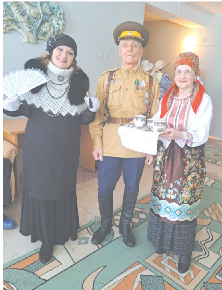
Тропю памяти по истории родного края.