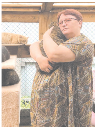
Надежда с Гифестом

– Гифест и его друг Топаз оказались на улице по причине пожара, и наши волонтеры пристроили их в «Кошкин дом». Топаз изолировали от Гифеста, потому что Топаз болел, и ему было необходимо лечение. Они оба переставали есть, когда их разлучали, и Гифест всё время пробирался к своему другу, всегда был рядом, они буквально всё время лежали в обнимку. Ког-