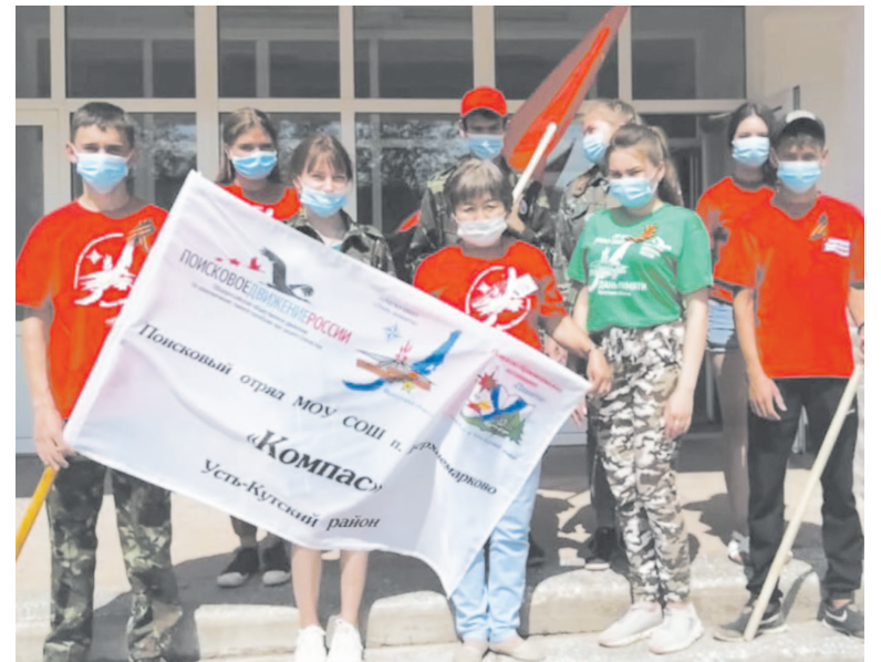
Слёт поисковых отрядов проходит в онлайн-режиме

В связи с ситуацией с коронавирусом ежегодный слёт поисковых отрядов, в котором участвовало 450 человек из разных регионов Сибири, проводился в онлайн-режиме. Жюри отметило отличную подготовку устькутян.