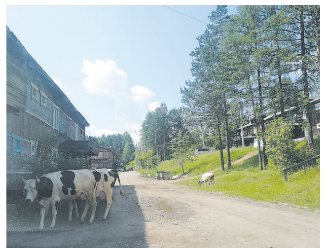
В такой ситуации население может обращаться к участковому