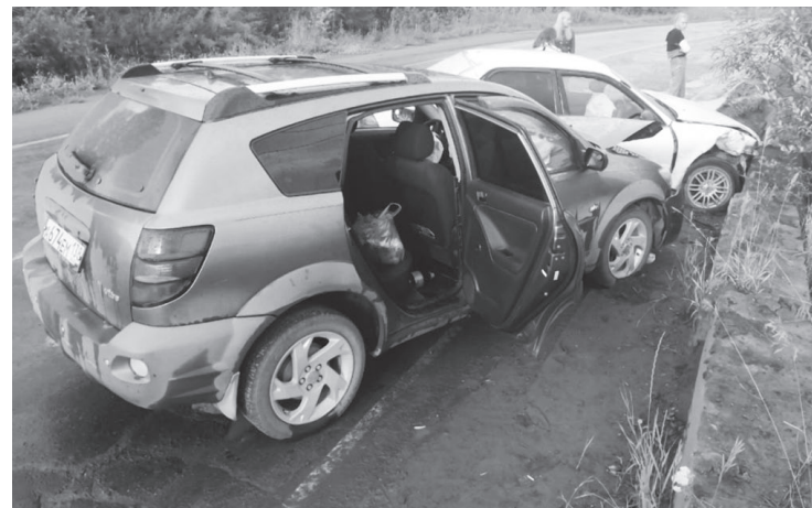
На улице Винеиной в ДТП пострадали два несовершеннолетних