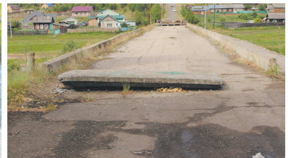
Подъезжая к объекту, видно только две бетонные плиты, которые не сложно преодолеть как взрослым, так и детям