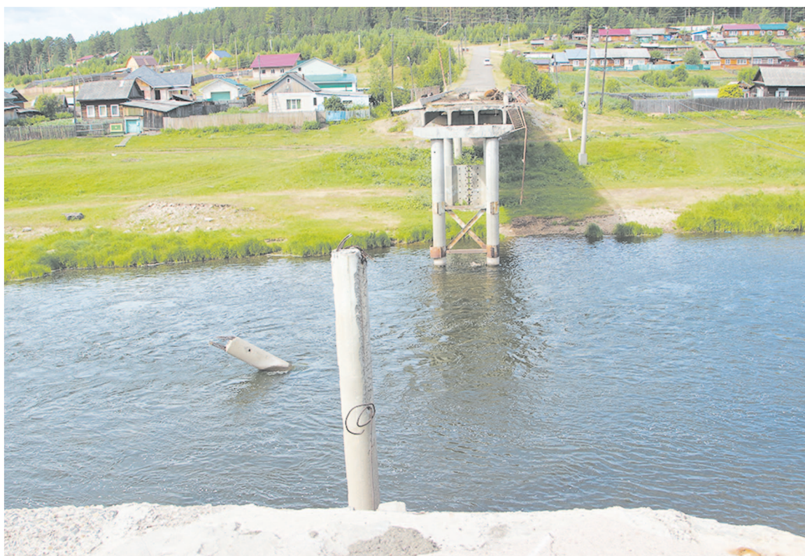
А где ограждение у разрушенного моста?