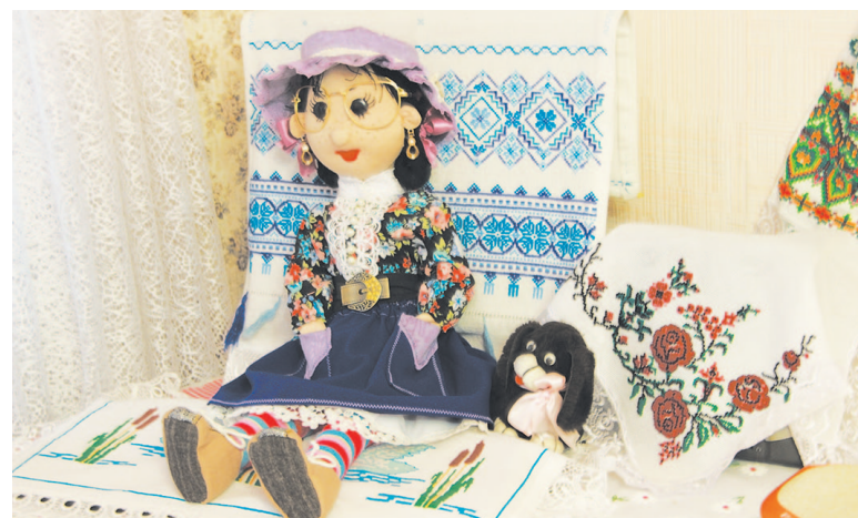
Именно так выглядит кукла тильда