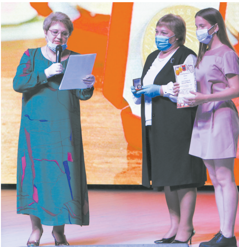
Помимо медалей ребятам также вручали и грамоты за особые успехи в обучении, а их родителям – за достойное воспитание детей