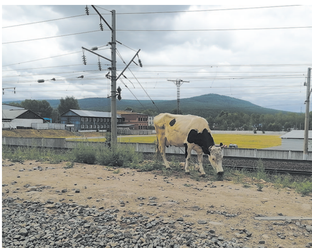
Ежегодно наблюдается выгул домашнего крупнорогатого скота без сопровождения