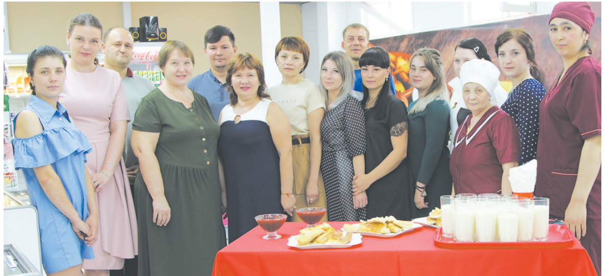
Секрет успеха компании «Алко» – нацеленность на результат, работа на опережение, новые идеи и, конечно же, любовь к общему делу!

«Алко» – одна из самых исполнительных и прогрессивных компаний по отношению к законам. Как только изменяются требования, нормы, появляются нововведения, руководство исполняет их незамедлительно. Компьютеризация позволяет делать скидки, каждую неделю проводить акции. На сегодняшний день до 1 августа в супермаркетах действуют фиксированные цены,