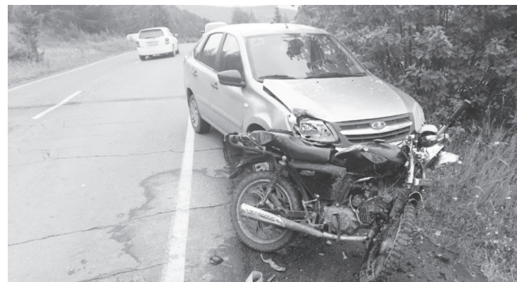
В результате аварии водитель мотоцикла получил травмы разной степени тяжести

Госавтоинспекция рекомендует водителям строго придерживаться всех правил безопасности дорожного движения, быть внимательными на дороге, выбирать скоростной режим, соответствующий конкретным погодным и дорожным условиям. Не нарушать режим самоизоляции.