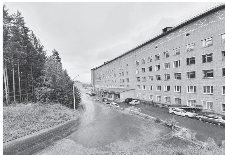
В период обострения пандемии пациенты с хроническими заболеваниями не получали необходимого лечения

– За последние двое суток в регионе выздоровевших больше, чем заболевших. Цифры обнадеживают, однако расслабляться нельзя. Все поликлиники и учреждения здравоохранения включились в работу по сопровождению больных, которые проходят лечение на дому. В обязательном порядке мы проведем диспансеризацию старшего поколения, тех, кто находится на самоизоляции. Планируется, что обследование будет проходить в поликлиниках по месту жительства, в определенные дни, вероятнее всего, в субботу, чтобы не допускать массового скопления