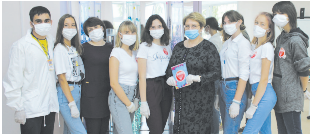
Накануне по адресу: улица Реброва-Денисова, 1А был открыт молодежный центр «Братство активной молодежи». Здесь будут собираться единомышленники, чтобы воплощать различные проекты и идеи