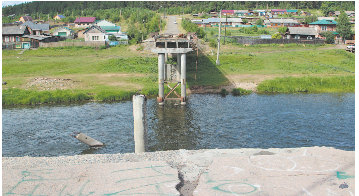
Через реку Куту до сих пор не установлены предупреждающие знаки, нет ограждений, забора, вывески