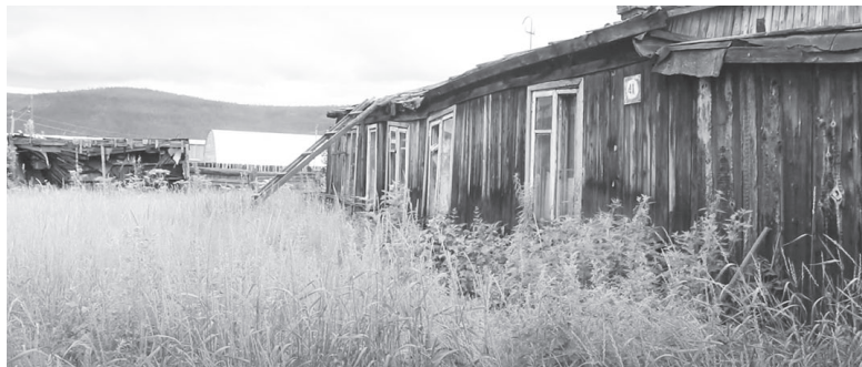
Дом № 41 на улице Заречной больше похож на развалины

Дом № 41 на улице Заречной больше похож на развалины. Кажется, что он может упасть от малейшего прикосновения: крыша – как решето, потолок осыпается, пол сгнил от ветхости.