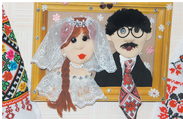
Тили-тили-тесто... Жених да невеста.