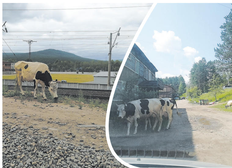
Как быть с коровами?

В нашу редакцию ежедневно поступают вопросы устькутян по разным проблемам, о разъяснении некоторых из них читайте на стр. 4.