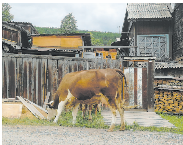
Местные жители опасаются за безопасность близких, особенно детей