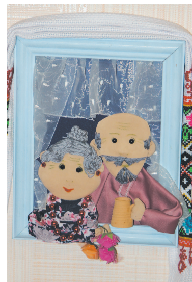
Перед нами целая картинная галерея