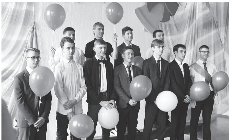
Будущие выпускники лицея.

Как замечательно, что есть в году день, когда мы можем признаться в любви и уважении к мужчинам и обратиться к ним с самыми искренними пожеланиями всех земных благ. В лицее мужчин трудится немного, но о каждом совершенно справедливо можно говорить только в превосходной степени.