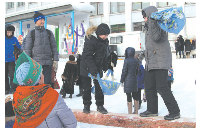
Не оставили без внимания и такую забаву, как «Бой с мешками на бревне», где нужно было сбить мешком противника. Проигравшим считается тот, кто первым коснулся земли.

Помимо концерта на сцене была организована площадка с русскими забавами, на которой полноценно проводилась развлекательная программа.