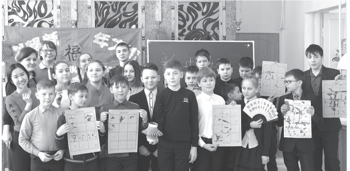
Лицеисты научились писать китайские иероглифы на специальной бумаге.