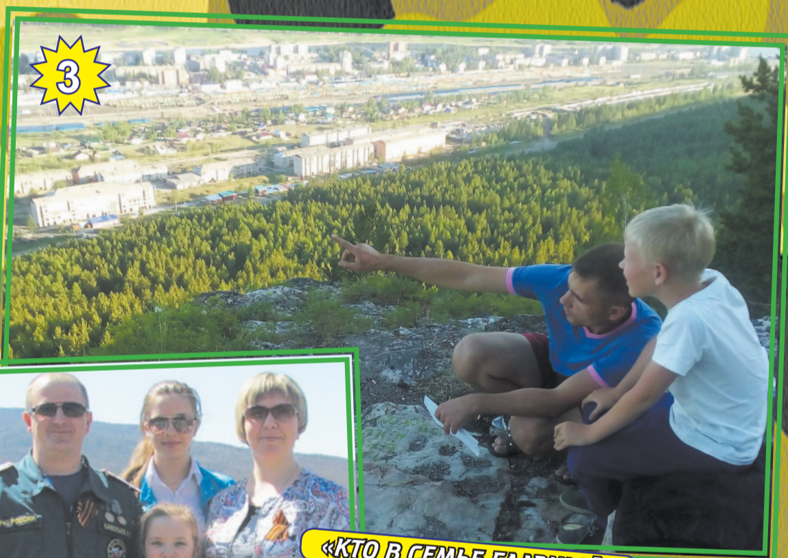
«КТО В СЕМЬЕ ГЛАВНЫЙ»