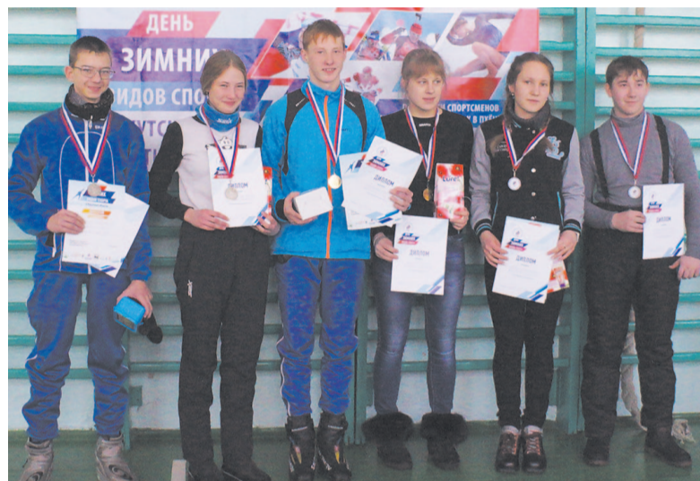
Победители и призёры соревнований по лыжным гонкам.

В течение двух дней состязания проходили на разных спортивных площадках города. 10 февраля были проведены хоккей с мячом, велосипедные старты и соревнования по конькобежному спорту. 11 февраля на площади водного вокзала и перед зданием ДК «Речники» были органи-