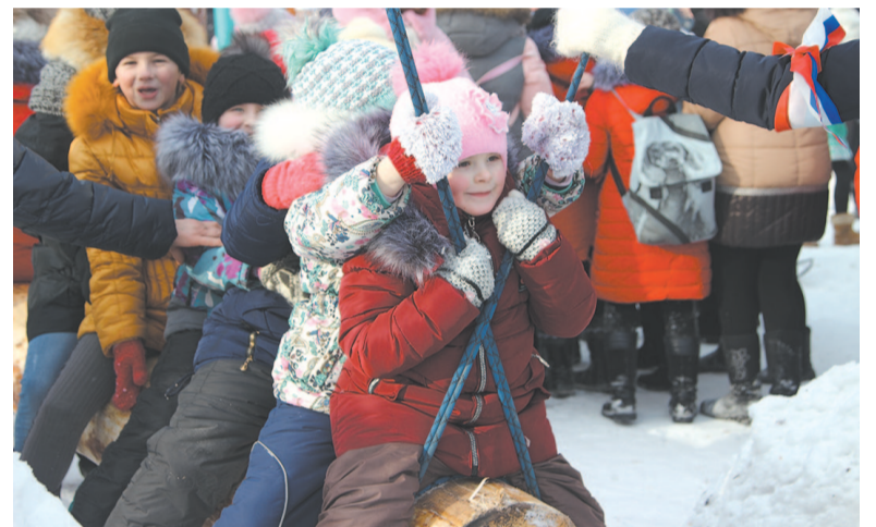
Особое внимание детей привлекла качеля из бревна, на которой можно было веселиться всей гурьбой.

Катание на санях в Масленицу – праздничная забава, пришедшая к нам из царской Руси. Раньше такие катания назывались «сездки», потому что в них принимали участие все жители окрестных деревень. И сегодня лошади, запряженные в сани, катали всех желающих.