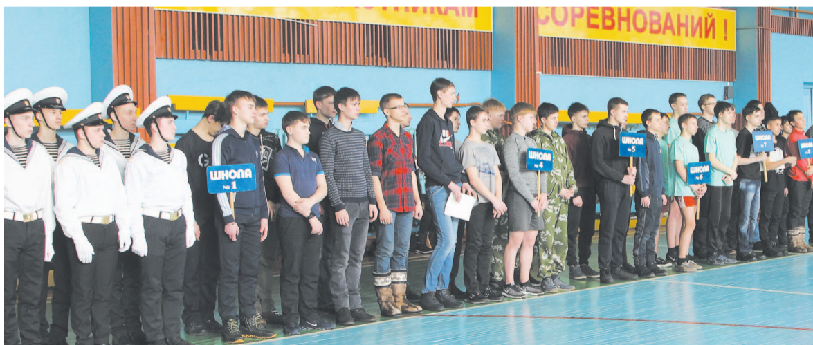
Участники лично-командного первенства допризывной молодежи.

10 февраля на базе спортивного комплекса «Водник» состоялось лично-командное первенство допризывной молодежи. Спартакиада была посвящена Дню защитника Отечества, в ней приняли участие школьники 2001 года рождения.