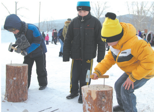
Традиционно горожане участвовали в силовых состязаниях. Любой желающий мог поспорить в забивании гвоздя в полено.