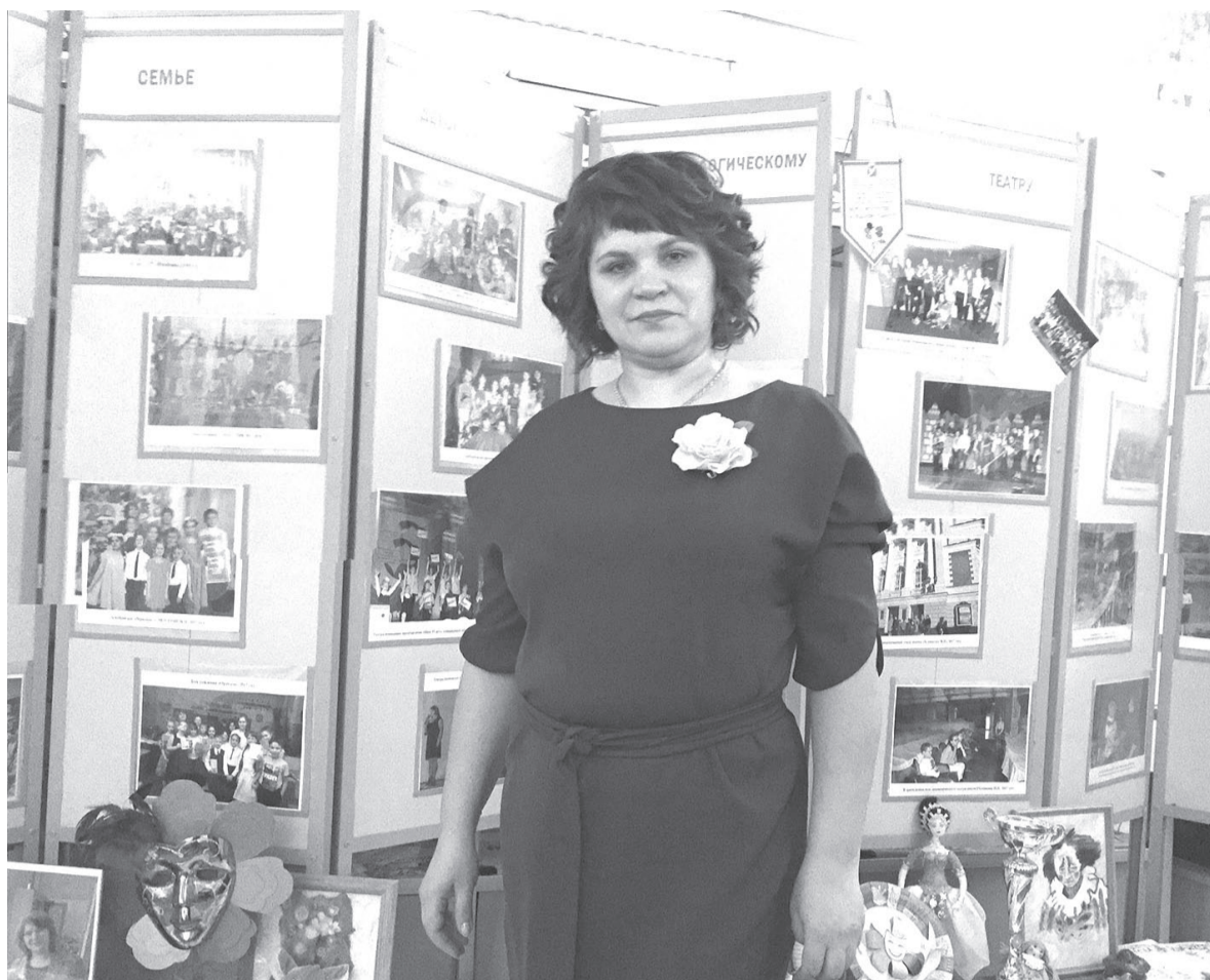
В Музее народного образования была открыта выставка, посвященная 20-летию детского экологического театра «Орхидея».