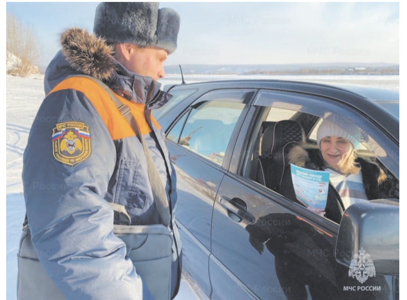
Выезжать на лёд можно только в специально оборудованных местах.