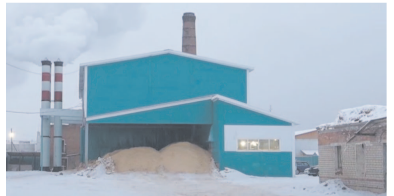
Щепа неожиданно стала дефицитной.