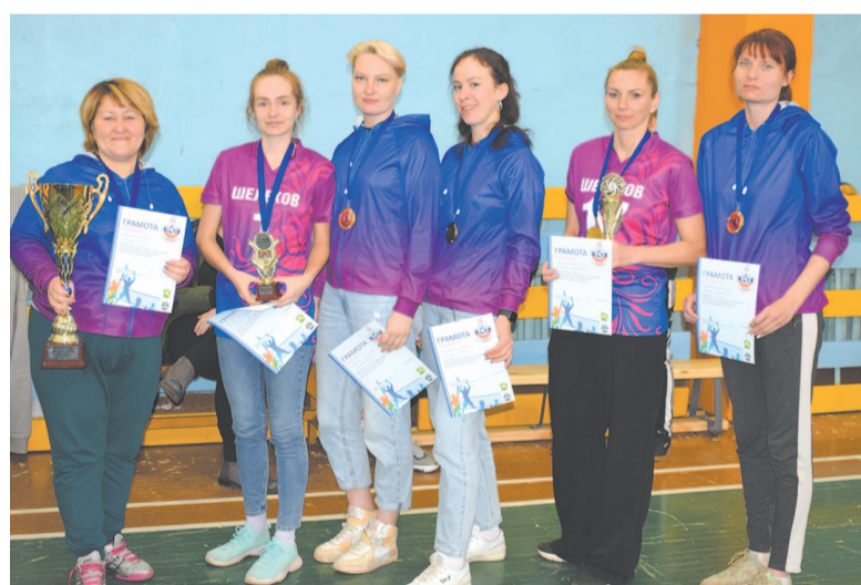
В третий раз чемпионками турнира среди женских команд стала команда «Шелехов» – действующий чемпион Иркутской области.