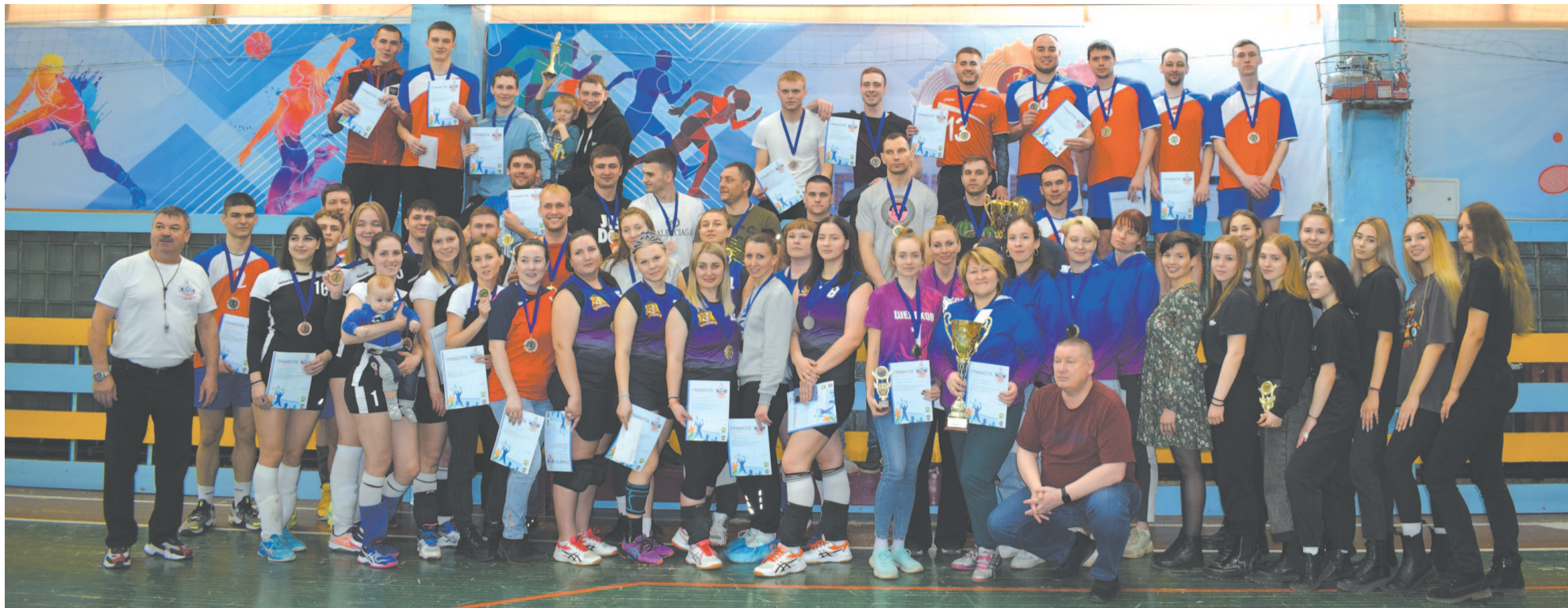
16 и 17 апреля в Усть-Куте в 4-ый раз прошёл Открытый турнир по волейболу среди мужских и женских команд «Кубок Осетрово». Участие в соревнованиях приняли сильнейшие любительские команды Иркутской области.