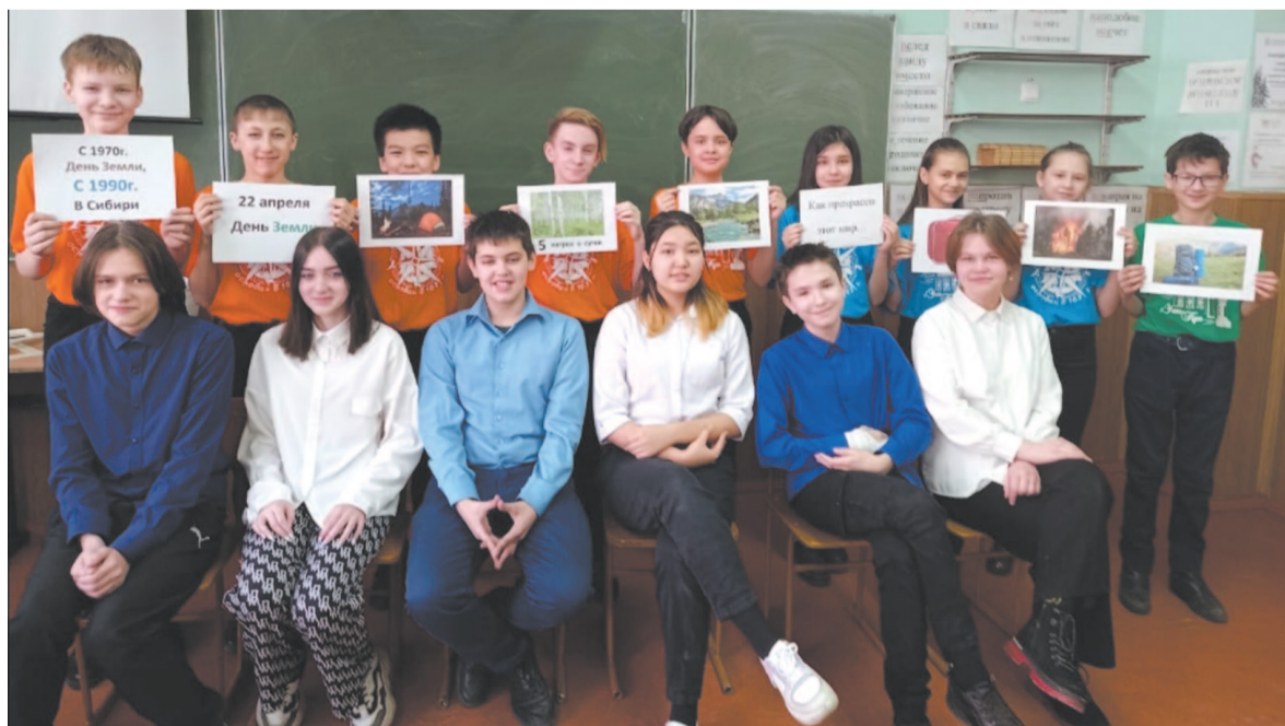
Агитбригада Дня Земли с одноклассниками

Мы хотим кратко напомнить вам историю этого праздника. А началась она в сороковые годы XIX века, когда его основатель Дж. Стерлинг Мортон переехал со своей семьёй в штат Небраска. На новом месте они увидели бескрайние прерии с редкими деревьями. Мортон и его жена занялись посадкой деревьев, призывая сограждан последовать их примеру. В 1872 году Мортон предложил назначить День озеленения, и жители откликнулись, посадив около миллиона деревьев. В 1882 году Небраска объявила День Деревя официальным праздником штата, датой был выбран день рождения Мортон.