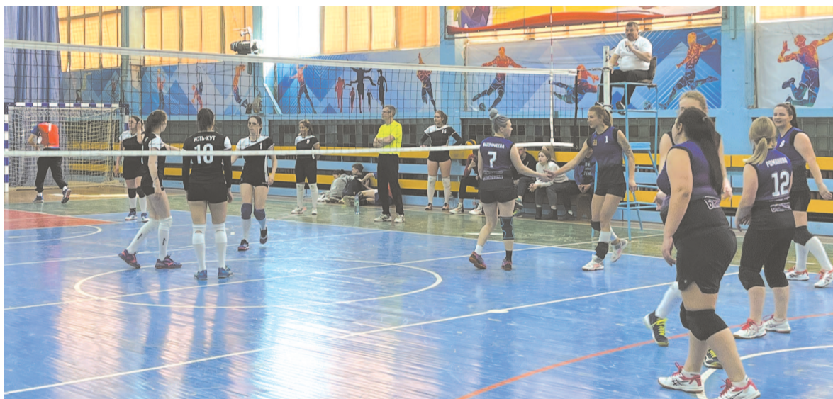
Турнир проходил по круговой системе, победитель определялся по количеству набранных очков

Соревнования проходили по круговой системе, победитель определялся по количеству набранных очков. По итогам двух дней турнира среди женских команд победу одержала команда «Шелехов». На втором месте – братский «Гелиос», на третьем – сборная команда Усть-Кута. Среди мужских команд титул чемпиона турнира завоевала брат-