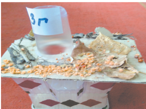
Птичью кормушку можно создать из любых подручных материалов