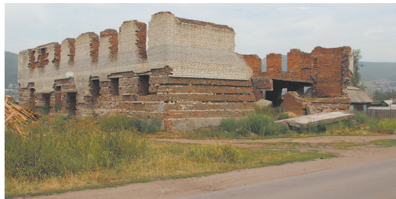
Нестроенная баня в Старой РЭБ привлекает внимание детей