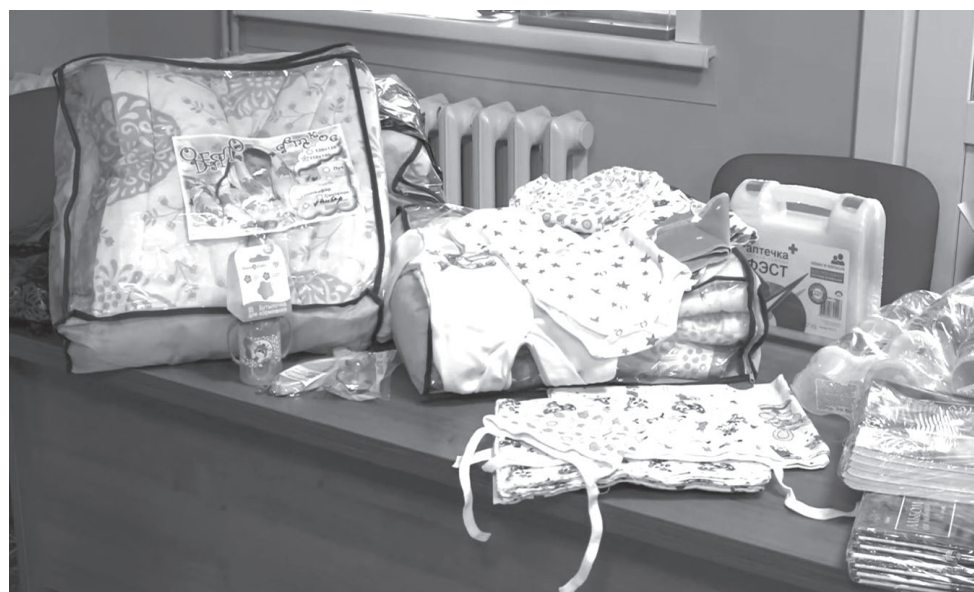
В наборах всё необходимое для мамы и малыша: аптечка первой медицинской помощи, детские одеяла, комбинезоны, ползунки, пелёнки и чепчики, средства гигиены, бутылочки для кормления и пустышки

Елена Попова, по материалам программы «9 этаж».