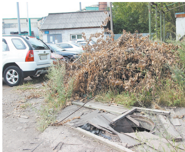
Деревянная дверь, закрывавшая люк в пер. Хорошилова, не обеспечила безопасность прохожим