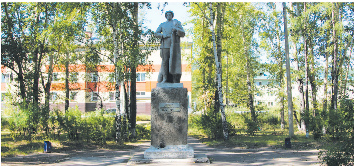
Последствия вандализма: в парке урны есть, а лавочек нет

Во время выезда корреспондентов с проверкой люков встречались люди разных возрастов, которым было любопытно, что человек делает с профессиональным фотоаппаратом рядом с их домом. Когда устькутяне узнавали, что работают корреспонденты газеты, то просили осветить и другие наблевшие вопросы.