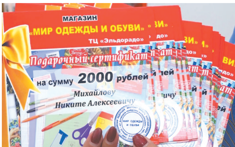
В канун нового учебного года руководство магазина «Мир одежды и обуви» подарило сертификаты воспитанникам Центра помощи детям, оставшимся без попечения родителей

Елена Попова, по материалам телепередачи «9 этаж».