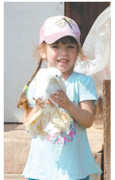
Домашние не считают это увлечение чудачеством. Сами в восторге!

В той же Зиме, в отличие от здешних мест, голубятен гораздо больше (в каждой не меньше 100-110 птиц). Много в Тулуе. Хотя наш город крупнее, голубеводство не развито. Возможно, потому, что редкие породы ценятся очень высоко. Знакомые иногда просят привезти их с выставки. Как отказать? Но, едва заслышав о стоимости, отмахиваются: «Нет-нет-нет!» На нет и суда нет. Хорошо, что остались неисправимые