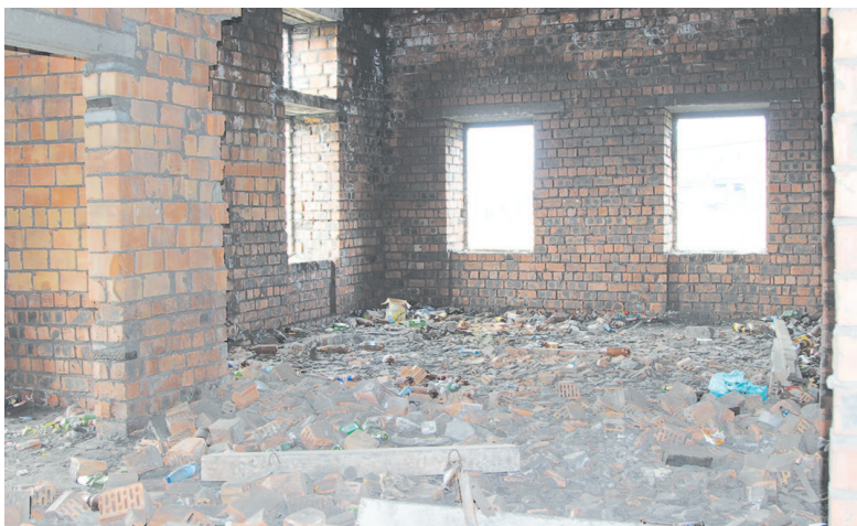
Среди кирпичей и железобетонных перемычек горы бутылок из-под спиртных напитков