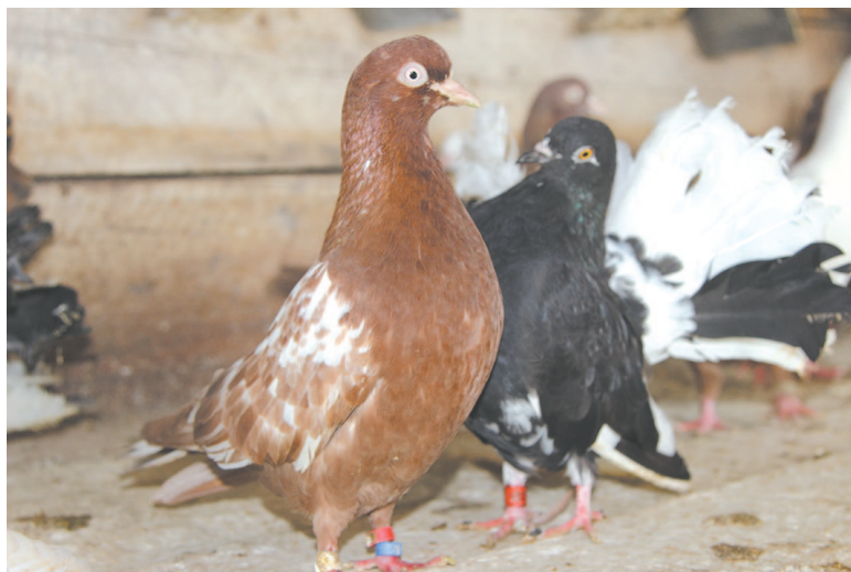
170 красавцев – поголовье внушительное: целая армия пернатых!

ка не знает, совпадут ли желания с возможностями. Приглашают в Челябинск, в Пермь – на выбор. Не получится – не беда: в следующий раз обязательно повезёт!