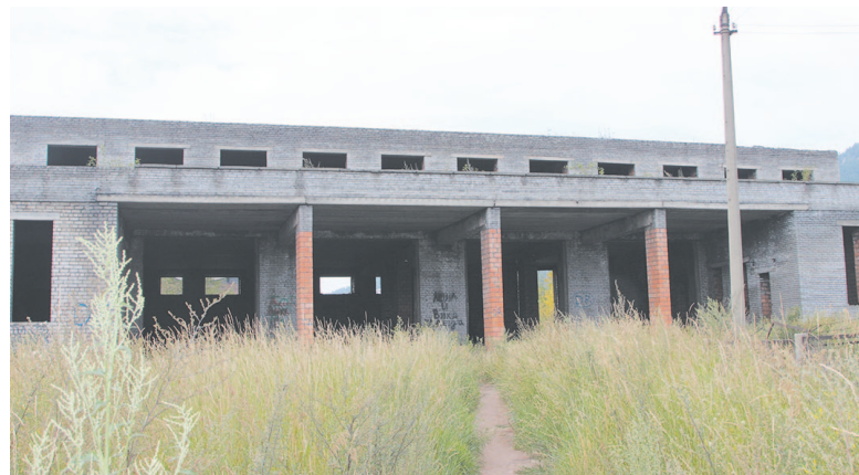
Многие жители микрорайона Техучилище проходят через это здание, чтобы попасть домой или на остановку «Портуправление»

Нахождение в состоянии опьянения несовершеннолетних в возрасте до шестнадцати лет, либо потребление (распитие) ими алкогольной и спиртосодержащей продукции, либо потребление ими наркотических средств или психотропных веществ без назначения врача, новых потенциально опасных психоактивных или одурманивающих веществ согласно ст. 20.22 КоАП РФ влечет наложение административного штрафа на родителей или иных законных представителей несовершеннолетних в размере от одной тысячи пятисот до двух тысяч рублей.