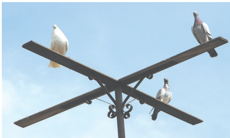
Птицы обычно кружат над домом и возвращаются