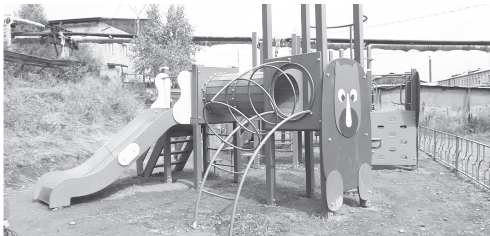
Пока детская площадка не сдана в эксплуатацию, однако дети уже резвятся на ней на свой страх и риск

Елена Попова, по материалам программы «9 этаж».