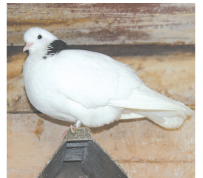
Вот он, символ мира