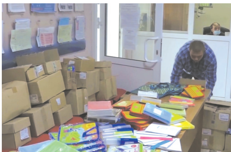
Школьные комплекты доставят в отделение помощи семье и детям, выдавать их будут с 20 августа по 1 сентября по заранее поданным заявлениям родителей

Елена Попова, по материалам программы «9 этаж».