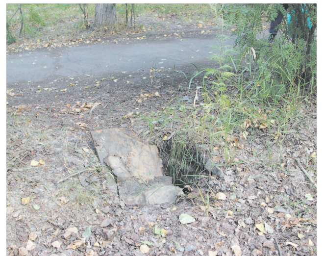
Парк Зверева. Фанера – не решение проблемы и не препятствие для детей