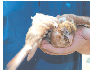
Даже молодняк окольцован