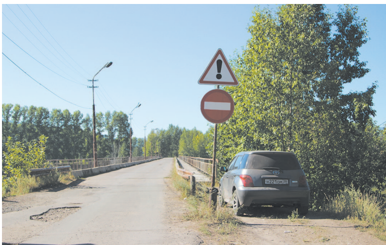
Как и обещали: знак «Въезд запрещен» установлен перед мостом через реку Куту.

Прошёл месяц с момента выезда корреспондентов в микрорайон Старый Усть-Кут по просьбам жителей города, чтобы убедиться в отсутствии ограждений и запрещающих знаков на обрушившемся мосту через реку Куту. 17 августа проверили результат работ: есть как и хорошие, так и плохие новости.