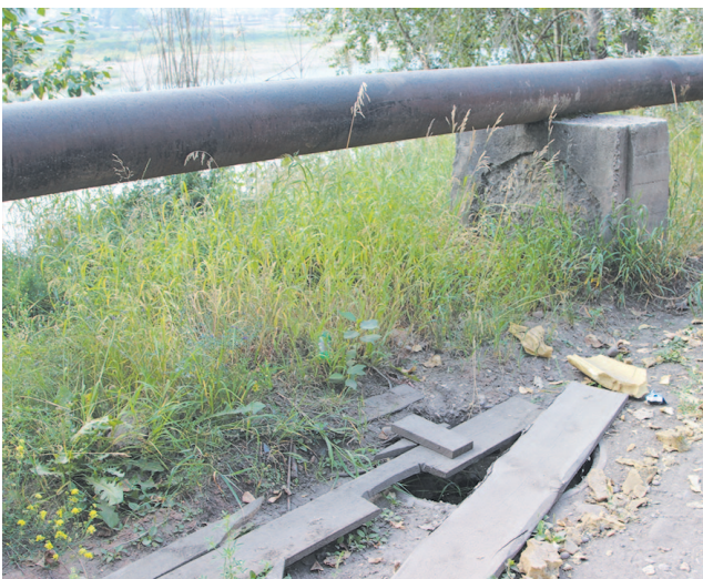
Рядом с домом № 7 на ул. Пролетарской открытый люк решили прикрыть старыми досками

Надеемся, что все работы будут выполнены до начала учебного года, когда дети пойдут в школу, и будем следить за решением этой проблемы. Опасностей у детей по дороге в учебное заведение встречается много, поэтому необходимо предотвратить то, что в силах, не жели ждать, когда кто-нибудь получит травму.