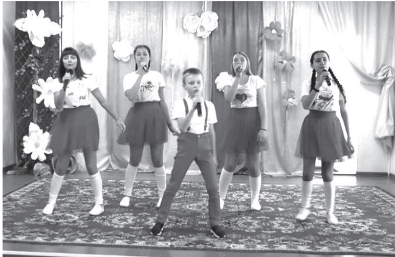
Музыкальный коллектив «Микс»

Творческому коллективу выпала честь завершить областной фестиваль, где жюри выдвинуло их на