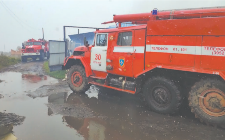
В Усть-Куте за сутки сгорели два частных жилых дома и один гараж

14 сентября в Усть-Куте произошло три крупных возгорания, сгорели два частных жилых дома и гараж.