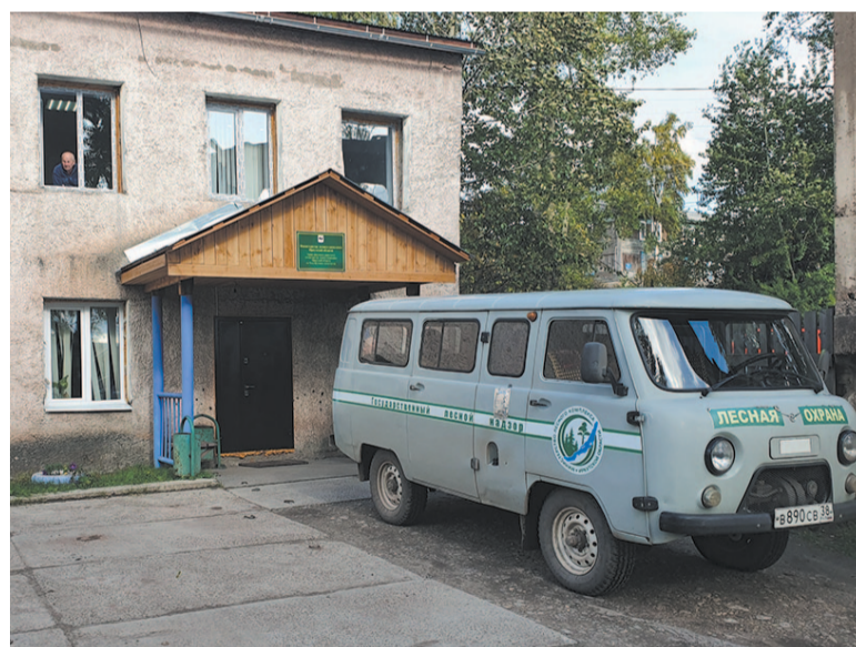
Усть-Кутское лесничество создано в 2008 году