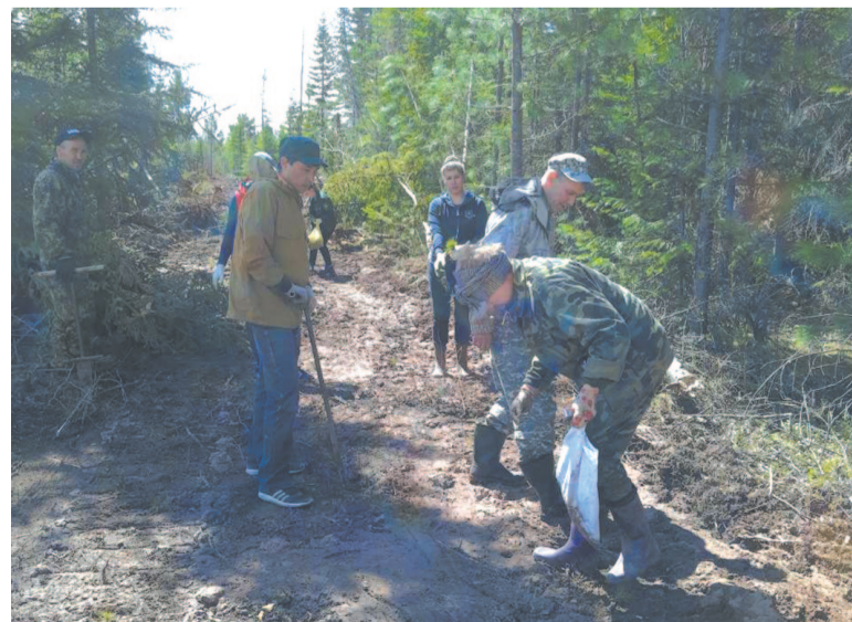
Молодые деревья высаживают на местах вырубок и гары