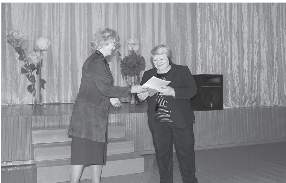
Приглашенным гостям вручили книги с автографами