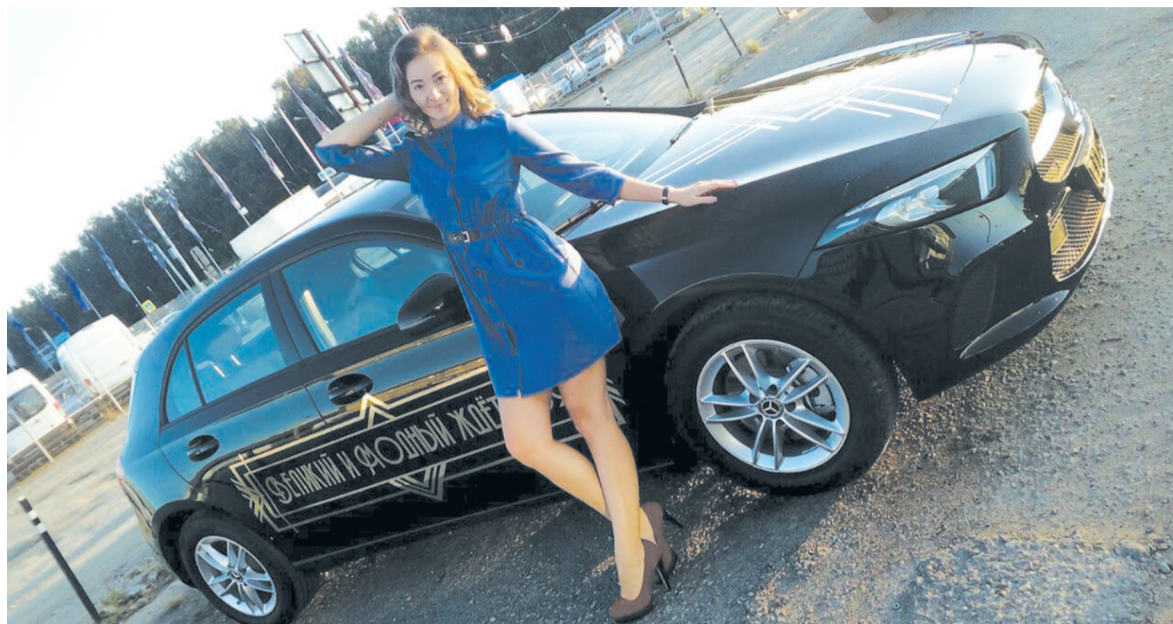
Устькютянка выиграла автомобиль на праздновании шестилетия «Модного квартала» в Иркутске

Праздничные мероприятия проходили 7 сентября. Стиль и красота смешались с безудержным весельем, развлечениями и подарками. Для гостей создали прекрасную атмосферу отдыха: взрослые делали кадры на память на фоне ярких фотозон, участвовали в конкурсах, а детей развлекали сказочные персонажи. Со сцены гостей приветствовали обворожительные ведущие, вручались подарки. Можно было