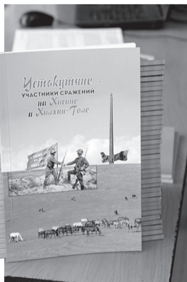
В книге описаны судьбы земляков-устькутян, участвовавших в сражениях на озере Хасан в 1938 году и на реке Халхин-гол в 1939 году