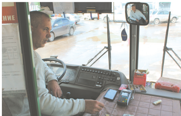
Городские власти надеются, что примеру «Автодора» последуют другие перевозчики

Электронная реальность все прочнее входит в нашу жизнь, и сегодня мы как должное воспринимаем безналичный расчет пластиковой картой в магазине. Теперь это можно будет сделать и в муниципальных пассажирских автобусах на шестом маршруте.