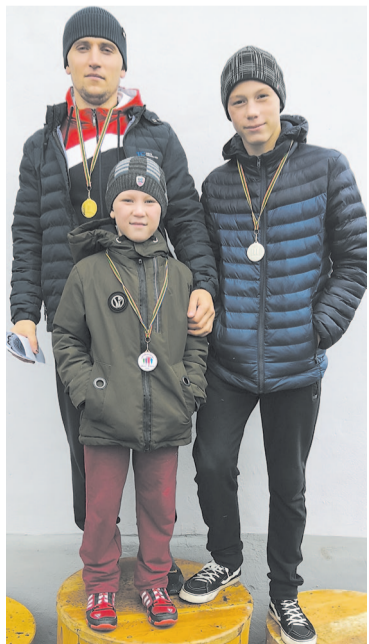
Особенно отметили семью Загарий: в кроссе приняли участие отец и два сына