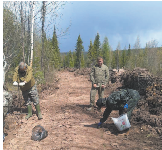
Одно из важных мероприятий – Всероссийский день посадки леса. Ежегодно в экологической акции принимают участие все сотрудники Усть-Кутского лесничества.