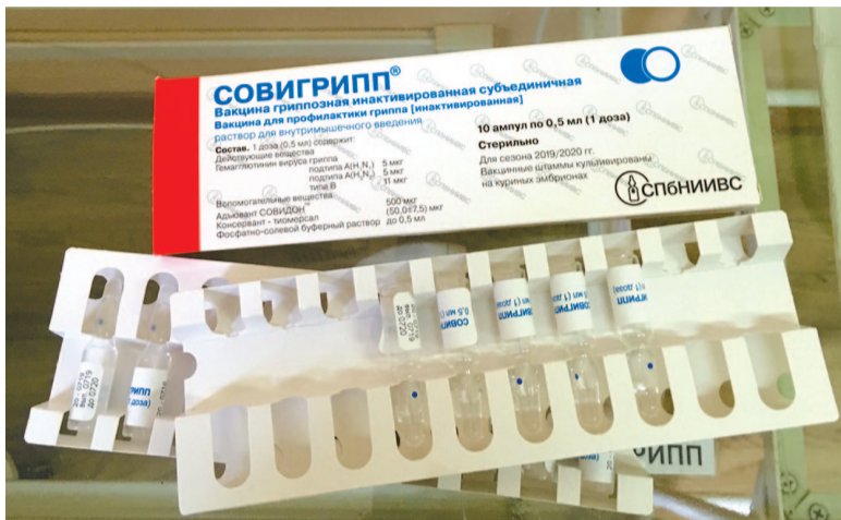
В Усть-Куте стартовала прививочная кампания

С 6 сентября в Усть-Куте началась прививочная кампания, которая продлится до 31 октября. Чтобы избежать эпидемии гриппа, планируется привить более половины населения города и района. Сотрудники Усть-Кутской районной больницы рассказали о профилактике острых респираторно-вирусных инфекций, возможных последствиях заболевания, а также напомнили, что, принимая решение об отказе от вакцинации, человек несет ответственность не только за себя, но и за окружающих.