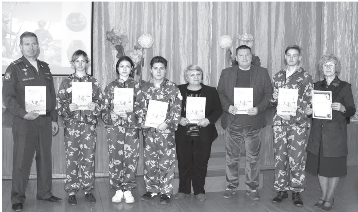
Накануне состоялась презентация книги «Устькутяне – участники сражений на Хасане и Халхин-Голе»

– Когда мы работали над материалом, с болью в душе читали: «погиб и похоронен в районе боя в братской могиле», – произнес