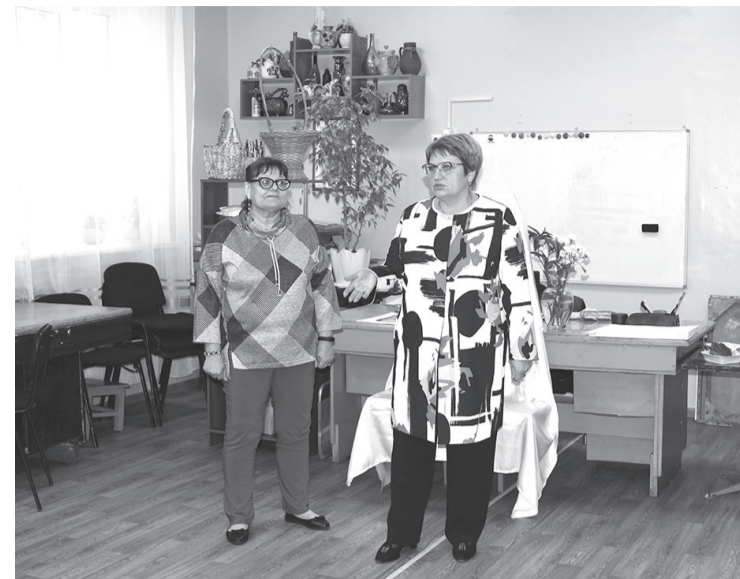
В этом году был проведен капитальный ремонт в здании художественного отделения ДШИ