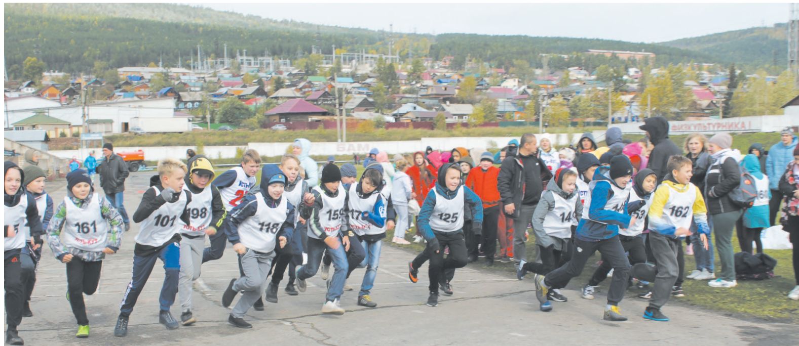
Во Всероссийский день бега традиционно проводят «Кросс нации»