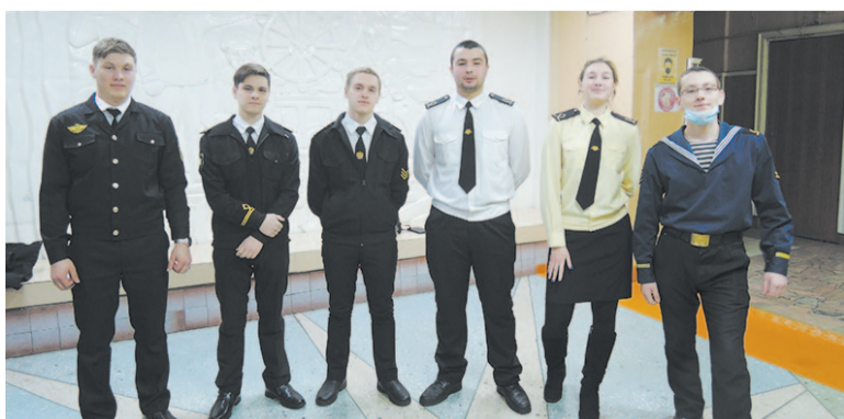
Ещё год назад эти ребята были студентами. Сейчас некоторые из них - специалисты.

В Болгарии студенты отмечают свой праздник 8 декабря, что связано с Софийским университетом им. Климента Охридского. В этот праздник все вузы страны закрыты, и студенты свободно встречаются в больших шумных компаниях.