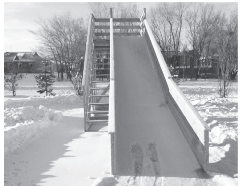
Горка выше 40 сантиметров – это захватывающий аттракцион.