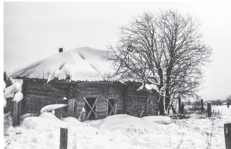
В Иркутской области станет меньше сёл.

В пояснительной записке к законопроекту также указывается, что в поселениях уже отсутствует жилая застройка, какие-либо организации или перспективные месторождения. Создавать какие-либо производства там тоже не планируют.