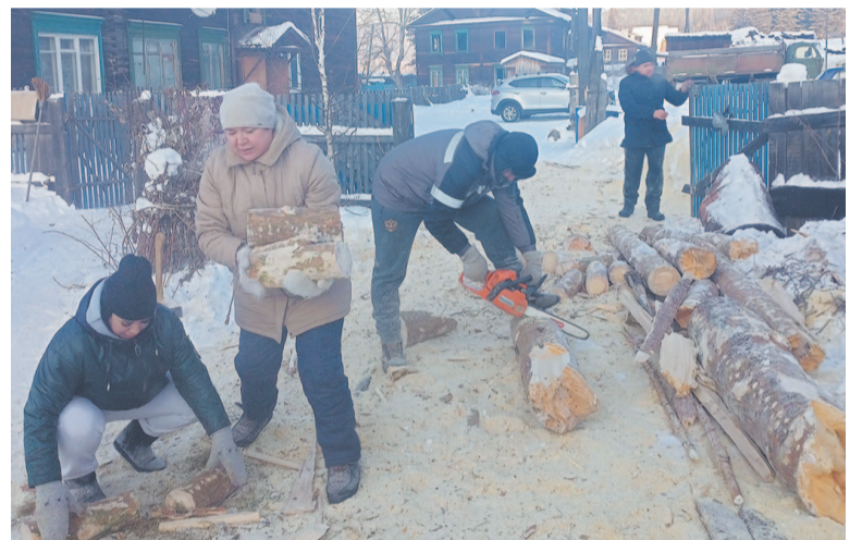
Неравнодушные устькутяне помогли распилить и расколоть пиломатериал.