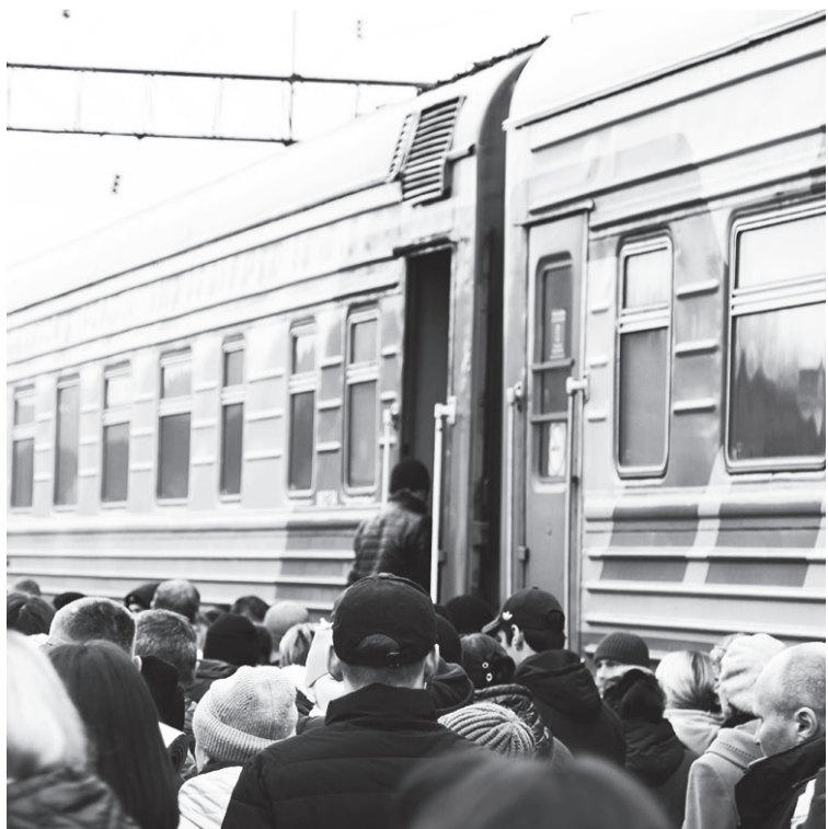
В Центре сопровождения семей мобилизованных помогут всем, независимо от места жительства.

Официальная страница в соцсетях называется «Центр поддержки 38»: «ВКонтакте» vk.com/center_podderzhki38, «Telegram» t.me/irkcentr38.