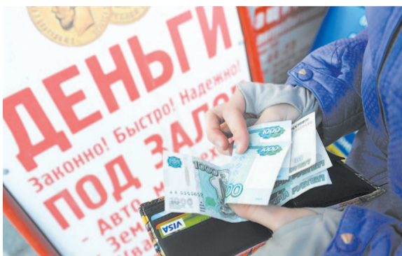
Власти постепенно ограничивают максимальную процентную ставку, которую МФО может назначить.

? Сын потерял работу и пошёл в МФО. Взял «быстрые деньги» под один процент в день и уже должен в 1,5 раза больше, чем занимал. Почему ему дали ссуду, несмотря на то что нет дохода?