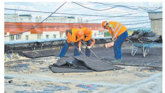
Инициаторами переноса сроков капремонта могут стать сами собственники жилья.

С заявлением надо обращаться в региональное министерство жилищной политики. При нём действует межведомственная комиссия, которая принимает решение о необходимости капремонта и его сроках. Документы можно принести в министерство, либо направить через организацию почтовой связи, а также по электронной почте: komjch@govirk.ru .