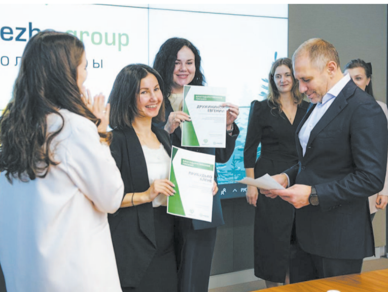
Слёт лидеров волонтерского движения «SegezhaGroup» в Москве.