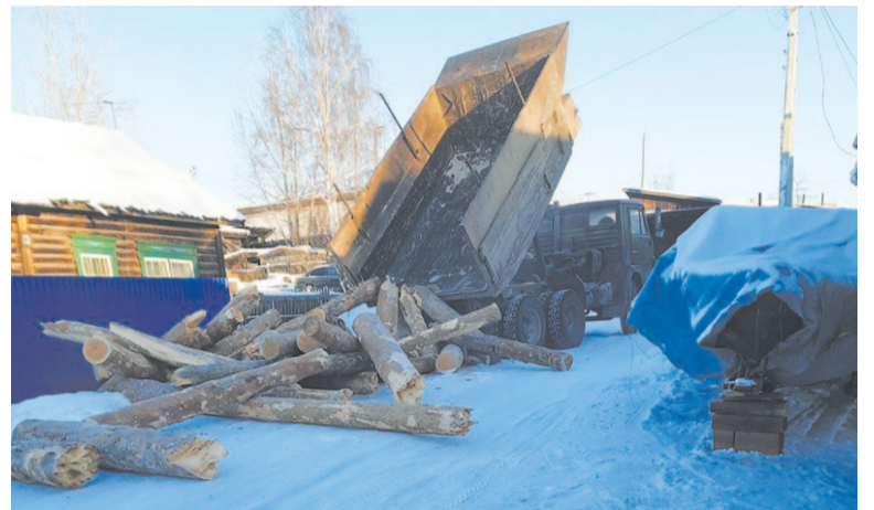
Более 70 семей, проживающих в Усть-Кутском районе, бесплатно получили топливо для печного отопления.

На суд жюри были представлены блюда по трём номинациям: горячее, холодные закуски и салаты, десерты. Оценивались не только сочетание продуктов, оригинальность рецепта, но ещё оформление и презентация. Участников конкурса мог стать как отдел, цех или отдельный сотрудник. Определить лидеров было непросто, но каждый из конкурсантов понимал, что участие важнее победы. Так дегустация превратилась в настоящее новогоднее застолье с множеством вкусностей, новогодних конкурсов, загадок и предсказаний. А открытки, сделанные детьми сотрудников, стали экспонатами выставки. Победители, призёры и участники конкурсов были отмечены грамотами и подарками.