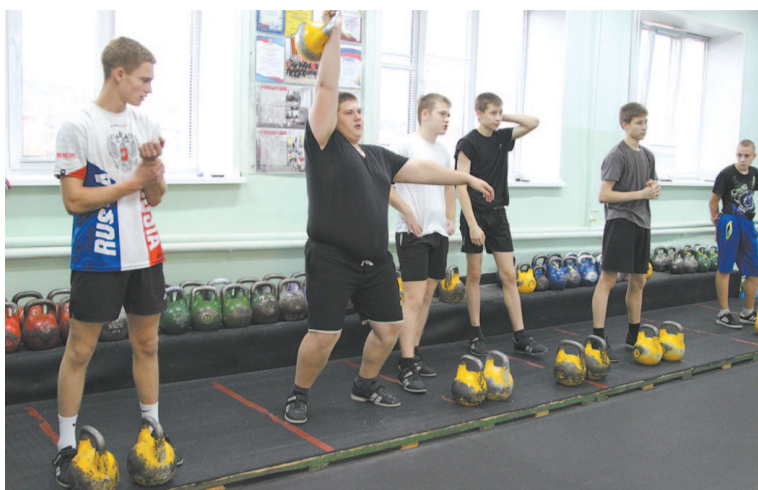
Наши гиревики стабильно показывают хорошие результаты.