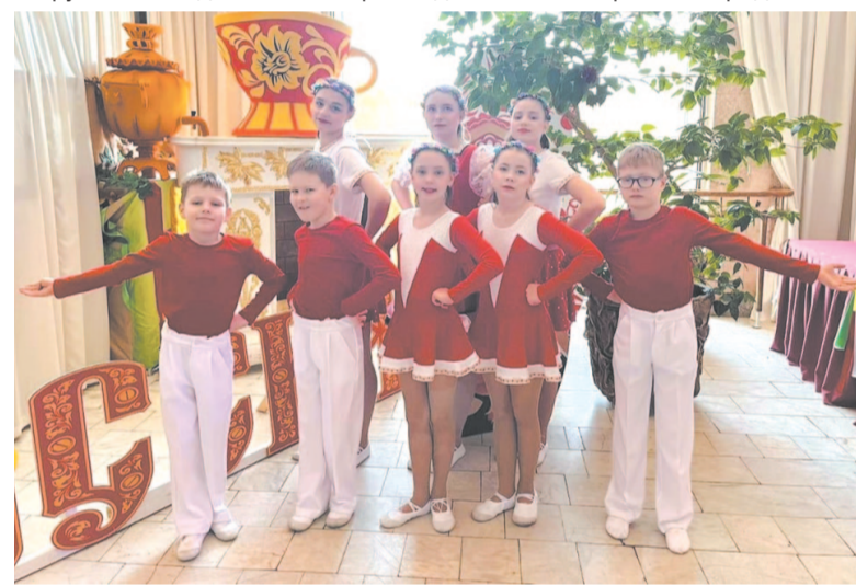
Воспитанники Центра помощи детям, оставшимся без попечения родителей.

Также отделение занимается подготовкой граждан к приему в свои семьи детей-сирот и детей, оставшихся без попечения родителей в школе приемных родителей «Аист». Эта школа существует в нашем центре с 2012 года. И за этот период обучение прошли 383 человека, из которых 356 стали приемными родителями.