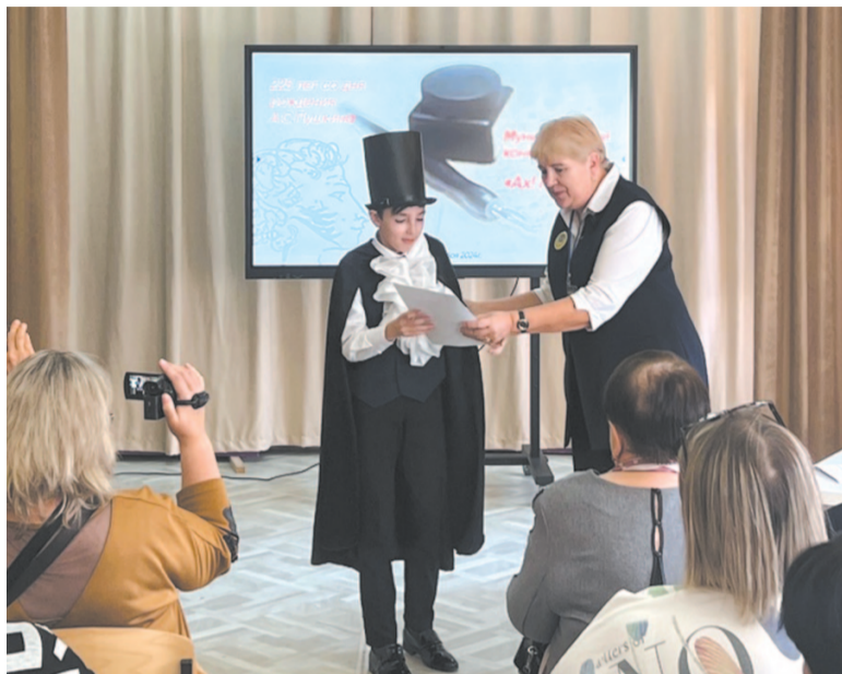
Всех победителей и призёров отметили дипломами.

11 октября в лицее прошёл муниципальный конкурс чтецов «Ах! Пушкин», посвящённый 225-летию русского поэта А. С. Пушкина.