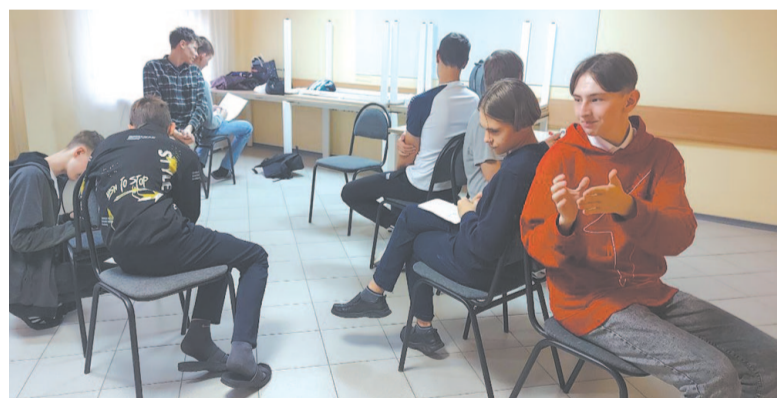
Смена в «Персее» прошла увлекательно.