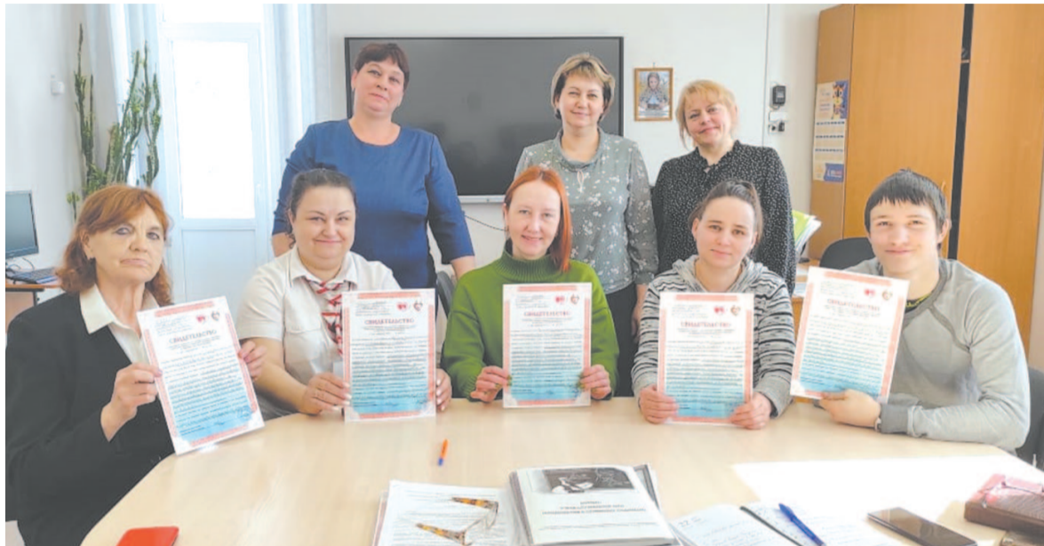
Вручение свидетельств о прохождении школы приёмных родителей.

Семьи обращаются с разными трудностями, но наши специалисты оперативно справляются с каждой конкретной проблемой, доступно объясняя каждый шаг, оставляя каждого обратившегося довольным результатом.