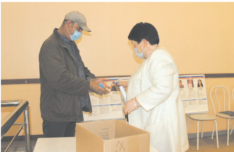
На входе измеряли температуру, дезинфицировали руки, выдавали маски и перчатки

Угрозы, разбитые стёкла и проколотые шины автомобилями останутся в истории выборов 2020 года. Всего за три дня голосования было зафиксировано восемь подвозов людей, установлено 12 правонарушений: 11 сентября –