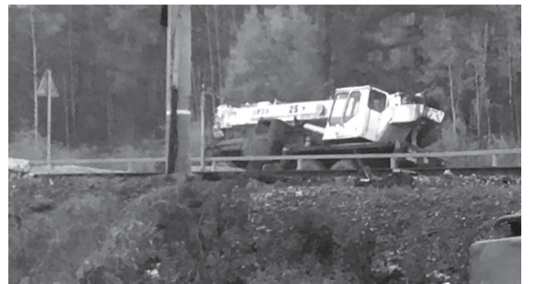
Вблизи посёлка Янталь автокран столкнулся с грузовым составом