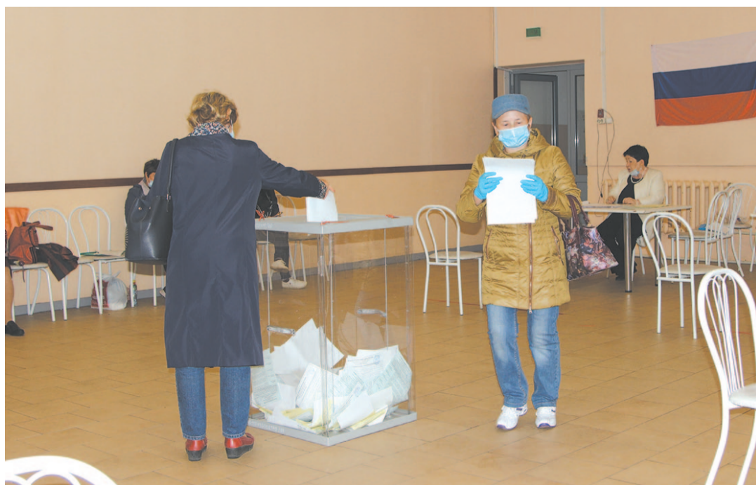
Все три дня россияне могли просматривать в режиме реального времени трансляции с камер наблюдения, установленных на участках