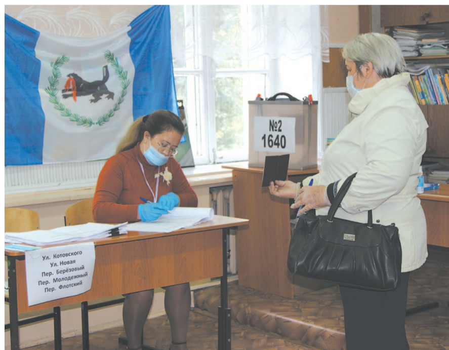
Соблюдение дистанции как одна из необходимых мер профилактики