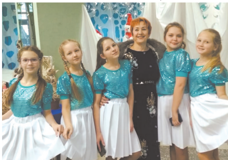
«Бесконечность» (младшая группа)