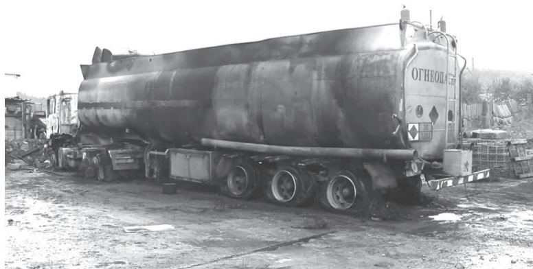
В результате пожара огонь уничтожил два большегрузных автомобиля и вагончики с запчастями