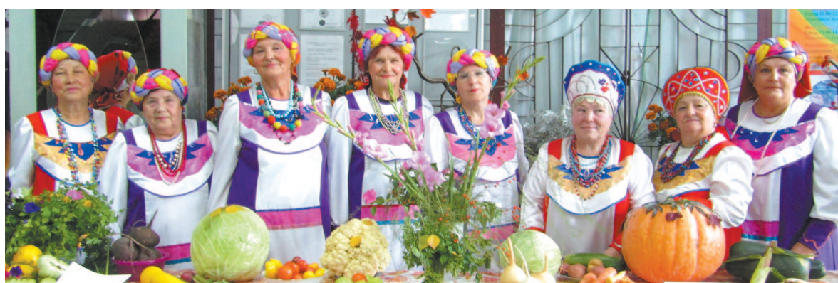
Народная фольклорная группа «Забавушка»