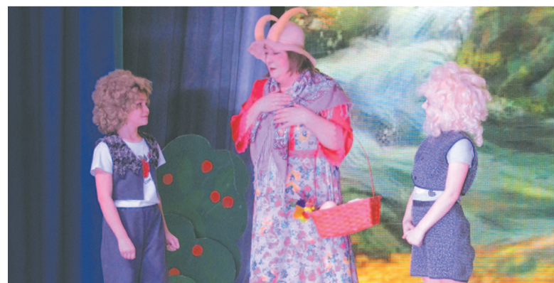
Театральная студия «Принцесса»