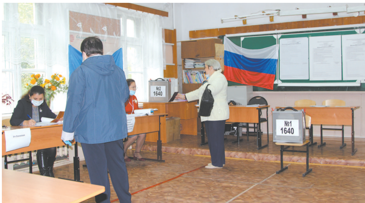
Граждане приходили в хорошем настроении и были доброжелательны