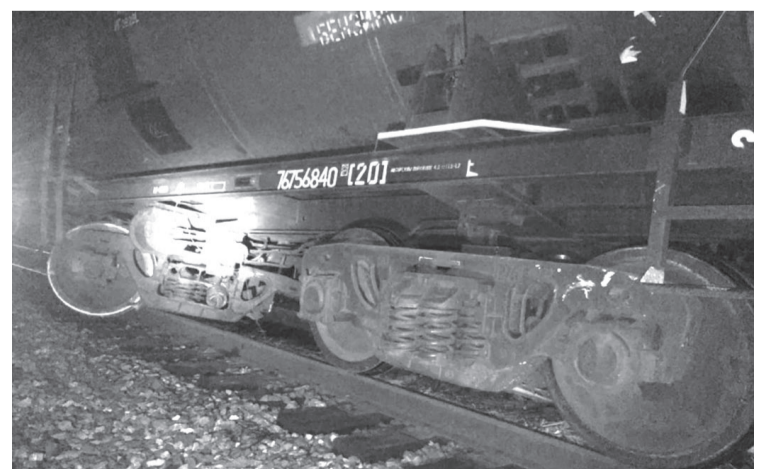
Жертв чудом удалось избежать, водитель автокрана и машинисты поезда не пострадали