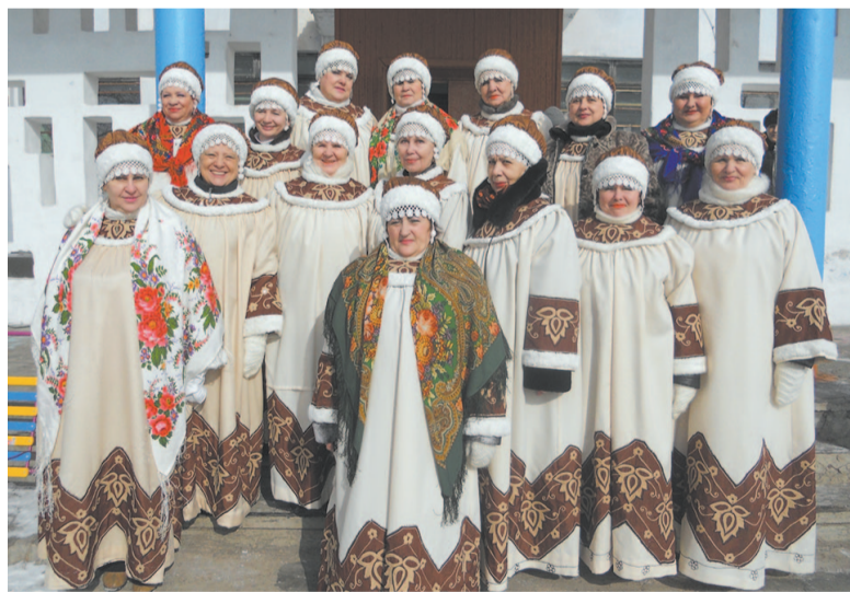
Народный хор «Россияночка»