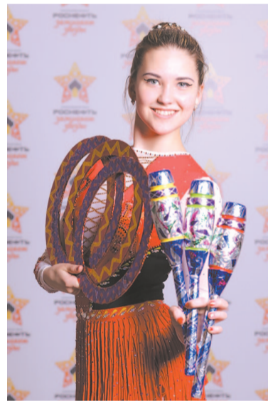
Цирк, цирк, цирк!