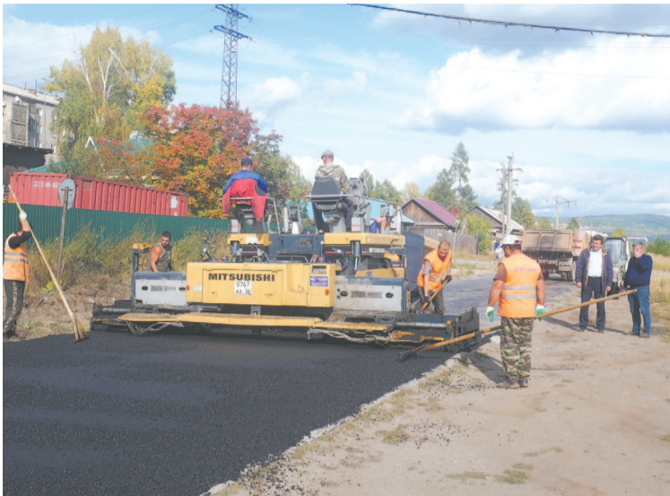
ООО «Лидер» завершил контракт по асфальтированию участка дороги на улице Горького