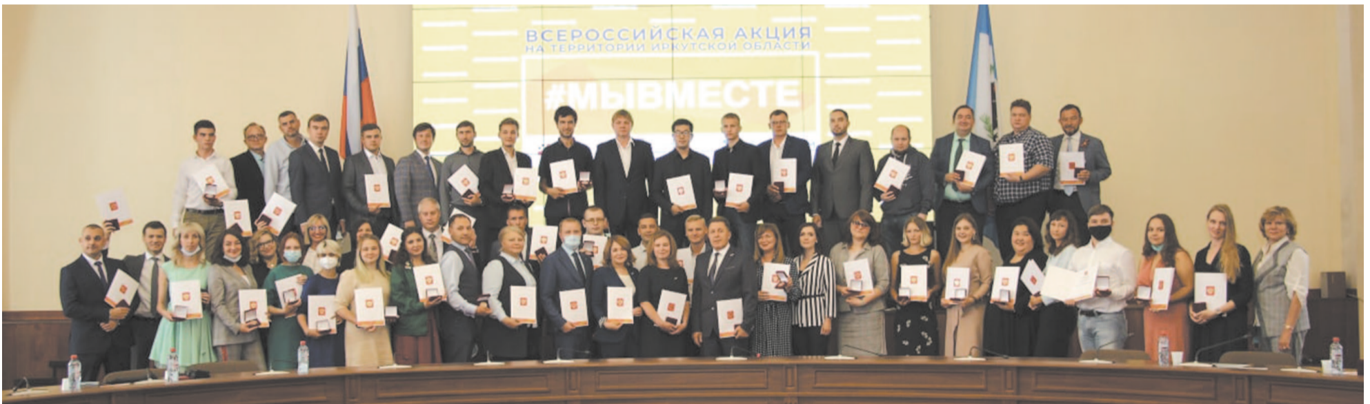
Медалью от имени Президента РФ гражданам и организациям, которые активно участвовали в проведении акции «Мы вместе», помощи врачам, пожилым и маломобильным людям, в общей сложности были награждены 60 волонтеров