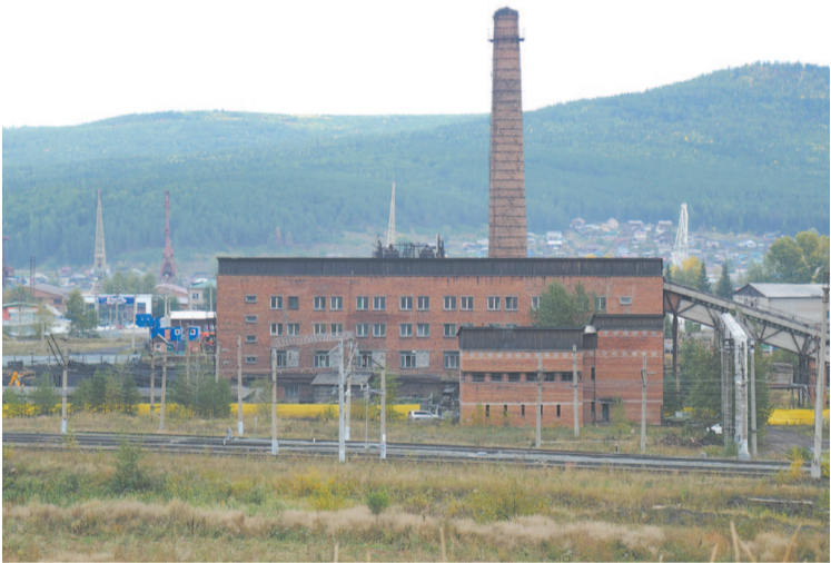
На 15 сентября в работе восемь муниципальных котельных

Во второй раз победителем аукциона стало ООО «Лидер», с которым был заключён контракт на сумму 6 973 022,6 рубля. Срок окончания контракта намечался на конец сентября 2020 года. Работы были выполнены досрочно, и 9 сентября специалисты городской администрации и «Службы заказчика по ЖКХ» выехали на улицу Горького, чтобы на месте проверить качество и объём выполненных работ. Контрактом предусмотрен гарантийный срок, и все выявленные в процессе эксплуатации дороги изъяны подрядчик будет обязан устранить за счёт собственных средств в течение четырёх лет.