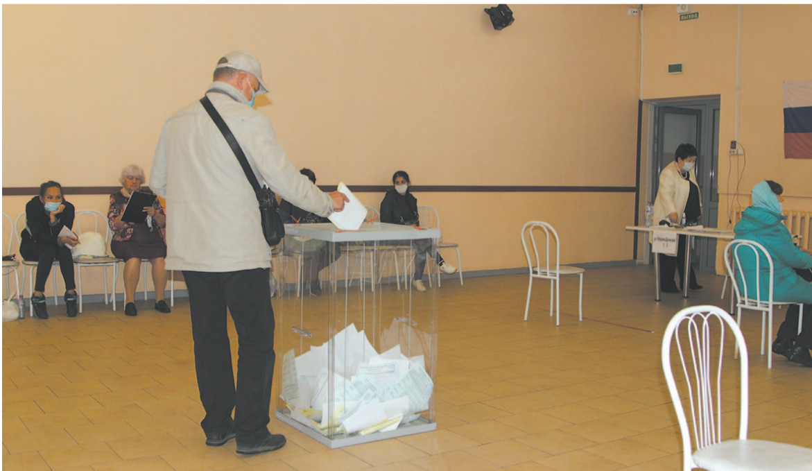
С 11 по 13 сентября граждане могли выбрать губернатора Иркутской области, мэра и депутатов думы Усть-Кутского района