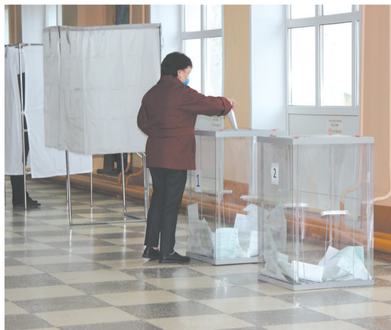
Явка избирателей на участке № 1646 была достаточно высокой по сравнению с общероссийским голосованием по поправкам в конституцию

пять, 12 – три, 13 – четыре. По мнению членов избирательной комиссии, такого безобразия никогда не было.