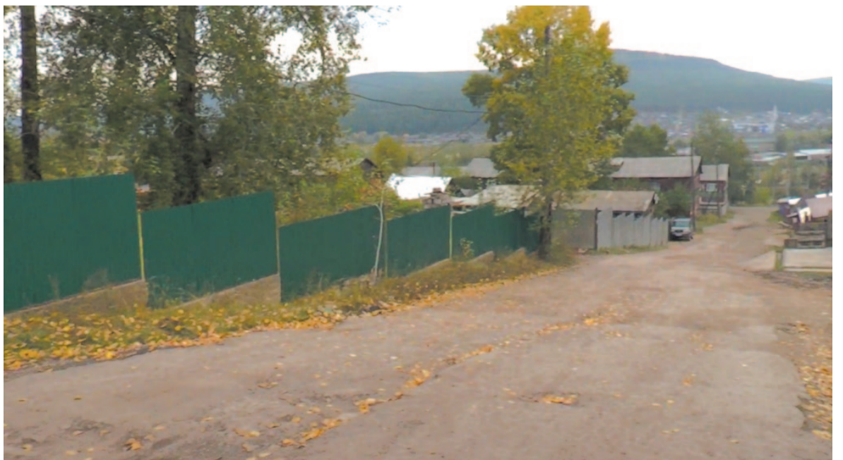
По словам жителей, ремонт данной дороги проводился около 30 лет назад