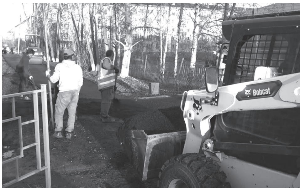
Укладка асфальта возле МОУ СОШ № 4.