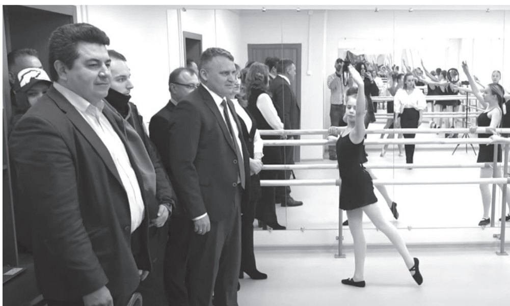
Открытие ДШИ после ремонта.

Подготовила Арина Михайлова