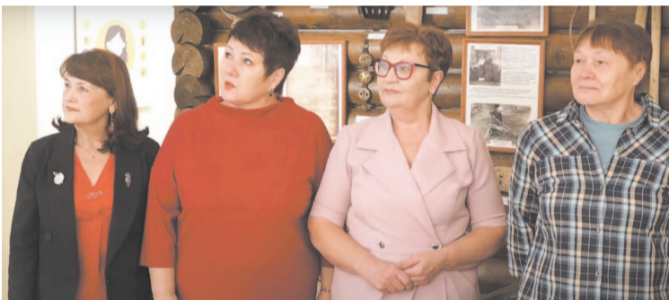
Члены НЛТО «Даван» обсудили выставку «Я нарисую твой портрет, Сибирь».