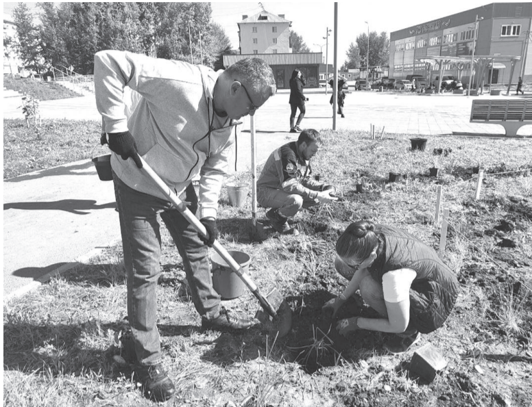
Посадка цветов возле ДК «Речники».