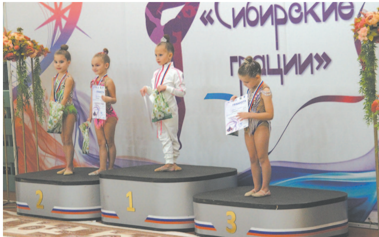
Одну ступеньку пьедестала могут разделить несколько спортсменов.

Любые соревнования – это, в первую очередь, волнение и стресс, справиться с нахлынувшими эмоциями всегда помогут тренер и, конечно, болельщики. Хотя сами спортсменки считают по-разному: одни говорят, что волнуются только до