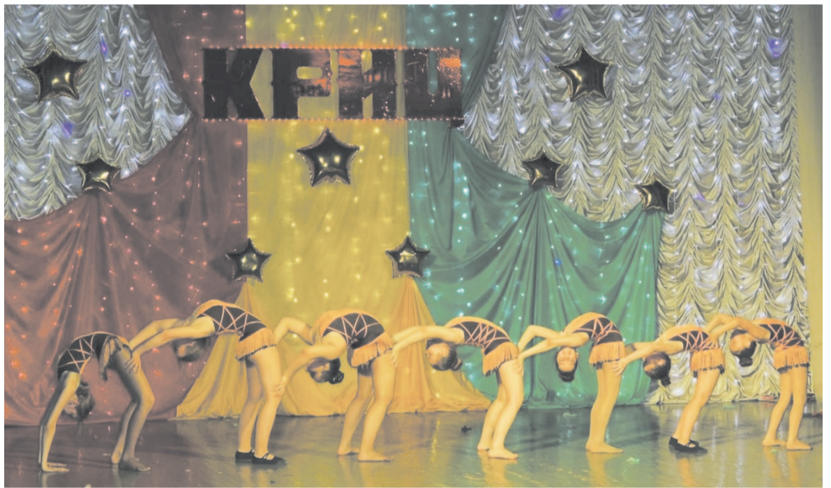
Акробаты – одно из направлений работы циркачей.