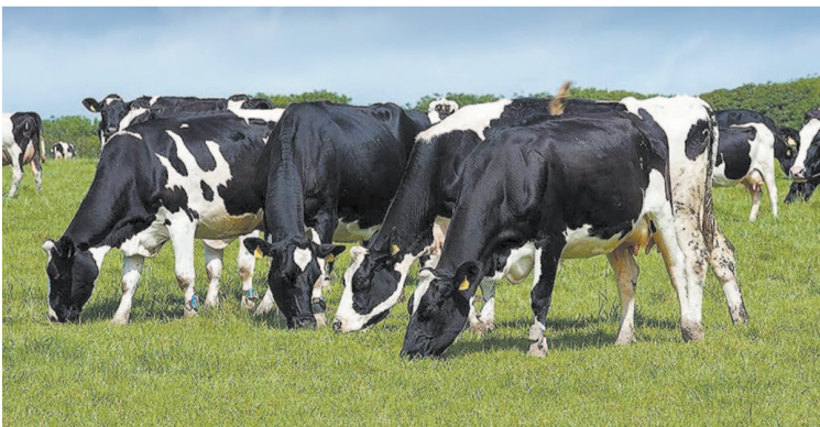
Сельхозтоваропроизводители Усть-Кутского района выращивают зерновые, содержат крупный рогатый скот и занимаются другими видами сельхозпроизводства.