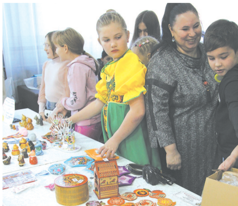
Перед началом концерта гости приняли участие в ярмарке.

Для тех, кто собрался в зале, пели песни, показывали танцы, а зрители сопровождали выступления бурными овациями. По завершении концерта удалось собрать около 49000 рублей и две большие коробки корма для собак и кошек. По традиции сумму разделили пополам между приютами «Кошкин дом» и «Верный друг».