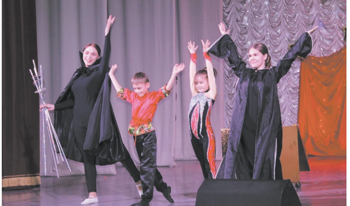
Старшие воспитанники студии «Криц» помогают младшим готовиться к выступлению.