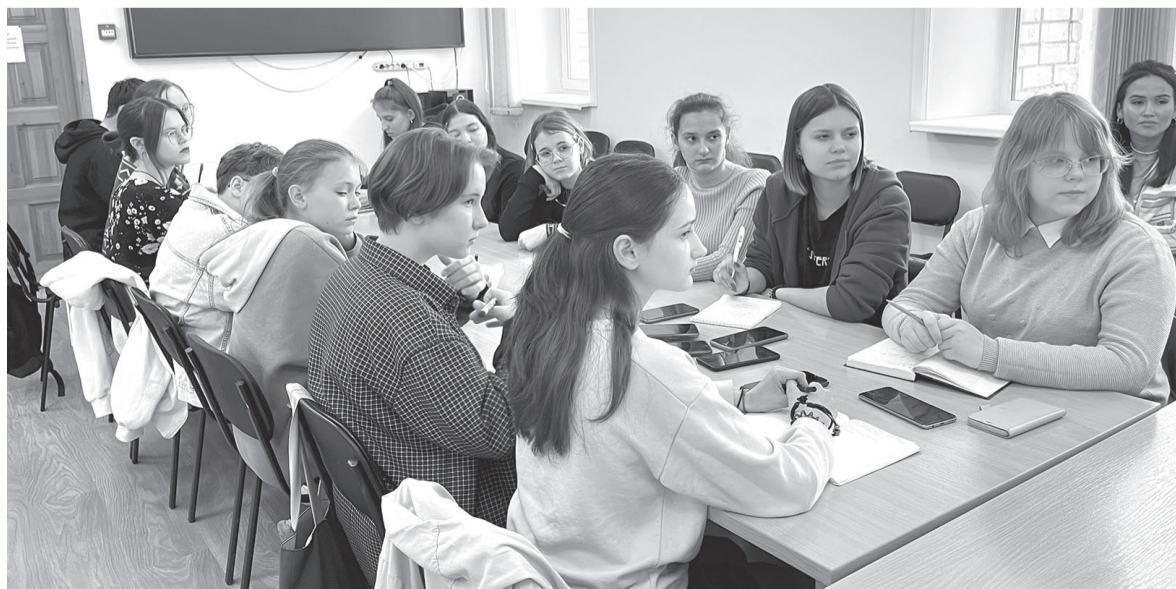
Школьники подготовили острые, актуальные вопросы, волнующие каждого жителя нашего района.

Всегда любил спорт, но сейчас рабочий график настолько плотный и насыщенный, что времени на занятия не хватает.