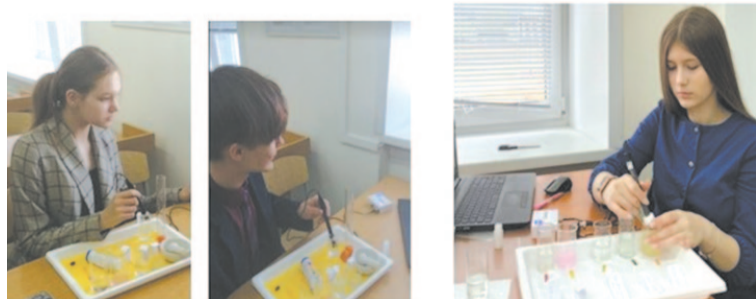
Межрегиональные интеллектуальные мероприятия «Неделя естественных наук» для обучающихся 8-х классов Центров «Точка роста»