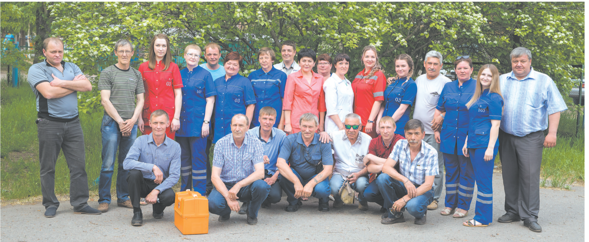
Коллектив станции скорой медицинской помощи.