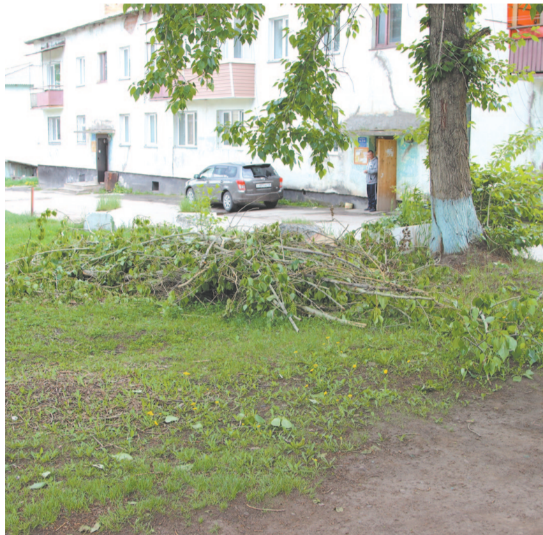
Спиленные ветки не всегда убирают вовремя.