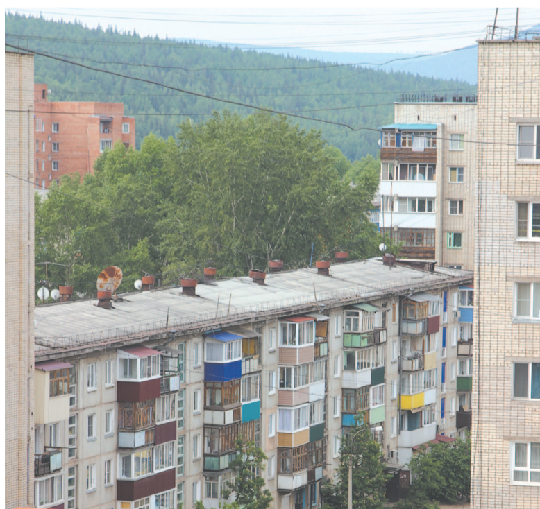
Тополя иногда вырастают выше пятиэтажных домов.

Многих горожан волнует, как обстоят дела с зелёными насаждениями в Усть-Куте. Можно ли взять и без проблем срубить дерево во дворе? Так ли просто посадить другое? Разберёмся в этих вопросах.