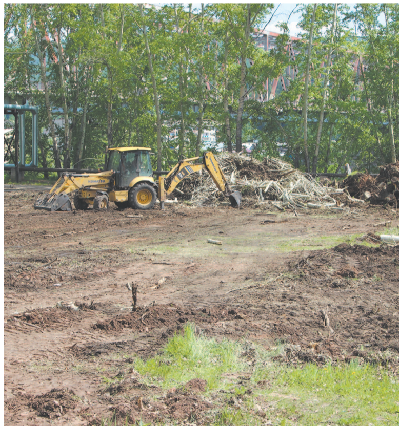
Работы в парке Зверева ведутся, благоустройство продолжается.