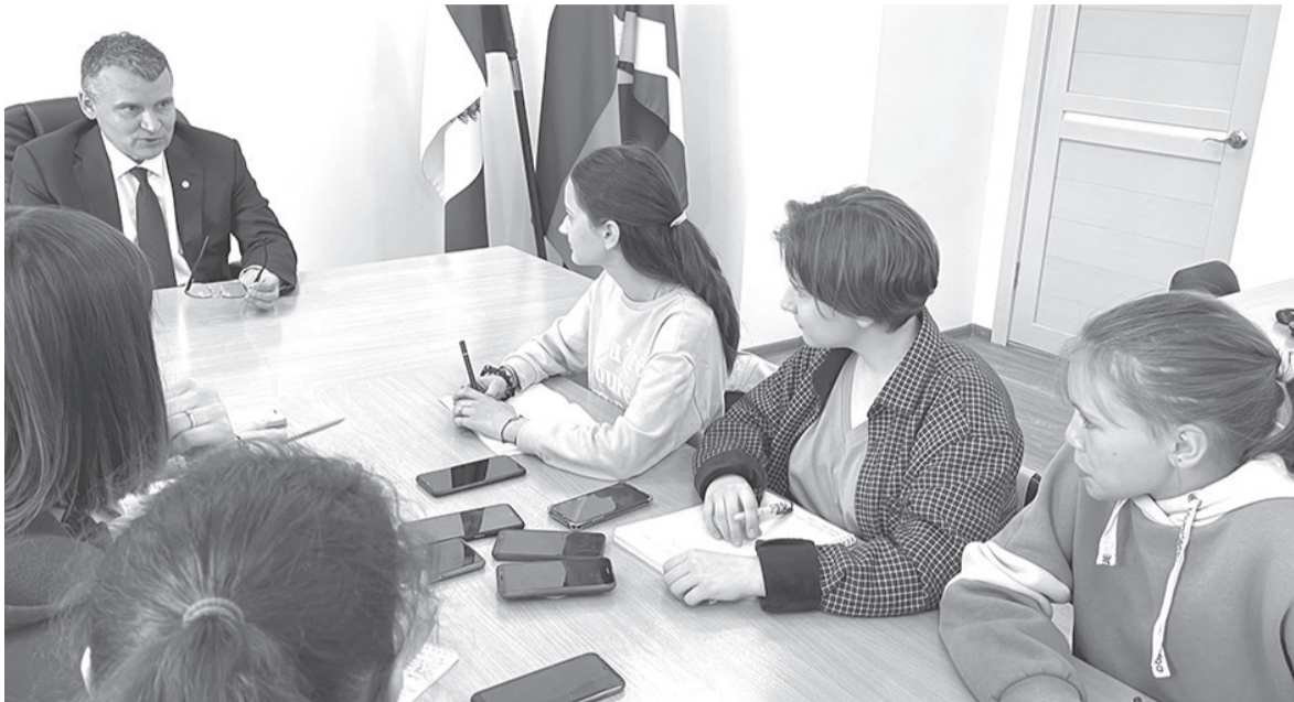
Пожалуй, это была самая необычная пресс-конференция в практике мэра.

Как Вы считаете, с какой периодичностью нужно прово-