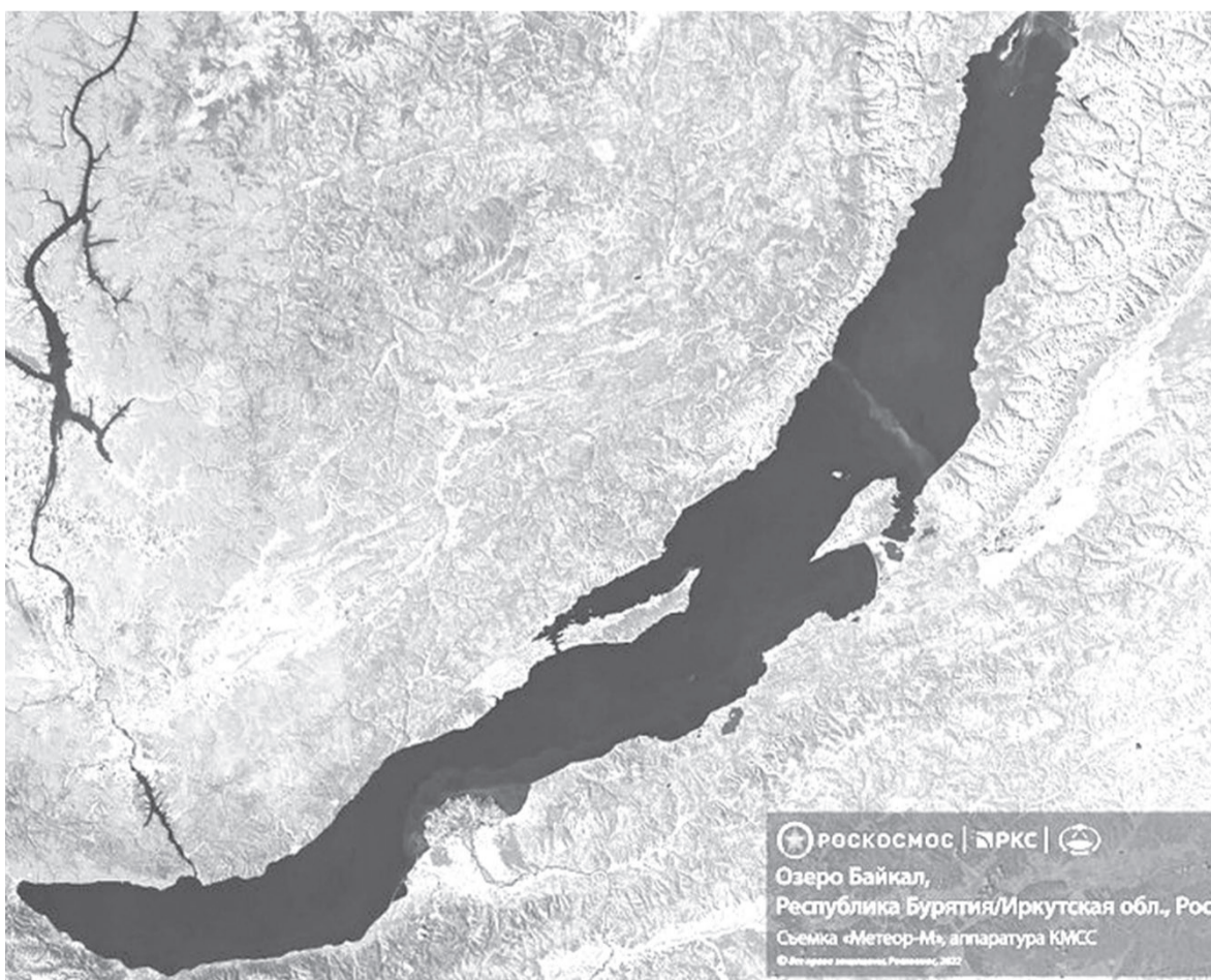
РОСКОСМОС | РКК | Озеро Байкал, Республика Бурятия/Иркутская обл., Россия Съемка «Метеор-М», аппаратура КМСС