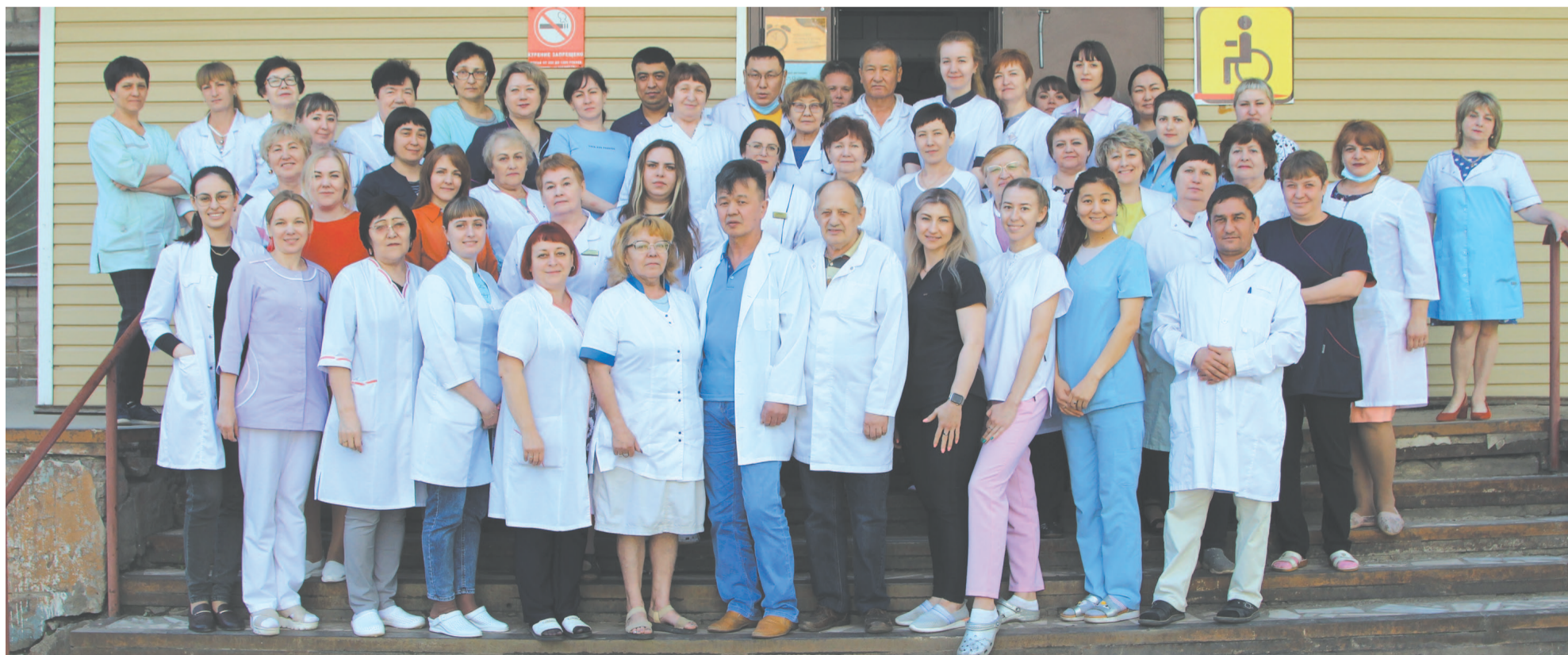
Специалистов поликлиники ЦРБ знают многие.