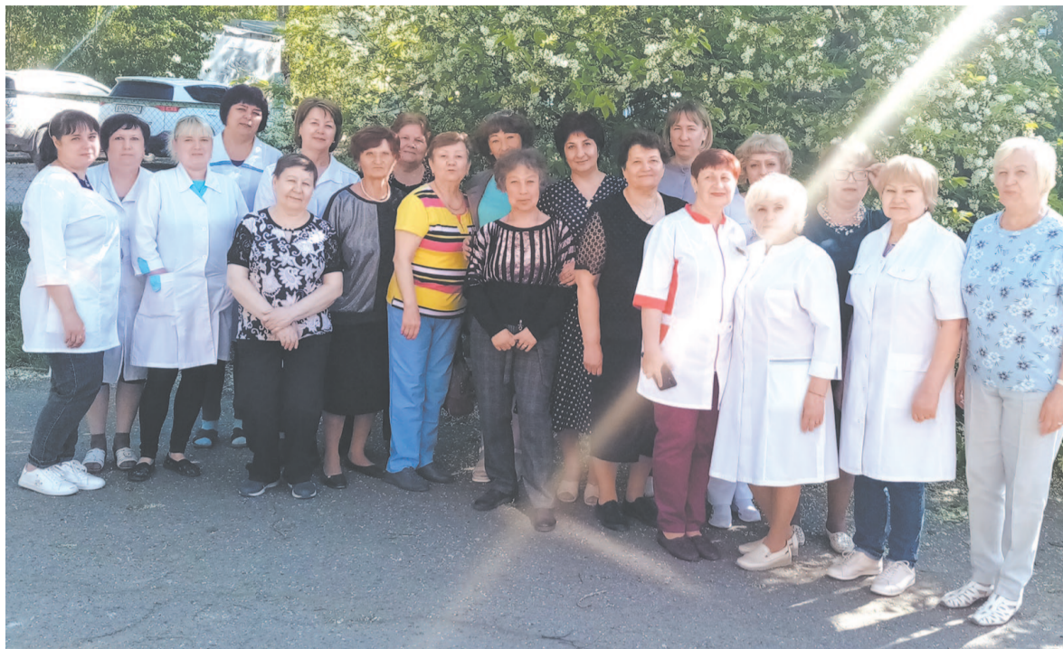
Лечить детей – их призвание.

Стало легче с материальной базой. В подразделениях больницы пусть понемногу, но появляется новое оборудование. Но работать на нём бывает некому. Нехватка