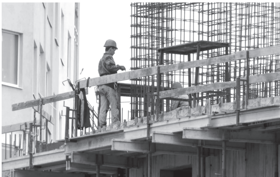
Современные многоэтажки проектируют и строят с расчётом на землетрясение в восемь баллов.