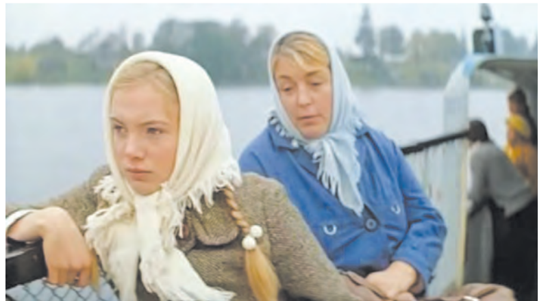
Кадр из фильма «Цыганское счастье», 1981 г.