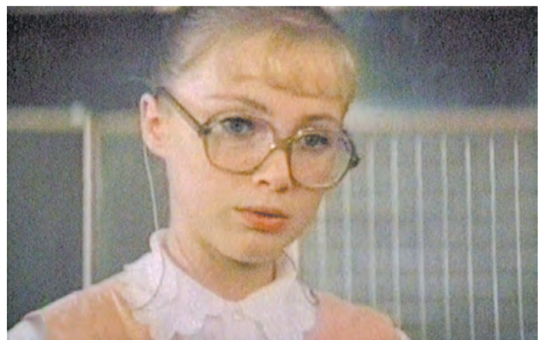
Кадр из фильма «Утро без отметок», 1983 г.