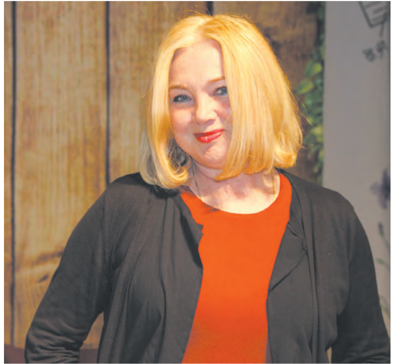
В рамках международного кинофестиваля «Сердце «Байкала» в нашем городе побывала популярная и любимая многими актриса М.А. Яковлева.