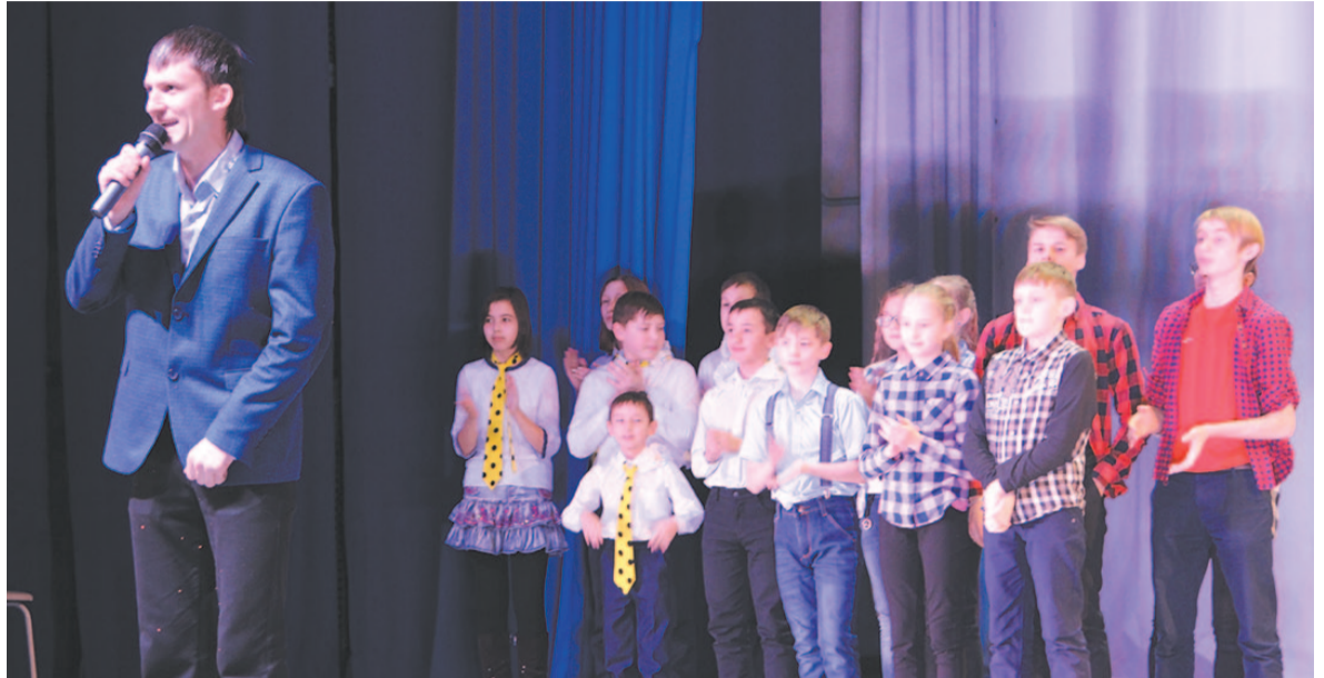
Открытие одной четвертой финала II сезона Лиги «Лена-БАМ».

Подготовила Марина Новикова.