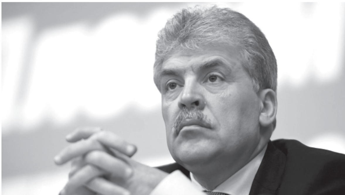
П.Н. Грудинин, предприниматель и политический деятель.

В социалистическом «раю» Грудинина выброшенными на улицу оказались ещё 9 семей, в том числе одна с грудным ребёнком.