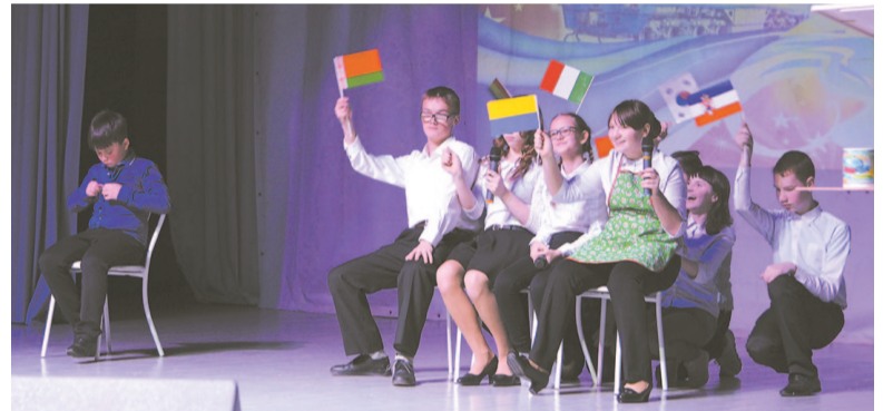
Команда «РЖД» (ЦДО).