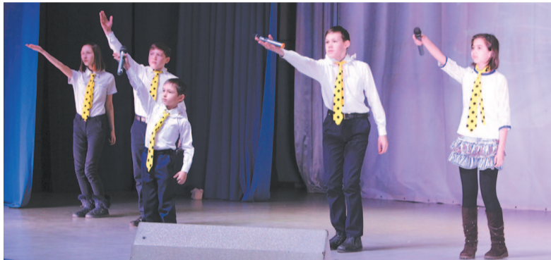
Команда «Принесённые аистом» (МОУ СОШ № 5).