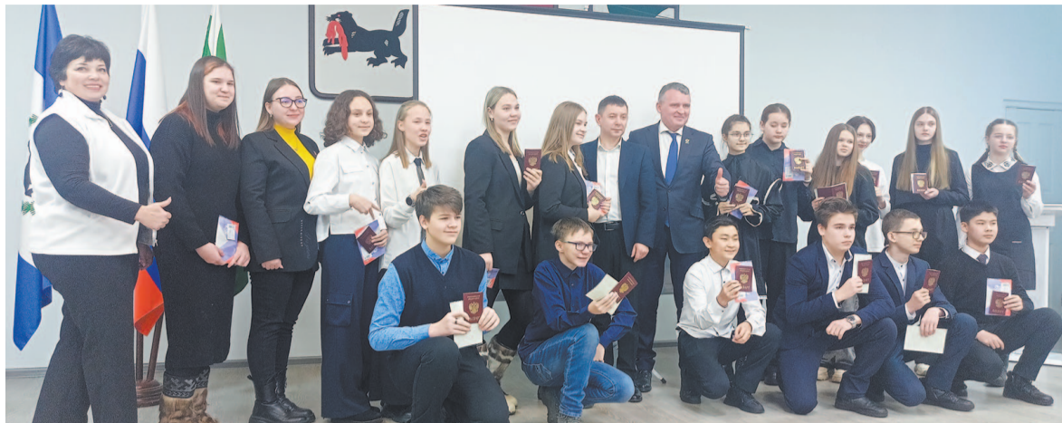
Школьники получили паспорта в торжественной обстановке.

вручение паспортов станет систематическим. Принять в нём участие смогут все ребята, которые получат паспорт впервые. Подать заявку можно на сайте проекта.