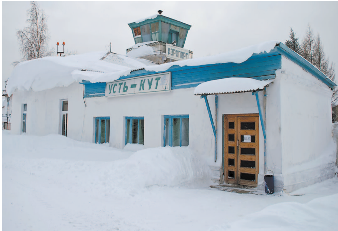
Аэропорт «Усть-Кут» ожидает реконструкции.

Согласно достигнутым договоренностям в течение трех лет «Авиакомпания «ЮТэйр» выделит на ремонт аэропорта Усть-Кут 100 млн рублей. Его пассажиропоток ежегодно растет. В 2023 году, по прогнозу, составит более 100 тысяч пассажиров. Это на 25 процентов больше, чем в 2022 году. В настоящее время из аэропорта Усть-Кут в среднем в день совершается четыре рейса. Между тем зал ожидания аэропорта рассчитан на комфортное пребывание