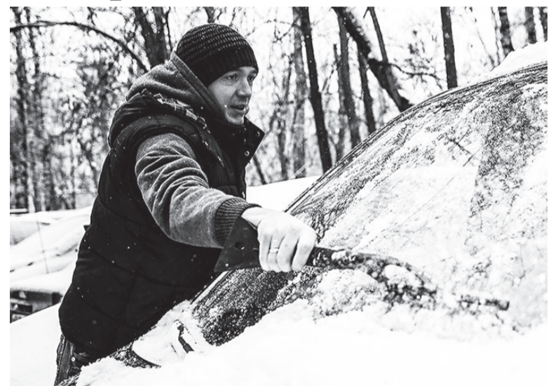
Водитель — самая востребованная профессия в Приангарье.

Также в топ-15 специалистов, которых чаще других ищут в области, вошли машинисты (4,1 процента), повара (2,4 процента), электро-монтажники (2,3 процента), врачи и разнорабочие (по 2,1 процента), бухгалтеры (2 процента), операто-