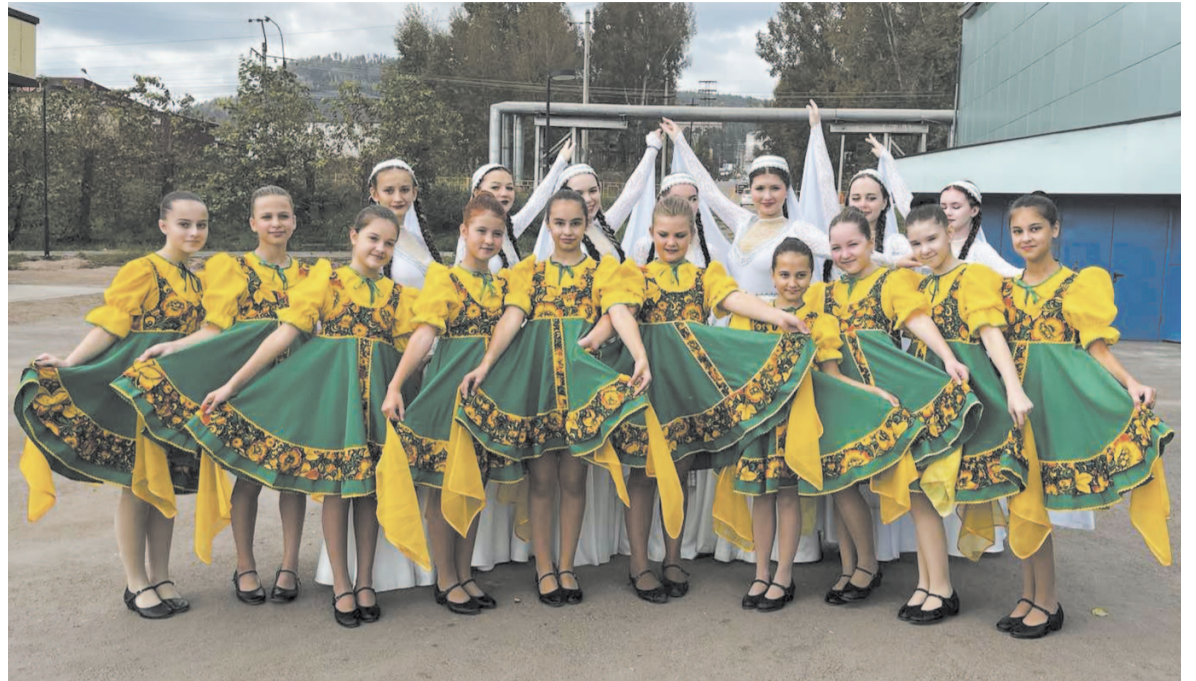
Образцовый хореографический коллектив «Импульс».