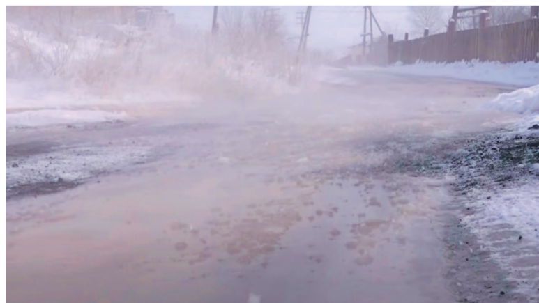
Несмотря на мороз, жидкость не успевает замерзнуть.

Единственный видимый результат – дорожку присыпали шлаком. В последние дни в Усть-Куте установилась морозная погода, поэтому запах сейчас не чувствуется, но