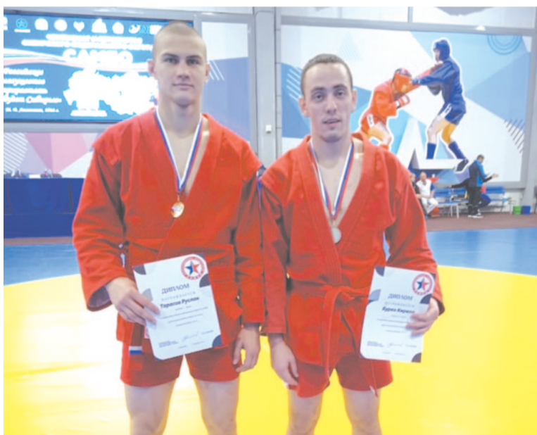
Наши юные земляки неизменно поднимаются на пьедестал почёта.