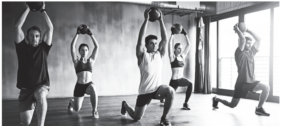
Налоговый вычет для спортсменов увеличат.