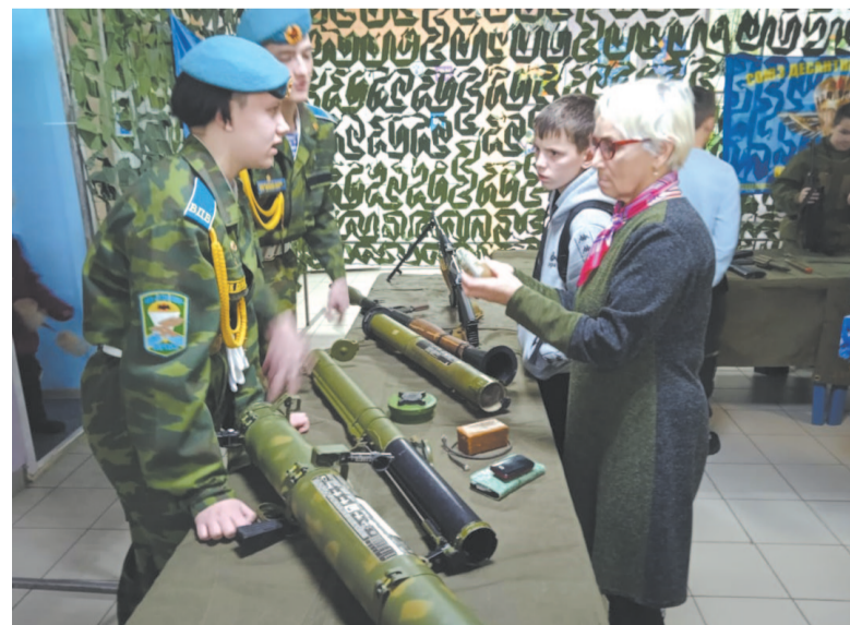
Выставка оружия в Киренске.