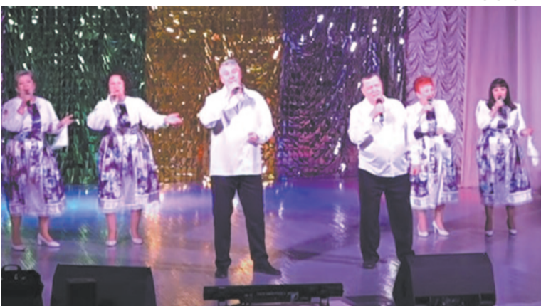
Почти все коллективы участвовали в концерте.