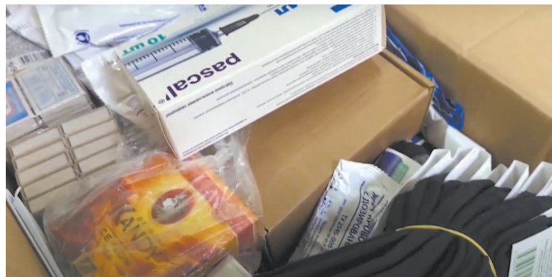
Помощь нужна самая разная.