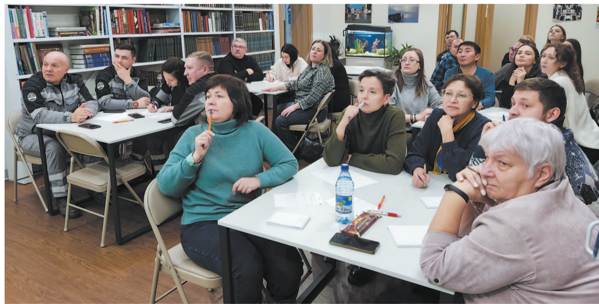
Экоквиз объединяет людей разных профессий.

Но вот все согрелись и настроились на игру. Уже первый вопрос квиза вызвал самые горячие обсуждения. Да и неудивительно, ведь споры ученых о том, что длиннее – Амазонка или Нил – продолжают по сей день. Вот и организаторы квиза «Зеленая логика» в итоге решили, что оба ответа верные. И это было только начало бескомпромиссной увлекательной интеллектуальной борьбы за звание побе-