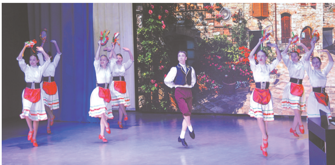
На сцене – коллектив «Спектр».