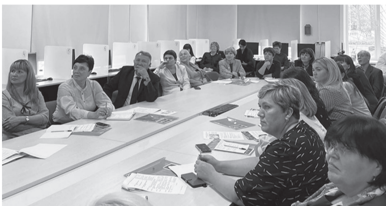
«Шаг в будущее»

Пятого октября старшеклассники провели День самоуправления, посвященный Дню учителя. Обо всем этом подробнее читайте в нашей газете. Ответственная за выпуск Н.Н. Локтева