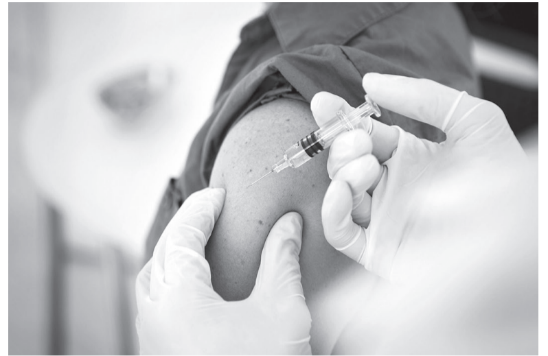
Заболеть гриппом от вакцины невозможно

Этот факт подтверждает необходимость проведения вакцинации против гриппа ежегодно. Во-первых, штаммы вирусов меняются очень быстро. Во-вторых, иммунный ответ организма на вакцинацию ослабевает с течением