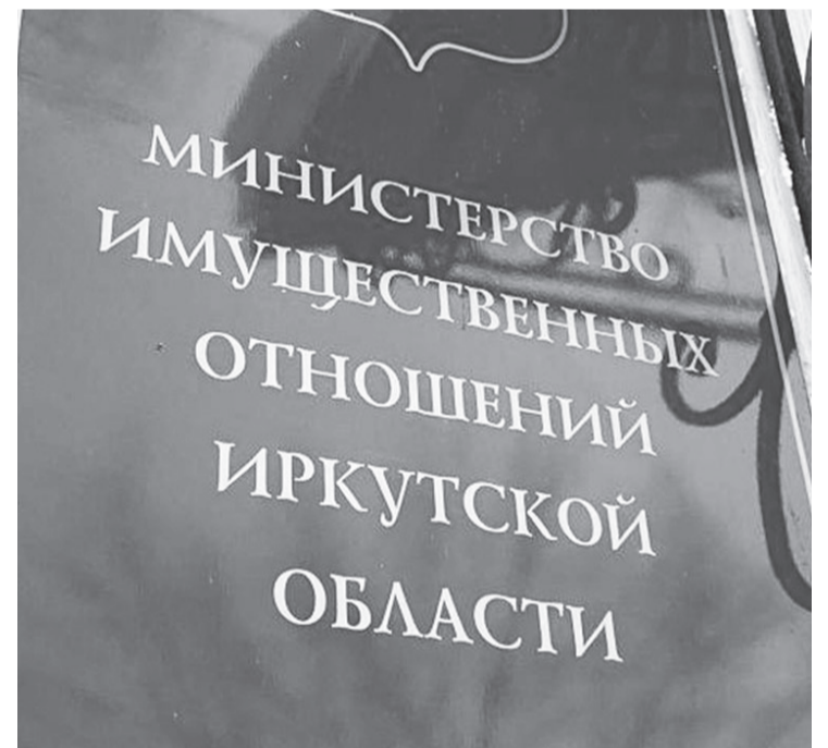
Оценка объектов капитального строительства состоится в 2023 году

Консультацию можно получить по телефону 8(3955)586-900, а также в ОГБУ «Центр государственной кадастровой оценки недвижимости» по адресу: Иркутская область, г. Ангарск, проспект К. Маркса, стр. 101.