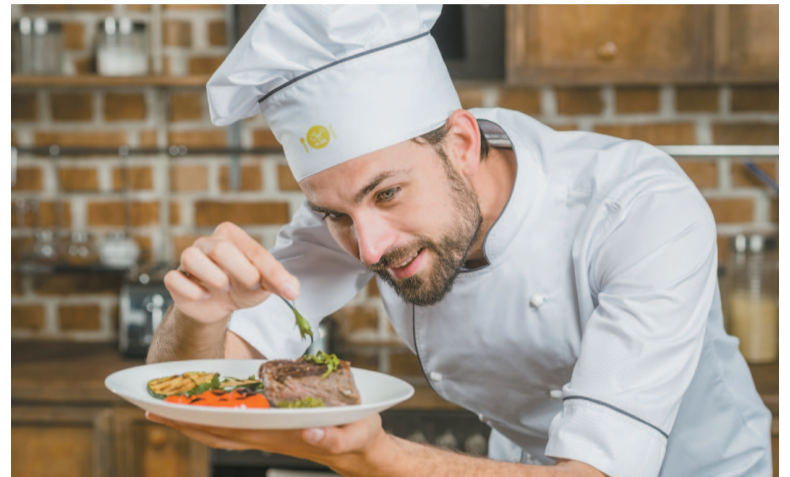
Неважно, где работает повар: в столовой, на судне, в кафе или ресторане, – профессия очень ценна и важна

Повара 2-го разряда перебирают, чистят и моют зелень, плоды, фрукты и ягоды, потрошат и разделяют мясные туши, рыбу, птицу и т. д. Повара 3-го разряда занимаются приготовлением, оформлением и порционированием несложных блюд. Повара 4-го разряда готовят блюда и кулинарные изделия средней сложности. Повара 5–6-го разрядов – мастера своего дела, готовят разнообразные блюда, в том числе повышенной сложности. Высшая ступень в профессии – шеф-повар. Он разрабатывает собственные рецепты и готовит по ним блюда, контролирует технологию приготовления пищи и соблюдение всеми работниками кухни санитарных требований и правил гигиены, анализирует спрос посетителей, формирует ассортимент блюд и кулинарных изделий, составляет