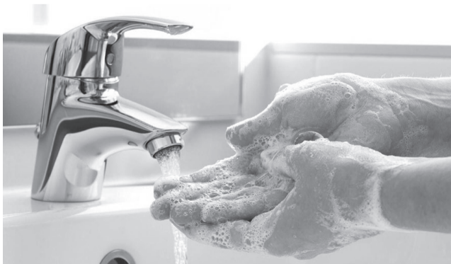
Соблюдайте правила личной гигиены, следите за своим здоровьем

Берегите свое здоровье, соблюдайте правила личной гигиены, при ухудшении самочувствия обращайтесь за медицинской помощью!