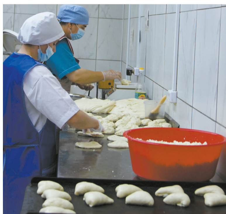
Хлебобулочные изделия всегда свежие. Утром придёшь в магазин – выпечка уже готова.