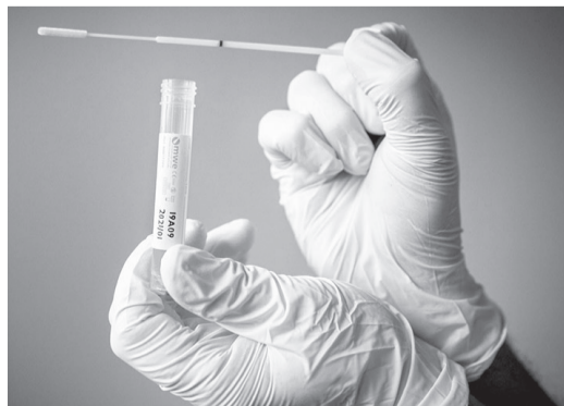
На территории области исследования на COVID-19 проводят 22 лаборатории