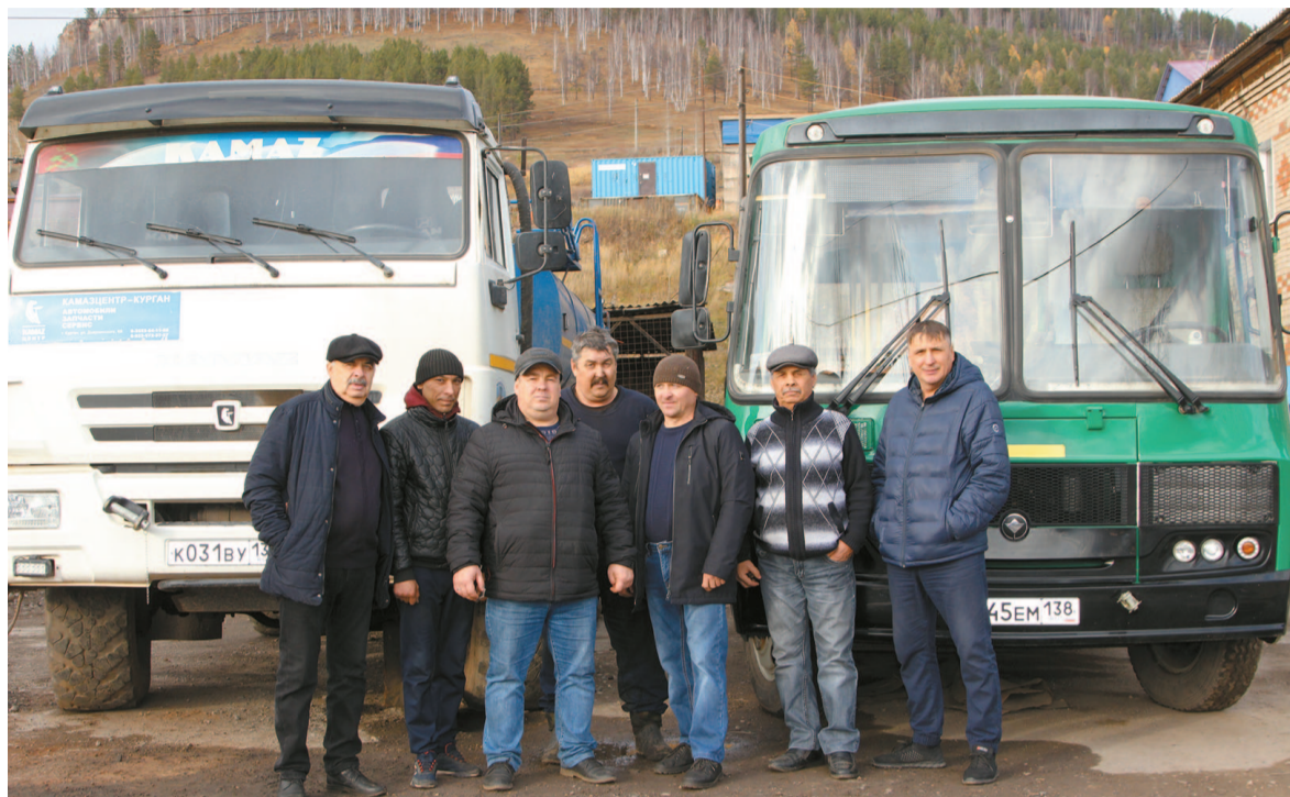
Сотрудники КМП «Автодор» в октябре отметят два праздника: 17-го числа – День работников дорожного хозяйства, а 31-го – День автомобилиста

Резко подорожали материалы, в частности битумная эмульсия, которую пришлось заказывать через посредников (ближайшие поставщики не стали участвовать в тендере). Завоз кубовидного щебня – из п. Зяба Братского района (предприятие несёт немалые транспортные расходы, но выбора нет: только этот инертный материал надлежащего качества).