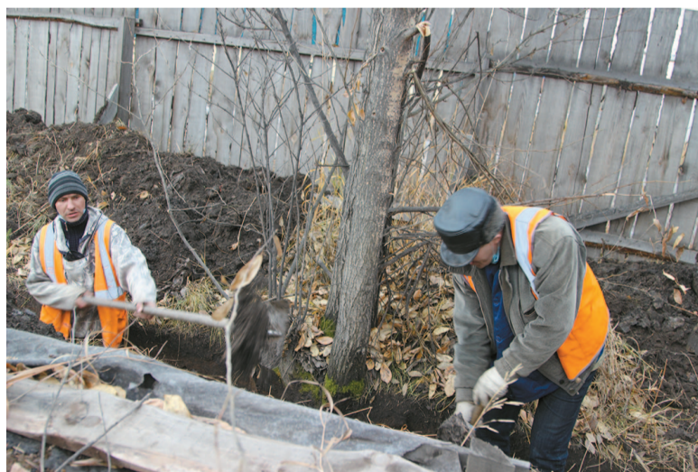
В плановом порядке осуществляется подготовка ливневой канализации на ул. Горького

добавил С. Шелёмин. – Запустили котельную на предприятии. Она работает в штатном режиме. Параметры выдерживаем. Топлива хватает.