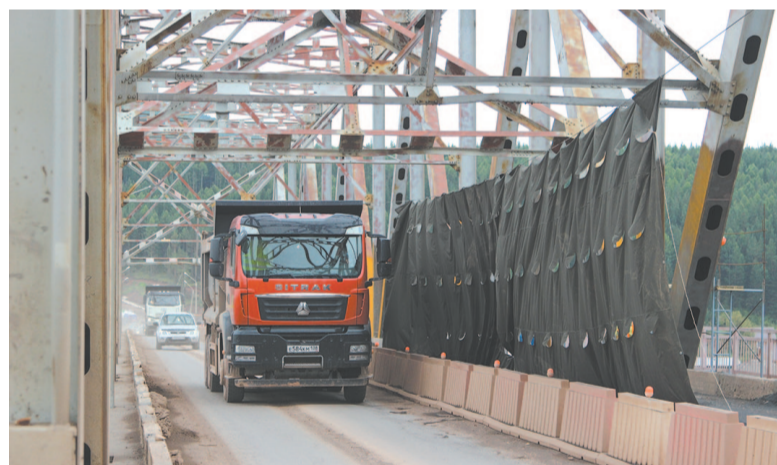
Масса большегрузов, идущих по мосту, превышает разрешённую во время ремонта на несколько тонн. И это порожняком. А с грузом?

станавливать на время сильных морозов. Ещё один интересный момент – движение большегрузов. Сейчас на мосту ограничен