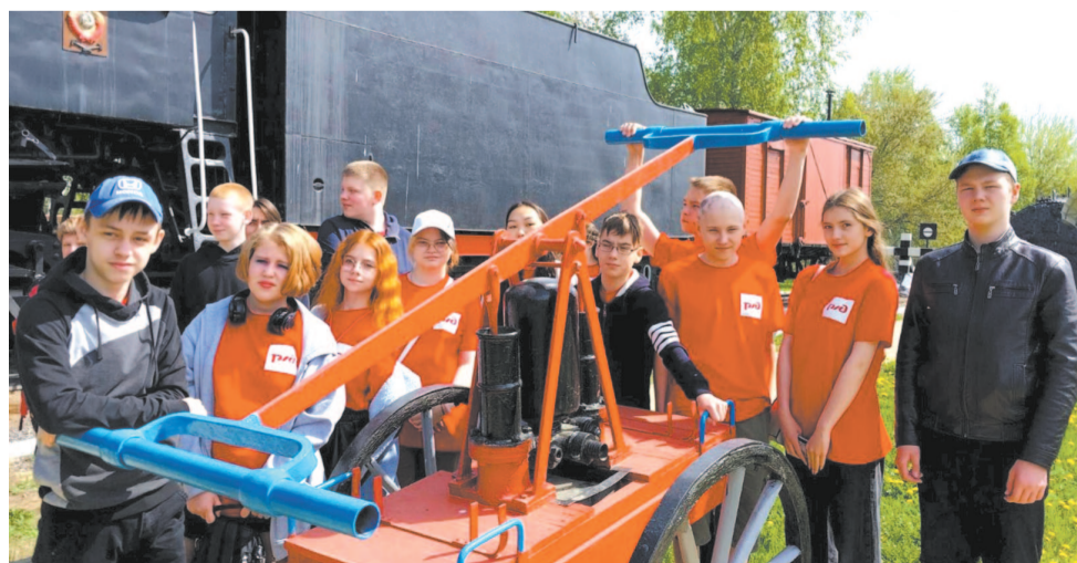
Полосу подготовила Юлия Щемелёва