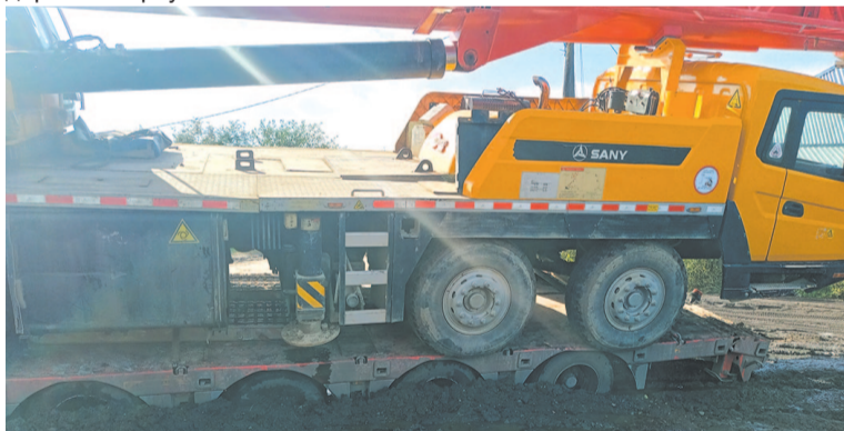
Главная дорога в Старую РЭБ была перекрыта более 15 часов.

Переулок, в котором было ограничено движение, и без того пострадал от работы недобросовестного подрядчика. Работы по восстановлению дороги в переулке так и не были выполнены.