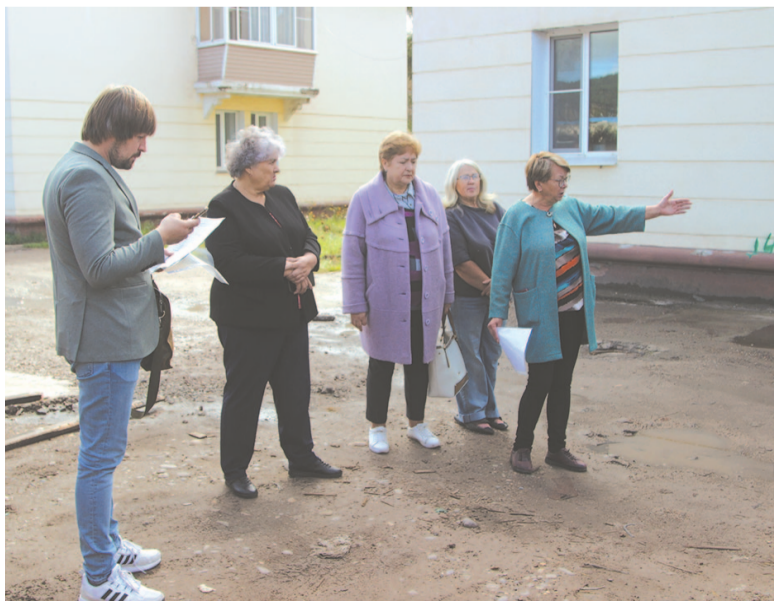
К решению вопроса с канализацией подключились депутаты.