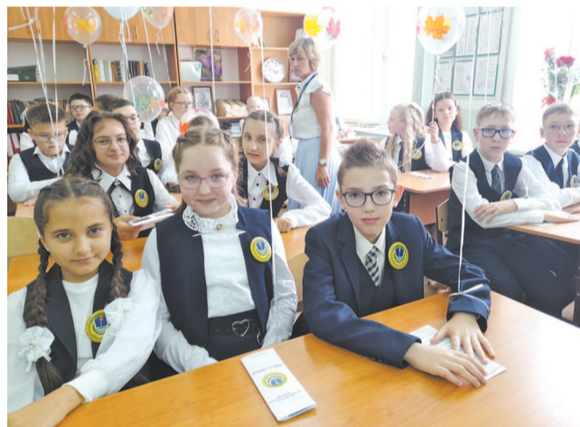
Знакомство с учителем.

подстраивались и сдерживали все наши порывы в рамках дозволенного.