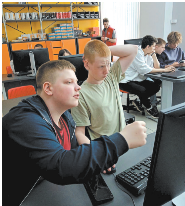
На занятиях в «Кванториуме».

«Было круто! Шикарно!» – вот мнения ребят о таких каникулах... Они благодарны организаторам за плодотворные, насыщенные событиями дни. А новая, уже осенняя смена классов РЖД, отправилась в Иркутск по программе «Страна железных дорог» показывать свои знания и получать интересные впечатления.