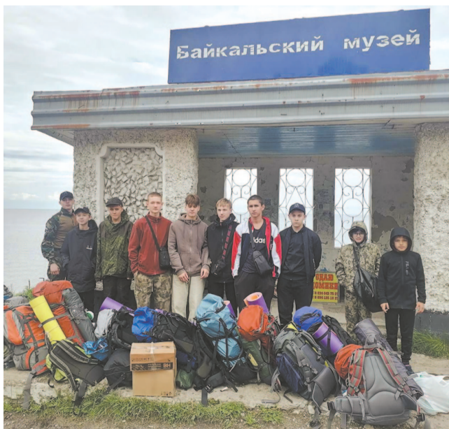
Туристическая и физическая подготовка в походе не помешает.