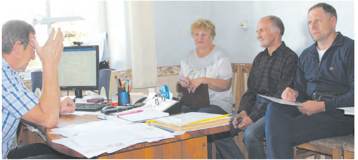
На еженедельных совещаниях ООО УК «Ленкомсервис» рассматриваются текущие вопросы, такие, как проведение опрессовки, установка и замена прибора учёта, промывка бойлеров. И не менее важное — поиск активных форм взаимодействия с жильцами.

Пока люди живут по принципу «моя хата с краю...» работать управляющим компаниям сложно. Руководителю ООО УК «Ленкомсервис» очень хотелось бы, чтобы посильное участие в решении многих вопросов принимали сами жители, активно действовали советы многоквартирных домов. Опыт работы показывает, что 30 процентов отведённых