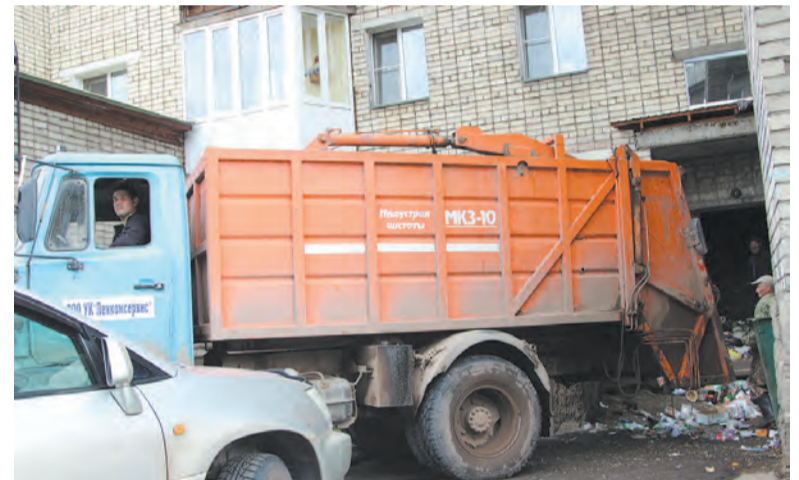
Вывоз мусора производится ежедневно, без выходных. Деятельность управляющей компании направлена на то, чтобы в городе стало чище.

По оплате жилищно-коммунальных услуг население имеет огромные долги, часть которых — до 17% — возвращаются через суд, службу судебных приставов. Эти меры применимы к той категории населения, которая к злостным неплательщи-