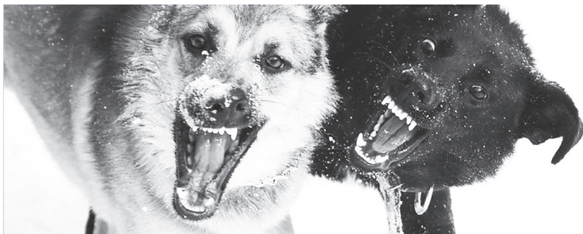
Контракт на отлов не позволяет убрать с улиц всех собак.