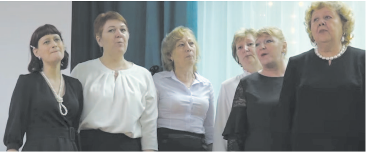
Педагоги не только опытные, но и талантливы.