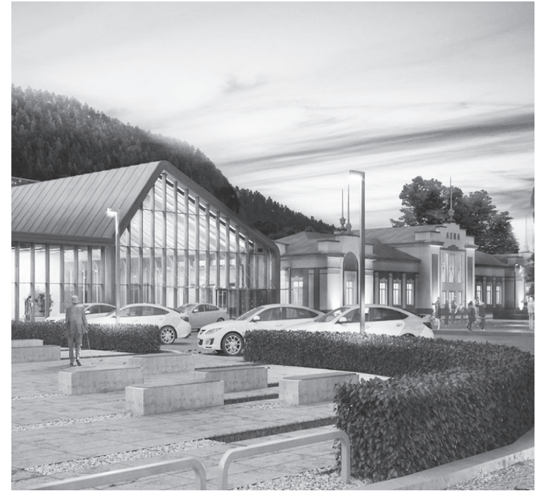
Новое здание вокзала будет иметь площадь около 1200 кв.м.

Управление Роспотребнадзора по Иркутской области