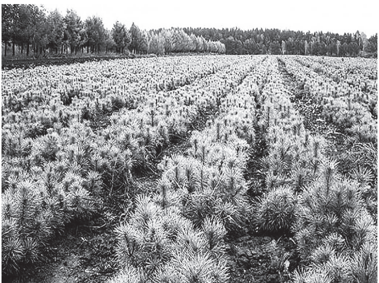
Лесовосстановление очень важно для Иркутской области.

– Наша задача по лесовосстановлению – достичь показателя, когда вместо одного срубленного дерева будет выращено шесть. И мы заинтересованы в создании лесопитомников. Это предприятие расширяется, – сообщил глава региона Игорь Кобзев.