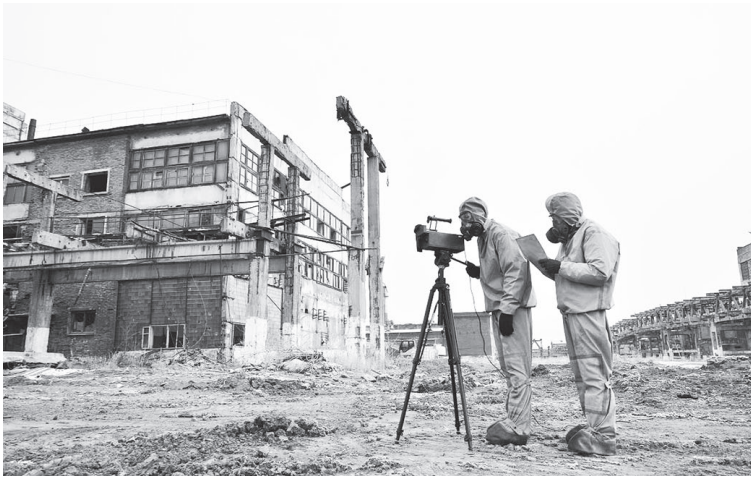
Территорию «Усольехимпрома» наконец очистят от опасных отходов.

Работы будут проходить на территории нефтяной линзы площадью 14 га и на других территориях накопленного вреда окружающей среде площадью 957,1 га. Планируется провести выемку и обеззараживание нефтезагрязненных грунтов, а также профилировать поверхность.