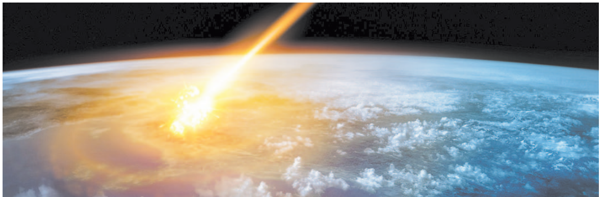
Падение неизвестного объекта удивило многих.