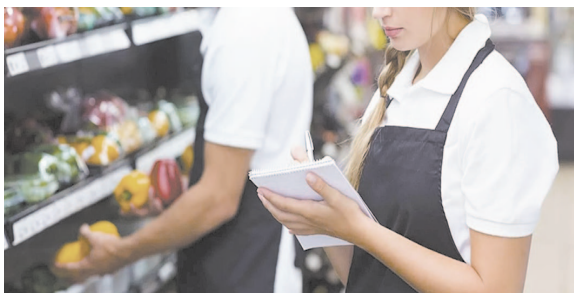
Продавец расставляет товар на полках так, как выгодно ему.

Когда посетитель заходит в магазин, ему стараются