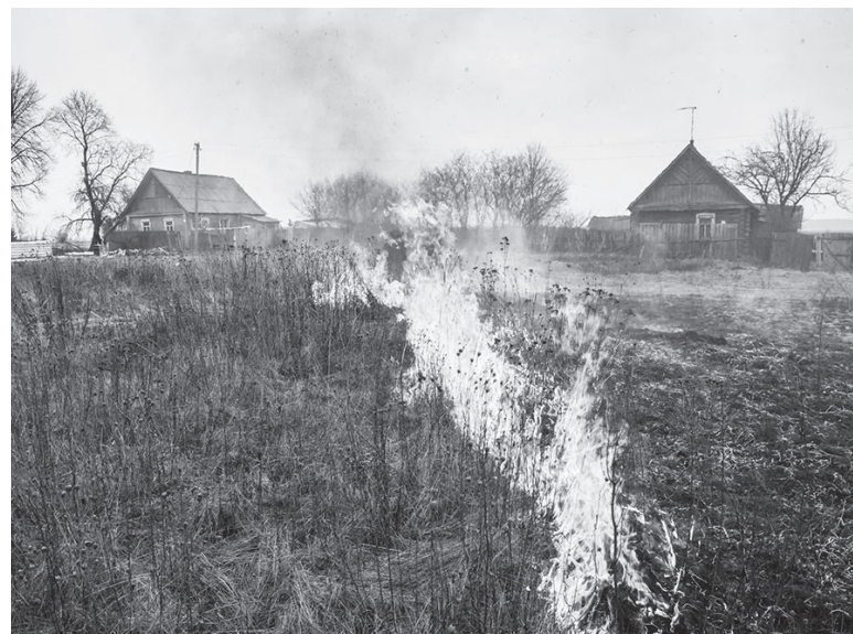
Пал травы нередко выходит из-под контроля.

Как подчеркнули в ведомстве, пожар удалось остановить в нескольких метрах от строений. После опроса свидетелей выяснилось, что пожар начался из-за поджога сухой растительности. В настоящее время организованы поиски виновного.