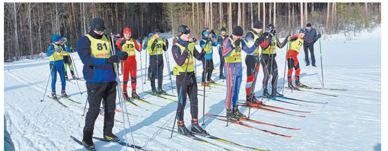
Самому старшему лыжнику – 76.