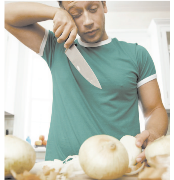
Вреда от овощей при лечении заболеваний не будет.