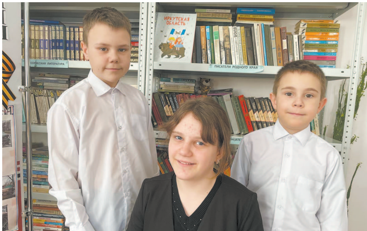
Ребята очень дружелюбны и отзывчивы.