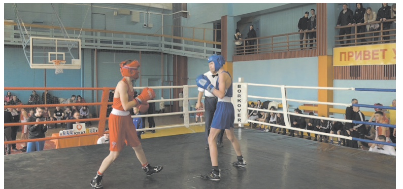
Боксёры из Усть-Кута показали себя достойно.

В спортивном зале на традиционном турнире собрались больше 120 спортсменов. Боксёры из Усть-Кута, Железногорска, Усть-Илимска, Братска, Вихоревки, поселков Железнодорожник и Магистральный встретились на ринге. Принимать на своей территории спортсменов из других городов не страшно, рассказывают усть-кутские боксёры, каждая такая встреча для них – это в первую очередь новый опыт.