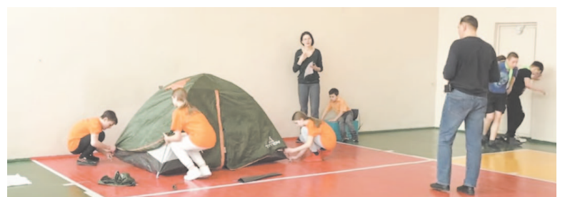
Ставить палатку – одно из важных для туриста умений.