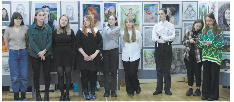
Кроме картин, на выставке представлены изделия декоративно-прикладного искусства.

работ, но мы ограничены в пространстве, поэтому выставили одну-две работы от каждого участника, – продолжает Ирина Влади-