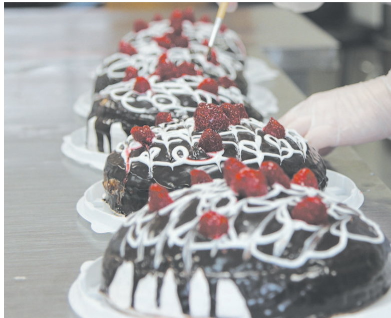
Торты украшают свежими ягодами, сладостями и шоколадом.

Выпечка и сладости всегда считались самыми душевными произведениями кулинарного искусства, которые готовятся исключительно с любовью. Фабрика-кухня «Элит» – это не просто цех по производству готовой продукции. Это то место, где уют фасуется по коробкам, домашнее тепло укутывается в бумагу для выпечки и заботливо отправляется к Вам на стол.