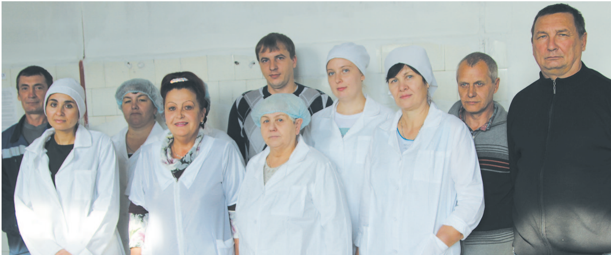
Слаженный коллектив АО «Вита», благодаря которому завод работает стабильно, снабжает своей продукцией детские сады, школы, больницы.