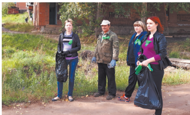
Жители п. Ния, во время проведения субботника «Зеленая Россия»