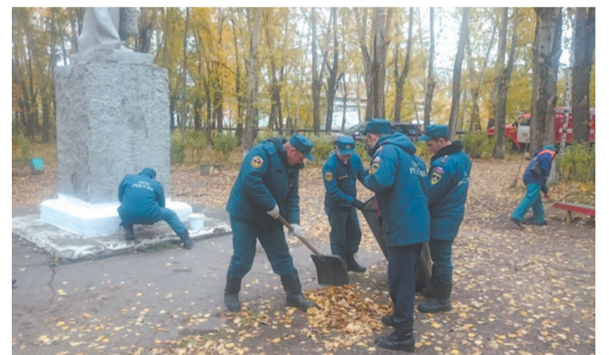
Уборка территории парка им. Д.И. Зверева. Организаторы субботника – сотрудники ФГКУ 8 отряда ФПС по Иркутской области ПСЧ-30