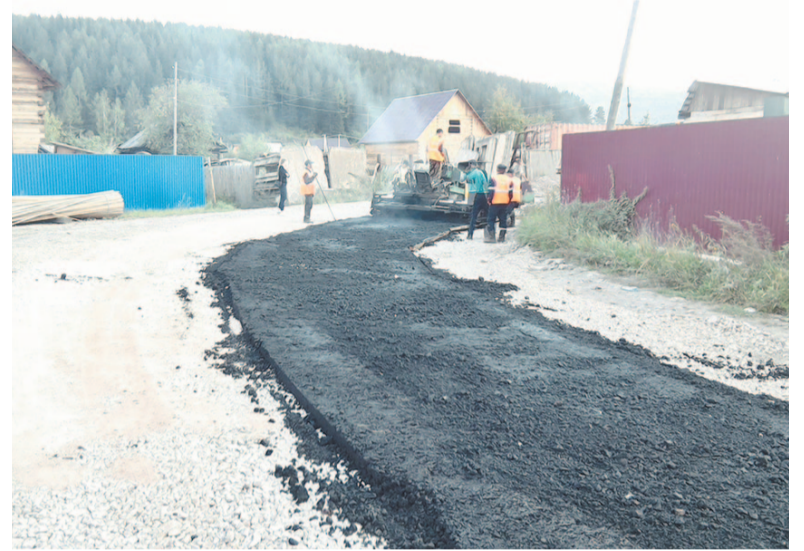
Укладка дорожного полотна в мкр. Старая РЭБ.

— В этот по-настоящему радостный день для тружеников нашей отрасли, в день, когда подводятся итоги строительного сезона, оценивается то, что было сделано, намечаются планы на будущее, я хочу выразить глубокое уважение и признательность тем, кто отдаёт свои силы, профессиональные знания, опыт и время для развития комфорт-