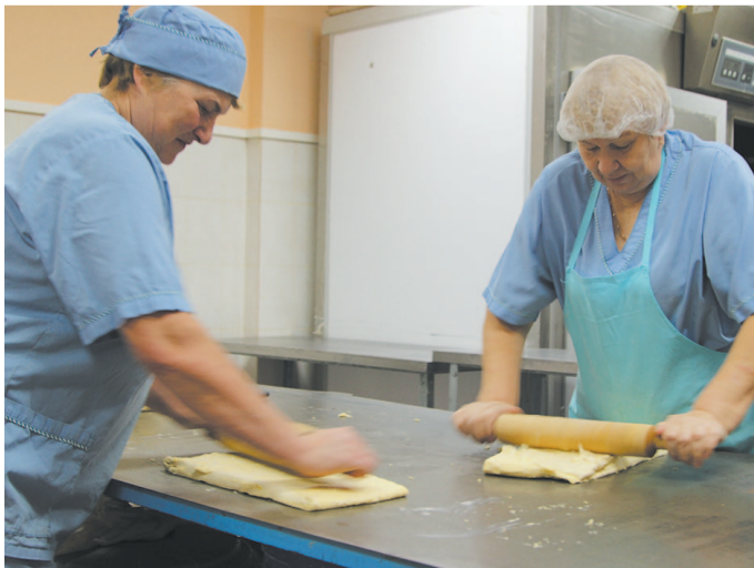
В хлебобулочном цехе работа идет и днем, и ночью.