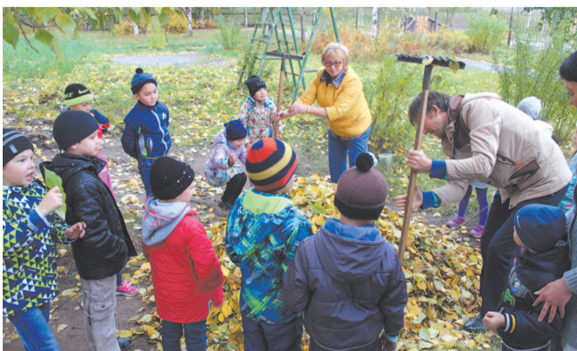
Воспитанники ЦДО на субботнике «Зеленая Россия 2017»