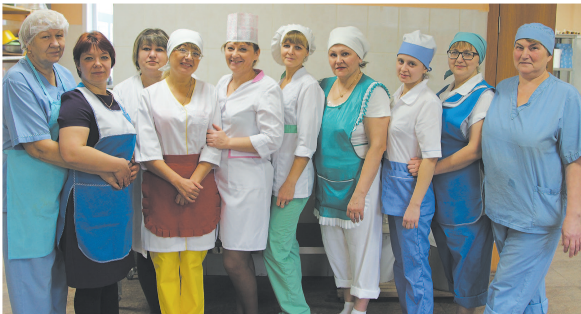
Несмотря на молодость предприятия (фабрике-кухне «Элит» всего три года), коллектив уже успел подружиться.