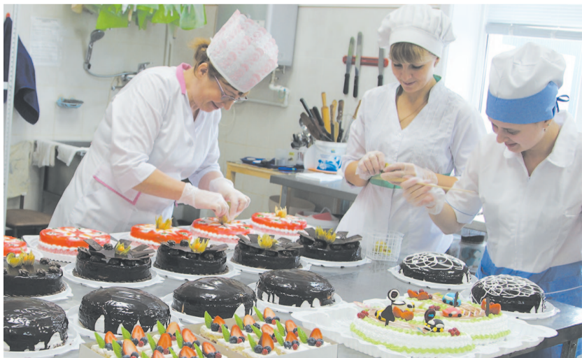
Торт должен быть не только вкусным, но и красивым – с чем сотрудники оформительного цеха справляются отлично.

Подготовила Анастасия Чепелева.