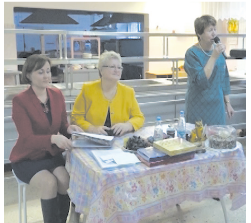
Интеллектуальная игра «Что? Где? Когда?» на кубок «Педагогическая знать» в этом году – юбилейная. Педагоги играют с азартом.

— Людям хочется общаться в такой простой непринужденной обстановке, отдохнуть душой. Что они творят, это уму непостижимо!