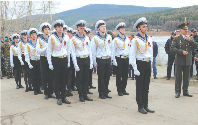
Студенты УИВТ подают пример младшим