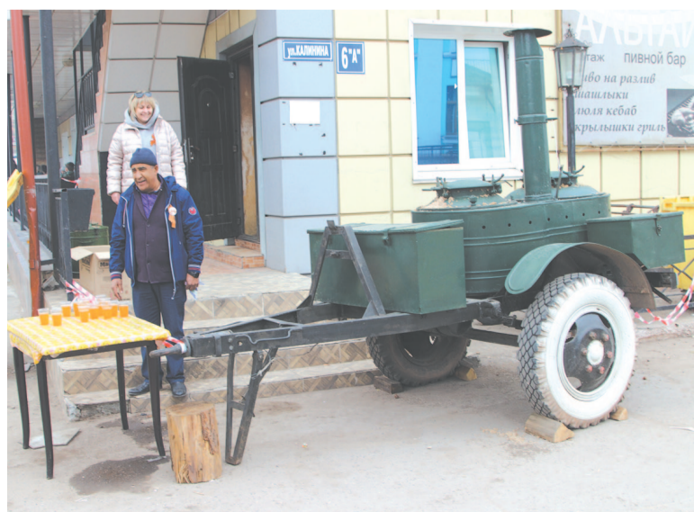
Традиционное угощение с полевой кухни