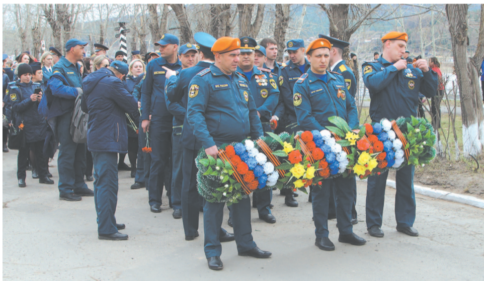
Сотрудники МЧС готовы возложить венок к памятнику погибшим землякам