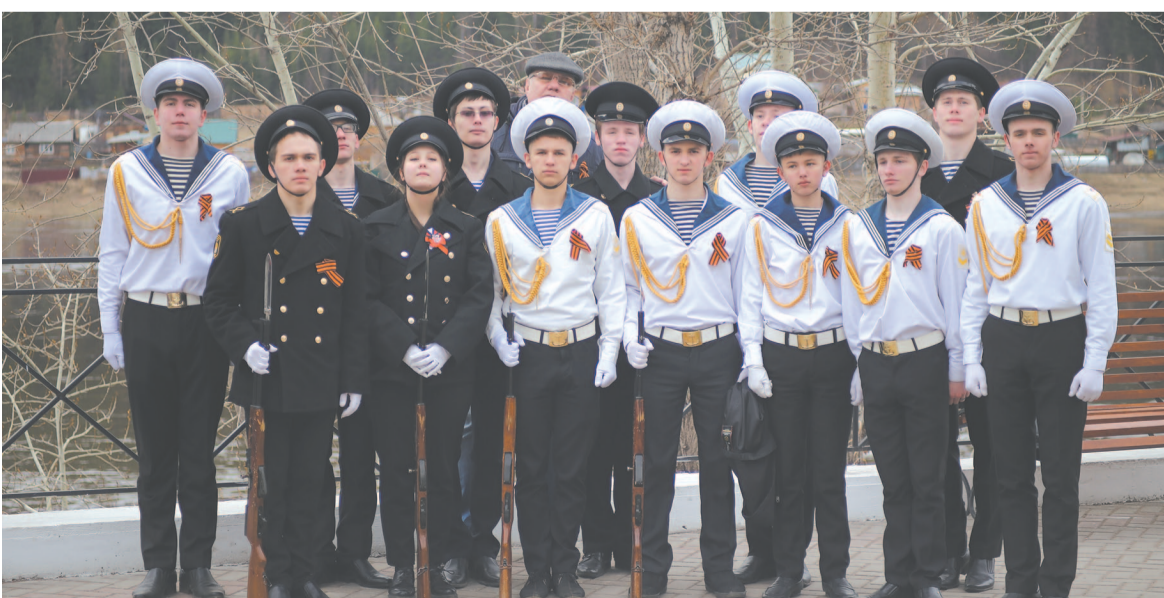
Студенты УИВТ заступят в почётный караул