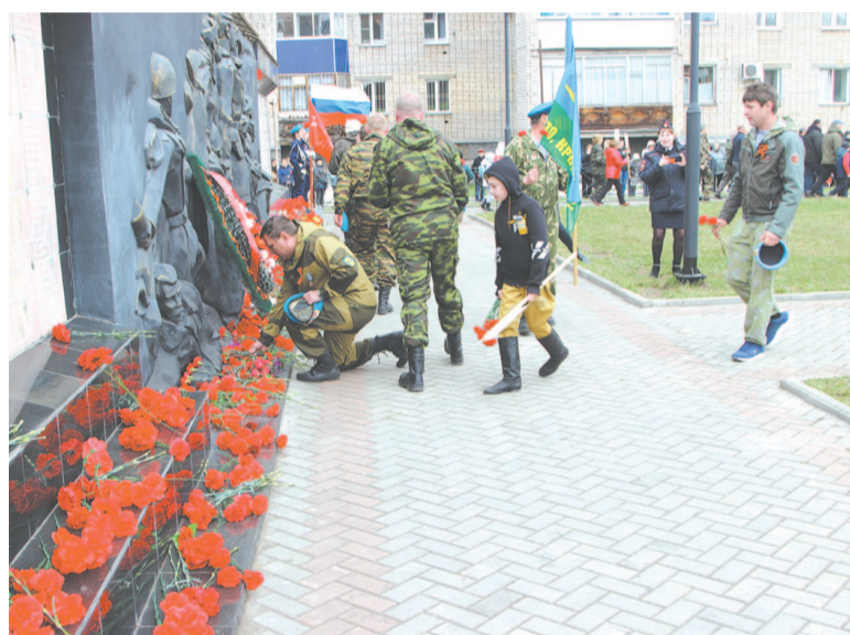
Возложение цветов к монументу