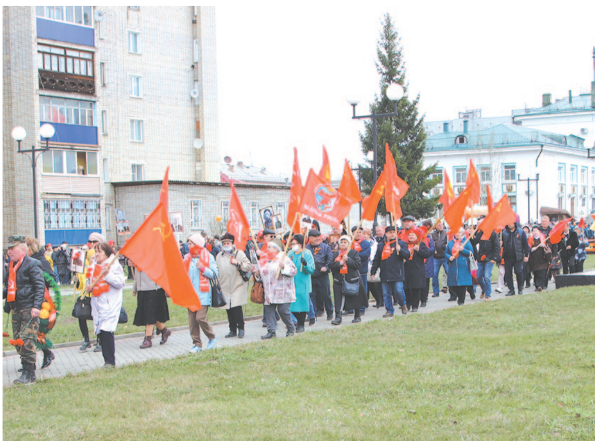
Красные знамёна – эхо Знамени Победы