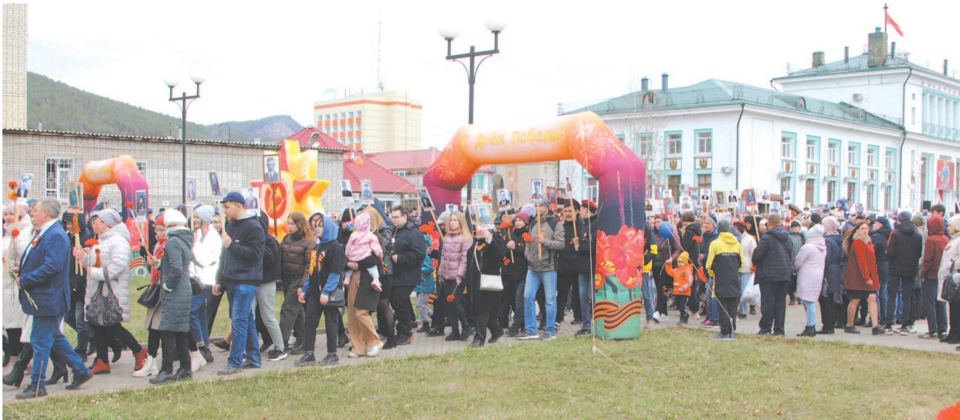
Многие горожане приняли участие в шествии Бессмертного полка