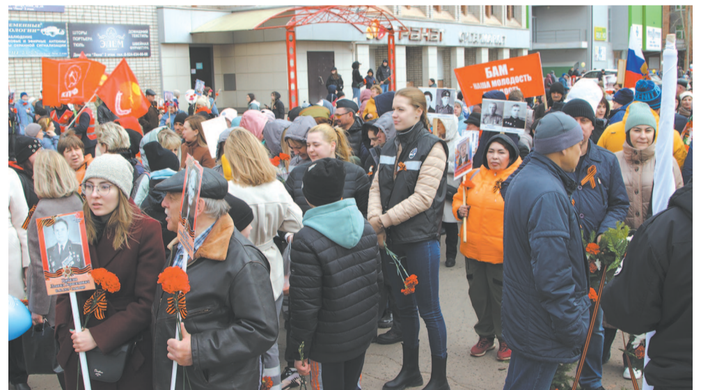
Колонна Бессмертного полка перед началом движения