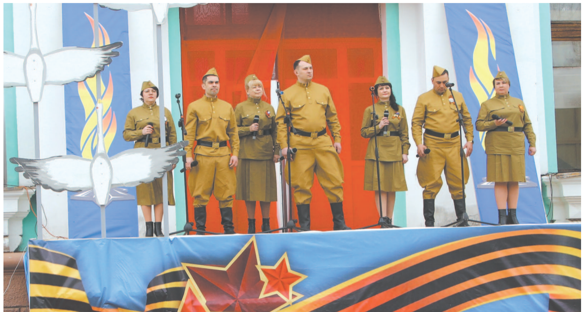
Поздравить устькутян с праздником Победы пришли многие творческие коллективы

Николай Чупров, фото автора, Оксаны Тихоновой, Виктора Горелова.