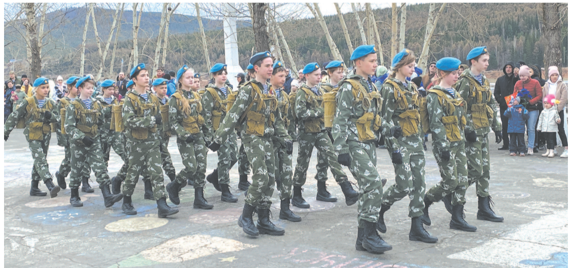
В торжественном шествии приняли участие бойцы юнармии