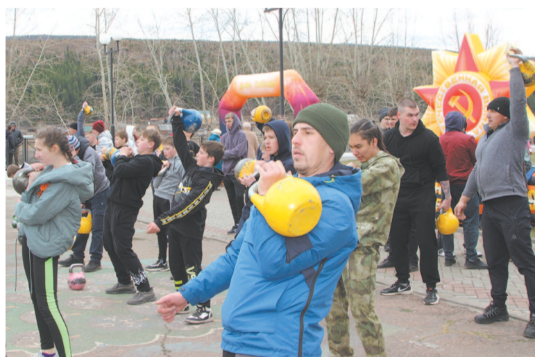
Показательное выступление устькутских гиревиков