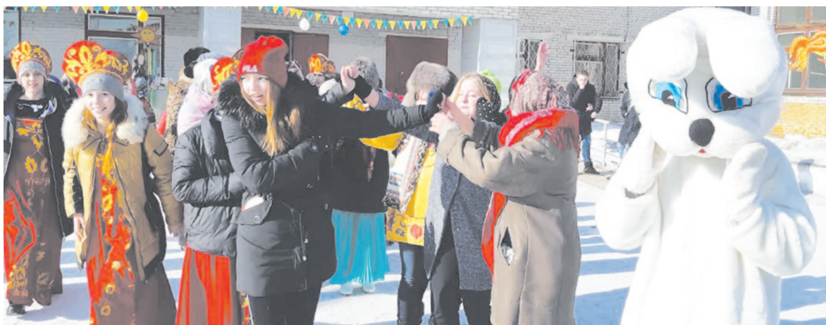
Красочные костюмы, ростовые фигуры, весёлые игры создали праздничное настроение