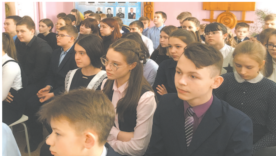
Лицейсты знакомятся с биографиями героев-земляков и историей их подвигов