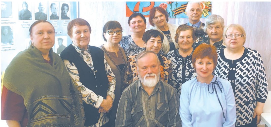
Торжественное мероприятие «Живая связь поколений» состоялось