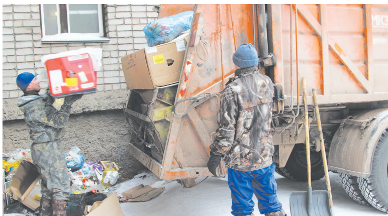
Вывоз твёрдых бытовых отходов – всегда своевременно

Жилищный фонд: 262 дома. Обслуживаемая площадь: 187192, 2 м. кв. Количество проживающих: 7948 человек.