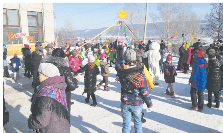
Начало хоровода под задорное исполнение ребят. В центре круга – солнце с лучами из атласных лент.

Праздник «Масленица – 2020» прошёл на территории школьного двора. Мероприятие было организовано школой № 8 и сотрудниками ДК «Геолог».