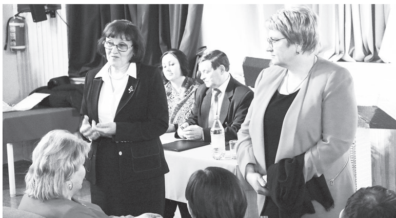
Чаще всего они касаются ЖКХ, недостатка педагогических и медицинских кадров, обслуживания дорог и заготовки дров