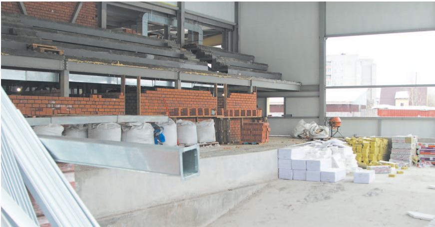
Зал с чашей для плавания площадью 212,5 квадратных метра может принимать 24 человека в час, трибуны насчитывают 153 посадочных места