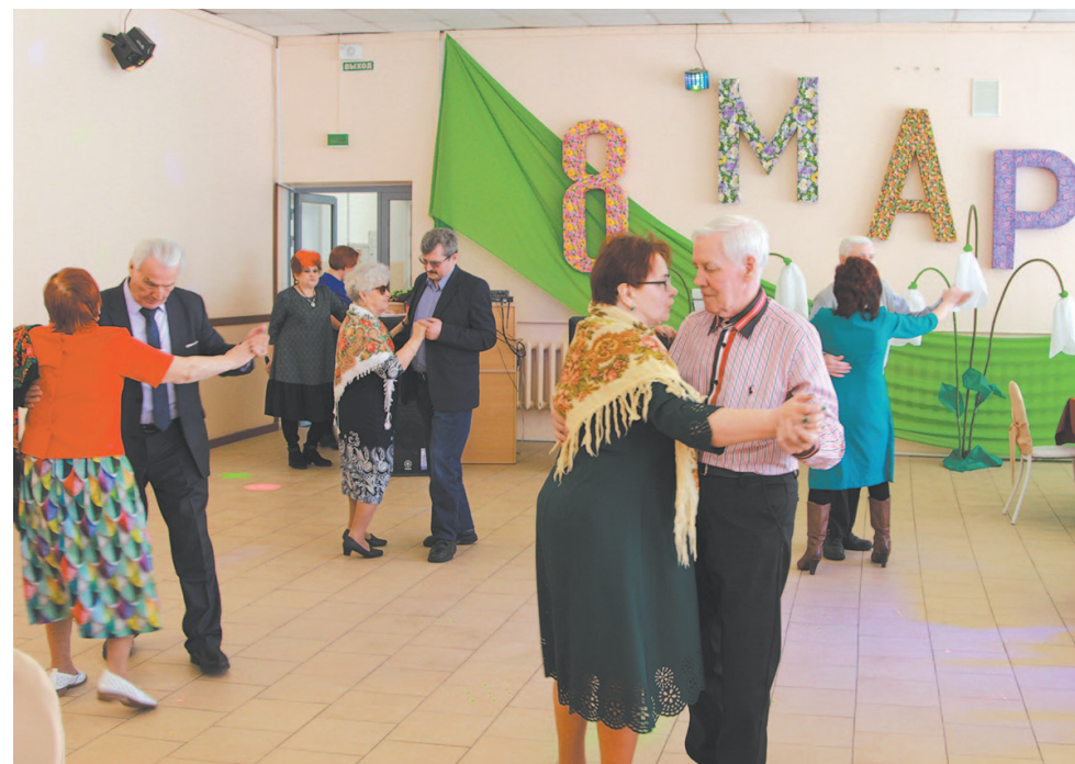
Разрешите пригласить на тур вальса