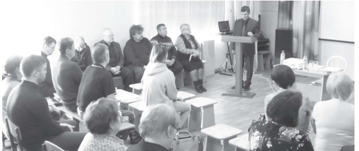
Ежегодно в Усть-Кутском районе проходят встречи с населением, где главы поселков рассказывают об итогах прошедшего года

Следующий вопрос касался оснащения амбулатории посёлка машиной скорой помощи, а также трудностей, с которыми сталкиваются сельчане при записи к врачам