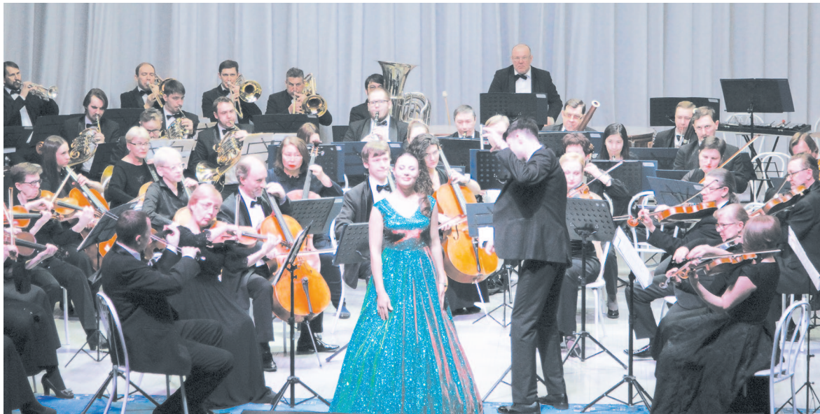
Подарок для устькутян – выступление Губернаторского симфонического оркестра

Вечером любителей музыки ждала встреча с творчеством Георгия Свиридова. Были исполнены иллюстрации к повести А.С. Пушкина «Метель». Картины русской жизни пушкинской эпохи были талантливо озвучены композитором. Так, русские просторы, бег тройки под перезвон бубенцов предстали перед слушателями в пьесе «Тройка» под мощное звучание оркестра. Зал с