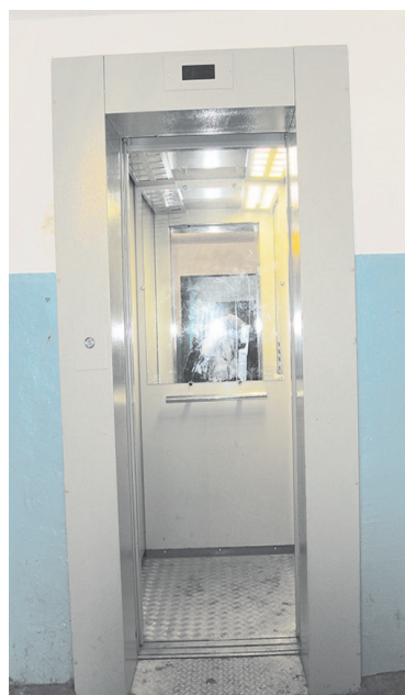
Новый лифт (ул. Кирова, 16) и вторые двери в подъезде (пер. Школьный, 1)