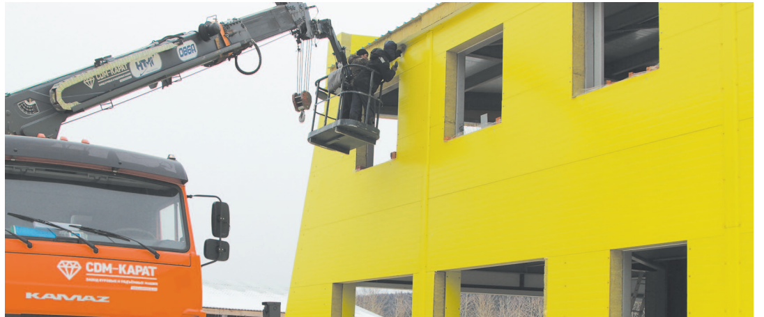
Поднявшись на автомобильном кране, рабочие устанавливают нащельники