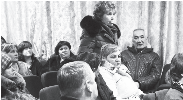
Традиционно после публичного отчета местные жители задают вопросы специалистам