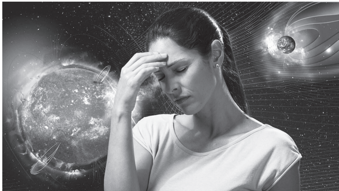
Всплески солнечной активности наиболее опасны для людей с хроническими заболеваниями.

И еще: не переживайте, зачастую изменение самочувствия из-за магнитных бурь имеет психосоматическую причину. Мы сами настраиваем себя на ухудшение, и это опасно. На пользу такой настрой не пойдет даже здоровому человеку!