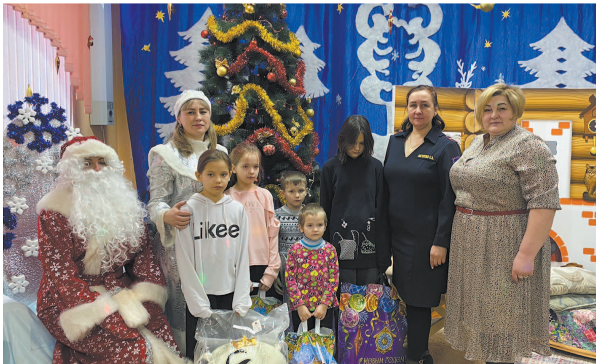
Сотрудники детского сада № 3 вместе с анти-квизерами помогли детям попасть в новогоднюю сказку.

Николай Чупров