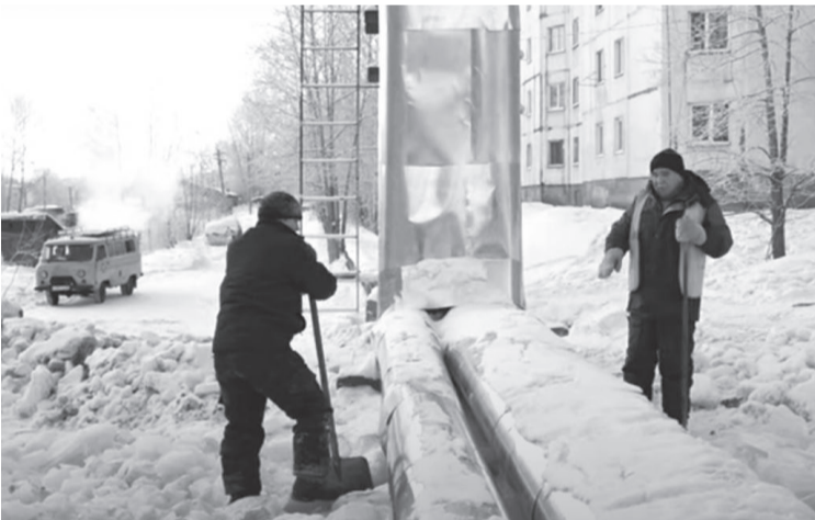
С разгулявшейся природой не всегда удаётся справиться вручную.

Чтобы вода не выходила за пределы русла и не растекалась по близлежащей территории, дорожники ведут работу ежедневно, дополнительно добавляя в русло поваренную техническую соль.