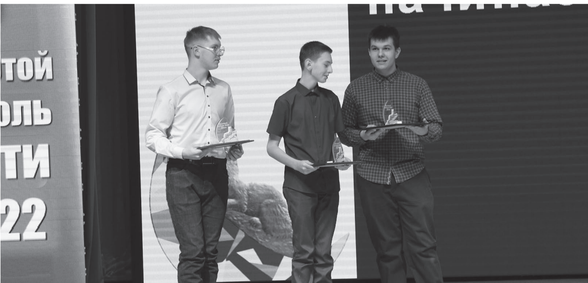
Волонтеры центра «БАМ» получили премию «Золотой соболя. Дети».

В следующем году «Золотого соболя» вручат взрослым жителям района.