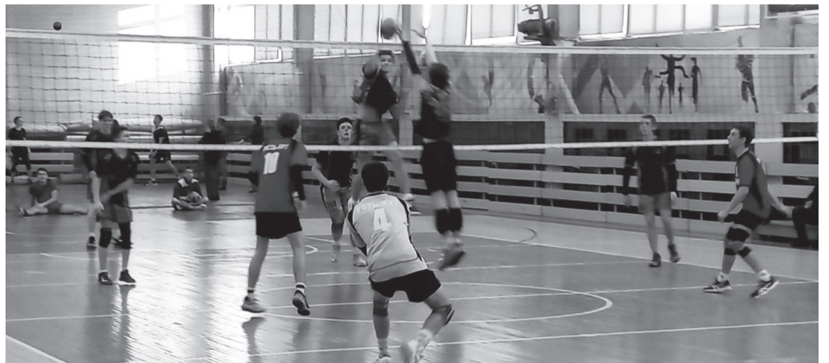
В «Кубке Севера» приняли участие 30 команд.

и команда «Титаны» из Усть-Кута, третье – спортсмены из посёлка Чуна. Среди девочек в категории 2009 год и младше первое и второе место заняли команды Усть-Кута «Успех» и «Феникс», а третье – спортсменки из Киренска. В категории 2010 и младше команда «Вихоревка 10» заняла первое место, «Вихоревка 11» – второе место, третье место досталось команде из Усть-Кута «Метеоры». В самой младшей категории (2012 год) все призовые места достались устькутянам.