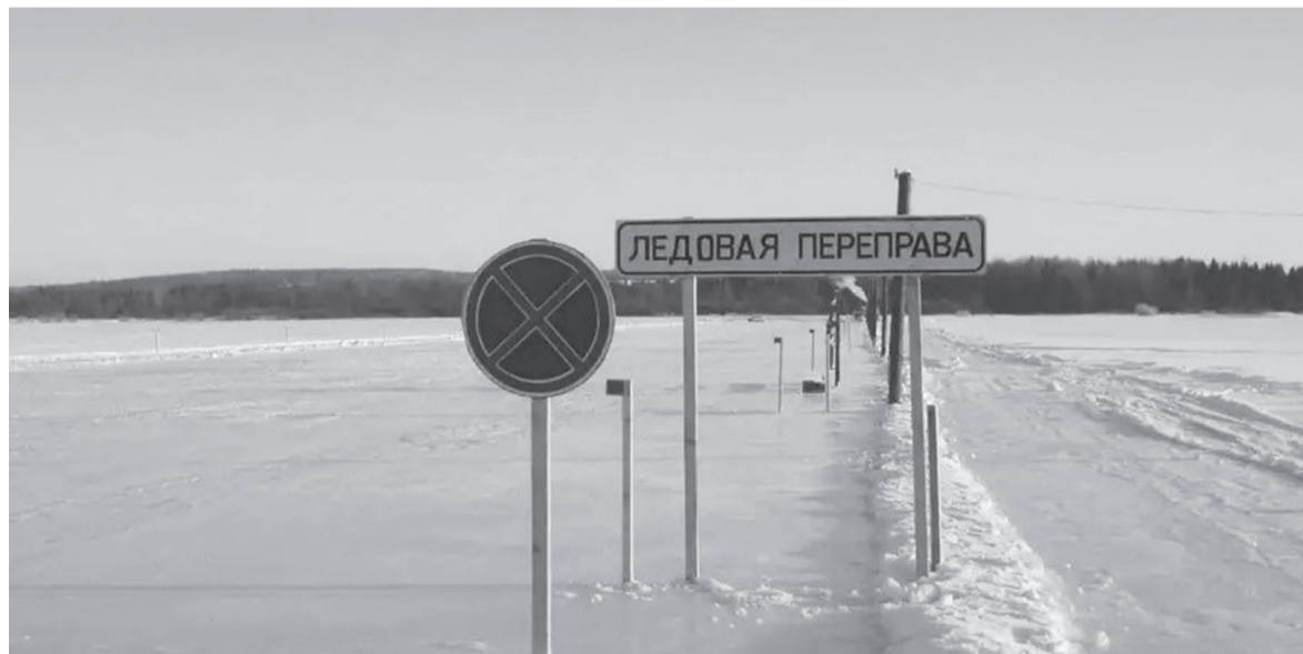
Из-за тёплой зимы выезд на лёд опасен.

О сроках открытия этих ледовых дорог спасатели пока ничего не сообщают. Однако в последние дни в регионе установилась морозная погода, которая, видимо, позволит реализовать планы по оборудованию и эксплуатации новых ледовых переправ в Иркутской области.