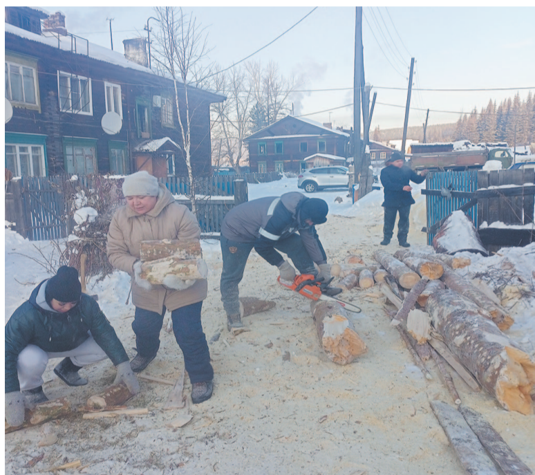
На просьбу помочь откликнулись разные люди.

Ученики второй и восьмой школ, студенты Усть-кутского промышленного техникума (в том числе участники поисково-краеведческого отряда «Надежда»), мужчины и женщины из разных организаций (один сказал просто: «У меня мобилизовали двух сыновей, но мужик в доме остался, а здесь – одни женщины») приняли участие в акции. Судя по их настрою – не в последний раз, санкция ещё не закончена, а зима в Сибири длинная.