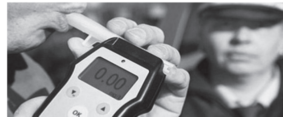
Если у инспекторов достаточно оснований полагать, что водитель пьян, его направляют на медицинское освидетельствование.

Но выпивая эту самую порцию перед тем как сесть за руль, помните: согласно закону, если даже результаты проверки отрицательные, а у инспекторов достаточно оснований полагать, что водитель пьян, то его направляют на медицинское освидетельствование. Также туда направляют водителей, несогласных с результатами теста или вовсе отказавшихся его проходить.