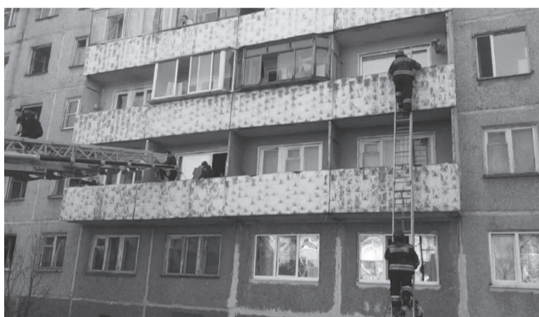
Помощь спасателей понадобилась жильцам верхних этажей.

По предварительным данным, причиной случившегося стало короткое замыкание. Пожары в этом доме происходили уже несколько раз. В новогоднюю ночь из-за распространения огня в подвале помощь понадобилась 20 жильцам. Будет оценена работа управляющей компании.