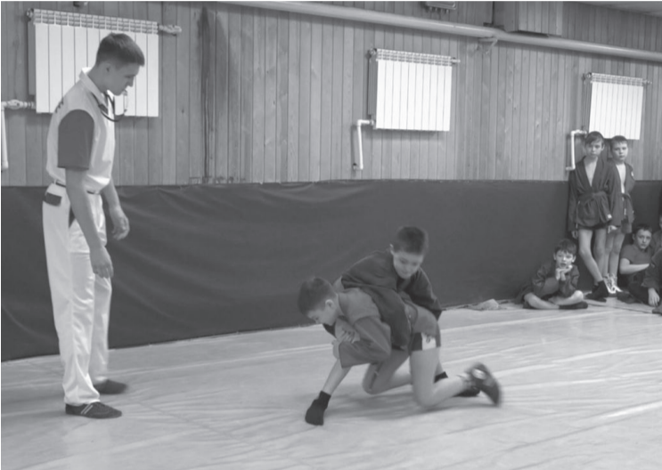
Соревнования по самбо среди юных спортсменов.

Участниками стали борцы из разных школ города, всего 51 спортсмен. Заниматься самбо для этих мальчишек важно не только потому, что это развивает силы и выносливость. Самбо – вид спорта, который родился в Советском Союзе, и развивать его сейчас – это национальная гордость. Лучшие спортсмены в разных весовых категориях получили медали и грамоты.