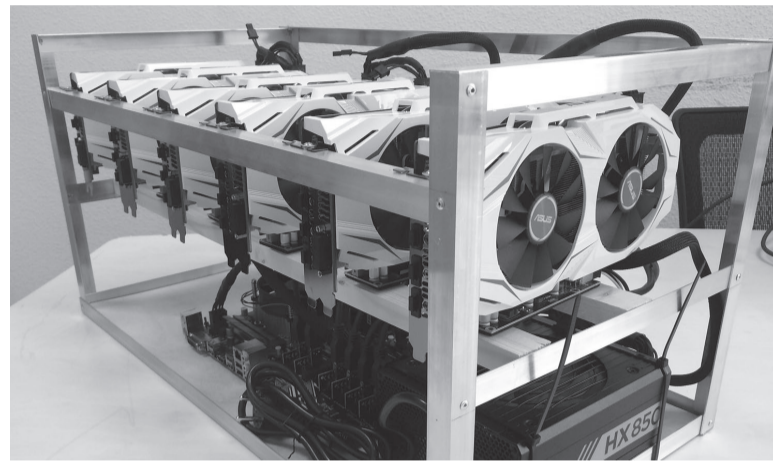
Майнинг-ферма потребляет столько же электроэнергии, сколько небольшое производство.

в Иркутской области выявлено более 4,1 тысячи случаев. Яркое пятно на карте - Грановщина, здесь энергетики обнаружили уже свыше 30 добытчиков криптовалюты. Как показывает практика, энергопотребление одного дома с работающими машинками по добыче криптовалюты равно пяти домам без таковых. То есть мощности, которую забирают 30 выявленных «серых» майнеров, достаточно для бесперебойного электроснабжения 150 домов с такой же жилой площадью.