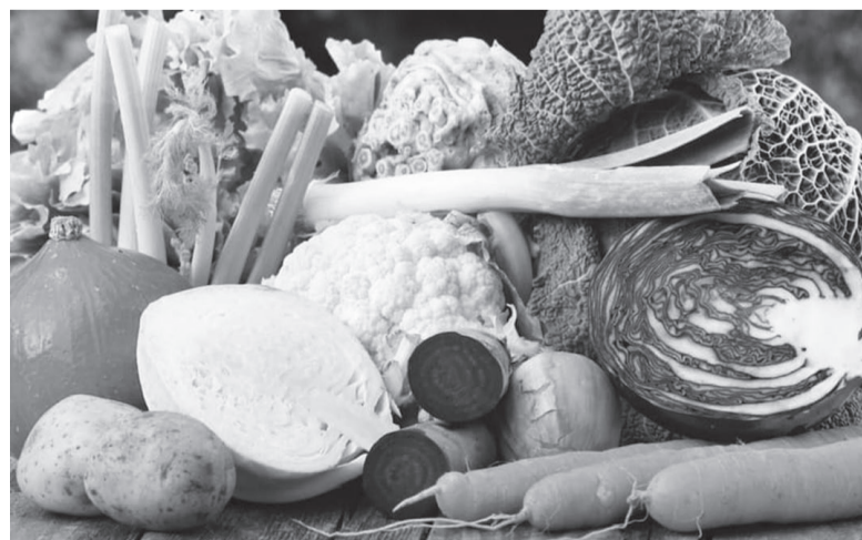
В зимнее время старайтесь есть больше овощей.