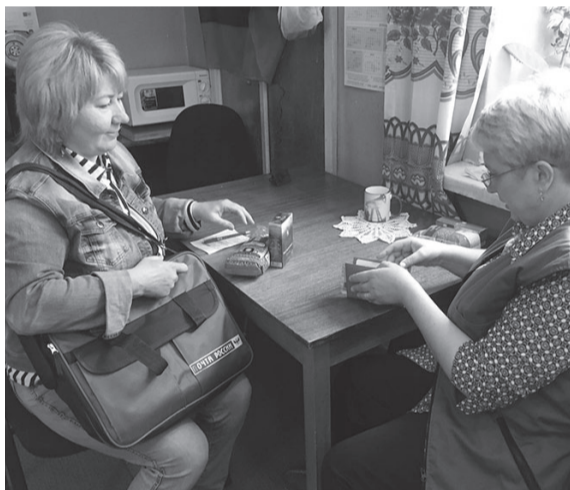
Ранее пенсионеры могли получить пенсию дома только в заранее назначенную дату.

Ранее пенсионеры могли получить пенсию дома только в заранее назначенную дату. Если же в этот день они были вынуждены куда-то отойти, за деньгами им приходилось идти лично в отделение почты