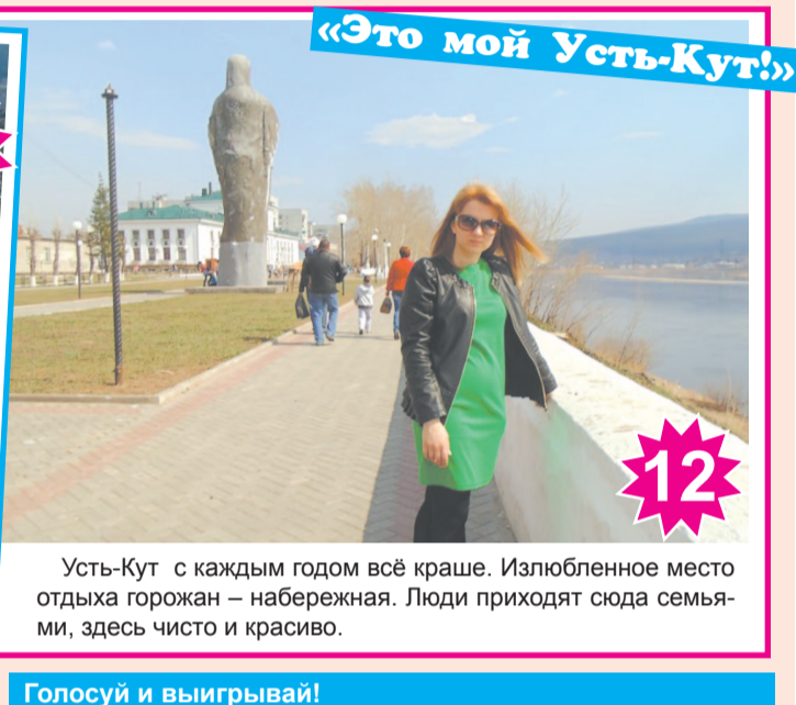
Усть-Кут с каждым годом всё краше. Излюбленное место отдыха горожан – набережная. Люди приходят сюда семьями, здесь чисто и красиво.

Приносите фотографии в редакцию газеты «Диалог-ТВ» по адресу: ул. Кирова, 88, оф. 907 (с пн. по пт., с 9:00 до 17:00) либо отправляйте по электронной почте: mt-dialog@yandex.ru (с пометкой – на фотоконкурс в газету) не позднее 16 июля 2018 г. Информация, предоставленная вместе с работами (ФИО, номер телефона, номинация, комментарий к фото), будет являться заявкой на конкурс.