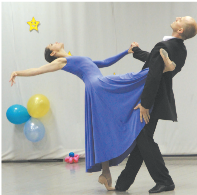
Классика – вне времени.

— Представление, которое мы привезли — сборное, на стыке разных жанров (вокал, балет и театр). Мы очень хотим донести до населения северных территорий красоту балета (состояние, которое охватывает тебя после этого великолепного зрелища, непередаваемо).