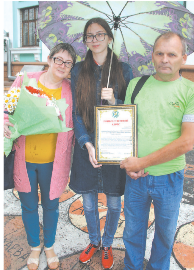
Девиз Седуновых: «Мама, папа, я – активная семья!».