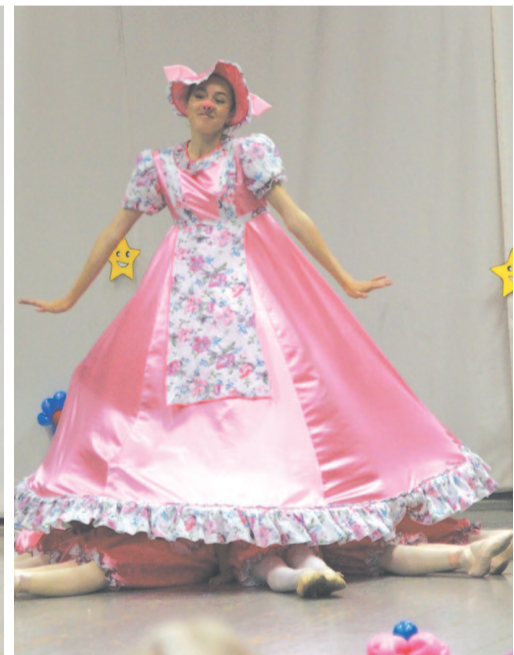
Фокстрот розовощёких «поросят».