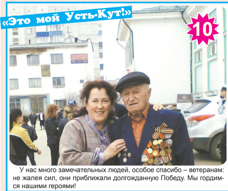
У нас много замечательных людей, особое спасибо – ветеранам: не жалея сил, они приближали долгожданную Победу. Мы гордимся нашими героями!