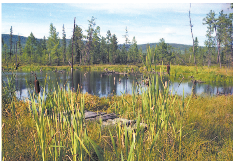
Фоторабота «Плотик» (озеро Керосинное).