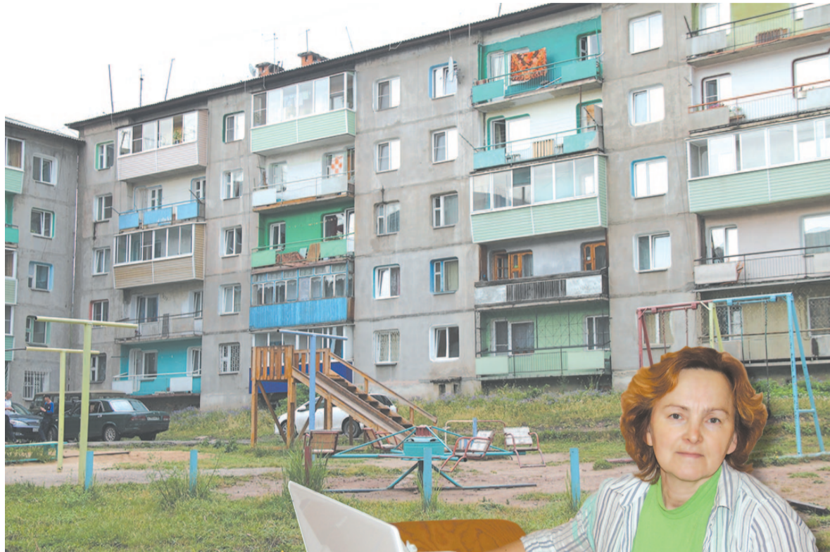
А у нас во дворе есть, где разгуляться детворе.