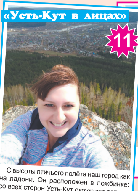
С высоты птичьего полёта наш город как на ладони. Он расположен в ложбинке: со всех сторон Усть-Кут окружают сопки.