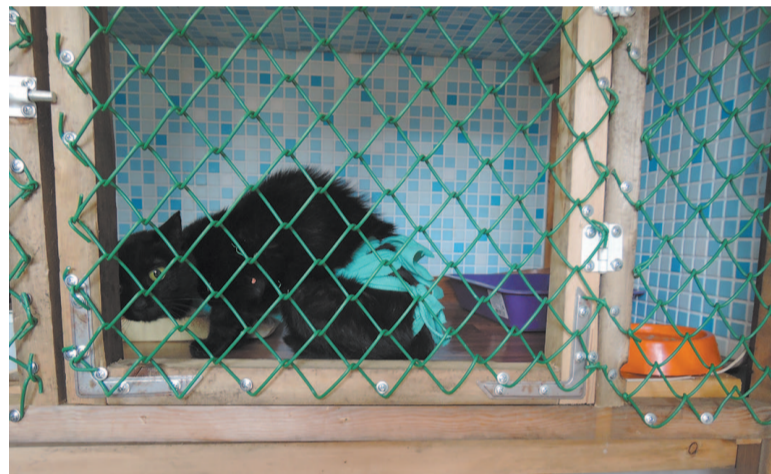
Всех животных стерилизуют