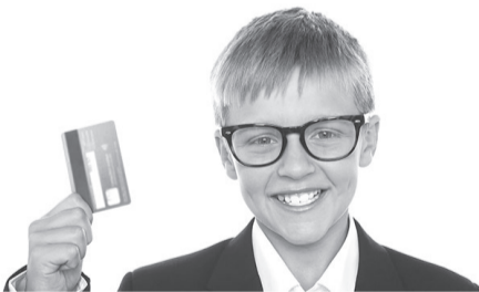
До 14 лет открыть счёт в банке на имя ребёнка могут только его законные представители.

Условия оформления карт детям до 18 лет надо уточнять в том банке, где планируется открыть счёт.