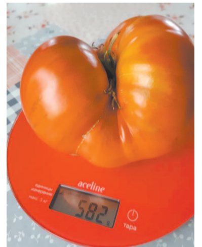
Вот это помидорчик!