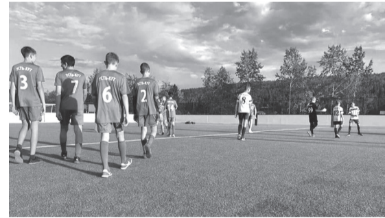
ФОК торжественно открыли год назад, но позже выяснилось, что спортобъект построен с нарушениями.

Напомним, ФОК открытого типа на Кирова строили по партийному проекту Единой России «Детский спорт». ФОК торжественно открыли год назад и даже провели на нём символический футбольный матч. Но потом оказалось, что при строительстве были допущены нарушения, и спортобъект в таком виде использовать небезопасно.