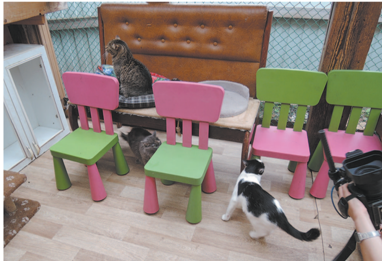
Летом питомцы с удовольствием проводят время в вольере