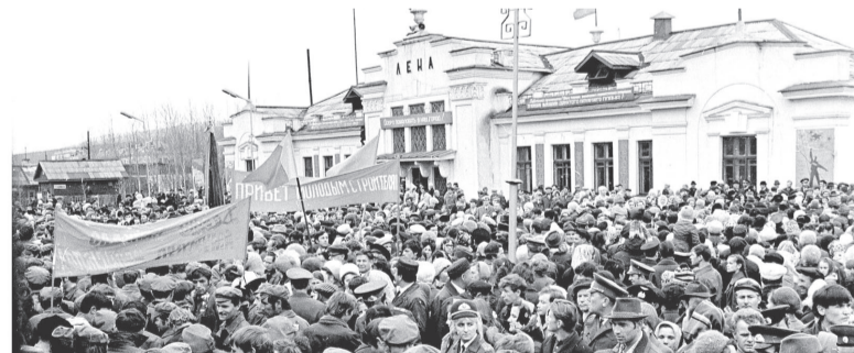
Сибирь принимает бамовцев со всей необъятной страны.

ционировал участок Тайшет-Лена, по которому доставляли грузы в Осетровский речной порт. Ударная комсомольская стройка привлекла тысячи людей со всего Советского Союза. Кто-то ехал «за туманом и за запахом тайги», кто-то – ради заработка и новых возможностей. Город рос, развивался. Выросла и важность Усть-Кута как связующего звена в перевозке грузов.