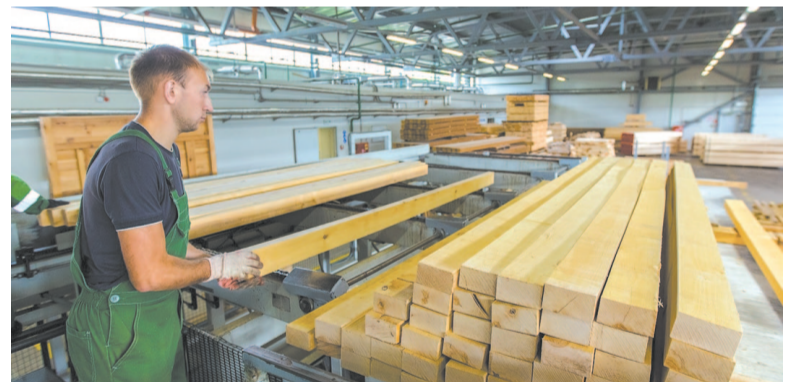
В Иркутской области создадут совет по развитию лесного комплекса.