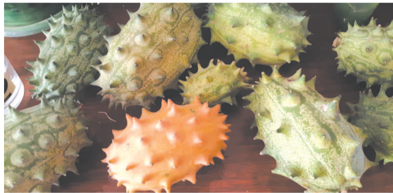
Эксперимент с выращиванием кивано (ещё его называют африканским огурцом) удался.