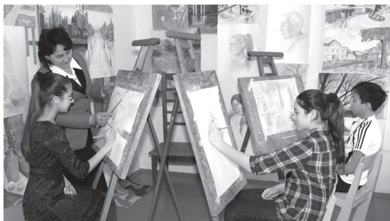
Для юных художников закупают мольберты, этюдники, наглядные пособия.

Средства получат учреждения, которые пройдут специальный конкурсный отбор. По словам министра культуры региона Олеси Полуниной, принять участие в конкурсе смогут художественные школы и школы искусств, которые обучают детей дополнительным предпро-