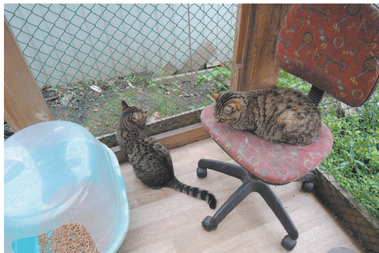
Коты попадают в «Кошкин дом» разными путями, но по одной причине: их бросают люди