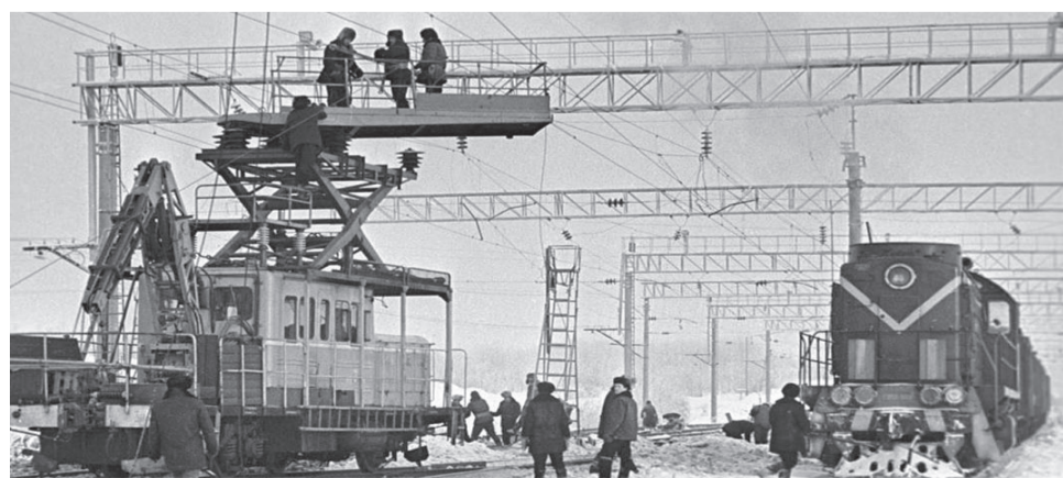
Электрификация железнодорожных путей на участке Тайшет – Лена, БАМ, 1981 год.