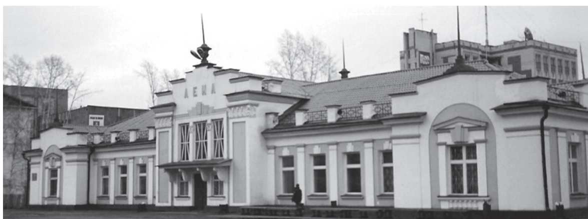
Усть-Кутский железнодорожный вокзал менял цвета, но архитектурный облик неизменен.

Железнодорожный вокзал станции Лена, построенный в 1954 году, – памятник архитектуры. Интересно, что у него есть брат-близнец: по такому же проекту построен вокзал станции Гидростроитель в Братске (в то время – станция Осинковка возле одноимённого посёлка). Цветовая гамма вокзала изменялась (был он в разное время покрашен и в жёлтый, и в голубой, и в розовый, и в