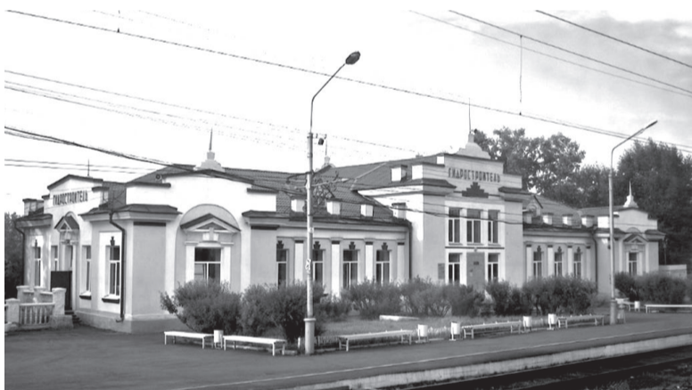
Брат-близнец нашего вокзала – Гидростроитель в Братске.