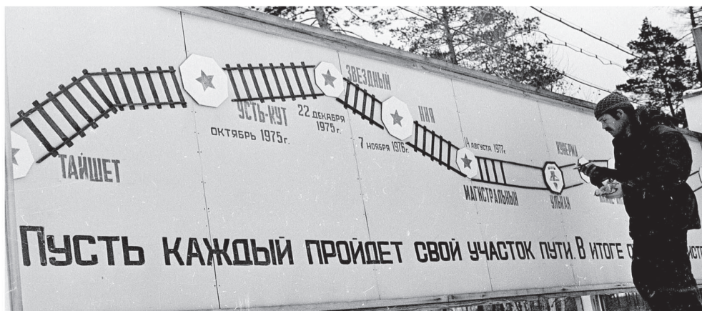
Схема Западного участка БАМа.