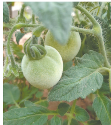
Листья, стволы и сами плоды у томата Мохнатый шмель покрыты лёгким пушком, как у персика.