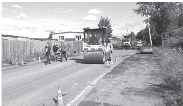
Дорожные работы ведут только днём, чтобы не нарушать покой жителей.

То, что нам действительно мешает, так это дожди, которые, кстати, чаще идут ночью.