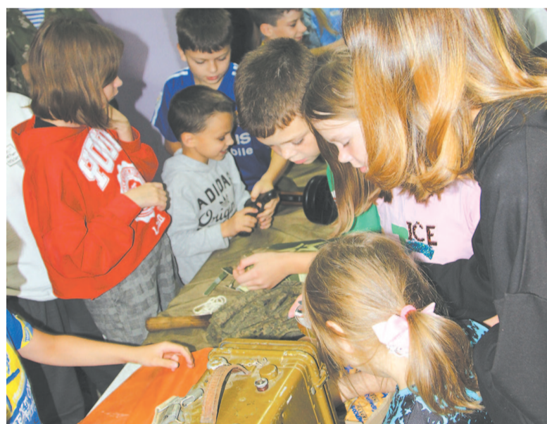
Детей интересует всё, что связано с воинской службой