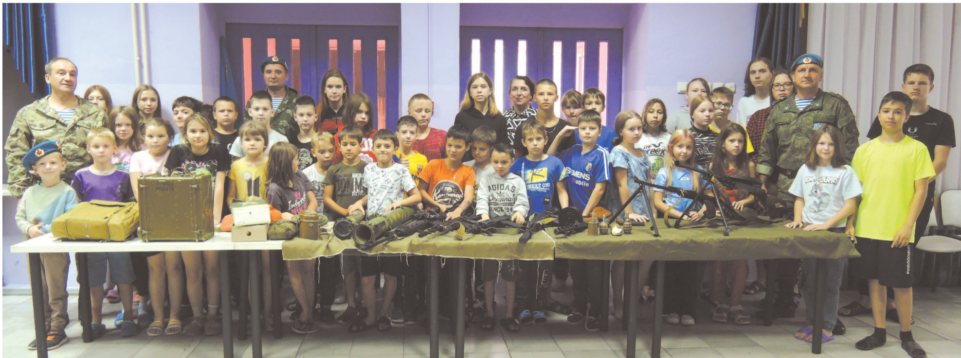
«Союз десантников города Усть-Кута» регулярно проводит встречи с молодёжью