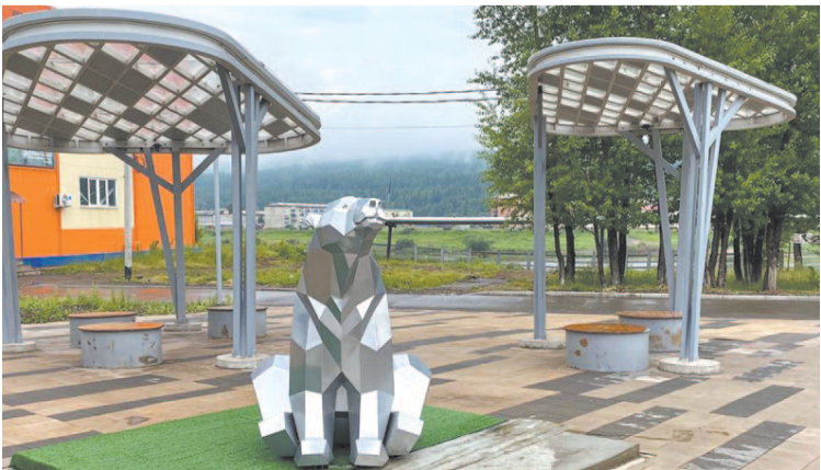
Администрация МО «город Усть-Кут».

Хочется верить, что устькутяне будут беречь арт-объект, чтобы спустя некоторое время его не пришлось реставрировать.