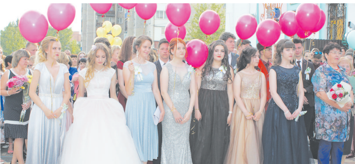
На празднике все выпускницы выглядели как настоящие принцессы. Юноши в галстуках и безупречных костюмах ничуть не уступали своим спутницам.