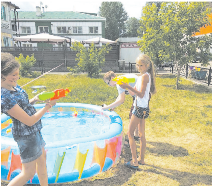
В центре города весело отметили День Ивана Купала

Оксана Некрасова