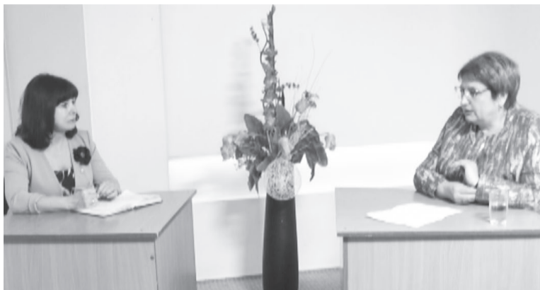
Во время интервью с мэром района Тамарой Климиной

– Стало известно, что для продолжения работ в парке на Кирова нашли спонсора, так ли это?