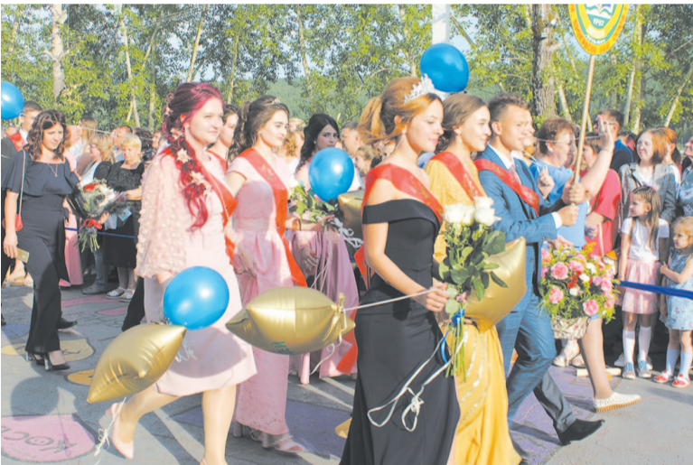
Экзамены остались позади, и будущие студенты в предвкушении новых эмоций и событий