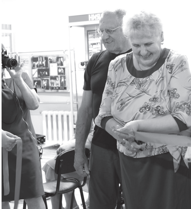
27 июня при поддержке ИНК состоялось открытие выставки работ «БАМ в творчестве художников» из собрания Иркутского областного художественного музея имени В.П. Сукачёва