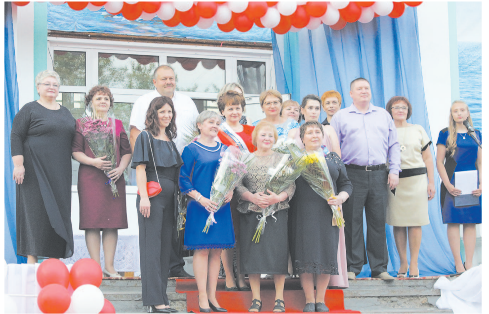
Особенно искренние и добрые слова звучат в адрес классных руководителей, которые сопровождали своих учеников на пути к взрослой, самостоятельной жизни