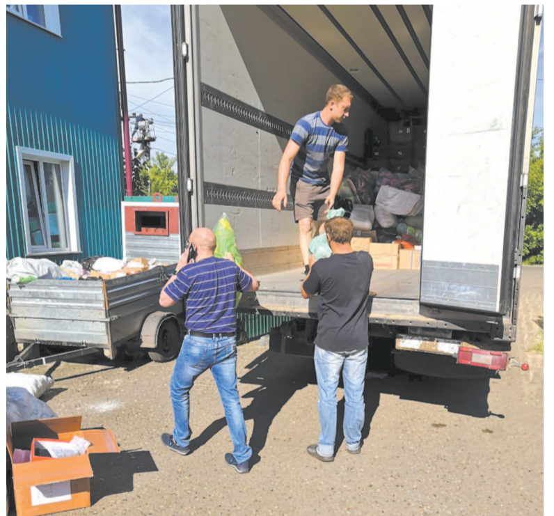
Всего на территории Иркутской области пострадал 31 населенный пункт