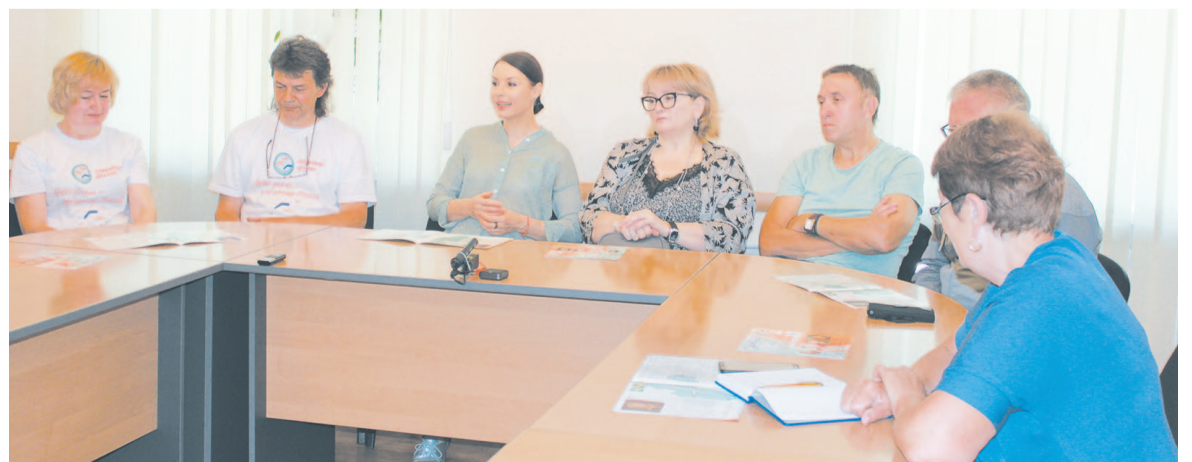
Также популярные актёры театра и кино приняли участие в пресс-конференции, где ответили на вопросы журналистов усть-кутских СМИ