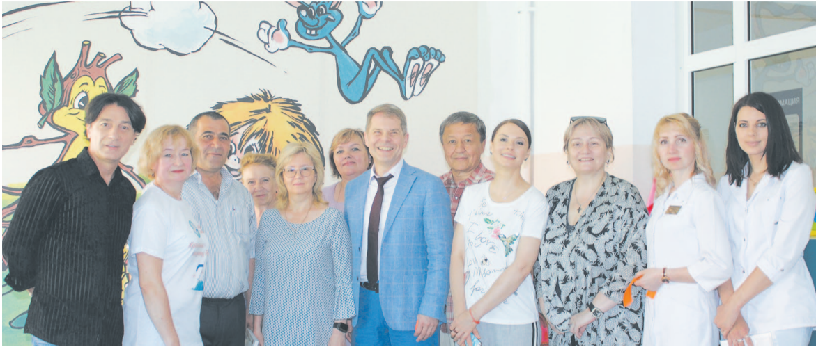
Усть-Кутский район в рамках акции «Северный десант» в шестой раз посетили популярные артисты театра и кино. Они провели несколько благотворительных акций, в том числе открыли в Усть-Кутской районной больнице детскую игровую комнату.