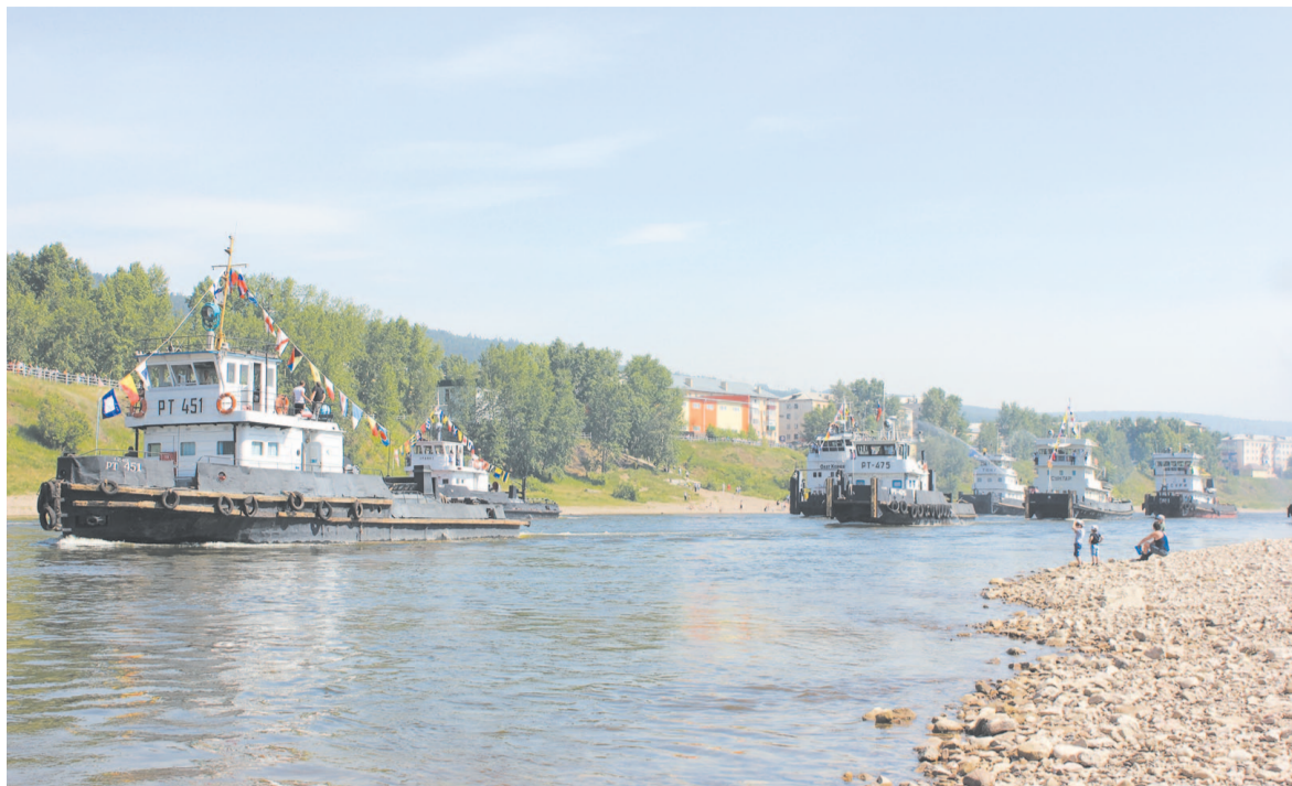
Торжественный парад теплоходов ко Дню работников речного флота