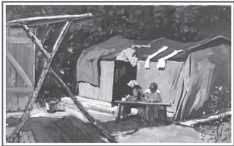
Посетить выставку картин известных художников, посвященную строительству великой магистрали, можно совершенно бесплатно. Она продлится до 15 августа.