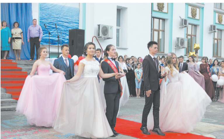
Романтичный вальс под музыку из мультфильма «Анастасия» невольно погружает в атмосферу сказки

27 июня на площади речного вокзала состоялся выпускной вечер под названием «Алые паруса». Прекрасный корабль-мираж из повести Александра Грина многие годы символизирует праздник выпускников средних общеобразовательных школ. В этом году в Усть-Куте и Усть-Кутском районе в свободное плавание отправились 266 школьников.