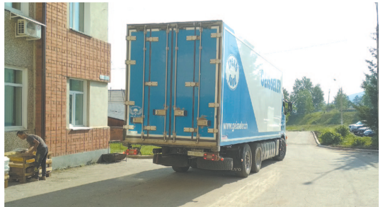
Тонны гуманитарной помощи из Усть-Кута отправляются в Тулун

Пункт приема гуманитарной помощи работает на базе соцторга по адресу: ул. Кирова, 79, с 9:00 до 20:00.