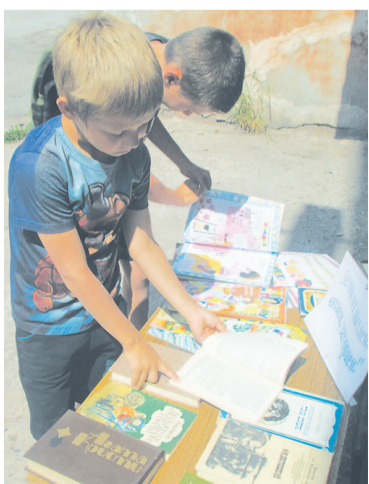
Дети с интересом рассматривают книги самых разных жанров

Наступило долгожданное лето. Каникулы – особое время для детей и подростков. Позади школьные занятия и уроки. С их наступлением у ребят всегда появляются новые увлечения: одни уезжают с родителями к морю, на дачи, в лагерь, другие остаются дома и предоставлены сами себе. Летняя пора – это уникальная возможность привлечь к чтению новых читателей.