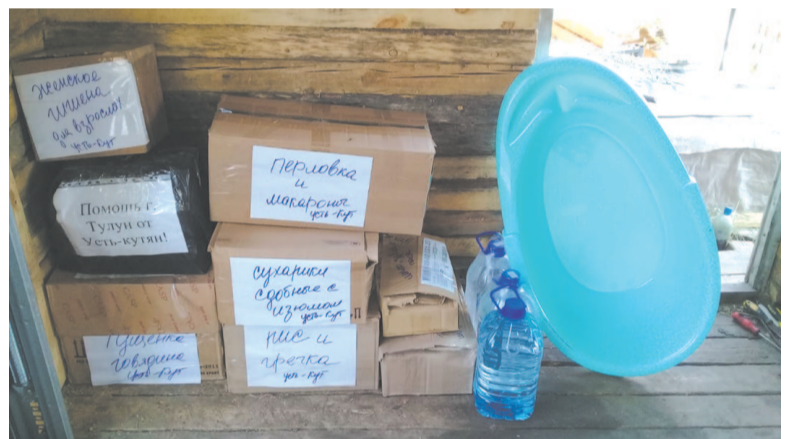
Волонтеры особенно рады, когда жители приносят вещи аккуратно упакованными