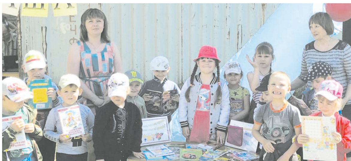
Устькутяне приглашаются в летний читальный зал микрорайона РЭБ

На летней площадке для чтения можно взять журналы и газеты, книги самых разных жанров и направлений: повести, романы, рассказы,