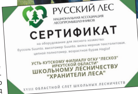
Школьное лесничество города Усть-Кута признано лучшим ассоциацией «Русский лес»

вала впервые. Мы жили в очень красивом месте: на базе отдыха «Лукоморье», где повсюду расположены деревянные скульптуры. Насыщенная программа,