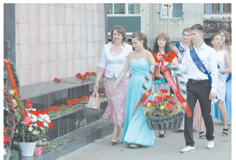
По традиции от каждой школы были возложены цветы и венки к мемориалу нашим соотечественникам, павшим в годы ВОВ