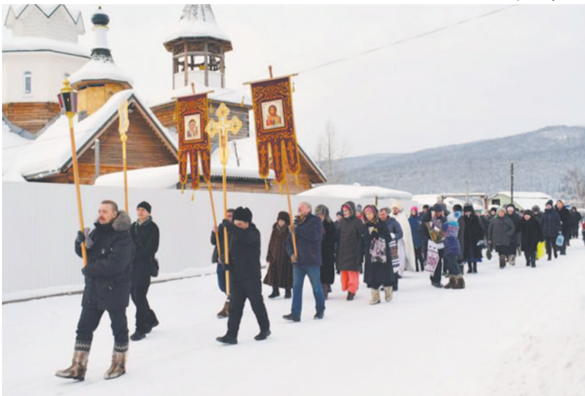
Крестный ход в день Крещения Господня.

щенное Писание. А зачем? К Иоанну приходили люди с близлежащих территорий, многие – для того, чтобы отмыть свои грехи. Любый человек понимает, что он несовершенен. Рождается как маленький ангелочек. Но проходит время, и как бы хорошо его ни воспитывали, ограждали от всего злого и неприятного, он так или иначе соприкасается внутри себя с какими-то несовершенствами. Это происходит от того, что он приобщён к греху: маленькому, большому. Не все убийцы, не все воры. Но у каждого есть какой-то недостаток, к примеру раздражительность, осуждение.