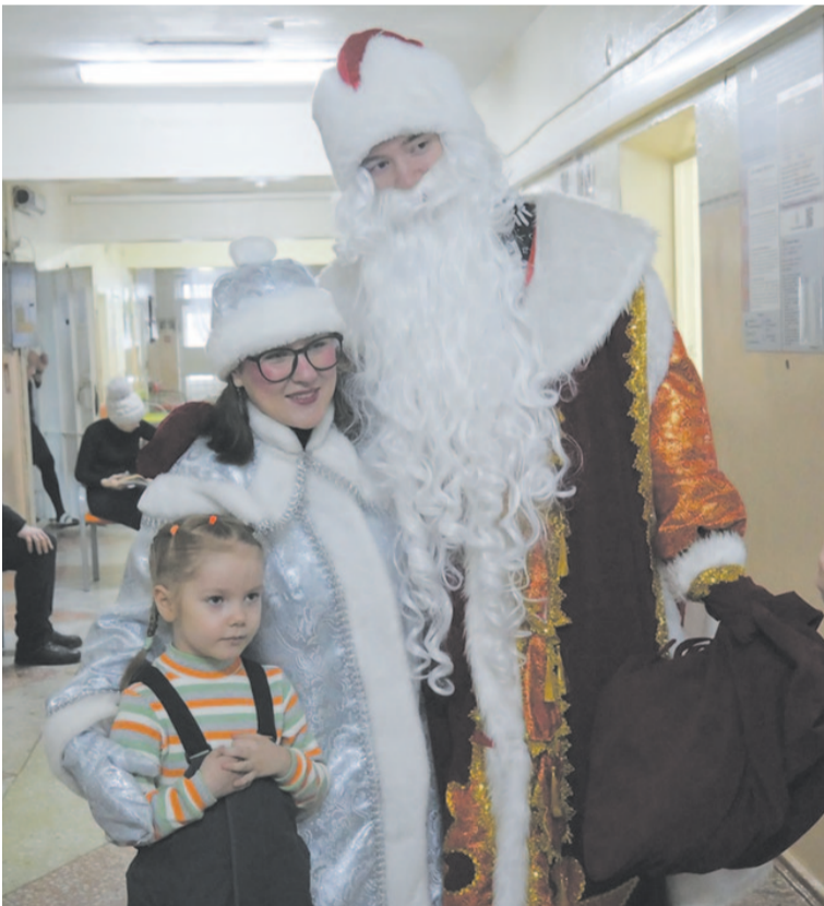
«Бамовцы» устроили сюрприз.