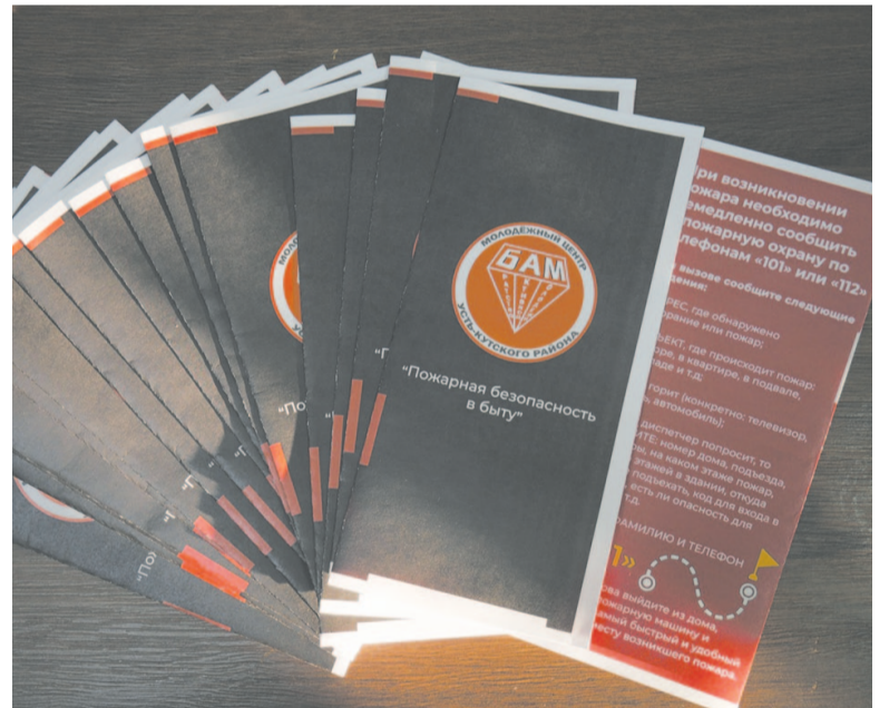
Памятки рассказывают о мерах безопасности.