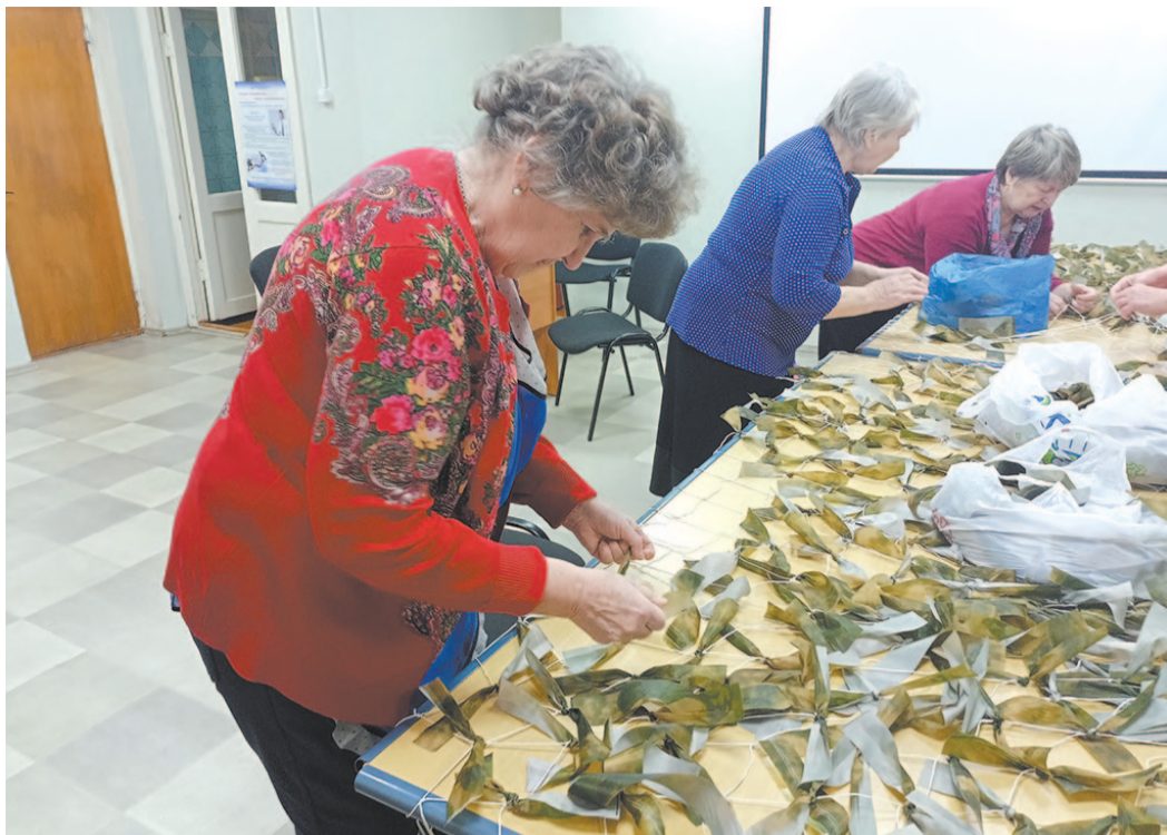
Волонтеры собираются постоянно.