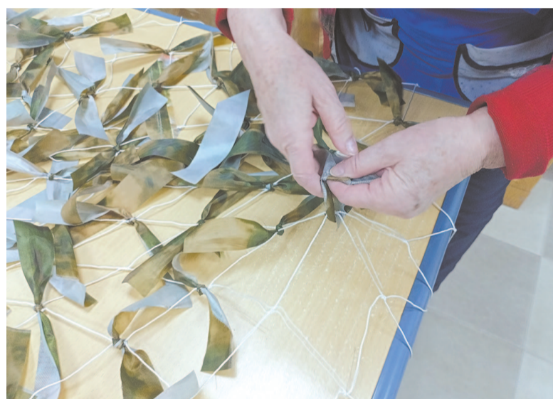
Плетение сетей — работа кропотливая.

Воспитанники школы тоже принимают участие, но заливку преподаватели делают сами: работа с горячим парафином для детей опасна. Сейчас уже сделали