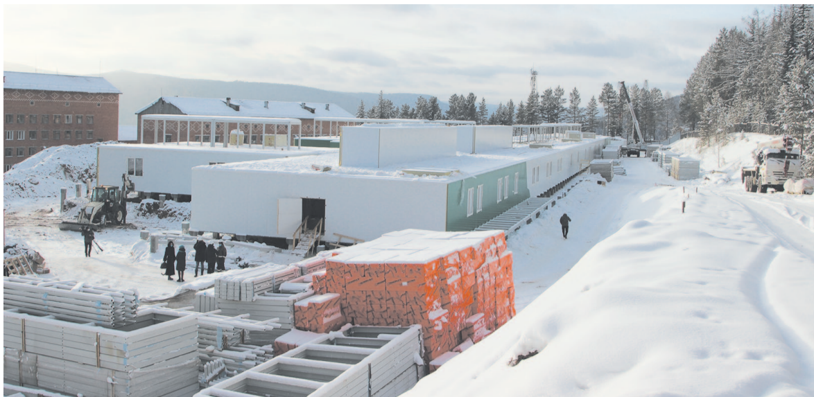
На объекте быстрыми темпами продолжаются работы