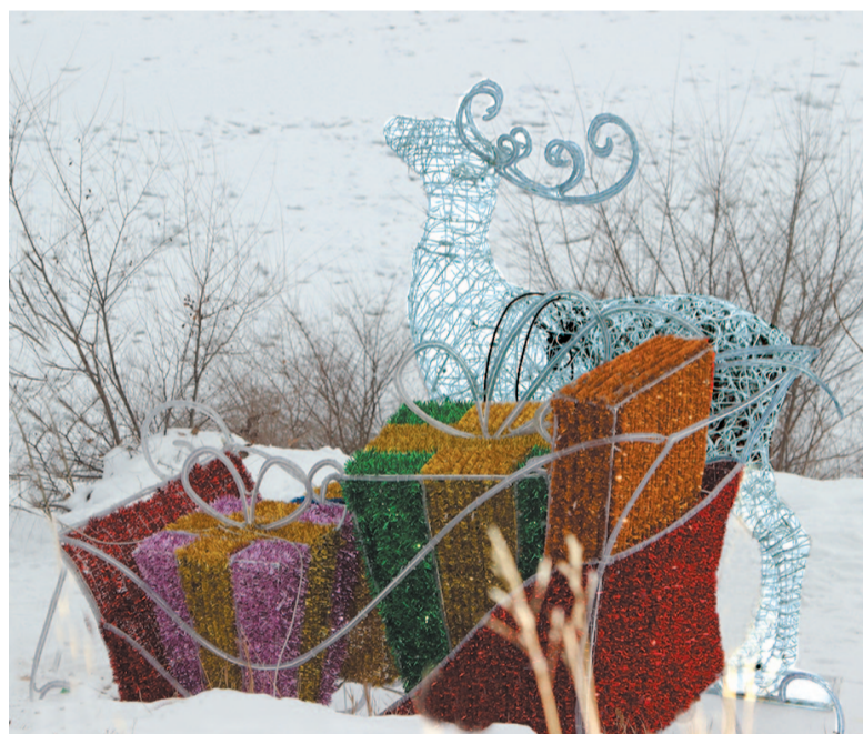
«Явись, лесной олень, по моему хотению!..»