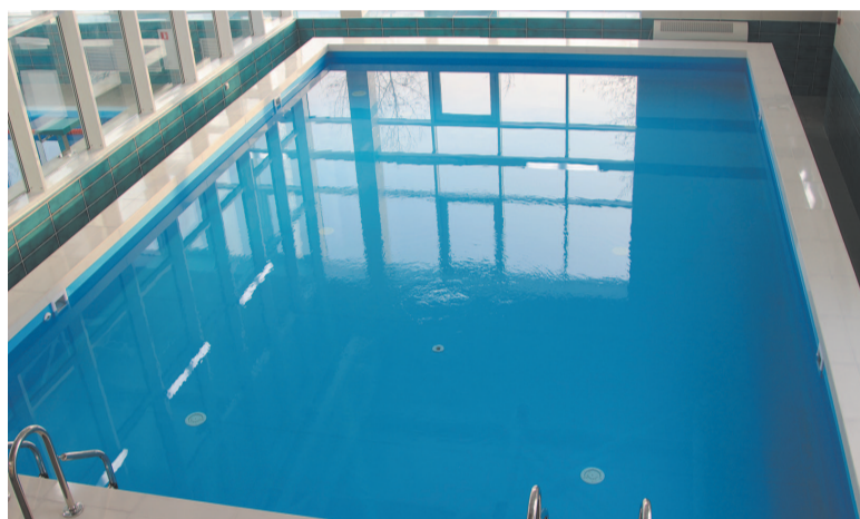
Малая чаша бассейна площадью шесть на 10 метров