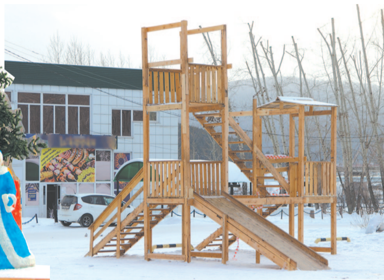
Нет забот у детворы: на ледянках, да с горы!