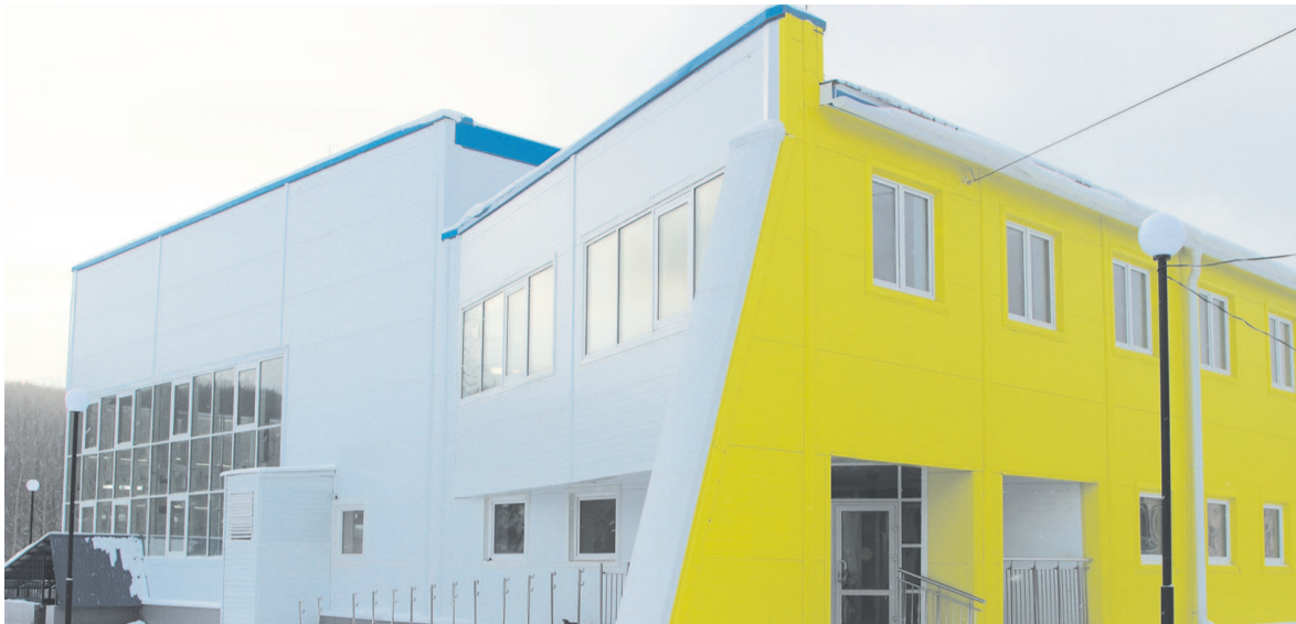
Работы в здании и на прилегающей территории выполнены в срок