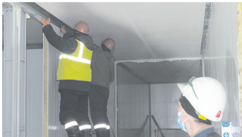
В процессе установки перегородок будущих помещений