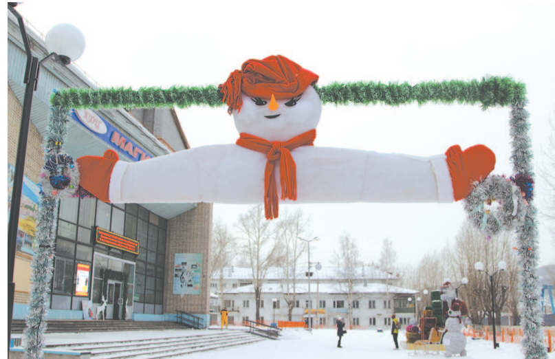
Территорию у РКДЦ «Магистраль» начали украшать ещё в ноябре. На арке, увитой мишурой, – снеговик.