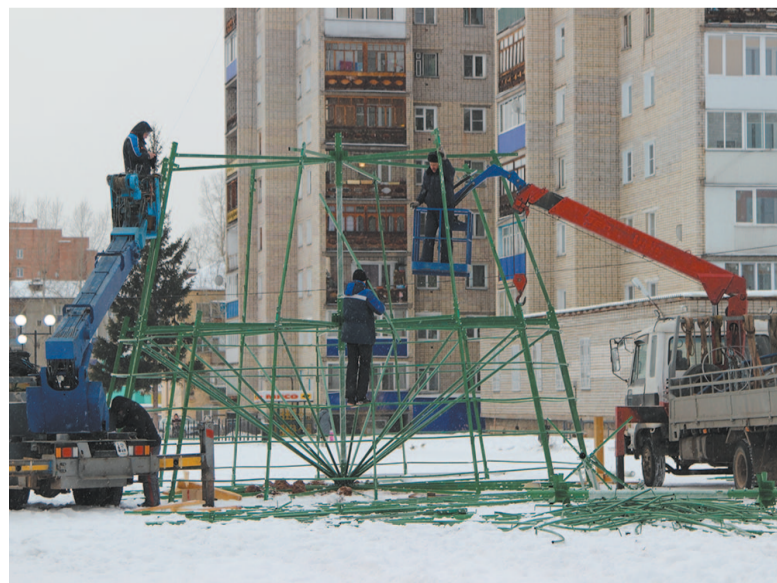
В этом году ёлку решили установить за речным вокзалом. Раз – собрали каркас.