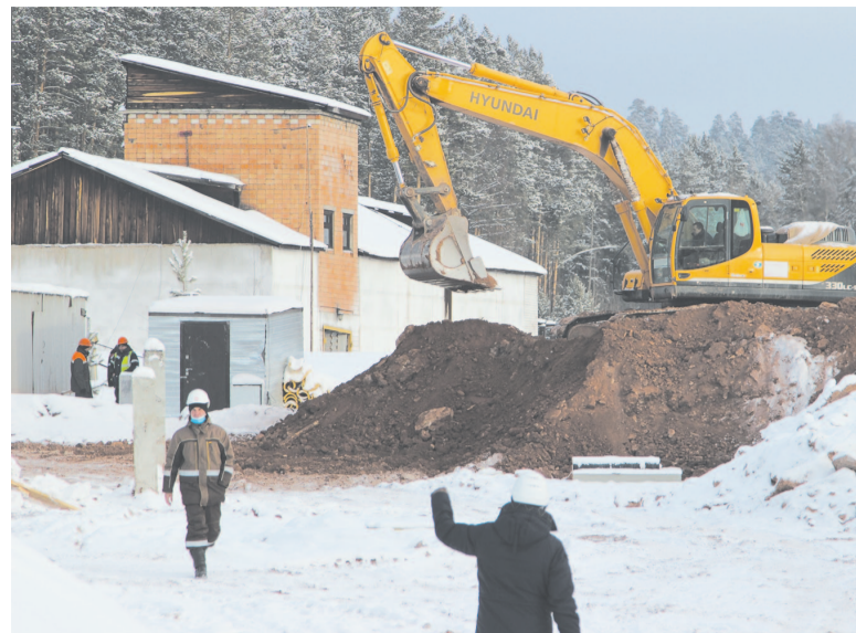
Подготовка к монтажу пожарных ёмкостей