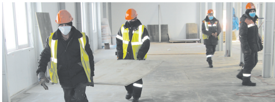
Настил половое покрытие – дело трудоёмкое и ответственное