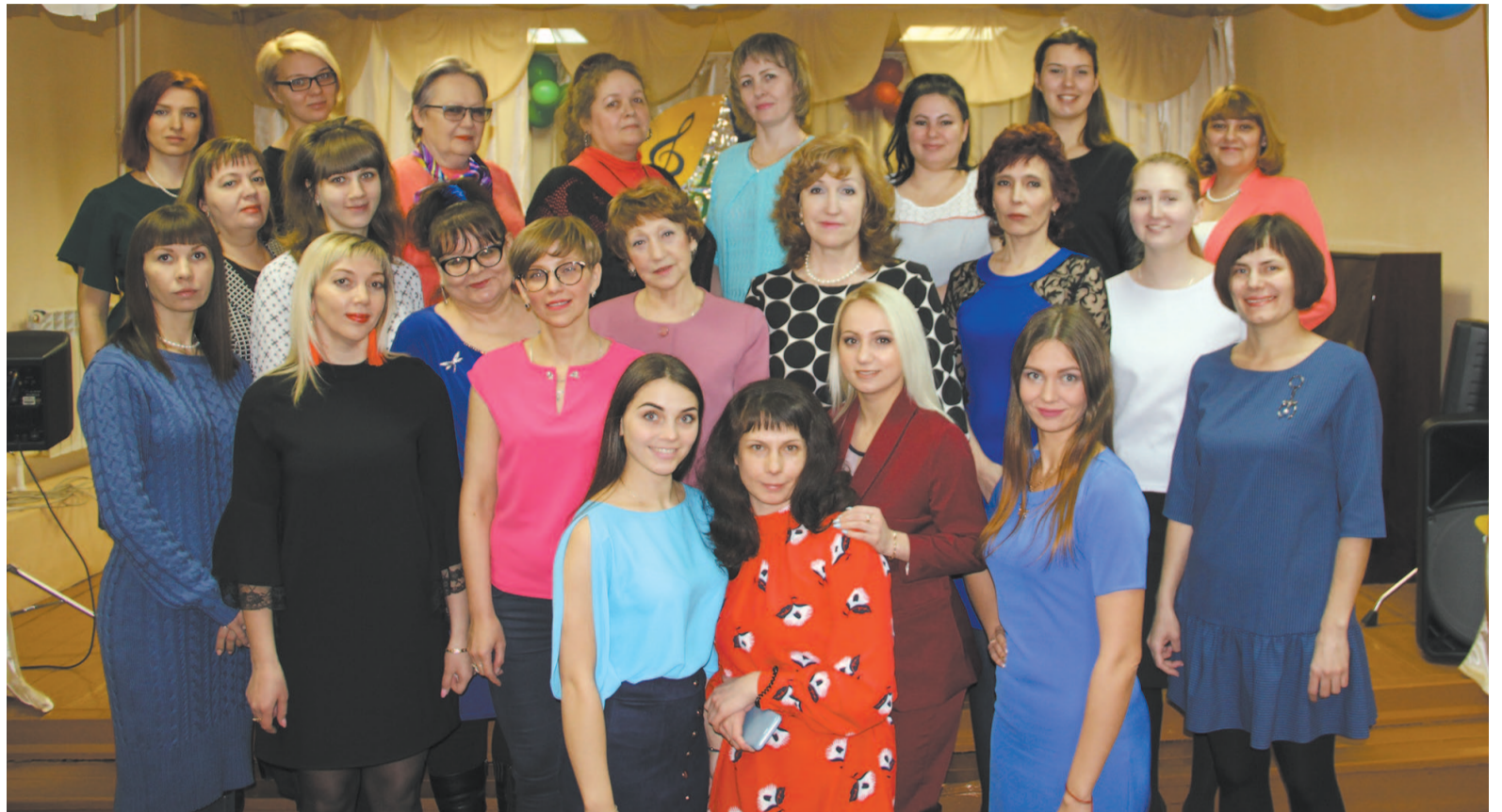
Коллектив Детской школы искусств более полувека приобщает устькутян к прекрасному. Преподаватели ДШИ постоянно совершенствуются, овладевают новыми технологиями.

Дистанционный режим обучения ещё раз подтвердил, что при овладении исполнительскими или художественно-практическими навыками очень важно, когда преподаватели «вживую» показывают приёмы игры на музыкальном инструменте, а также техники