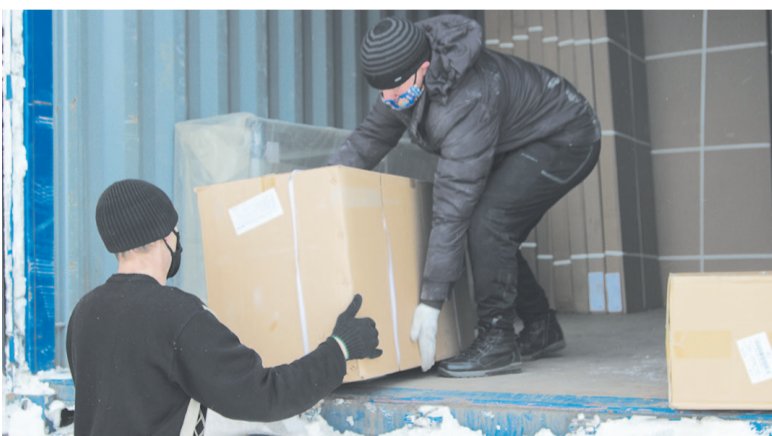
Получена первая партия оборудования для оснащения