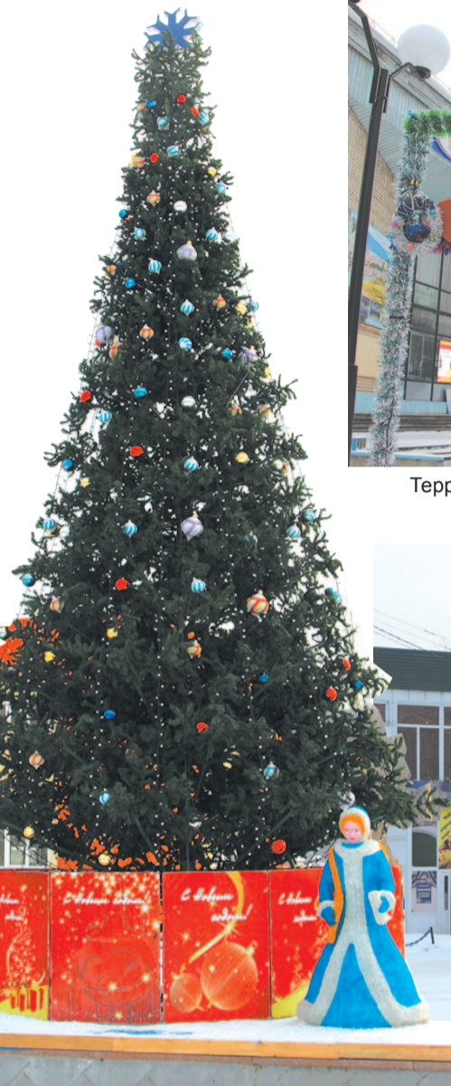
Зелёная красавица на площади ДК «Речники». С пушистых веток свисают стеклянные шары.

Остроносые сосульки, фонарики, белочки... Новогодних игрушек не счесть, раньше их масте-