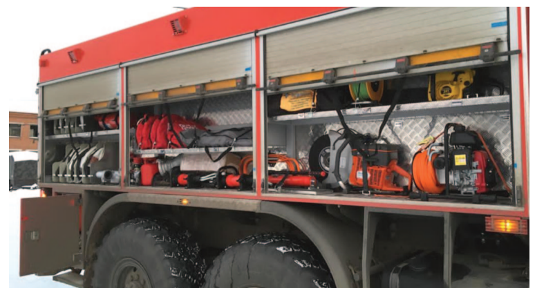
Проходимость автомобиля и его оснащение значительно сокращают сроки оказания помощи при ЧС