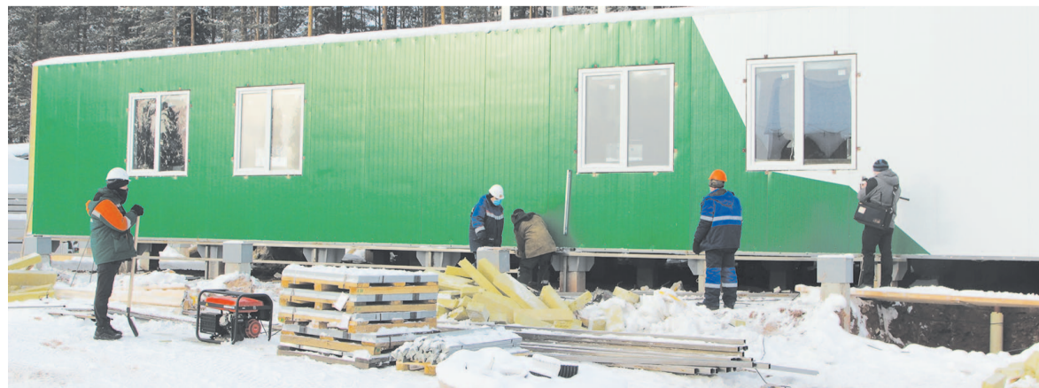
Внешняя отделка корпуса на стадии завершения