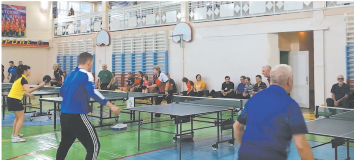
Наши теннисисты растут профессионально, занимая призовые места в соревнованиях различного уровня