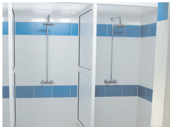
Женская и мужская душевые. Просто и со вкусом.