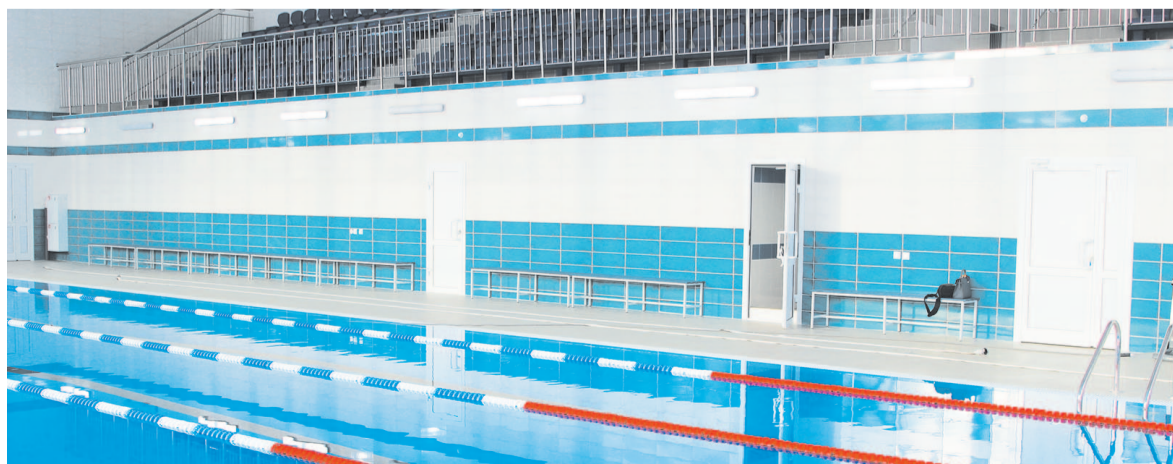
Бассейн ждёт спортсменов и любителей плавания