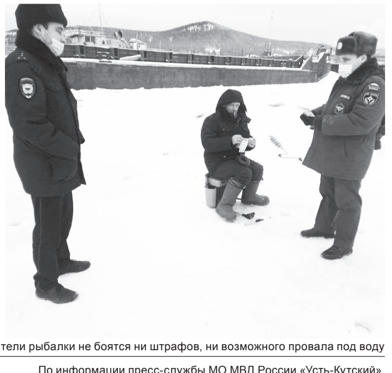
По информации пресс-службы МО МВД России «Усть-Кутский».

Безопасным для человека считается лёд толщиной не менее 10 сантиметров. В устьях рек и притоках прочность льда ослаблена. Лёд непрочен в местах быстрого течения, бьющих ключей и стоковых вод, а также в районах произрастания водной растительности, вблизи деревьев и камыша. Если температура воздуха выше 0 градусов держится более трех дней, то прочность льда снижается на 25 процентов. Её можно определить визуально: лёд прозрачный, голубого, зеленого оттенка – прочный, а белого цвета – в два раза слабее. Лёд, имеющий оттенки серого, матово-белого или желтого цвета ненадежен, обрушивается без потрескивания.