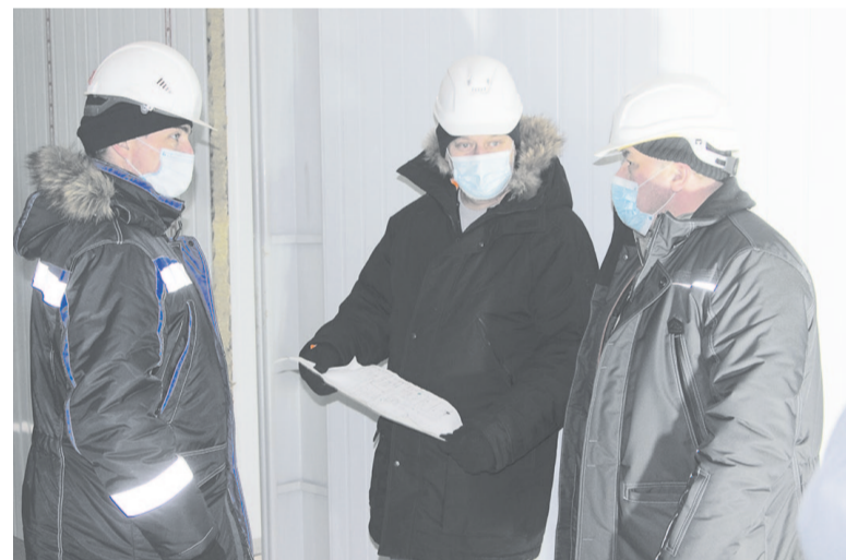
На контроле руководства: планы, графики, ход работ