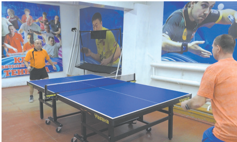
Трёхчасовые тренировки проводятся ежедневно