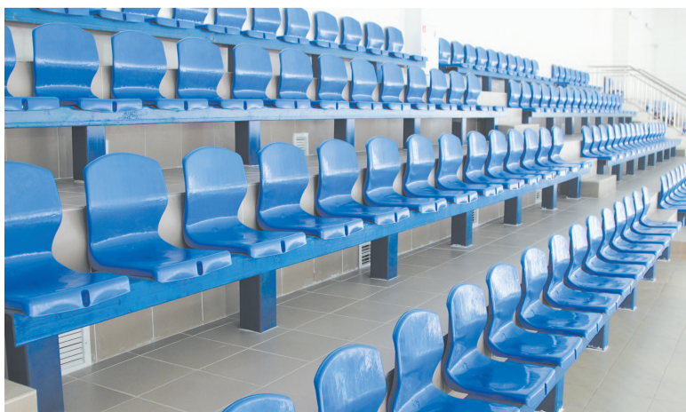
Трибуны для болельщиков на 153 места