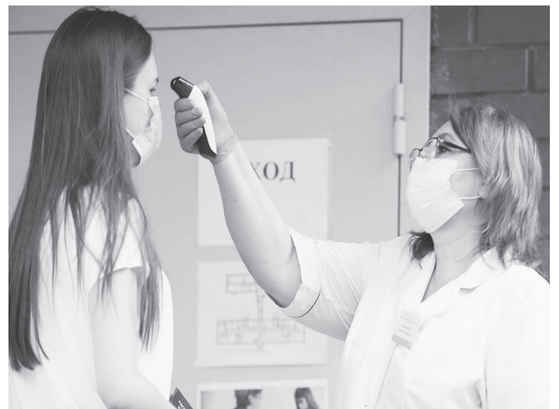
По информации управления Роспотребнадзора по Иркутской области.

Через два-три часа постоянного использования маску надо менять. Одноразовые медицинские маски из нетканого материала не подлежат повторному использованию и какой-либо обработке. В домашних условиях использованную одноразовую медицинскую маску необходимо поместить в отдельный пакет, герметично закрыть его и лишь после этого выбросить в мусорное ведро.