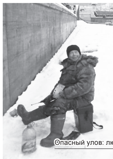
Опасный улов: любители рыбалки не боятся ни штрафов, ни возможного провала под воду

Одна из самых частых причин трагедий на водоёмах – алкогольное опьянение. Люди неадекватно реагируют на опасность и в случае чрезвычайной ситуации становятся беспомощными. Особенно детям, выходя на лёд, нужно быть крайне внимательными и соблюдать меры безопасности.