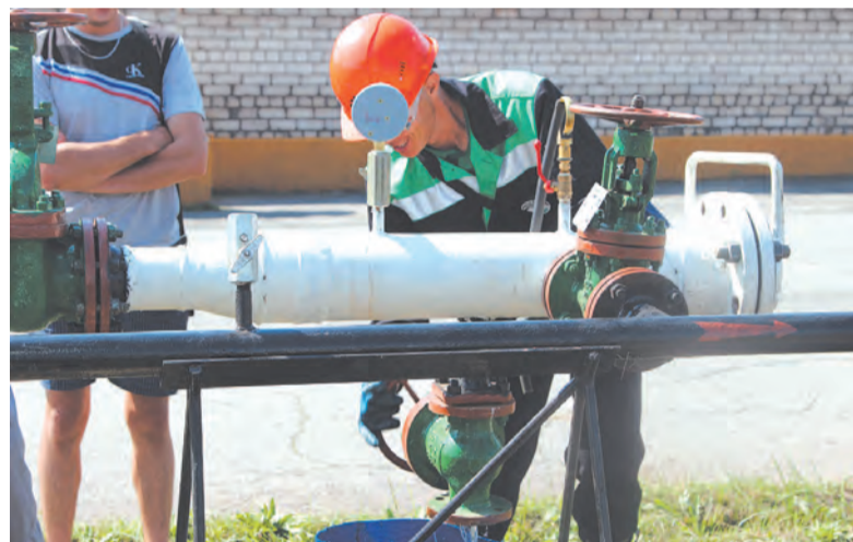
Выполнение упражнения по очистке внутренней полости трубопровода, номинация «Слесарь аварийно-восстановительных работ».