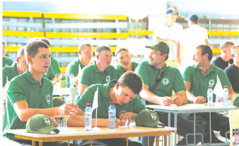
Теоретический этап конкурса «Лучший по профессии-2017».

«Каждый год участвую в этом конкурсе, и номинаций с каждым годом все больше, что только радует. Это хорошая практика для совершенствования своего мастерства и удобная площадка для обмена опытом среди участников».