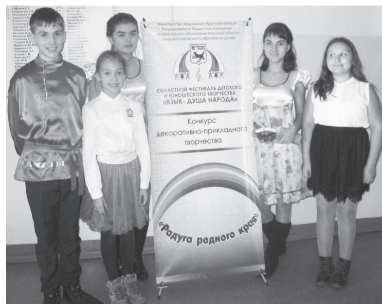
Ребята из Центра дополнительного образования УКМО принимали участие в конкурсе декоративно-прикладного творчества «Радуга родного края».