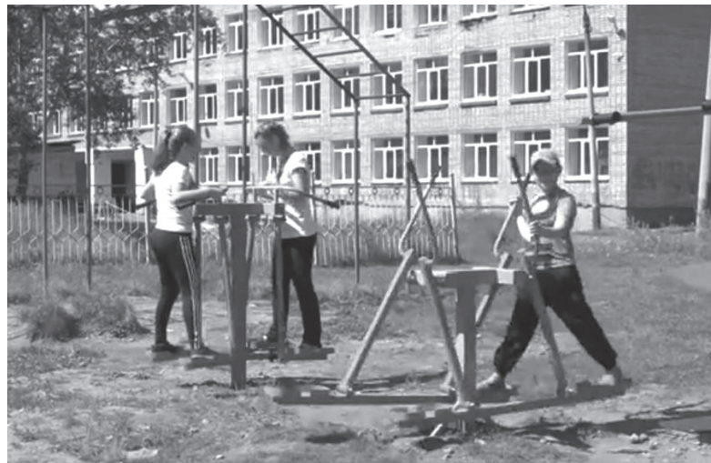
Новые тренажеры около школ Усть-Кута.

– Уличные тренажеры нужны, чтобы поддерживать себя в форме. Тем более возле школы – можно будет заниматься на уро-