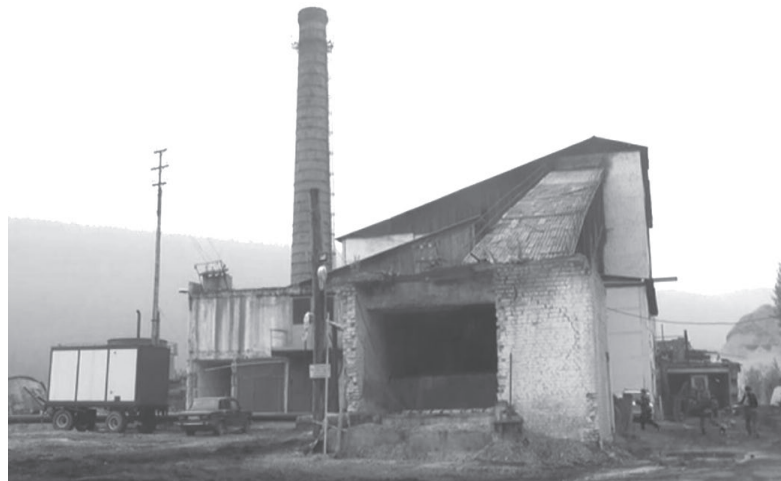
Котельная п. Янталь готовится к отопительному сезону.

В детском саду уже демонтировали старую отопительную систему, чтобы установить новые трубы и радиаторы отопления.