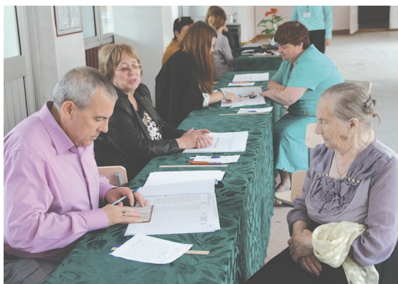
93 года не помеха, чтобы прийти на выборы!