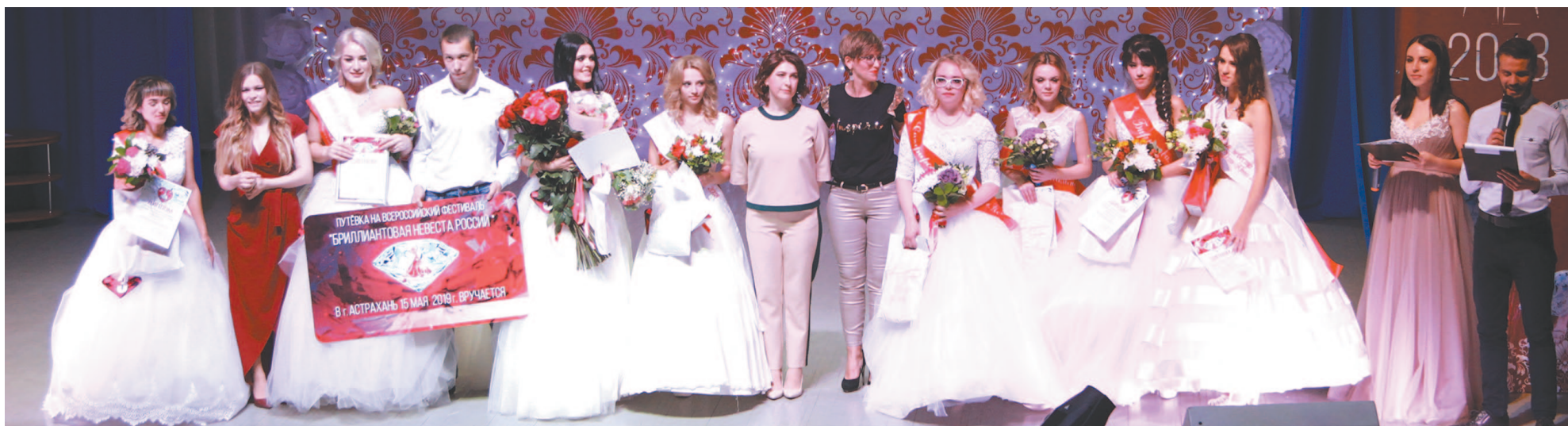
Церемония закрытия фестиваля «Бриллиантовая невеста г. Усть-Кута-2018».