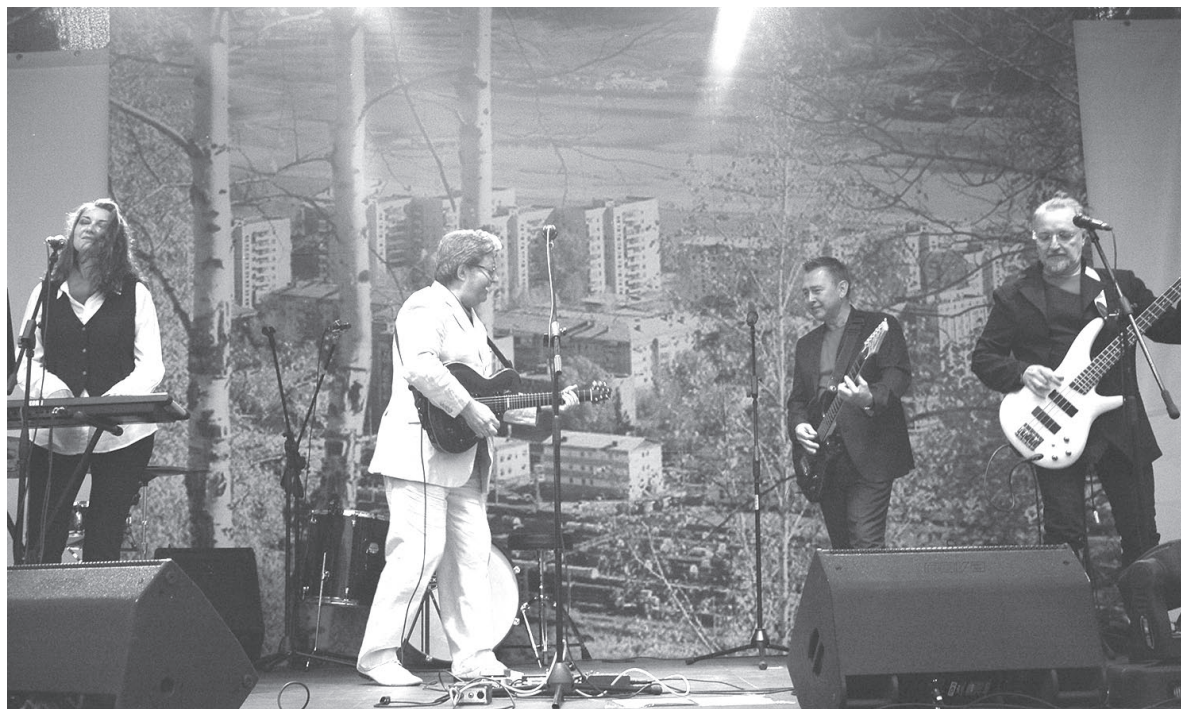
Гости города исполняют «пламенные» песни.

— Спасибо. Я искренне люблю Усть-Кут: люди здесь необыкновенные и отзывчивые. Буду рад побывать здесь снова.