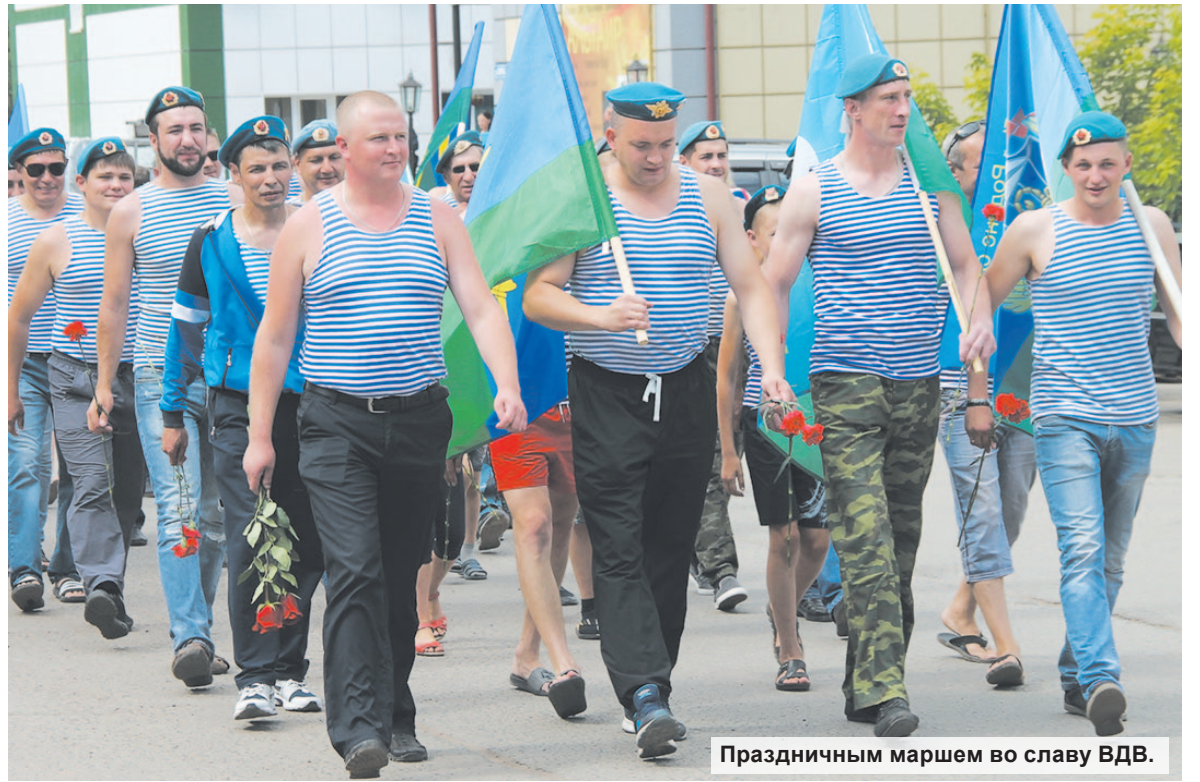
Праздничным маршем во славу ВДВ.