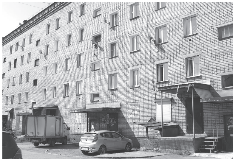
В доме № 54 по ул. Кирова оперативно устранили проблему.

ботают сантехники, в это время он остается открытым. Когда они заканчивают, то запирают замок изнутри и выходят через другой подвал, закрывая его снаружи. Решетка с замком стоит здесь уже