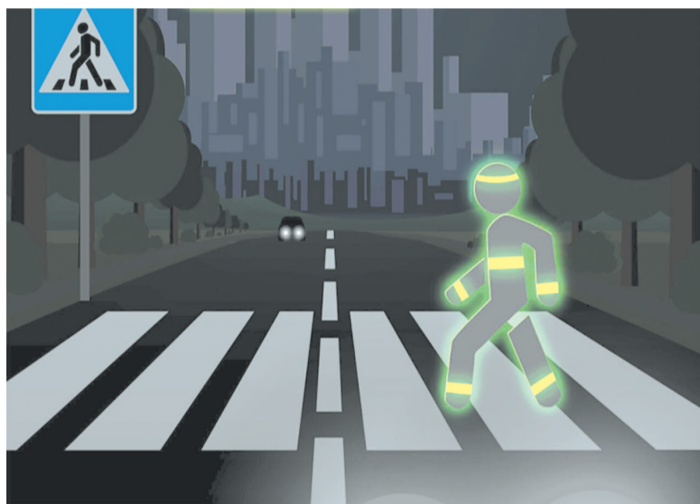
Светоотражатели делают пешехода гораздо заметнее.