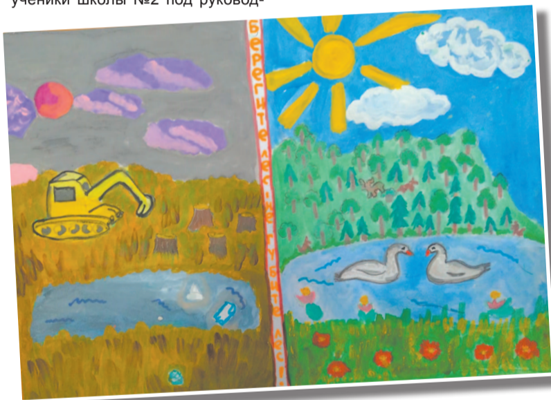
Агитационная листовка. Автор Черновская Маша, 8 лет, МОУ СОШ№2.

Николай Чупров