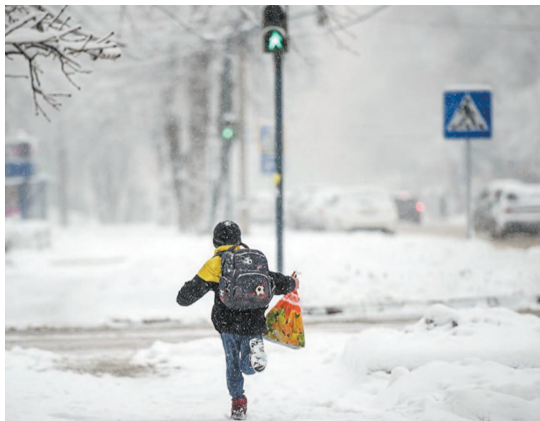
Ни в коем случае не бегайте через проезжую часть, даже на пешеходном переходе.