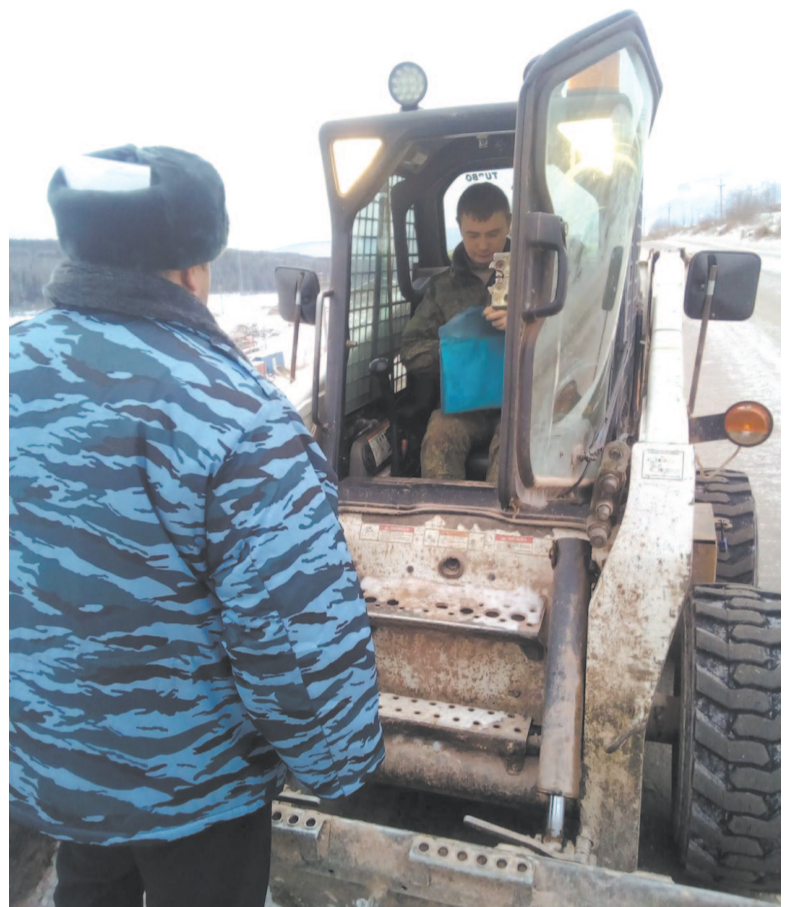
Во время операции «Колея» проводились профилактические беседы.

Проверку законности сбора и заготовки валежника осуществляют государственные лесные инспекторы. При выявлении нарушений