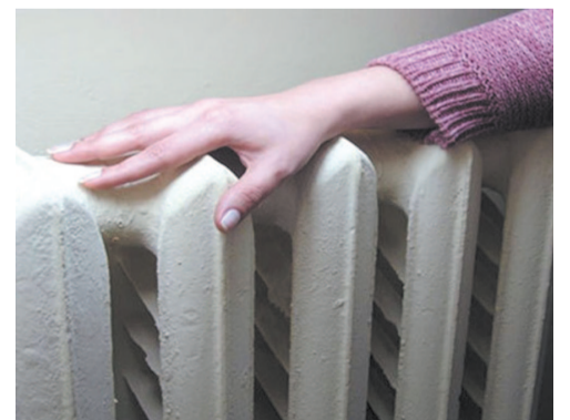
Если температуры ниже нормы, обратитесь в управляющую компанию.

— в Службу государственного жилищного и строительного надзора Иркутской области; — в суд, чтобы потребовать возместить вам убытки (к примеру, если в холода вы пользовались обогревательными приборами и счет за электроэнергию существенно пре-