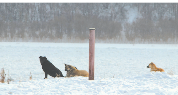
Часть бродячих собак отловили в нескольких районах города.

О местонахождении агрессивных и потенциально опасных бродячих собак можно сообщить по телефону 8(39565)5-80-58 или на электронную почту комитета по природным ресурсам и сельскому хозяйству. prigodresurs@admin-ukto.ru . Если же вы пострадали от нападения агрессивной собаки, следует сообщить об этом в дежурную часть МО МВД России «Усть-Кутский»: 8 (39565) 5-01-43.