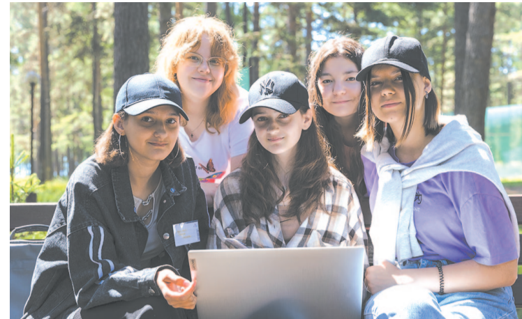
Авторы проекта приглашают новых участников.

Екатерина Морозова, МИА «Хорошие новости»