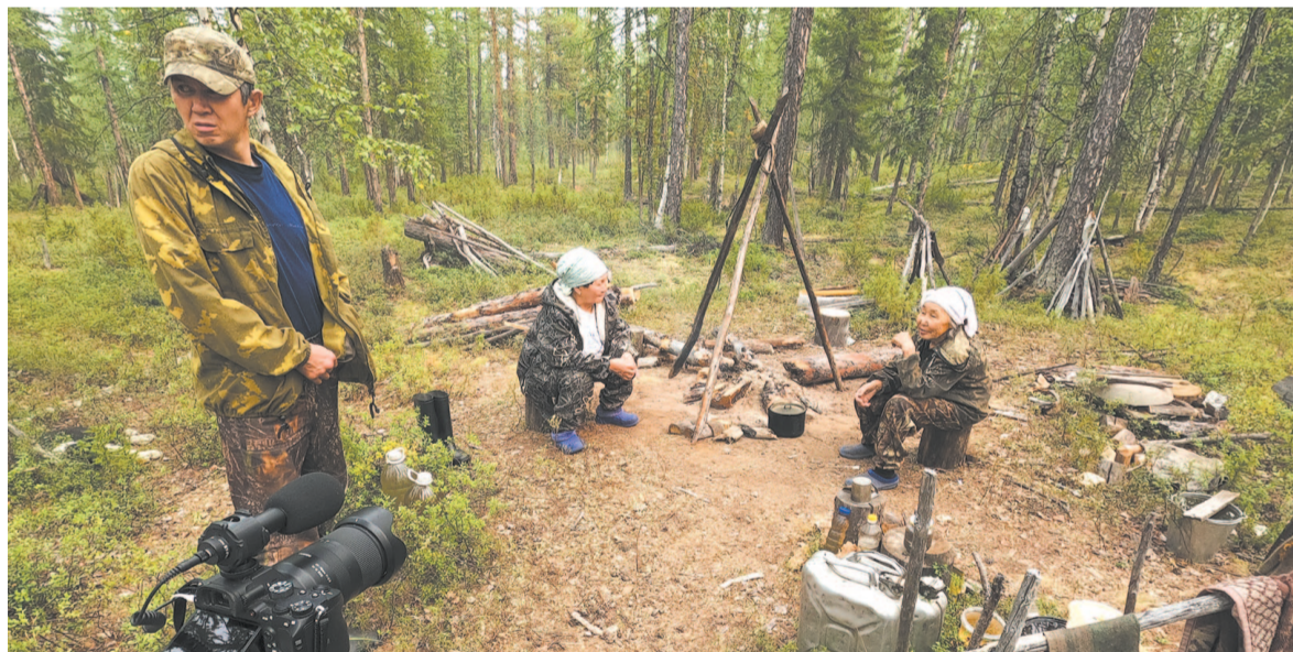
Выставка в Усть-Кутском историческом музее основана на этнографическом материале.