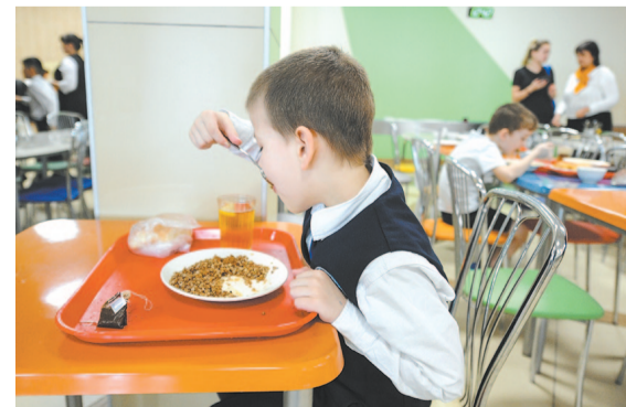
Бесплатным питанием обеспечат учеников и государственных, и частных школ.

Нормы обедов для школьников с соблюдением требований по детскому питанию в кратчайшие сроки утвердят специалисты из регионального министерства социального развития, опеки и попечительства.