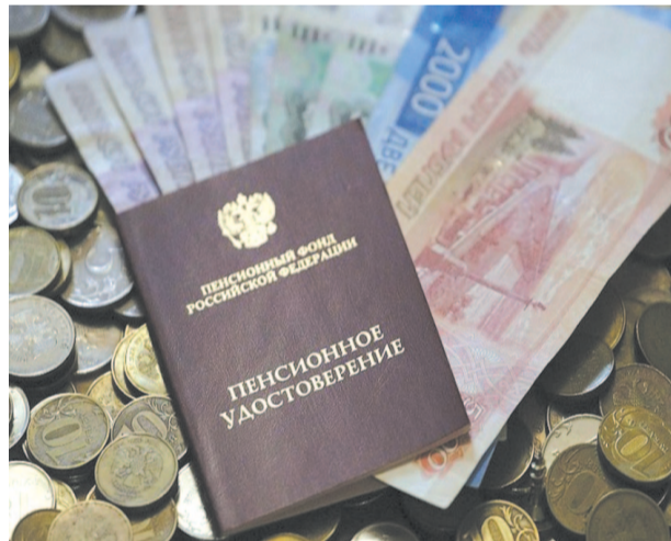
В Госдуму внесут законопроект, который предусматривает выплату в конце года дополнительной страховой пенсии.

Законопроект также предусматривает увеличение в два раза фиксированной выплаты к страховой пенсии по старости лицам, достигшим возраста 70 лет. Сейчас такая норма предусмотрена для 80-летних граждан.