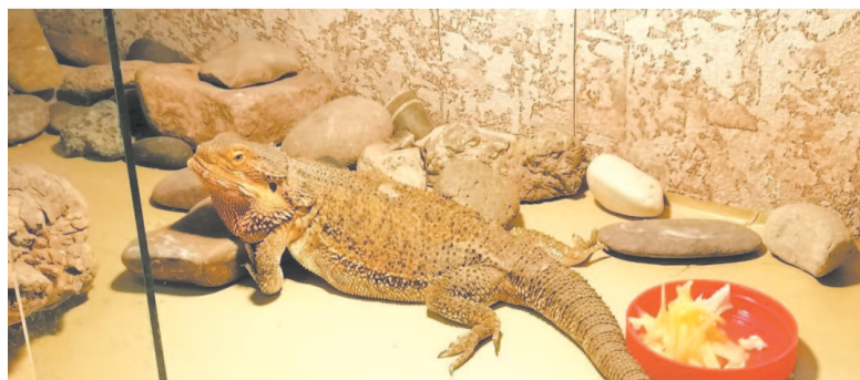
Даже для экзотических животных подходят обычный корм.

Сейчас в зоокабинете Центра содержится более 30 животных. Всем им требуется полноценное, разнообразное питание, поэтому