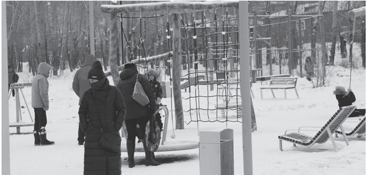
Устькутяне уже осваивают новый парк в Речниках

- Для многодетных семей проезд в маршрутном транспорте становится достаточно накладным, особенно если дети посещают какие-либо кружки и секции. Будет ли решаться вопрос с проездными билетами? К тому же недавно прогремела история о том, что ребёнка высадили из маршрутки на мороз.