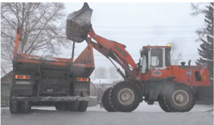
С наступлением зимы техника «Автодора» вышла на улицы.

Осадки выпадают ежедневно, а погодные качели лишь усугубляют ситуацию. Поэтому расчистка одной улицы может затянуться на несколько дней. Уборку ведут согласно установленному графику. При неблагоприятных погодных условиях на улицы выводят всю технику.