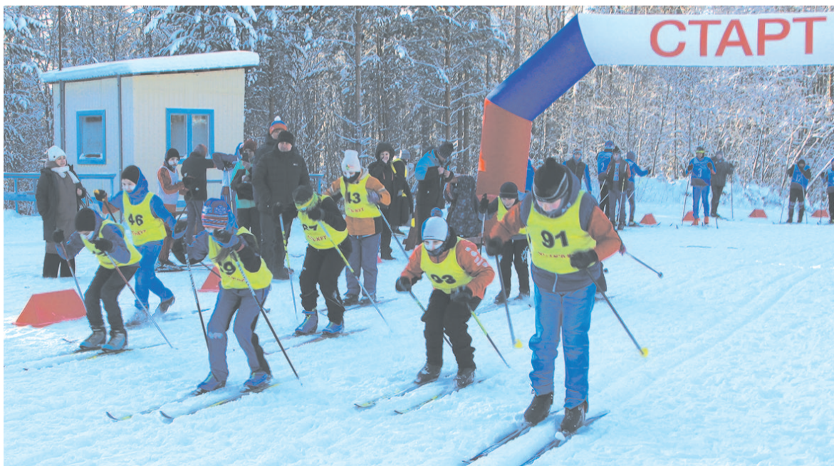
Первыми стартовали участники младшей группы

Напутствие от тренера, последние приготовления, старт. Впереди финиш на дистанциях в полтора, три и пять километров.