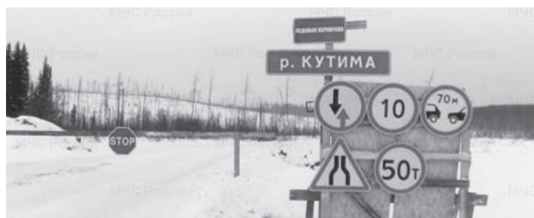
Помните: выезд и выход на лед вне оборудованных зимников опасен для жизни.

Помните: выезд и выход на лед вне оборудованных ледовых переправ опасен для жизни. Лёд окончательно встал ещё не на всех реках. Так, на Лене толщина ледового покрытия составляет всего 10-15 сантиметров. Специалисты предупреждают: определять прочность льда визуально и выходить на него в несанкционированных местах недопустимо. Категорически запрещено проверять его прочность ударом ноги, прыжками и т.п. Особенно следите за детьми вблизи водоёмов.