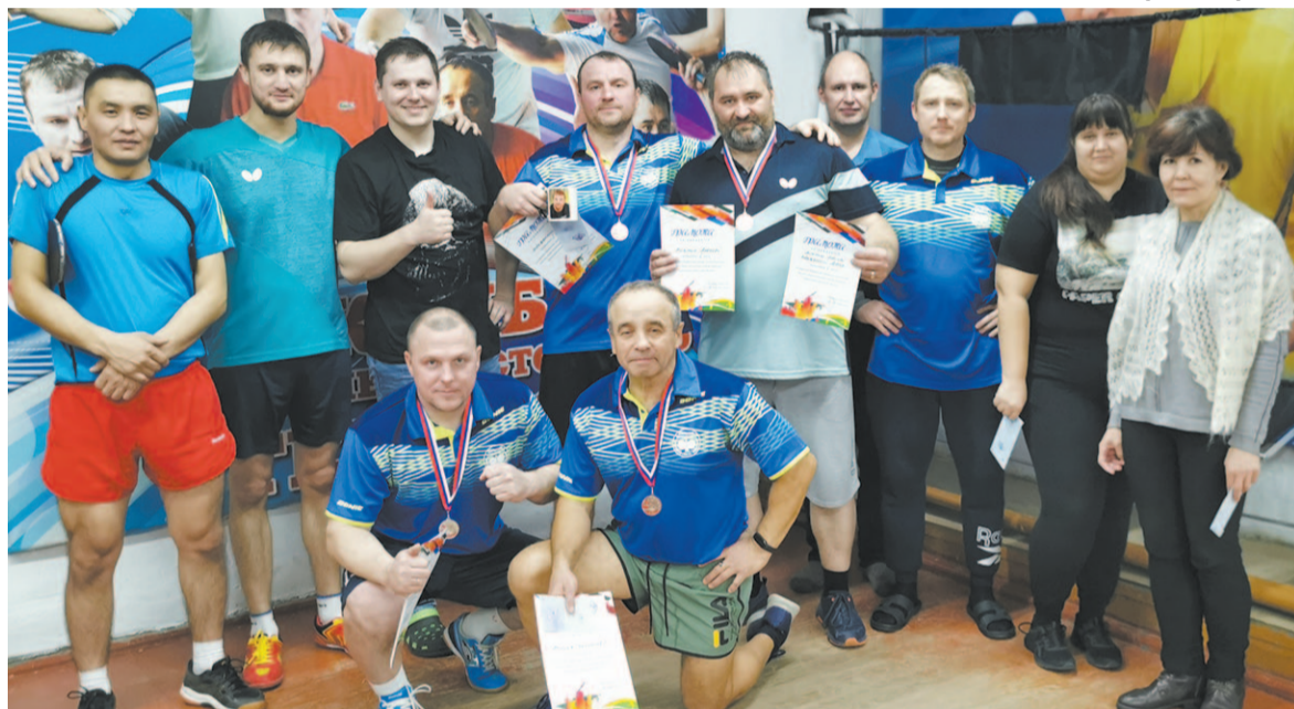
Любители настольного тенниса провели командный турнир.