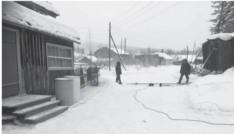
В посёлке Артемовском Бодайбинского района вторую неделю устраняют последствия аварии на теплотрассе.