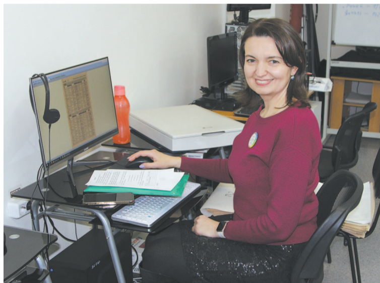
На компьютерные курсы приходят люди разных возрастов.

Записаться на курсы и получить дополнительную информацию можно по телефону 8(39565)5-76-77.