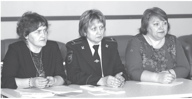
Работа площадки «Ответственное родительство».

Первым и главным из рассматриваемых вопросов стало обучение по адаптированной программе (что это такое и кто по ней должен обучаться?). Специалисты объяснили, что адаптированная программа обозначает не что иное, как индивидуальный подход к ребёнку (ранее такие программы предназначались для обучения в классах VII – VIII видов). Некоторые из приёмных и опекаемых детей имеют нарушения физического и психического здоровья, программу общеобразовательной школы усваивают с трудом. Причиной может быть как задержка психического развития, так и нарушение интеллектуальной деятельности, причём при разных диагнозах образовательные программы разные. По какой из них следует учиться ребёнку, определяет медико-психолого-педагогическая комиссия. Однако во время обсуждения вопроса выяснилось, что приёмные родители и опекуны зачастую не понимают, что