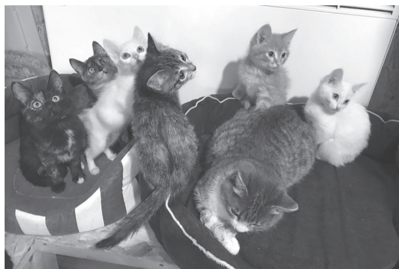
Кошки и котят ждут новых хозяев.

Подготовила Марина Новикова.