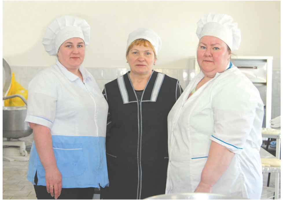
Коллектив столовой ОАО «Алроса-Терминал».