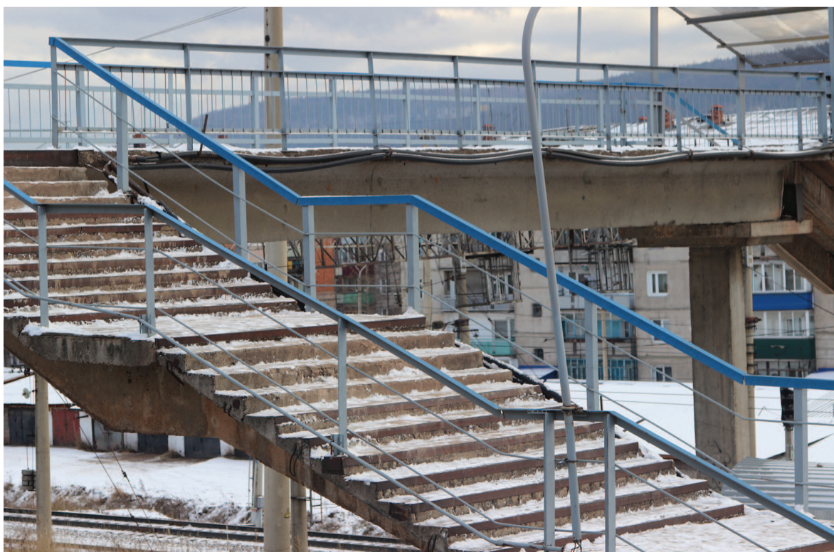
Виадук в микрорайоне Речники после утреннего снежка