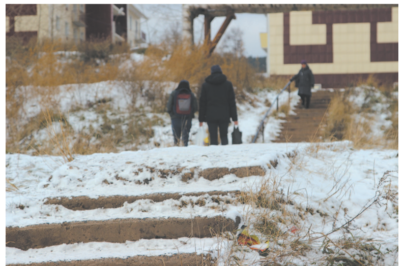
Жителям улицы Халтурина не позавидуешь...