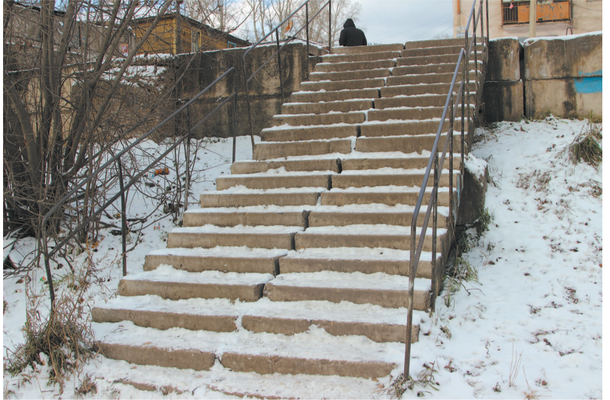
Спуск к остановке «Дзержинская» нужно подчистить

...Спуск к остановке «Дзержинская» выглядел, получше, но и его не мешало бы подчистить. Чтобы настроение у людей было более оптимистичным, а не таким, как у одной прохожей: «Я в этом городе ничему не удивляюсь!».