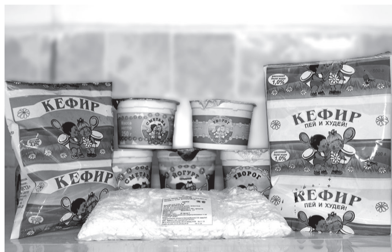
Кефир в ярких пакетиках, йогурт, творог, сметана – продукция АО «Вита» нравится и взрослым, и детям.