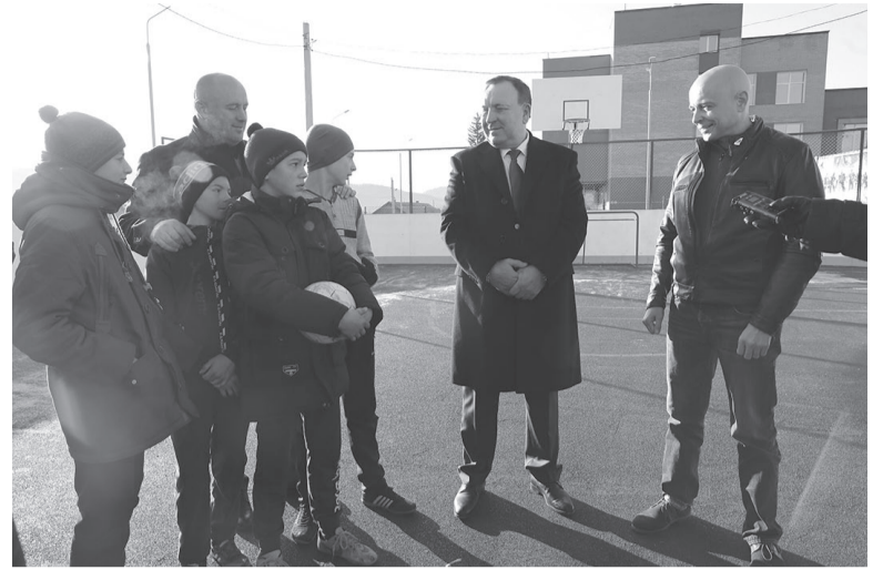
Новая спортплощадка в п. Горячий Ключ