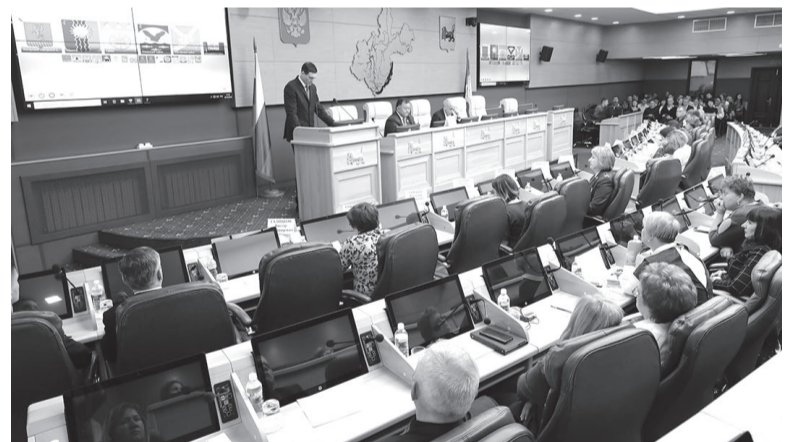
Урок для чиновников

Председатель профильного комитета обратила внимание участников школы на то, что принят закон о переходе на исчисление налогов на имущество физических лиц, исходя из кадастровой стоимости. Переход будет осуществлен с 2020 года. Новые цифры муниципалитеты должны увидеть только в 2021 году, но главная задача сейчас – успеть установить ставки по этим налогам на территории муниципальных образований.