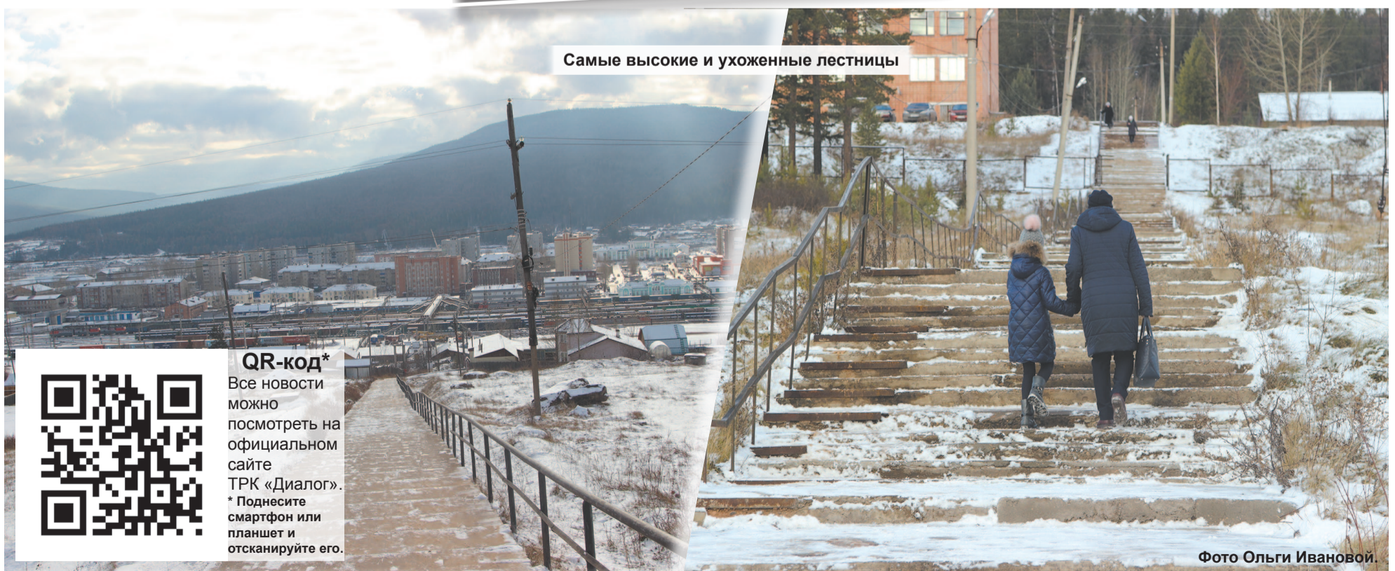
Самые высокие и ухоженные лестницы