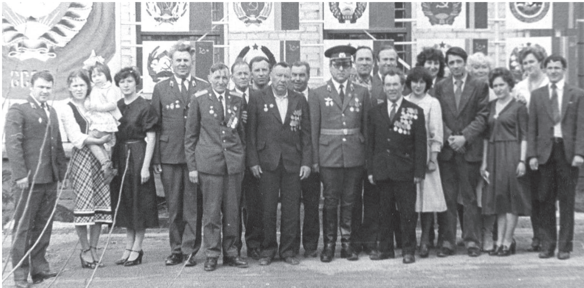
Сотрудники ГОВД и участники Великой Отечественной войны

Какое-то время Янталь и весь верхний подрайон был подведом-