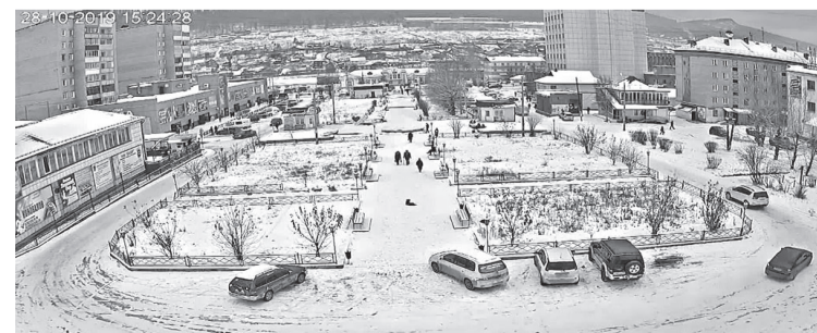
По материалам телепередачи «9 этаж».

Наблюдать за тем, что происходит в городе, в режиме реального времени можно на сайте: 60500.ru.