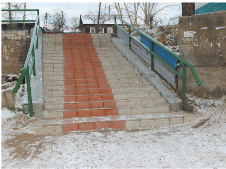
Лестница, ведущая к лицу, – самая чистая