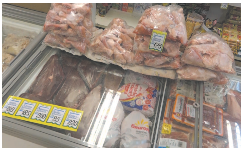
Под пристальным вниманием мясная продукция

Осуществляется контроль над выкладкой молочной продукции, прошло 36 проверок. Продукция без заменителя молочного жира должна иметь соответствующую маркировку; информацию необходимо довести до сведения потребителей.