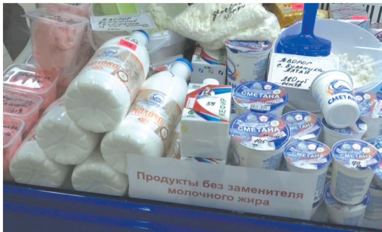
Осуществляется контроль над выкладкой молочной продукции

Чтобы не заболеть сальмонеллёзом, необходимо соблюдать меры предосторожности: не употреблять пищу в заведениях сомнительной репутации, учитывать санитарное состояние помещения, наличие спецодежды и другие факторы. Особое внимание – к точкам общепита, реализующим «еду на вынос»: не известно, кто и в каких условиях её готовит. Выяснить это можно, лишь нагрянув с проверкой, предварительно согласовав с прокуратурой.