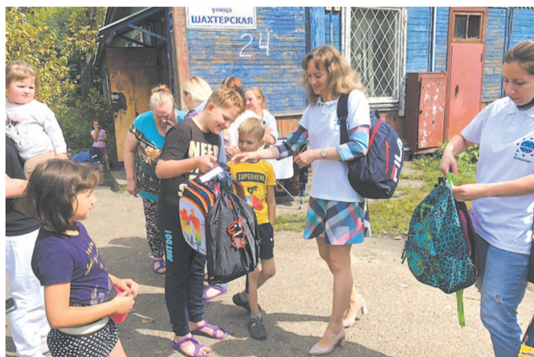
Более 1000 детей получили портфели и канцелярские принадлежности.

екты экологической, творческой и социальной тематики. Фонд специализируется на помощи детям с ОВЗ, поддержке общественных и медицинских организаций, детского спорта, ветеранов войны и труда, пожилых людей, малоимущих и многодетных семей, талантливых детей.