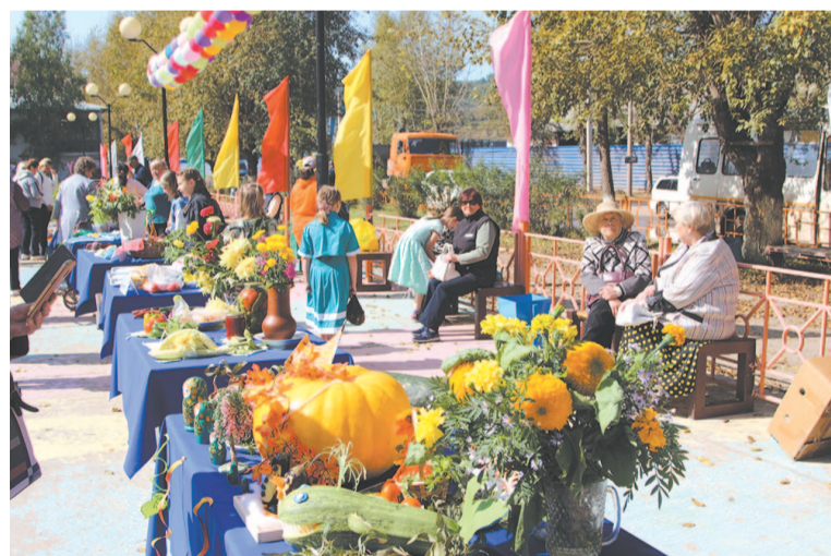
На ярмарке встретились огородники со всего Усть-Кута.