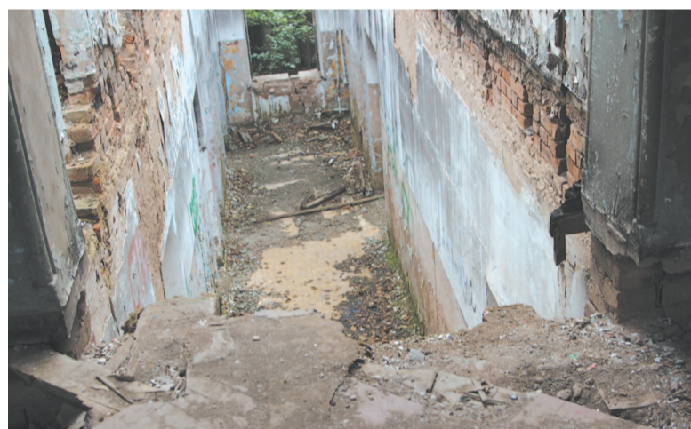
В заброшенные здания можно попасть без проблем.

С одной стороны, надо следить, чтобы у ребенка не возникло впечатление, что мир — это страшное место и лучше вовсе не выходить из комнаты. С другой — поясняя, что опасности существуют, и дать инструкцию, как поступить в той или иной ситуации. Беседы о безопасности должны быть частью повседневного бытового общения, проходить по случаю и между делом.