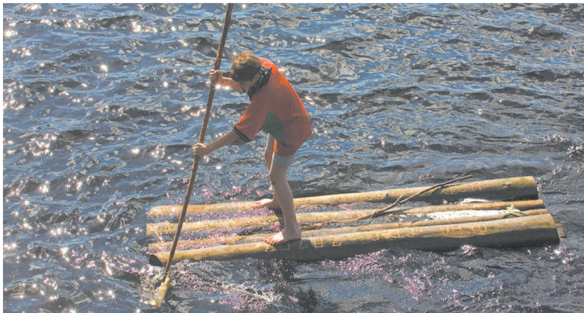
Развлечения подростков зачастую связаны с риском.

Молодые родители нередко задаются вопросом, как человечество умудрилось выжить, если все человеческие дети так старательно пытаются самоубиться, особенно в первые годы жизни. Они суют пальцы в розетки, залезают на подоконники, хватаются за ножи и горячие кастрюли, и кто знает, на что еще они способны, если за ними не следить.