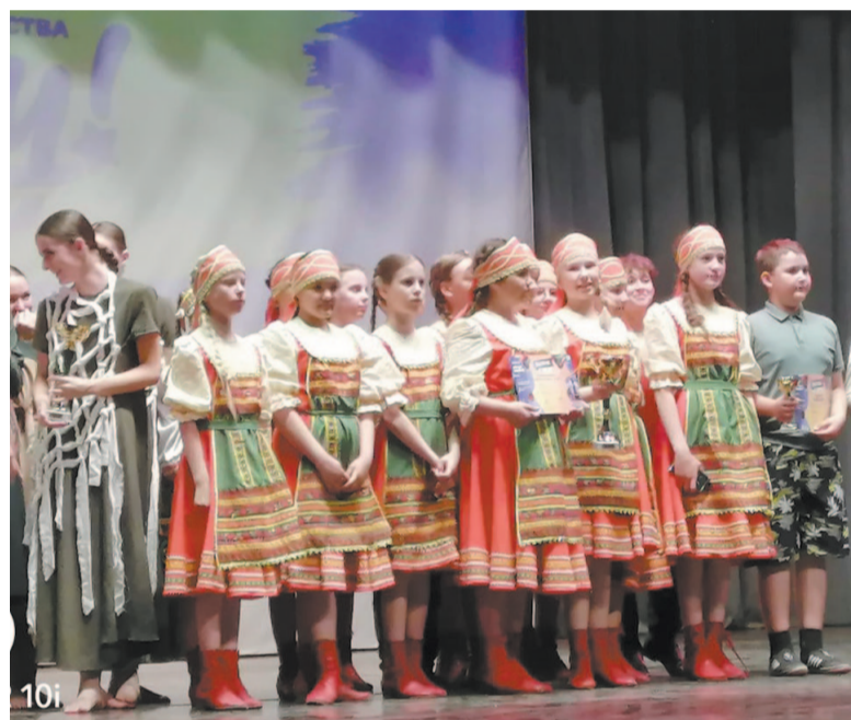
На фестивале «Сердце Сибири».