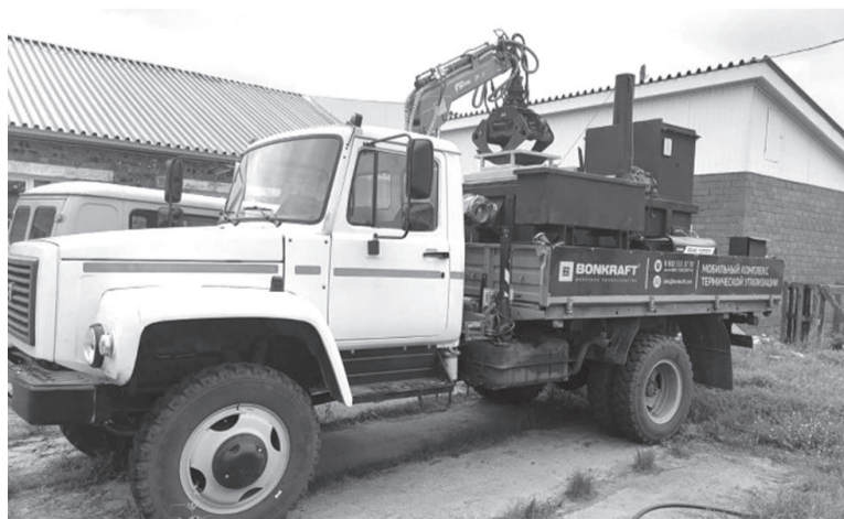
С помощью этого комплекса будут утилизировать павших животных.

Стоимость оборудования составила более 9 миллионов рублей. Комплекс оборудован краноманипуляторной установкой для загрузки инфицированных биологических отходов в камеру сжигания дизельным генератором. Кроме того, автомобили оснащены дезинфицирующим оборудованием, с помощью которого обрабатывается место, где лежал труп павшего животного.