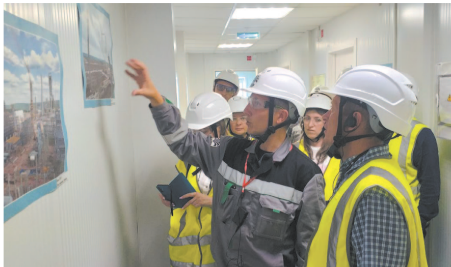
На строительной площадке Иркутского завода полимеров побывали гости из соседнего района.