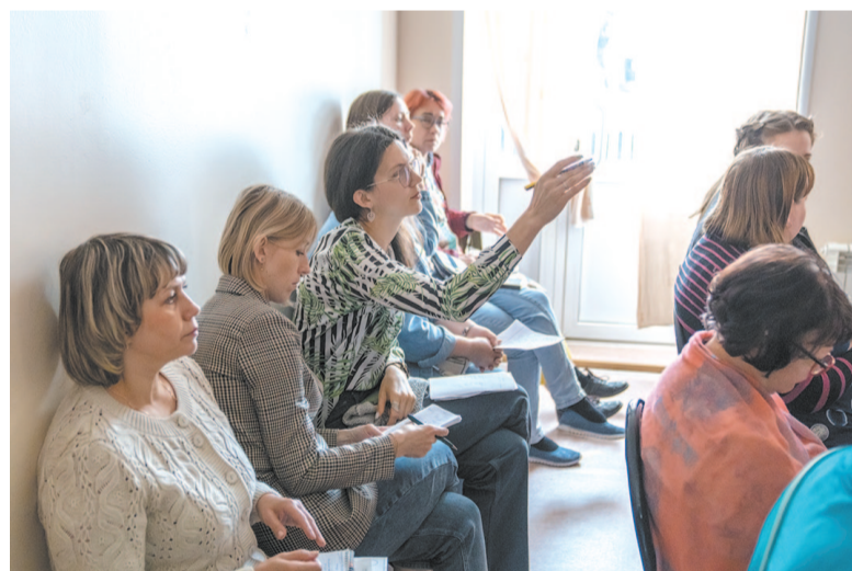
Педагоги ЦДО приняли участие в областной методической сессии.

ющие задумки: асфальтирование центральной дорожки с разметкой для проведения соревнований, обустройство деревянной площадки-сцены у центрального входа и фотозоны, что позволит эстетично и безопасно проводить мероприятия и награждения обучающихся разных категорий, в том числе детей с ограниченными возможностями здоровья и инвалидов. На установленном рядом флагштоке ежедневно поднимается флаг РФ, а на прилегающей стене здания создан арт-объект с изображением эмблемы ЦДО. Благодаря благоустройству улучшились условия безбарьерной среды на территории центра.