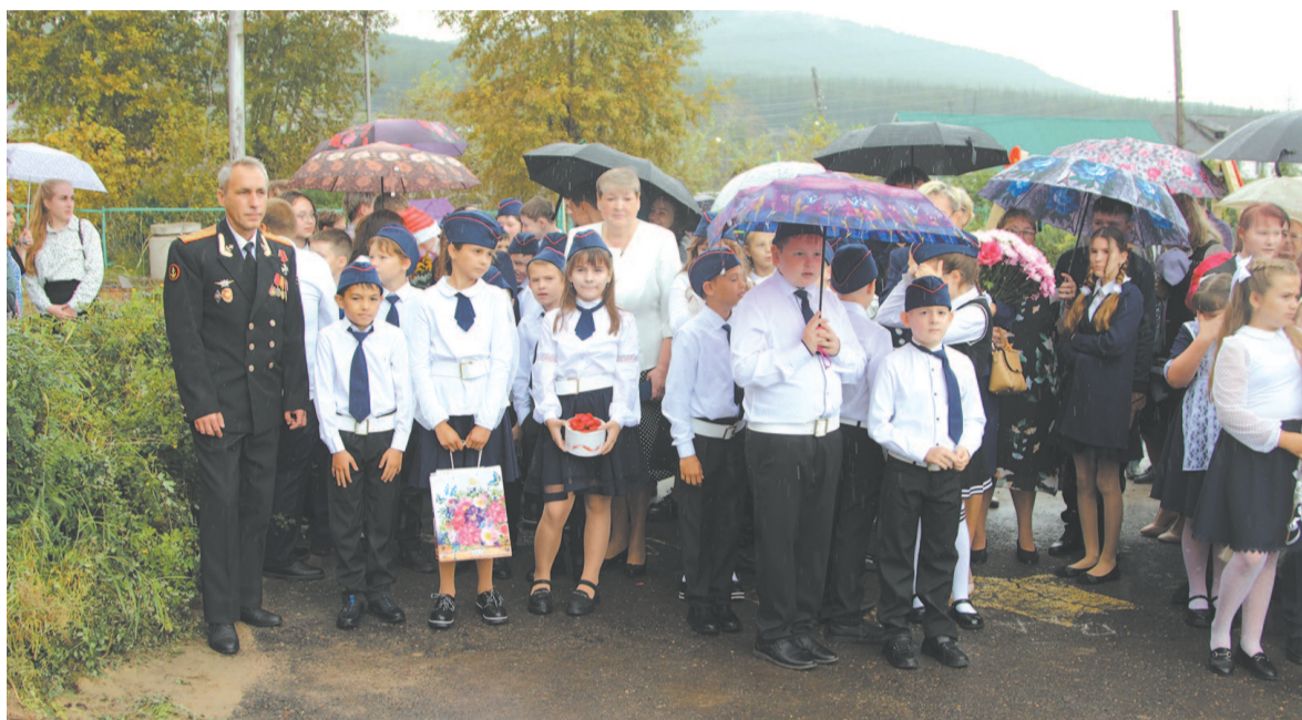
Впервые в Усть-Куте появились кадетские классы.