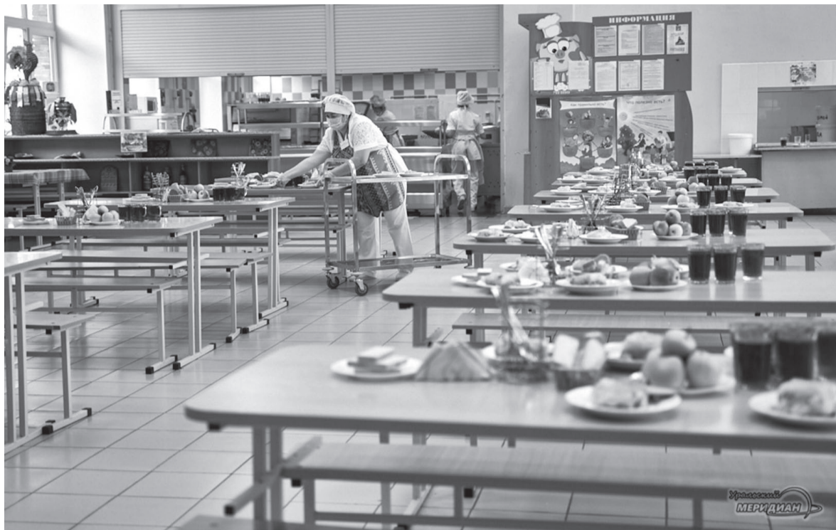
Тема школьного питания волнует многих родителей.