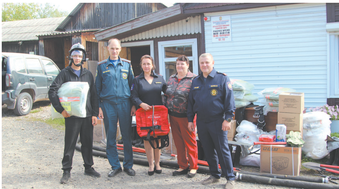
Новое снаряжение поможет огнеборцам работать более эффективно.