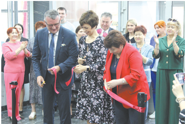
На торжественной церемонии открытия РКДЦ перерезали красную ленточку.

РКДЦ «Магистраль» открыл свои двери после ремонта. Сотрудники центра приветствовали первых гостей первого сентября.