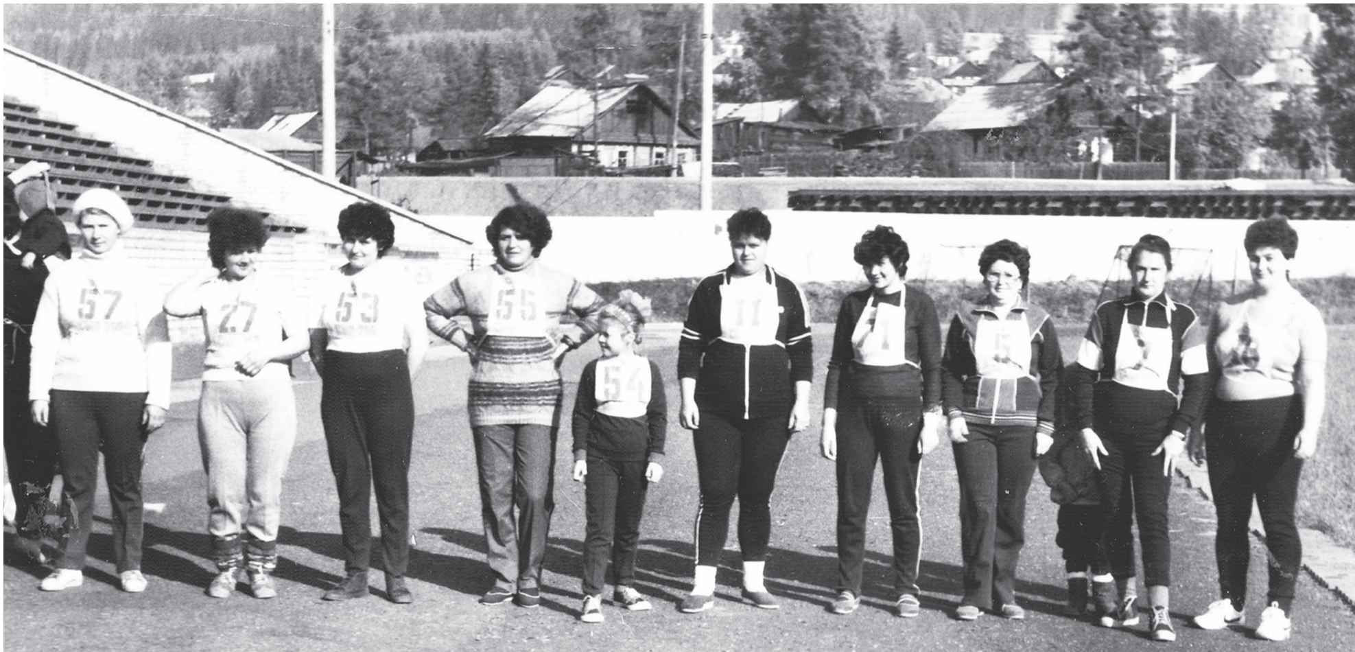
Сдача норм ГТО.