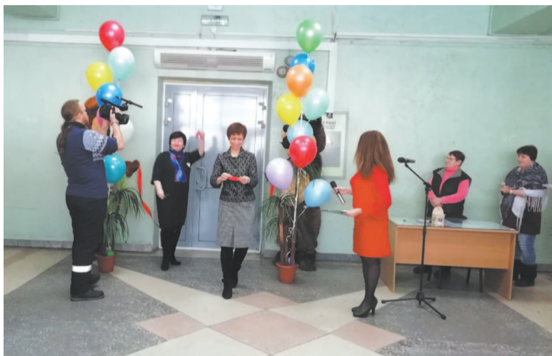
Открытие первого муниципального кинотеатра.

3 февраля в РКДЦ «Магистраль» состоялось торжественное открытие муниципального кинотеатра, который будет радовать устькутян каждый день. В ближайшее время в прокате – мультфильмы для детей по сниженной стоимости.