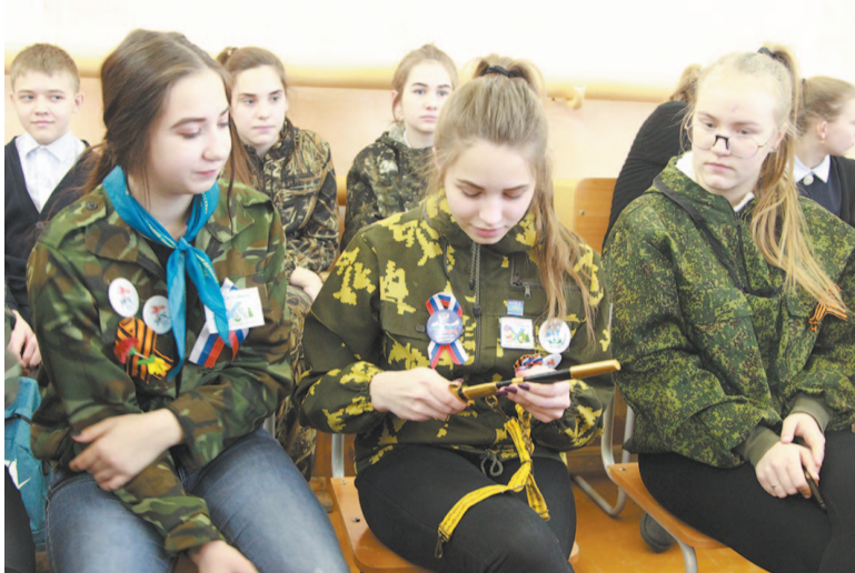
Девчонки из поискового отряда «Багульник» с любопытством разглядывают кортик.