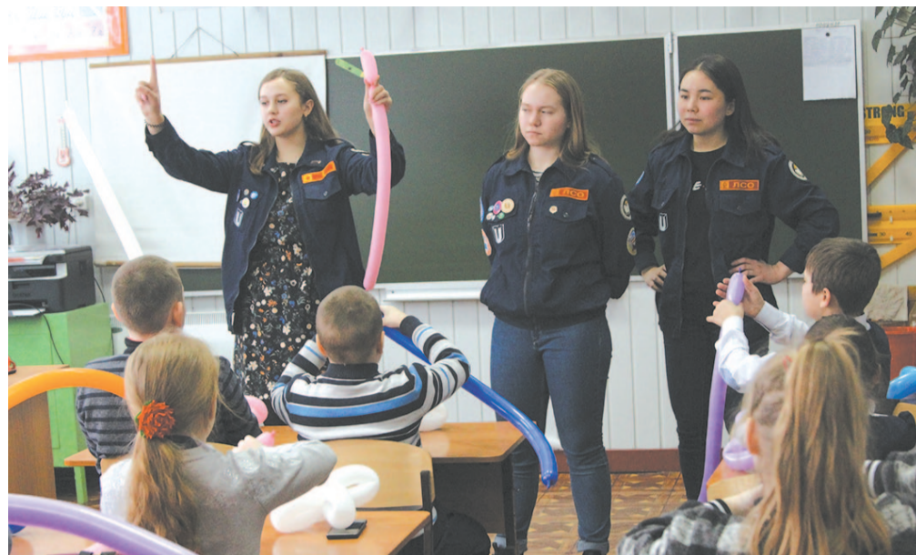
Для учеников начальной школы волонтеры провели мастер-класс по прикладному творчеству.