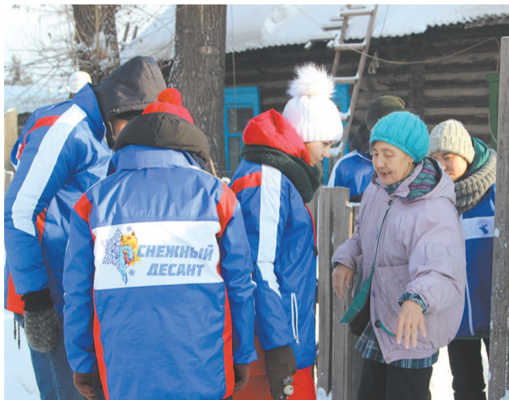
Добровольцы помогают пенсионерам по хозяйству.