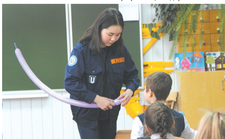
Малышей научили складывать фигурки из воздушных шаров.