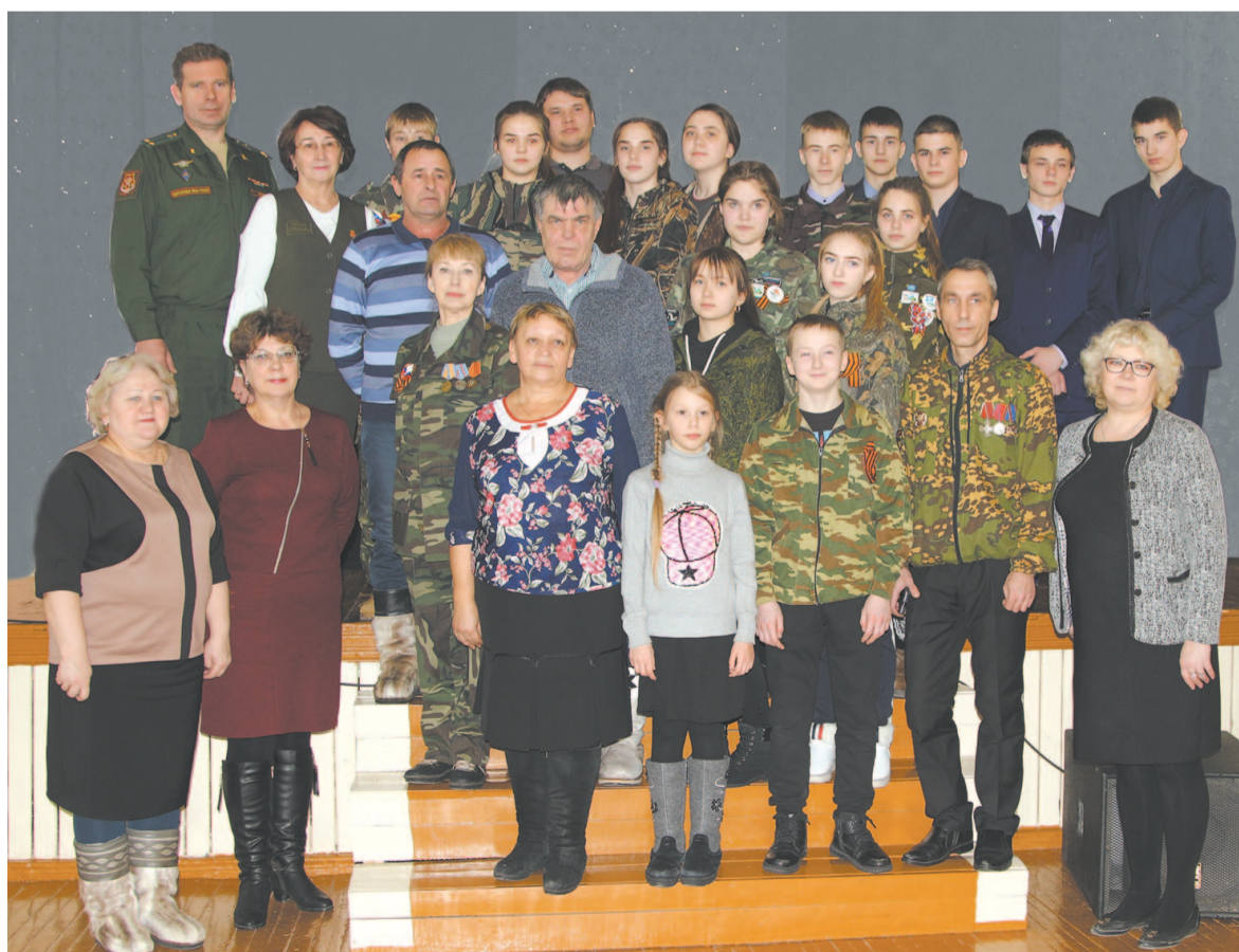
Между старшим поколением и младшим нет различий: все они защитники Отчизны.