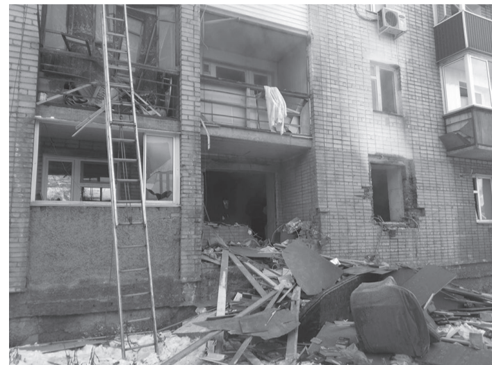
Взрыв газового баллона в доме произошел в декабре 2017 года.

Суд вынес приговор рабочему, из-за которого в декабре 2017 года произошел взрыв газового баллона в пятиэтажном доме по улице Халтурина в Усть-Куте. Напомним, трагедия унесла жизнь пенсионера, несколько жильцов получили травмы и ожоги. Мужчину признали виновным по статьям 238 УК РФ «Выполнение работ, не отвечающих требованиям безопасности, повлекшее по неосторожности смерть человека» и 168 УК РФ «Уничтожение и повреждение имущества по неосторожности», назначив ему два с половиной года лишения свободы условно.