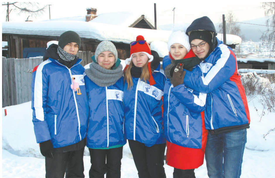
Студенты из Иркутска и Барнаула провели в нашем районе пять дней.