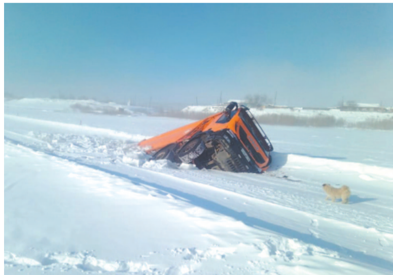
Грузовик ушёл под лёд в районе п. Верхнемарково.

На зимник выехали представители администрации и государственные инспекторы по маломерным судам, чтобы решить сложный вопрос: как извлечь из-под льда тя-