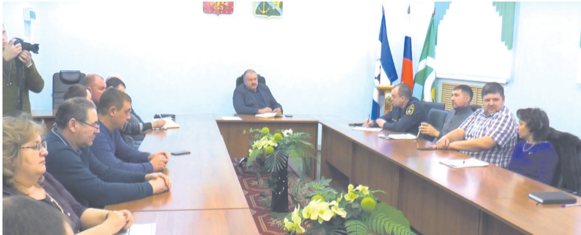
На оперативном штабе в городской администрации присутствовали все, кто принял участие в ликвидации коммунальной аварии в мкр. «Нефтебаза».

Несмотря на то, что авария была ликвидирована, подача тепла и воды в жилые дома восстановлена, городские службы находятся в