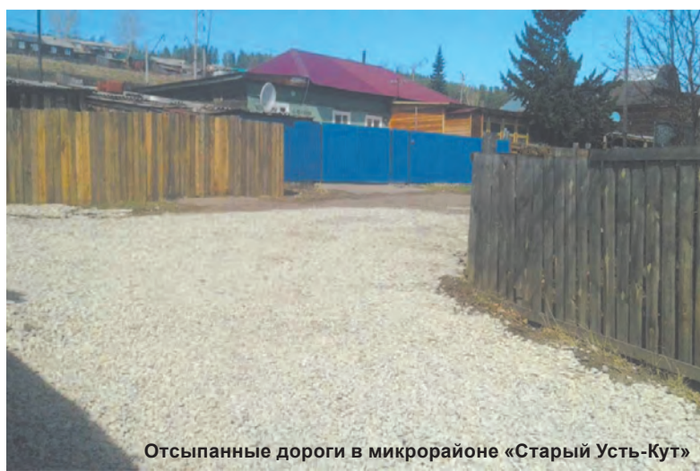
Отсыпанные дороги в микрорайоне «Старый Усть-Кут»