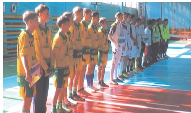
Соревнования по мини-футболу, проводимые среди разноразнонациональных команд г. Усть-Кута, стали традиционными.

Второй год в преддверии Международного дня мира по инициативе Управления по молодежной политике, культуре и спорту на базе спортивно-оздоровительного центра «Водник» проводятся соревнования по мини-футболу среди разноразнонациональных команд города Усть-Кута.