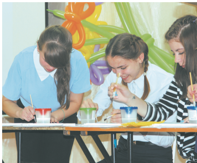
Конкурс «Ученик года-2017», мастер-класс основ художественного творчества