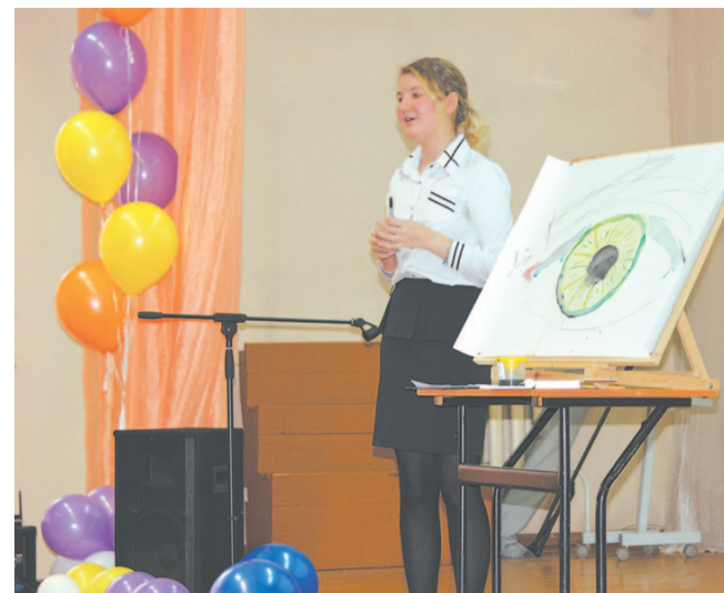
Участница конкурса «Ученик года-2017» проводит мастер-класс по основам художественного искусства.