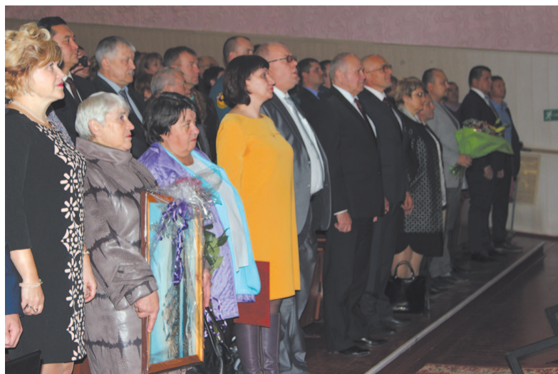
На торжественную инаугурацию пришли порядка трёхсот человек.