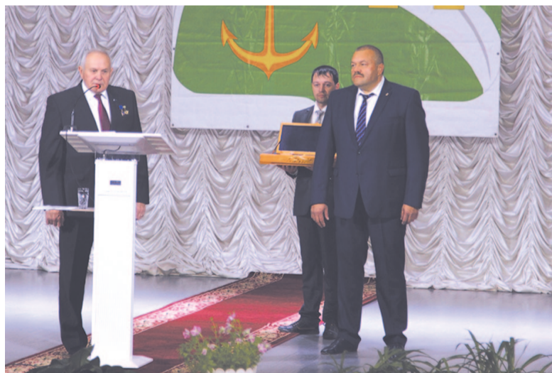
Экс-глава при передаче ключа от города преемнику.