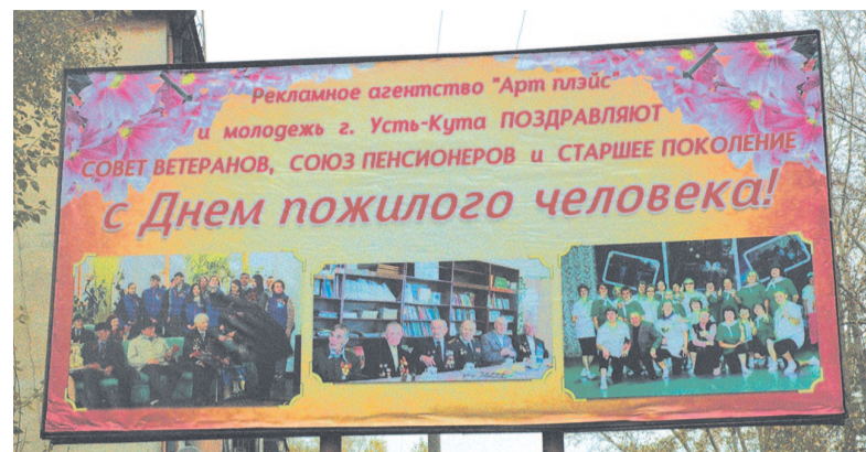
Социальный баннер установлен рядом с «Комплексным центром социальной защиты населения».

Наши не стареющие душой ветераны по-прежнему занимают активную жизненную позицию, являются наставниками для молодежи. Несомненно, это поздравление не оставило никого равнодушным. Создатель баннера не в первый раз участвует в социально значимых проектах на безвозмездной основе.