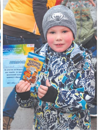
Каждого участника Всероссийского дня ходьбы награждали дипломом и сладким призом.