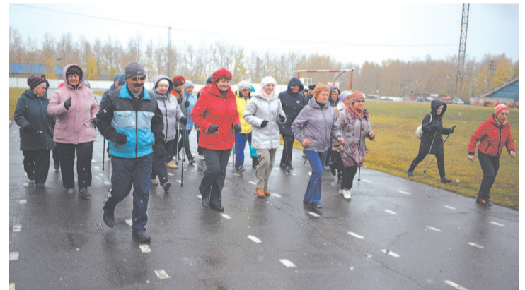
Участников Всероссийского дня ходьбы не испугали мокрый снег и холодная погода.