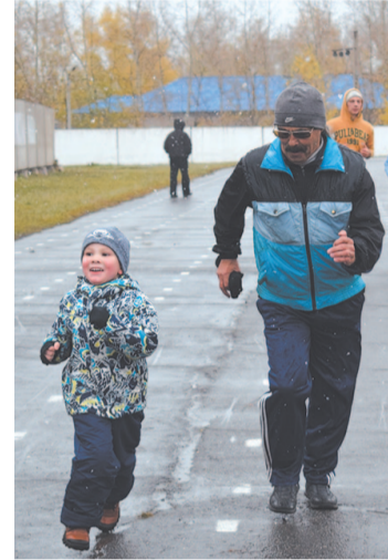
В Дне ходьбы-2017 участвовали от стара до млада.

Все участники получили дипломы и сладкие призы, которые любезно предоставили комитет по культуре, спорту и молодежной политике УКМО и ООО «Продлайн».