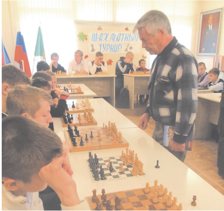
XIII муниципальный шахматный турнир, посвященный Н.К. Маркову.

Юным шахматистам была предоставлена возможность на деле испытать свои силы и навыки, чтобы понять на каком уровне понимания игры в шахматы они находятся и какова их практическая сила.