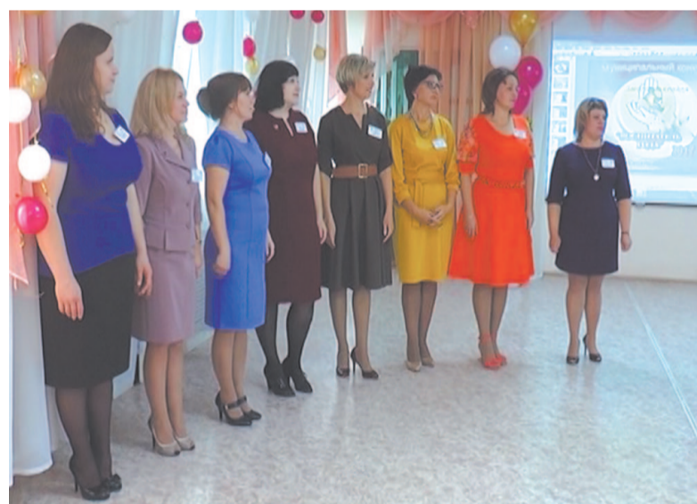
Среди участников конкурса профессионального мастерства «Воспитатель года» и опытные педагоги, и только начинающие профессиональную деятельность.

Существует множество профессий, но нет важнее той, что напрямую связана с маленькими детьми, – педагог-дошкольник. Конкурс – это один способ проявить свои возможности, и он даёт возможность испытать свой профессионализм. Они проводятся с целью инновационного продвижения образователь-