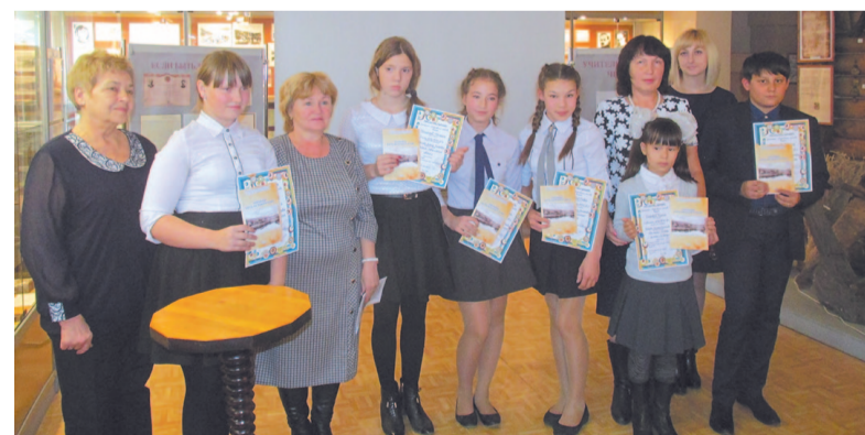
«Марковские чтения-2017». Вручение свидетельств участникам мероприятия.

«Марковские чтения – 2017» проводила заведующая отделом экс-