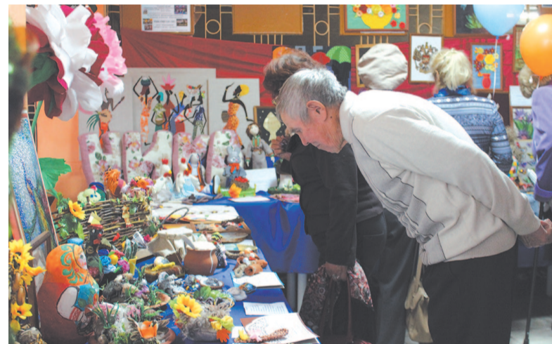
Выставка декоративно-прикладного творчества, посвященная празднику микрорайона «Речники».