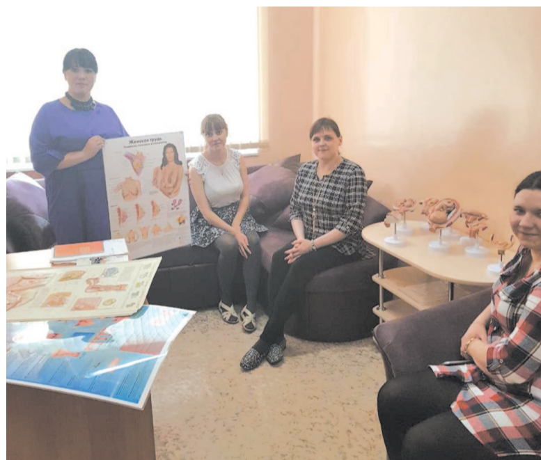
В тренингах могут поучаствовать не только будущие мамы, но и сотрудники женской консультации и родильного отделения