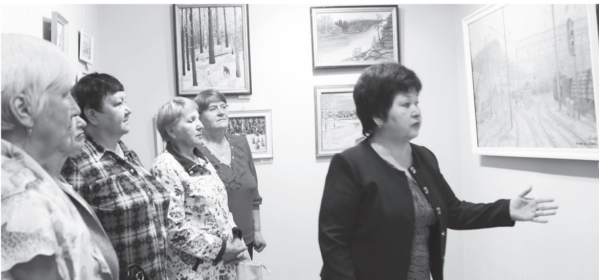
Выставка картин наших земляков вызвала огромный интерес