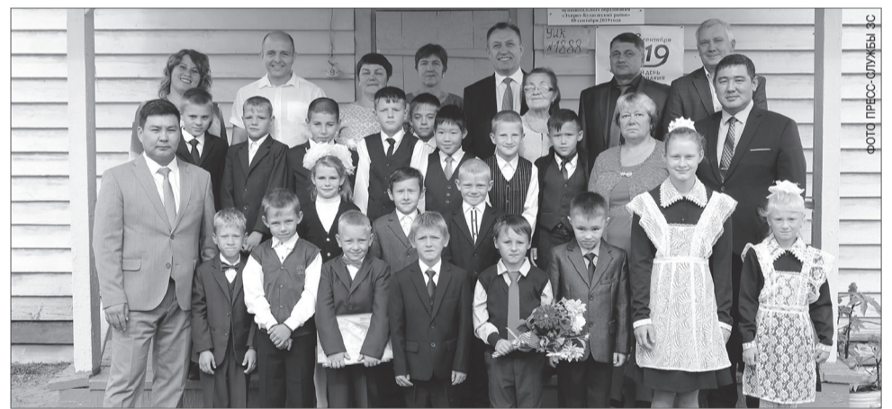
Депутаты Законодательного собрания с учениками малокомплектной школы в селе Куяда