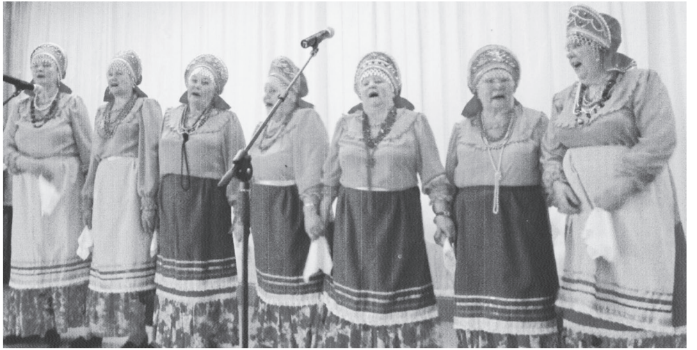
Фольклорный коллектив «Забавушка» исполняет народные песни