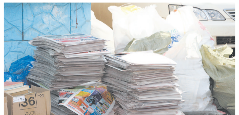
Свой вклад внесла телерадиокомпания «Диалог», сдав 155,6 кг макулатуры

жителей к деятельности по сбережению ресурсов. Принимать вторсырье будут поэтапно: для начала – макулатура, затем пластик, металл, стекло. В планах у компании поставить картонные боксы в офисных помещениях, бизнес-центрах, государственных структурах, образовательных учреждениях.