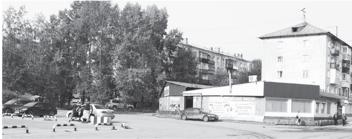
Почти каждый день уличные гонщики собираются на площади у ДК «Речники»

В связи с последними поправками закон «Об административной ответственности за отдельные правонарушения в сфере охраны