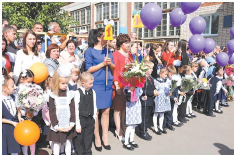
В этом году в школу отправились более 600 первоклассников

база). Нынче там прозвучал 55-й первый звонок. Посетила школу № 9, где состоялось открытие ещё одного специализированного класса Иркутской нефтяной компании. Кроме этого, присутствовала в Усть-Кутском промышленном техникуме, где обучаются около 350 студентов. Среди них будущие специалисты по перевозкам, повара-кондитеры, швеи и строители.