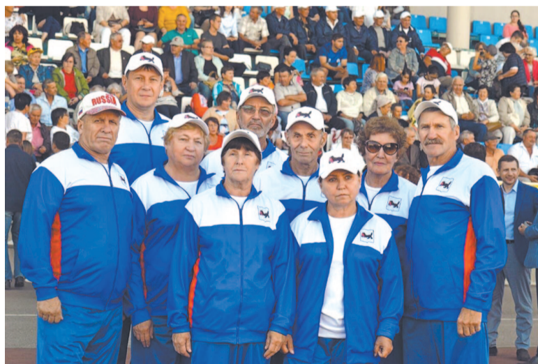
Команда Иркутской области на VI Спартакиаде пенсионеров России по легкой атлетике

В забеге среди мужчин приняли участие 45 спортсменов. Так, в дистанции на 1000 метров с самого старта началась упорная борьба. Трасса непростая: сильный дождь, холодный ветер, но настрой один – победить. Зрители на трибунах не смолкали, до финиша оставалось