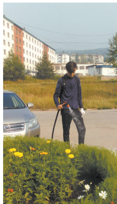
Школьники ухаживали за клумбами, кустарниками, цветами и убирали мусор

Л.С. Антипина, педагог дополнительного образования ЦДО.