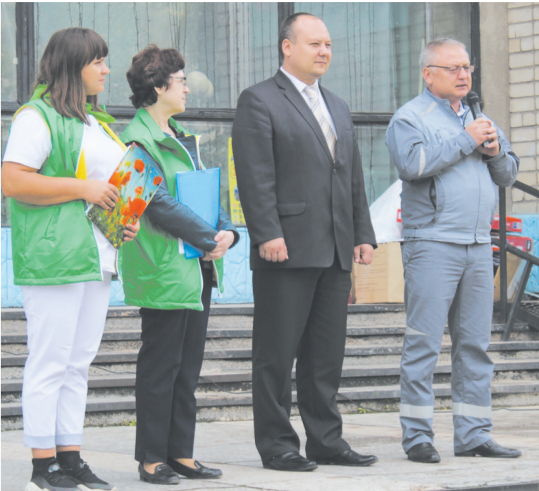
Впервые в городе Усть-Куте состоялась экологическая акция «Скажи мусору нет»