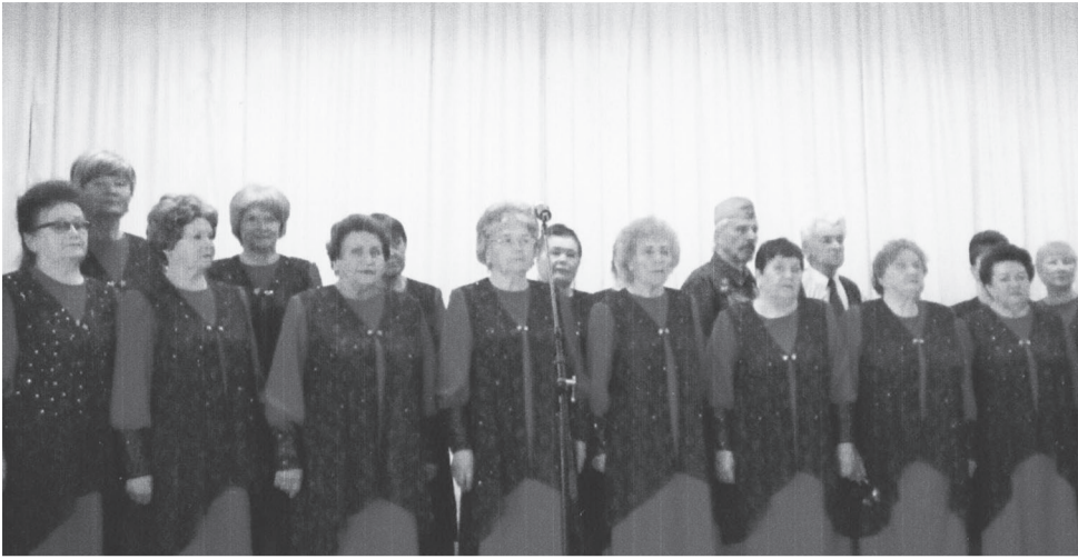
У солистов хора ветеранов «Журавушка» голоса чистые и звонкие