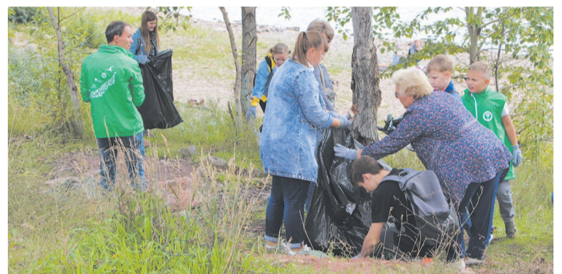
Участники акции и добровольцы вышли на субботник

Цель компании – реализация крупного проекта «Сбор вторсырья, как инструмент по сохранению окружающей среды», приобщение