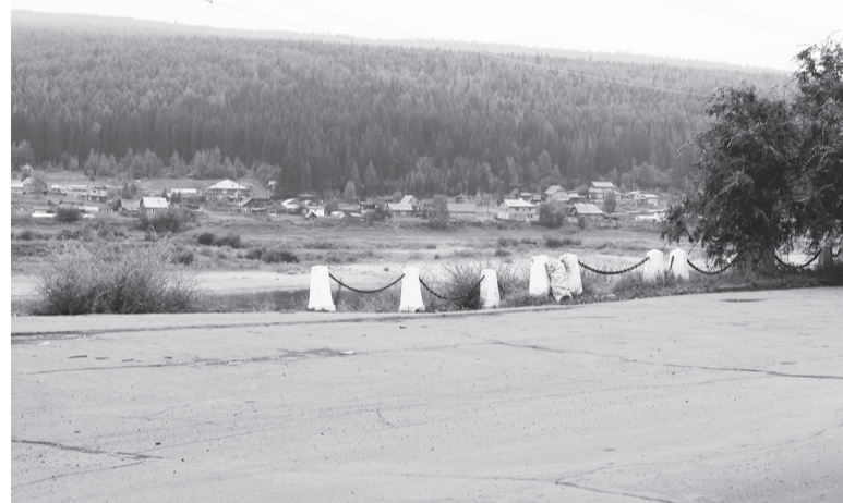
Набережная в мкр. Лена по ночам тоже не пустует

Допустимый уровень шума в жилых помещениях, установленный Санэпиднадзором: 55 дБ днем, 45 дБ ночью.