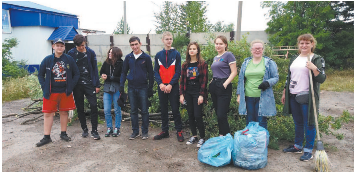
Благодаря проекту «Зеленый город» усть-кутских ребят приобщают к общественному труду

Непросто пришлось тем ребятам, которые работали в июле, потому что этот месяц был жарким и засушливым. Они не просто справились, им хватило времени и на творчество. Вместе с педагогами и рабочими ЦДО дети начали работу по разбивке парковой зоны на территории ЦДО, установили павильон и бережно ухаживали за его хвостом из цветов. А розарий, который тоже впервые появился в Центре дополнительного образования, до сих пор удивляет всех, кто приходит сюда. Ребята научились ухаживать за цветочной рассадой, обрезать кустарники, формировать кохию.