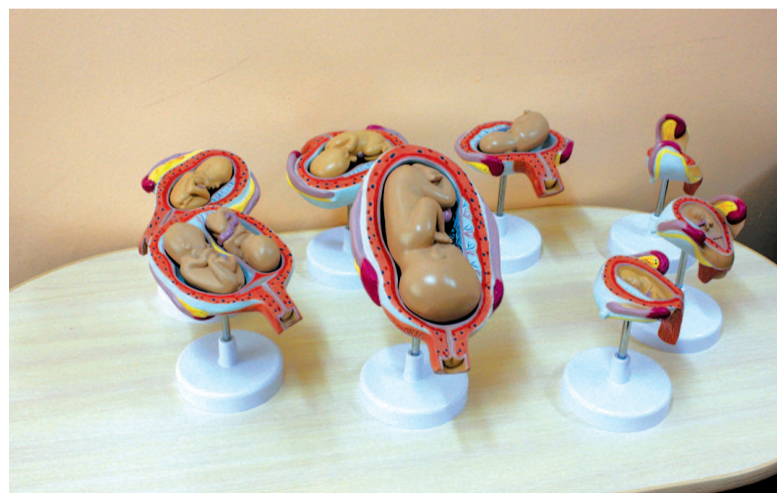
Наглядные методические пособия, изображающие внутриутробное развитие ребенка по этапам беременности

нения беременности. В будущем может понадобиться мультимедийное обеспечение для наглядной информации.