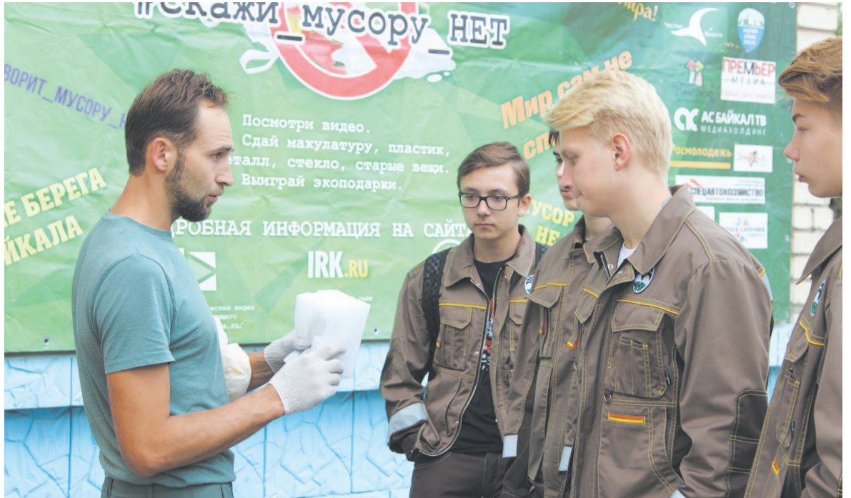
В мастер-классах ребята научились правильно подготавливать вторсырье для дальнейшей переработки