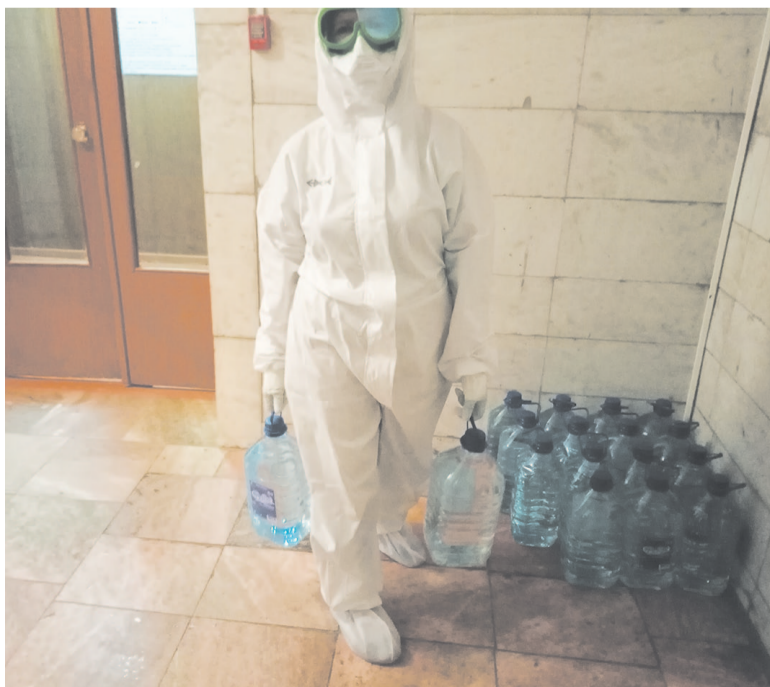
Только за неделю активисты волонтерского движения «Начни с себя» обеспечили пациентов 400 литрами питьевой бутилированной воды