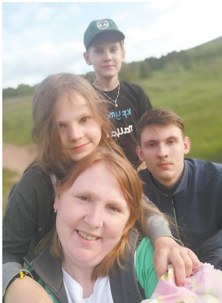
Как приятно, когда вся семья в сборе! А папа фотографирует.