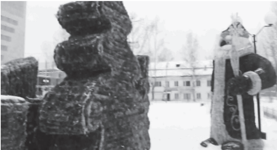
Возле РКДЦ «Магистраль» уже появились яркие, красочные фигуры

С уважением, работники филиала № 1 Городского культурно-библиотечного центра.