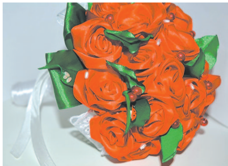
Шикарный букет невесты – копия настоящего