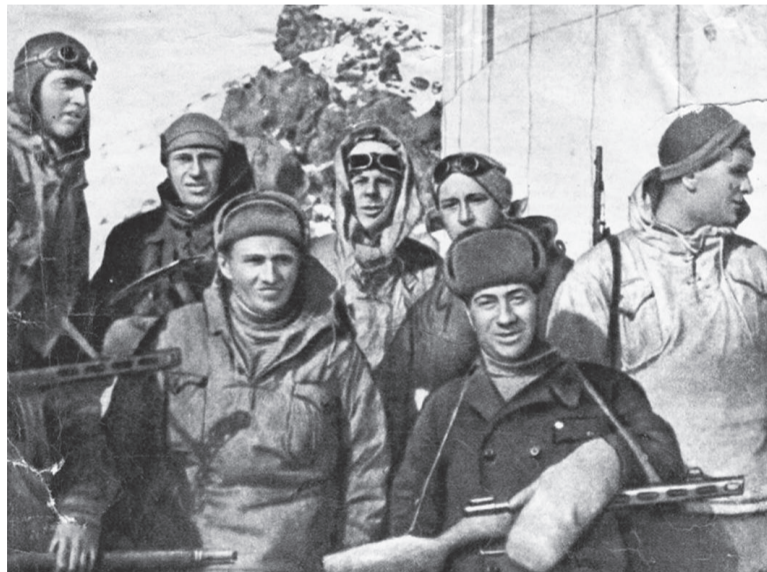
Участники восхождения на вершину Эльбруса для установки красного флага

Далее отряд разбивался на отделения, по три связки. У каждой