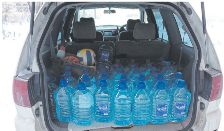
Одна из потребностей медицинских учреждений – доставка воды для пациентов с ковид-19

Елена Попова, фото автора и А. Мананкова.