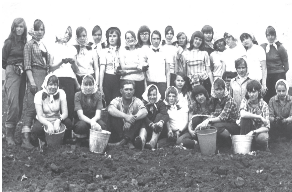
Уборка урожая картофеля в Подымахино. Работали весело и дружно.