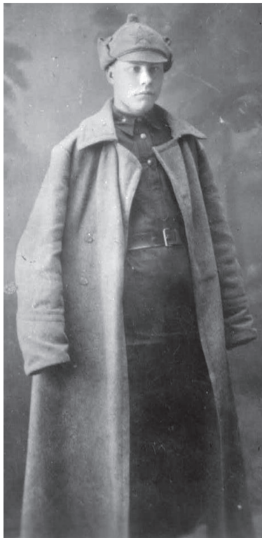
Время не сохранило ни имени, ни фамилии этого человека. Мы знаем лишь, что так выглядели комсомольцы 20-х годов.

Осложнение международной обстановки требовало усилить внимание к военной подготовке молодёжи. Во время 30-х годов было создано бюро для руководства пионерской организацией. Комсомольцы Орлинги в 1935 году собрали 200 рублей на постройку самолёта имени X съезда ВЛКСМ. В селе Усть-Кутском провели «неде-