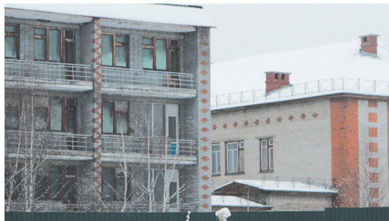
В сентябре-октябре началась вторая волна пандемии. Санаторий «Усть-Кут» снова переоборудовали под инфекционное отделение.

Это частный случай. На самом деле помощь гораздо шире. Она включает раздачу средств индивидуальной защиты (заявку можно подать по телефону 8-995-338-20-31, либо кто-нибудь из близких родственников может оставить её в штабе по адресу: ул. Реброва-Денисова, 1а), для одиноких пожилых людей, у которых нет возможности сходить в магазин или аптеку, – доставку медикаментов, продуктов питания. Возможно, волонтерам будет поручена доставка бесплатных лекарственных препаратов для амбулаторного лечения больных коронавирусом.