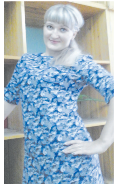
Мама – самый родной и близкий человек

Я стараюсь не огорчать её своими поступками. Всегда помогаю по дому, чтобы