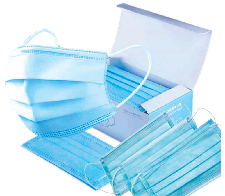
Подготовила Елена Попова.

О том, что грозное заболевание отступило, пока говорить рано. Поэтому по возможности нужно минимизировать посещение людных мест. Отменены все массовые мероприятия. Предприятия общественного питания работают до 23.00. Новый год пройдёт без корпоративов и банкетов.